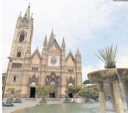
TEMPLO. Inició su construcción en 1897 y fue concluida hasta 1972.

Pero, ¿qué pasó durante todos estos años