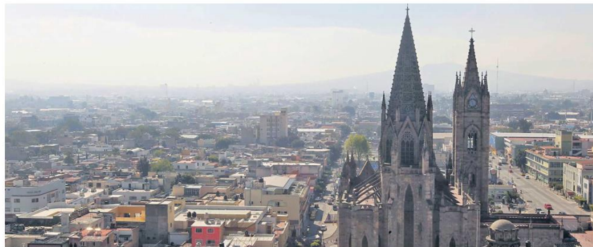
CARACTERÍSTICAS. En su fachada destacan dos torres gemelas de 65 metros de altura.