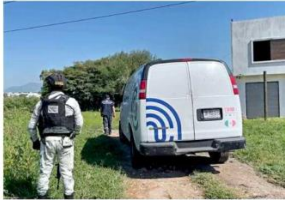
El cuerpo fue localizado por un trabajador en un establo de la Colonia Hogares de Nuevo México.