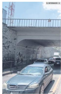
PLANACIÓN. La infraestructura urbana debe resistir a cada temporal.

De acuerdo con un análisis realizado por académicos de la UdeG, hasta el pasado 7 de septiembre, los túneles con más inundaciones durante el temporal 2023 son Plaza del Sol, Plaza de la Paz y Plaza de la Libertad, con cuatro registros, y el paso a desnivel del ITESO, con tres registros.