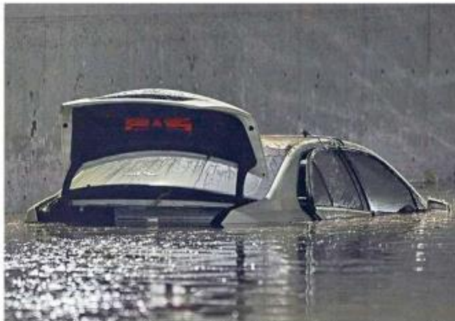
Emilio de la Cruz

Por el momento el plan quedó detenido, pues se vino abajo un convenio de concertación con los particulares Metrópolis Ábaco, GVA Virgo, Negocios Inmobiliarios DMI, Grupo Jimaltá, Cima 500 y Grupo Mendelssonhn; todos habían propuesto inversión privada al ser dueños de inmuebles en los alrededores de la vialidad.