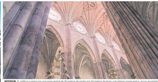
INTERIOR. El edificio cuenta con una nave central de 30 metros de ancho por 54 metros de largo, con pilares compuestos, arcos apuntados y bóvedas de crucería.