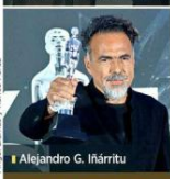
▲ Alejandro G. Iñárritu