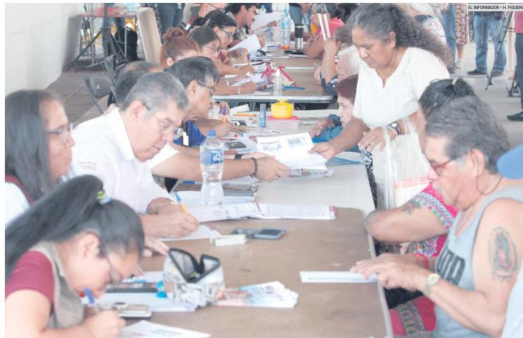
DISPONIBILIDAD. Adultos mayores son atendidos por los servidores de la nación desde la inscripción hasta la atención en las sucursales del Banco del Bienestar.

Beneficiarios pueden acudir a las sucursales y disponer de los cajeros o cobrar en ventanilla