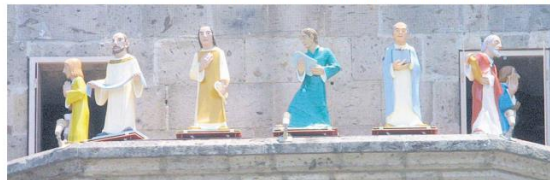
DETALLE. En 1969 se instaló un carrilón de 25 campanas que tocan una colección de obras musicales, acompañadas de una peregrinación de diversos santos de la Iglesia Católica.

Pero décadas después quien retoma la obra es el arquitecto Ignacio Díaz Morales, quien es más conocido por ser fundador de la Facultad de Arquitectura de la UdeG. "Él hará un rediseño de detalles estructurales y estéticos de la obra. Por ejemplo, su aporte será la construcción del capítulo con un estilo más inspirado en el gótico francés".