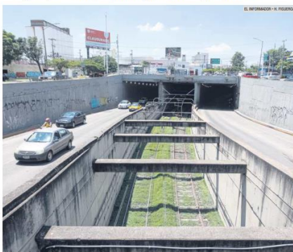
REVISIÓN. La infraestructura debe actualizarse al paso de los años para mantenerse vigente y segura para la población, según expertos.

"Casi en cada lluvia fuerte se ha inundado, e incluso debido a los encharcamientos durante todo el año, ha habido también accidentes y muertes, relacionados con infiltraciones. O el de Niños Héroes e Inglaterra, que hace años hubo personas fallecidas, muy similar a lo que acaba de ocurrir, que en poco tiempo se llenó de agua y las bombas no alcanzaron a sacarla, y los carros que quedaron atrapados al fondo resultaron en la muerte de algunas personas".