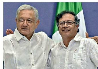
▲ Los Presidentes Andrés Manuel López Obrador y Gustavo Petro se reunieron en Cali, Colombia.

Coco Gauff, confirmada para el GDL Open Akron WTA 1000, alza su primer Grand Slam, el US Open, a los 19 años. CANCHA