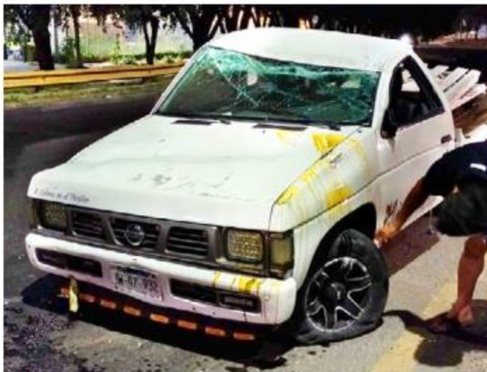
CHOQUE. Sobre la Carretera a Chapala se registró la volcadura de una camioneta que minutos antes había sido robado por tres sujetos en Tlaquepaque, los cuales lograron escapar del lugar.