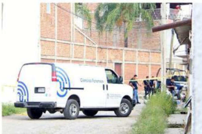
■ En Tlajomulco fue asesinado a balazos un hombre.

Eran aproximadamente las 8:30 horas cuando la Po-