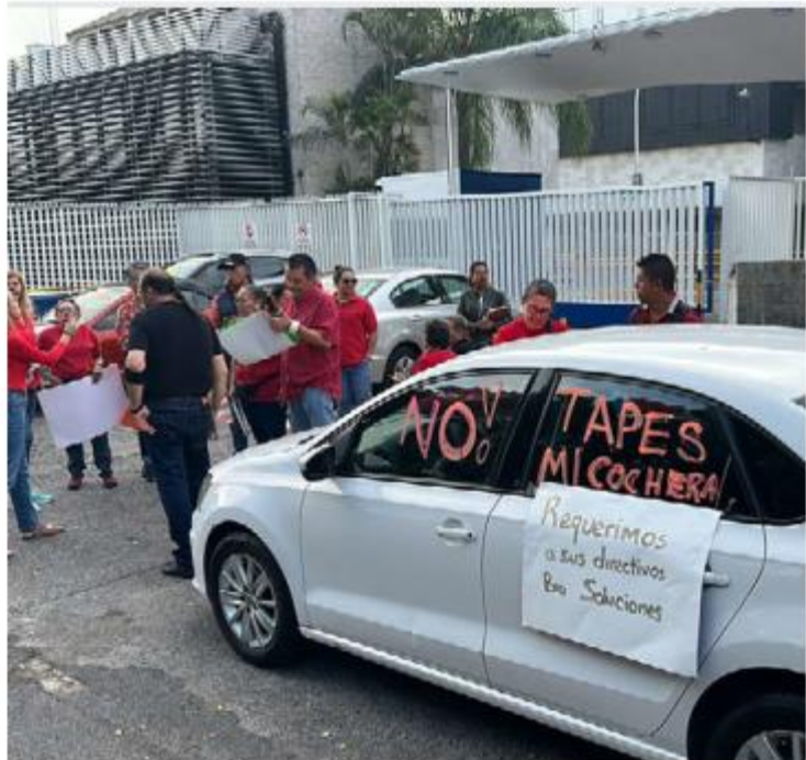
Vecinos de la colonia Jardines del Bosque bloquearon ayer las entradas y salidas de la cervecería.

Entre las peticiones que hace la ciudadanía a la empresa es no maniobrar en las calles o avenidas de la colonia; no estacionarse en cochera, doble fila o rampas para personas con dis-