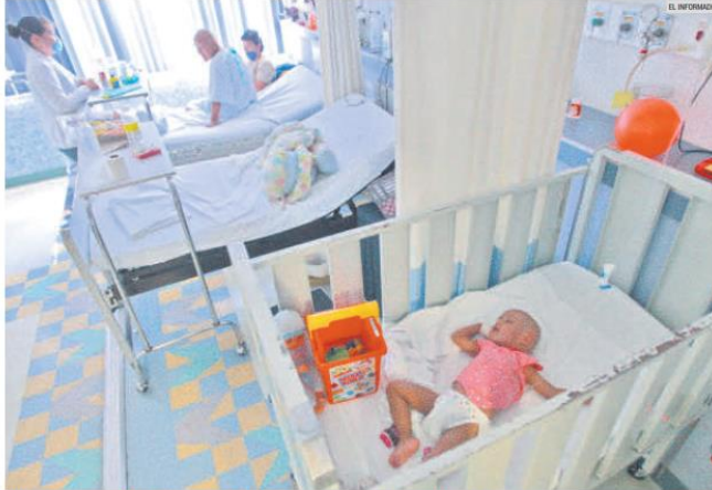
BENEFICIOS. El trasplante de médula ósea ayuda a personas que padecen cáncer, entre otras enfermedades.

Señalan que no hay una cultura de la donación tanto de órganos como de tejidos en México