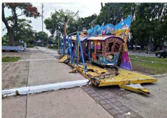
■ Dos aparatos de juegos mecánicos fueron abandonados.