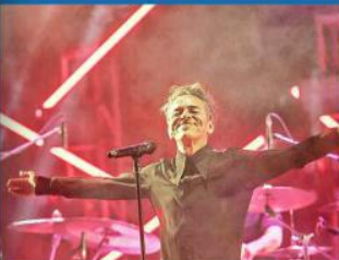
■ Rubén Albarrán y compañía se convirtieron en el deleite de los tapatíos anoche, en la celebración del Grito de Independencia.