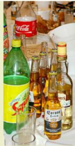
■ Llamaron al consumo de bebidas alcohólicas con responsabilidad.

“Si eres una persona con capacidad de decidir cuánto alcohol quieres ingerir, establécelo bien y si vas a reunirte con amigos, no permitas que los demás influyan en ti y que decidan cuánto alcohol vas a beber”.