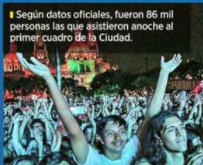
■ Según datos oficiales, fueron 86 mil personas las que asistieron anoche al primer cuadro de la Ciudad.