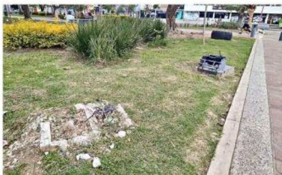
■ Faltaba una lámpara con todo y poste.

Se pidió información al Ayuntamiento de Guadalajara sobre las acciones que se harán para garantizar la seguridad de usuarios y saber las razones por las cuales no hay vigilancia, pero no dio respuesta.