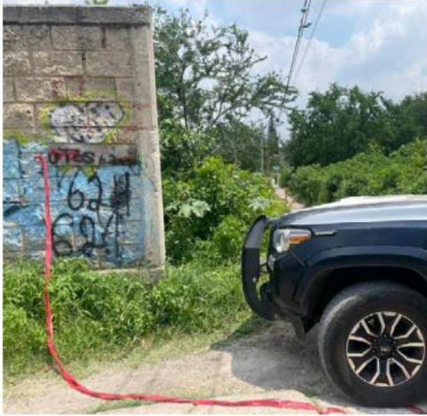
La Fiscalía ya trabaja ese punto. DIANABARAJAS