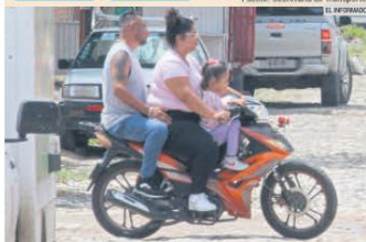
IRRESPONSABILIDAD. En la ciudad hay conductores que incluyen suben a las motocicletas a menores de edad, con lo que los ponen en peligro.

sideró que además de campañas de concientización, también es importante el sentido de responsabilidad de las personas.