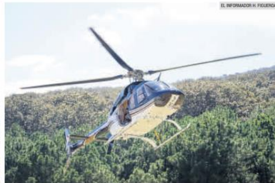
APOYO AÉREO. El helicóptero usado para lanzar las bombas de semillas fue facilitado por Aviacopter.

“Con la mentalidad filántropa de apoyar a la humanidad es que unimos esfuerzos de salvar el mundo contra el cambio climático. En ocasiones la iniciativa ha sido criticada porque hay quienes dicen que se contamina por el uso de combustibles. Sin embargo, consideramos que se utiliza para reforestar de esta manera es mínimo si lo comparamos con la ayuda masiva que esto representa para la renovación de los Bosques y de esta for-