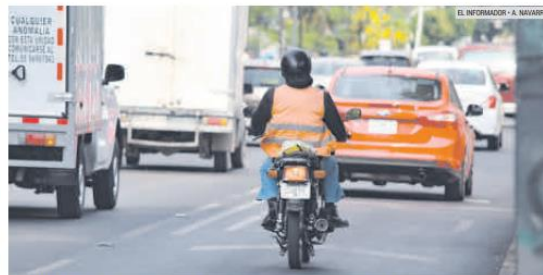
PREOCUPA. Cada vez se ven involucradas más motocicletas en accidentes viales.