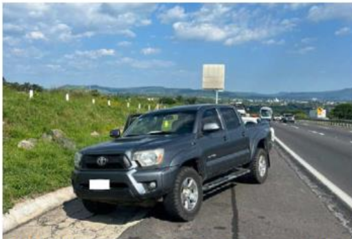
ARMAS. Elementos de la Guardia Nacional aseguraron en Tonalá un vehículo abandonado que traía en su interior 61 cargadores, 824 cartuchos útiles y un inhibidor de señal con ocho antenas.