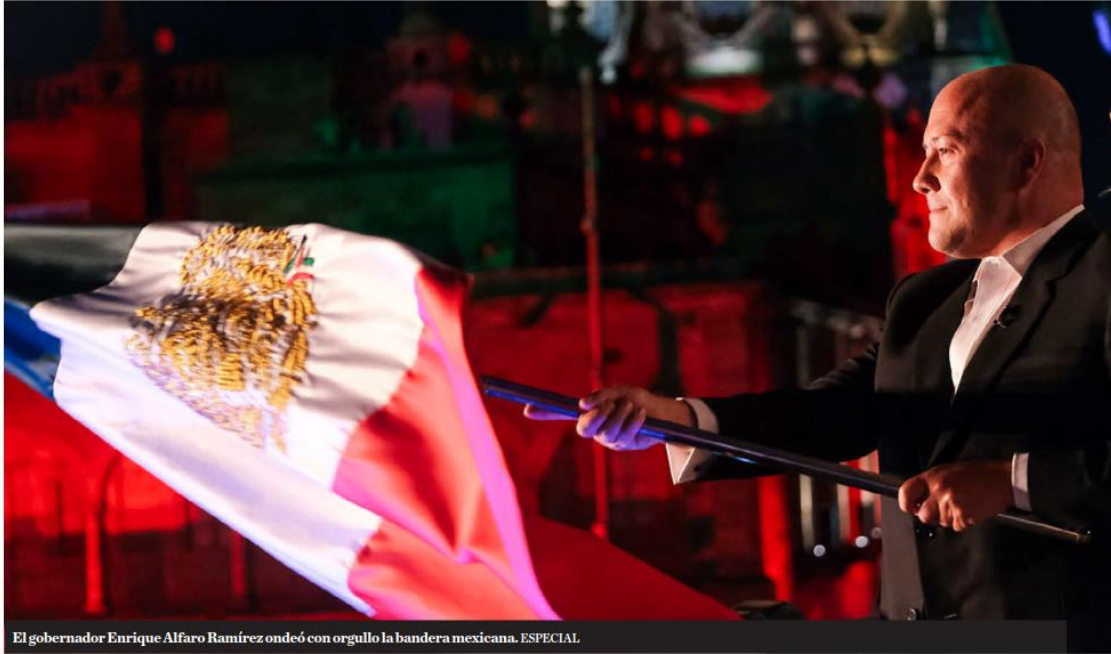
El gobernador Enrique Alfaro Ramírez ondeó con orgullo la bandera mexicana.