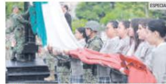
HONOR. Soldados y estudiantes rindieron honores al lábaro patrio.