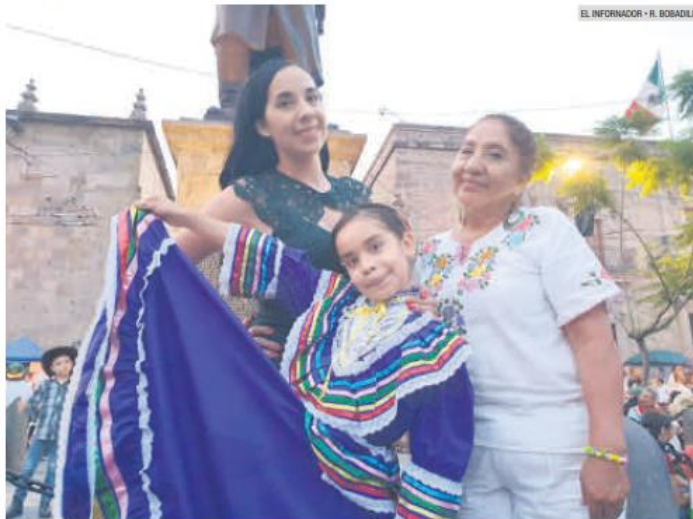
TRADICIÓN. Familias tapatías acudieron al Centro de la ciudad para celebrar la Independencia de México.

En su vitoreo recordó a Miguel Hidalgo y Costilla, así como a Josefa Ortiz de Domínguez, José María Morelos y a Leona Vicario, Ignacio Allende, Aldama y a Rita Pérez Jiménez. Vitoreó también a Vicente Guerrero, Guadalupe Victoria y a Pedro Moreno, pero también a la capitana Manuela Medina, así como a José Antonio "El Amo" Torres y a Gertrudis Bocanegra. "¡Vivan las mujeres y hombres que nos dieron patria y libertad! ¡Viva el Estado Libre y Soberano de Jalisco!", instó el mandatario ante la Plaza de Armas.