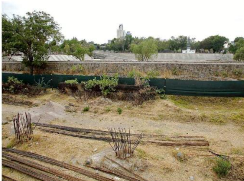
En el área de la Presa Zoquipan se está construyendo una torre de departamentos, obra que ha dañado contrafuertes.

El 12 de septiembre, vecinos de Jardines del Country se manifestaron en el Nodo Colón para exigir a las autoridades la revisión de la cortina de la presa, ya que, debido a la construcción de una torre de departamentos, se dañaron dos contrafuertes.