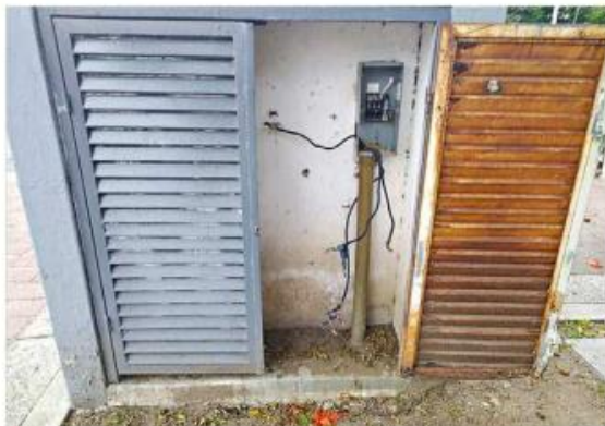
■ Algunas tomas eléctricas fueron saqueadas.