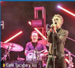
■ Café Tacvba y los tapatíos pudieron disfrutar del concierto en una noche despejada.