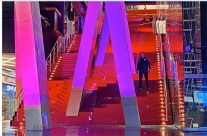
El ataque ocurrió en las escaleras de un complejo comercial.