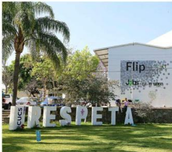
El programa "Ingenious" se lleva a cabo en el CUCS.

Aunque existen iniciativas similares en el nivel básico, "Ingenious", orientado a universitarios, es único en