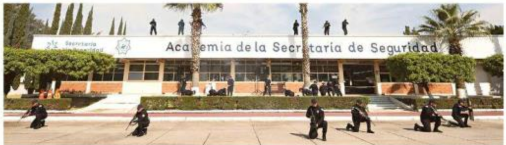
■ Ex instructora denunció acoso de un prefecto en la Academia de la Secretaría de Seguridad del Estado.

“Falta algo descentralizado, porque ya vimos que entre ellos mismos se tapan ahora sí que las cochinas que hacen, de estar acosando a las compañeritas y la que denuncia, la corren, es una mafia todo eso”, señaló la ex funcionaria.