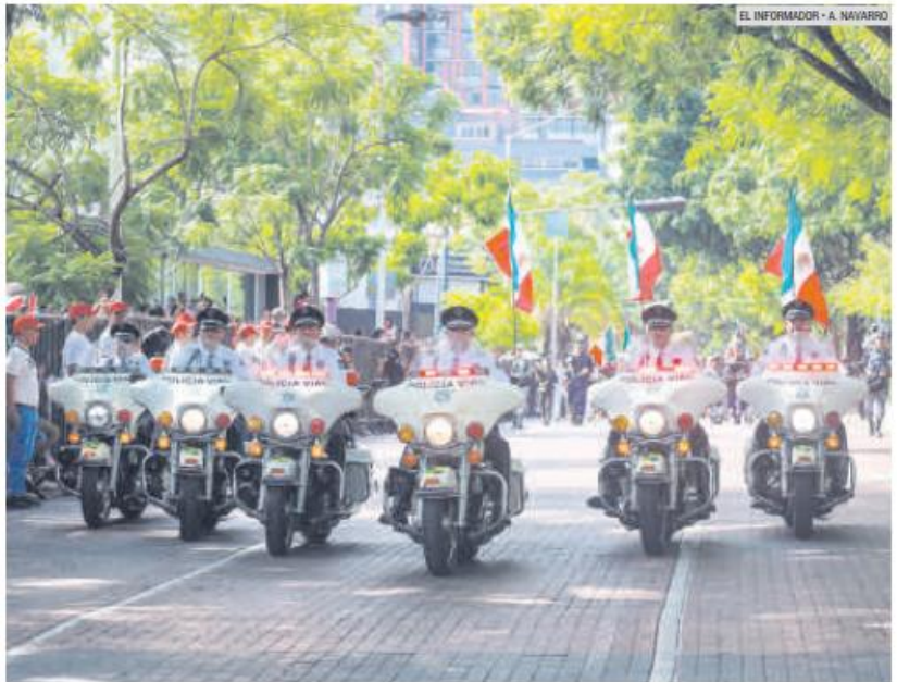
A TODA MÁQUINA. Agentes viales en motocicletas participaron en el recorrido oficial.