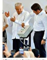
Pese a que fue inaugurada, la obra aún está en proceso.

MONTERREY.- El acto oficial: El pasado miércoles, al oprimir un botón en la Planta de Bombeo Cerro, el Presidente Andrés Manuel López Obrador y el Gobernador de Nuevo León, Samuel García, festejaron echar a andar en tiempo récord el Acueducto El Cuchillo 2, que "en siete a 10 días" empezará a calmar gradualmente la crisis de abasto de agua en Monterrey. La realidad: El botón fue sólo para la foto. La obra está inconclusa. Una investigación de Grupo REFORMA evidenció que el acueducto no pue-