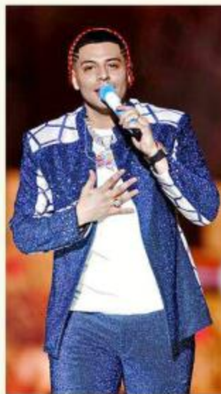
■ Eduin Caz, vocalista de Grupo Firme.

Barbosa explicó que, además de Caz, hay otra campaña abierta con el luchador Cinta de Oro; si junta 2 millones de pesos, subirá a la tirollesa más grande del mundo,