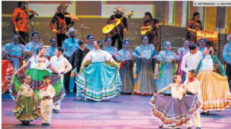
EVENTO. La apertura del XXII Encuentro Nacional de Mariachi Tradicional se vivió en el Teatro Degollado.