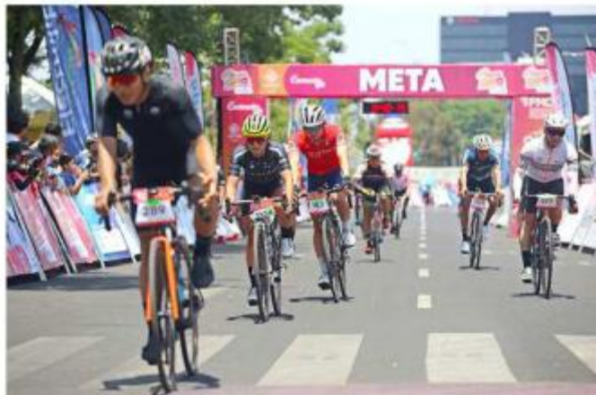
El paso estará cerrado hasta las 13:00 horas.

El inicio, meta y premiación del Gran Fondo New York (GFNY) Zapopan 2023 será en los alrededores del Estadio Akron. Por lo cual, cerrarán el Circuito JVC y la Avenida del Bajío.