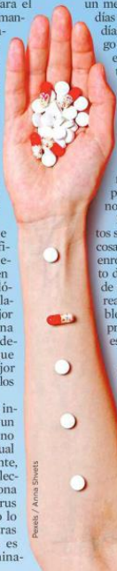
Pexels / Anna Shvets