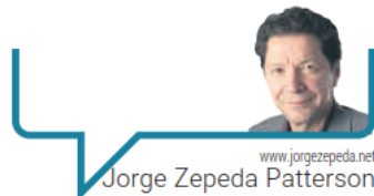
www.jorgezepeda.net Jorge Zepeda Patterson