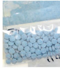
SALUD. Este fármaco se utiliza para paliar el dolor.