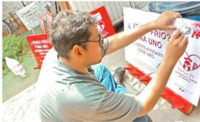
■ Proa31 nació en 2017 y ha instalado 750 percheros.

Se hallan de manera permanente en las sucursales de Cruz Verde, Instituto Jalisciense de Ciencias Forenses, preparatorias de la Universi-