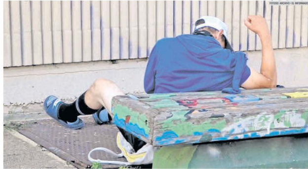
PELIGRO. En Estados Unidos hay una alerta debido al alto índice de adicción al fentanilo.

Las incautaciones superan en cantidad a la marihuana, la metanfetamina y la cocaína