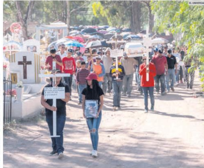
LUTO. En Zacatecas se dio el último adiós a los seis muchachos que fueron privados de la libertad por un grupo armado y encontrados sin vida.