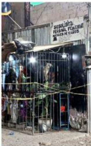
■ La agresión ocurrió en Lomas de Polanco.