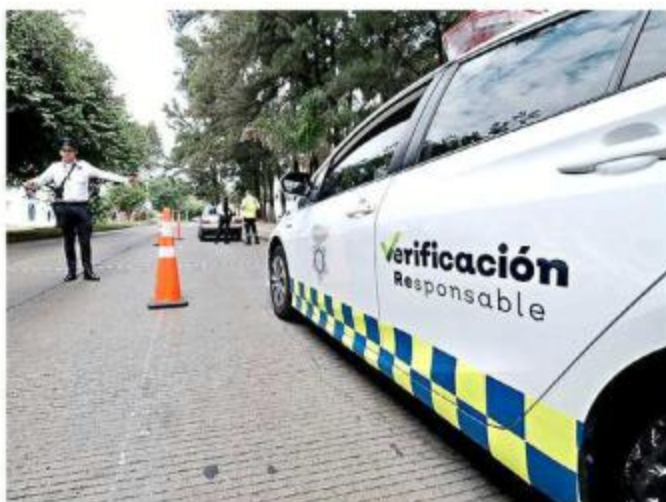
Los morenistas afirman que el operativo es hostigamiento a la gente de Jalisco.

Desde el 3 de octubre legisladores locales morenistas y del PRI habían criticado las infracciones por no verificar, las cuales también han causado inconformidad de ciudadanos; sin embargo, ahora los diputados coordinados por Martínez presentaron ante el Legislativo local una iniciativa que, de ser respal-