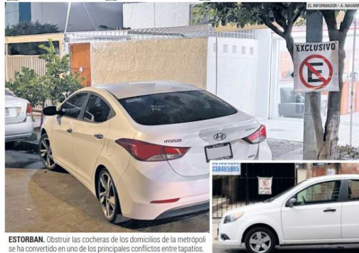
ESTORBAN. Obstruir las cocheras de los domicilios de la metrópoli se ha convertido en uno de los principales conflictos entre tapatíos.

Otros conflictos de los habitantes de Guadalajara son por ruido, daño en los inmuebles y basura; más de la mitad se resuelve