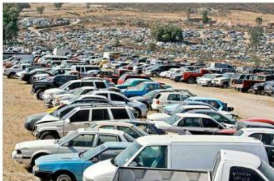
Los vehículos se alojaban en depósitos del IJAS hasta que desapareció la dependencia.

“Solamente pasó a la Secretaría de Administración la