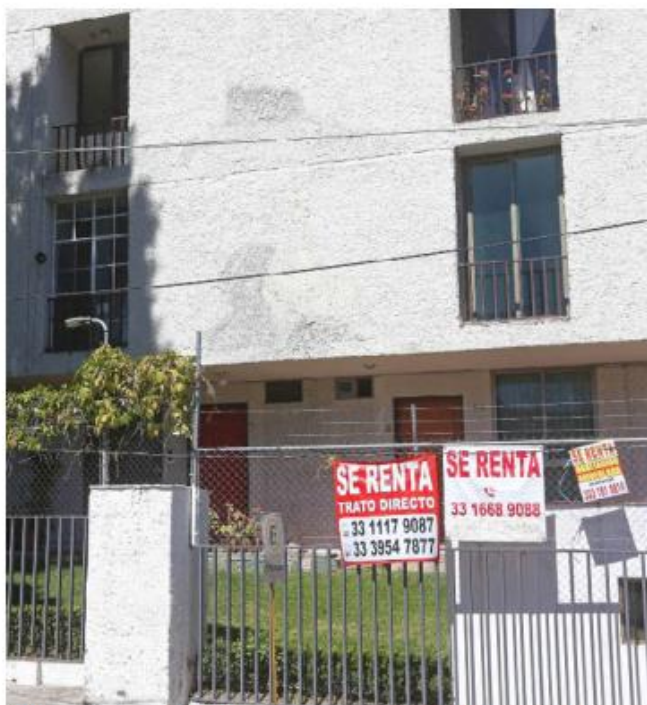
Últimamente se han elevado el precio de las rentas.

“Realmente el precio que buscamos aquí es que si tú quieres acercarte con una inmobiliaria bien y