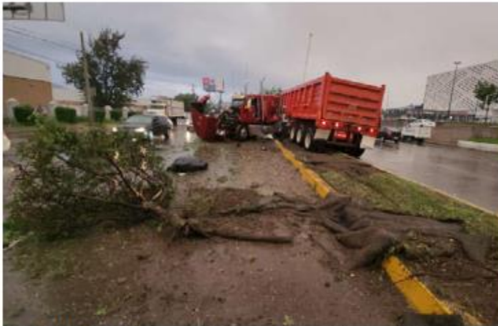
CARAMBOLA. Al menos ocho lesionados dejó un múltiple choque en la avenida López Mateos, en el poblado de San Agustín. Señalan que un tráiler perdió el control e impactó a 4 vehículos.