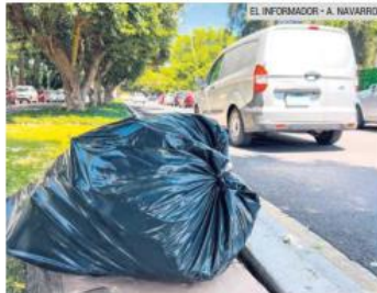
CONFLICTO. La basura es uno de los problemas recurrentes entre los vecinos.

La Encuesta Nacional de Seguridad Pública Urbana (ENSU) del primer trimestre de 2023 indicó que más de la mitad de los ciudadanos del área metropolitana de Guadalajara (51.5%) experimentó algún tipo de conflicto o enfrentamiento en su vida diaria. El ruido fue la causa principal de conflicto o enfrentamiento para el 20.4% de la población, aunque este porcentaje ha disminuido en 4.7 puntos porcentuales en comparación con el año anterior. Otros motivos importantes de conflicto incluyen los incidentes con la basura y los problemas de estacionamiento, los cuales provocaron conflictos en el 20.1% y 18.2% de los ciudadanos, respectivamente, según un análisis del Instituto de Información Estadística y Geográfica de Jalisco (IIEG).