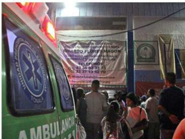
El sujeto que detonó el arma adentro de la secundaria ya fue denunciado ante la Fiscalía.