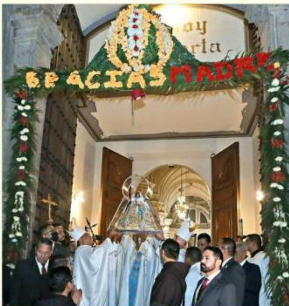
■ A las 5:00 horas del 12 de octubre será la misa de despedida en la Catedral.

En el vestido color lavanda, la Catedral de Guadalajara irá bordada con hilos de oro en el vientre de la advocación de Nuestra Señora de la Expecta-