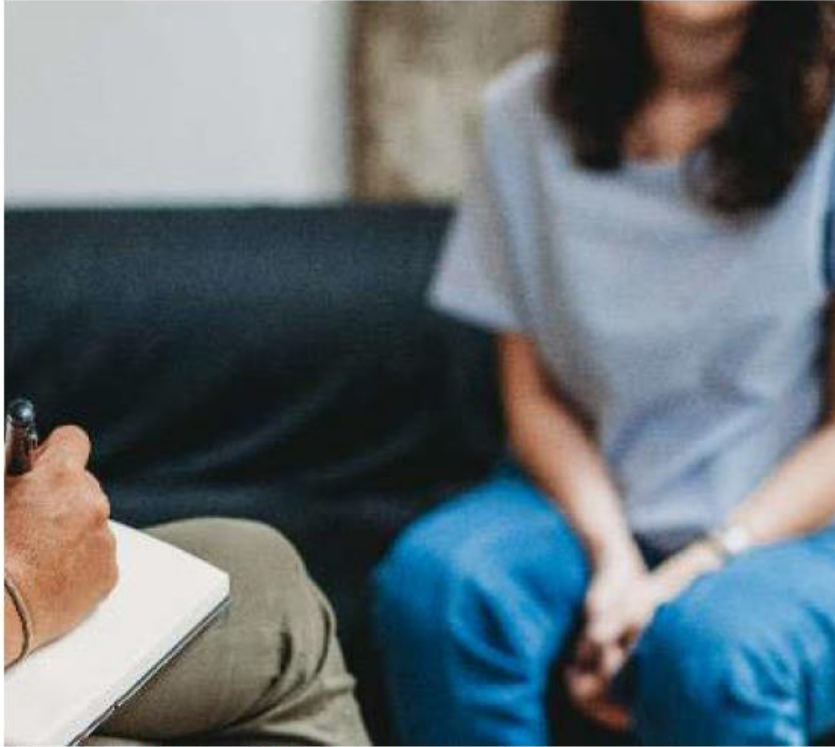
Piden a los tutores darle seguimiento al menor con un experto.

Además pueden presentar lagunas mentales como tener olvidos o amnesia disociativa, esta última es más grave que los olvidos normales y no puede explicarse por una enfermedad. En las primeras fases el menor podría negar el acontecimiento violento que presenció por lo que es necesario que explore a través de prácticas lúdicas que le