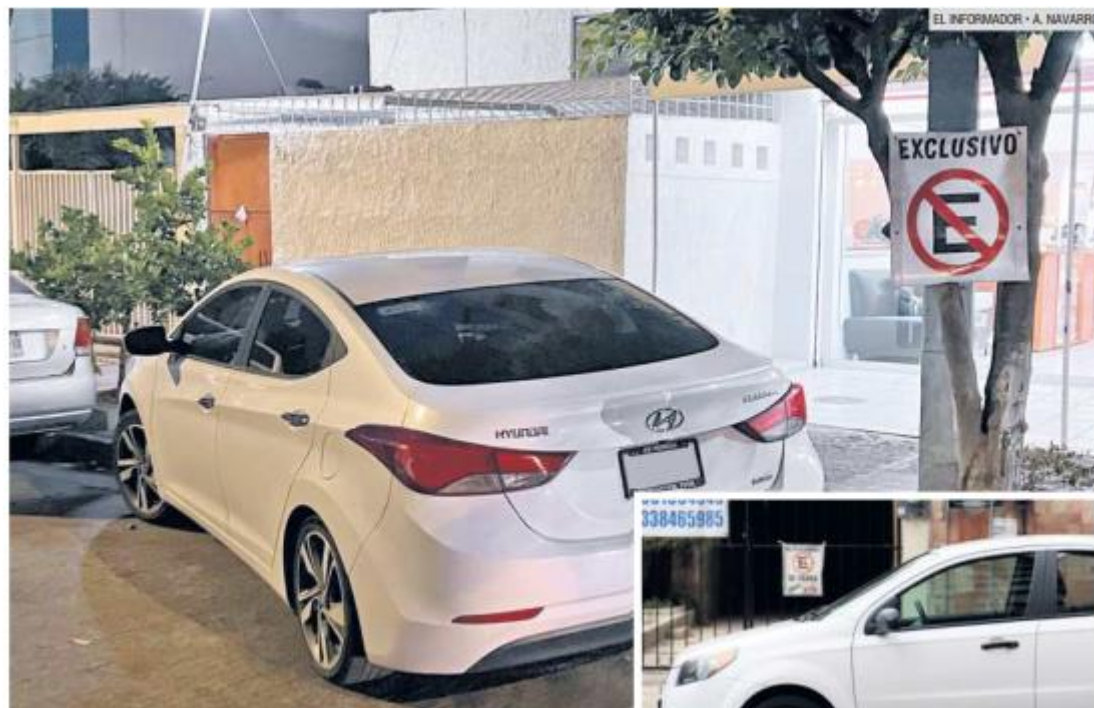
ESTORBAN. Obstruir las cocheras de los domicilios de la metrópoli se ha convertido en uno de los principales conflictos entre tapatíos.