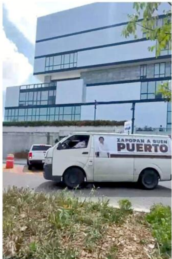
El regidor morenista señaló que el vehículo no es suyo, pero le pareció "simpático".

Por su presunta responsabilidad en operaciones fraudulentas, el 2 de octubre denunció ante la Fiscalía General de la República a Pablo Lemus Navarro, Alcalde en Zapopan, cuando se depositó ahí el dinero; y a Juan José Frangie, actual Presidente Municipal.