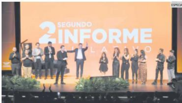
CUMPLE. Los temas primordiales fueron lo educativo y lo laboral.

“Hoy se ven beneficiados de manera directa 22 millones de mexicanas y mexicanos que son trabajadores de tiempo completo y que hoy tienen más tiempo para sus familias, para su descanso y para el cuidado de su salud mental”.