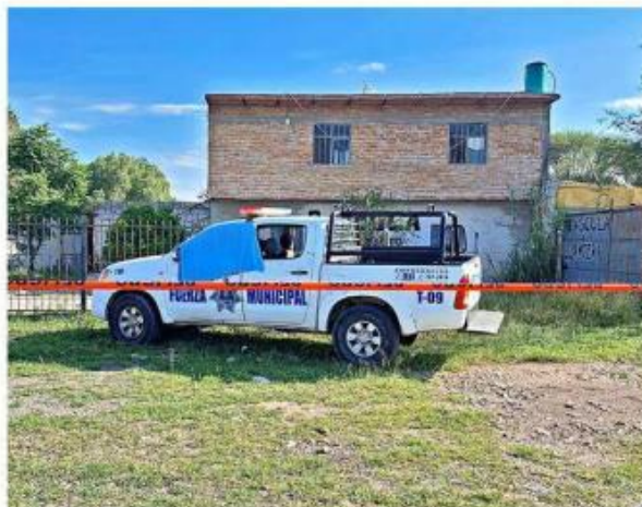
El 2 de septiembre fueron emboscados dos policías.

Entre las víctimas de este 2023 están dos policías municipales, quienes fueron emboscados el 2 de septiembre,