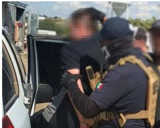
El sujeto fue detenido por oficiales de la Fiscalía Especial en Personas Desaparecidas.

La audiencia para determinar si se le vinculará a proceso por los delitos de desaparición cometida por particulares y desaparición de personas se realizará a través de video llamada.