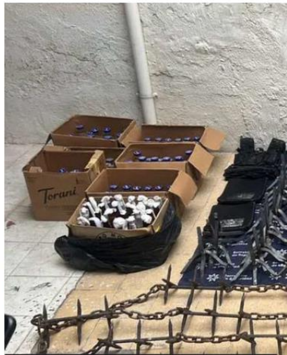
Todo lo encontrado en el sitio fue debidamente resguardado por las autoridades estatales y federales. ESPECIAL

En un segundo hecho, durante un recorrido de vigilancia por la carretera que conduce de Teocaltiche a