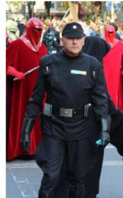
Cientos de fanáticos inundarán las calles de Guadalajara en esta segunda edición.