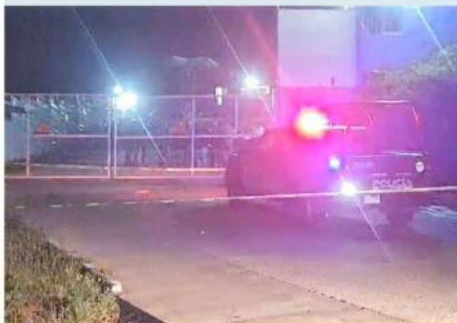
Los hechos ocurrieron en Puente Grande.

Asimismo, durante la noche del jueves fue hallado el cadáver de un hombre en avanzado estado de descomposición en una finca en obra negra de la Colonia Pueblo de Moya, en Lagos de Moreno.