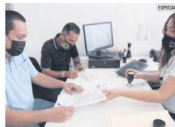
OPCIÓN. Este procedimiento agiliza la resolución de conflictos entre vecinos.

“Primero fue por un tema de la basura, que decía que la dejábamos donde no iba, pero se ha vuelto personal y ahora nos ataca en el chat de vecinos. Si es un problema porque vive al lado y los dos somos dueños, así que va a ser una convivencia permanente. Si veo que no hay solución, si pensaría en ir a uno de estos sitios”.