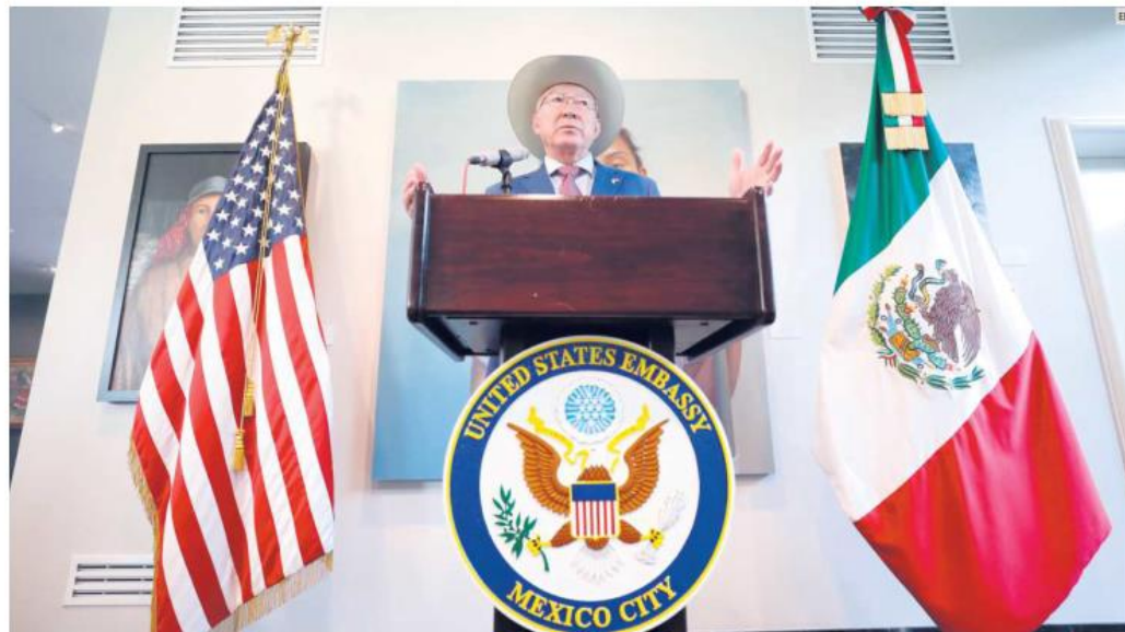
POSTURA. Ken Salazar, embajador de EU en México, dijo que en la frontera norte "somos como una familia".

Ken Salazar, embajador de EU, indica que se vienen tiempos de "cooperación histórica"