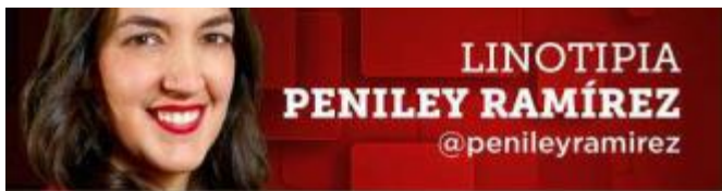
LINOTIPIA PENILEY RAMÍREZ @penileyramirez

Desde China, suministradores de precursores de fentanilo presumen su negocio mexicano; mientras nuestro gobierno repite una versión irreal.