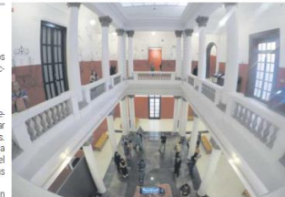
CULTURA. A lo largo de 29 años, el museo ha presentado casi 300 exposiciones.