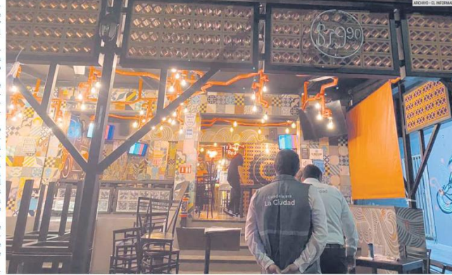
LÍMITES. En zonas comerciales, el nivel de decibeles en horario de 18:00 a 22:00 horas no debe sobrepasar los 68.