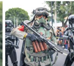
CABEZAS. El evento es organizado por el club de fans internacional de "Star Wars", denominado Legión 501.