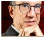
CARLOS ELIZONDO MAYER-SERRA @carloselizondom

Sheinbaum quiere un Poder Judicial que no discuta y acate instrucciones. ¿Eso queremos?