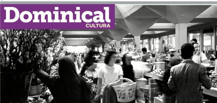
El edificio actual fue diseñado en 1962 por el alemán Horst Hartung