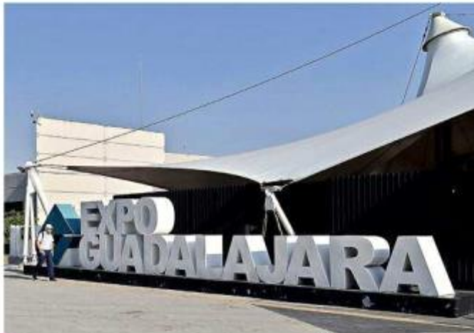
La infraestructura se proyecta que se realice a corto plazo, señaló el presidente de Expo Guadalajara.

Aunque aún no se define lo que se hará, una de las propuestas es realizar otro puente peatonal que ubicarán a unos metros del recinto en dirección a Plaza del Sol, o un paso desnivel, pero ninguno de los dos se ha concretado.