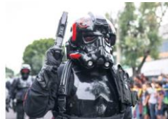
VARIEDAD. El desfile reunió a 300 personajes del universo de "Star Wars".

Cabe señalar que la intención de este desfile es apoyar a la fundación Nariz Roja, la cual se dedica a atender niños con cáncer de escasos recursos a través de servicios gratuitos como albergue, comedor, educación, medicamentos y pelucas.