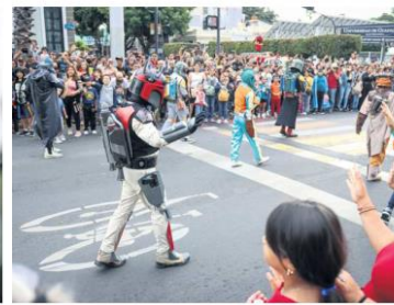
PÚBLICO. Reportan que asistieron a ver el desfile cerca de 40 mil personas.