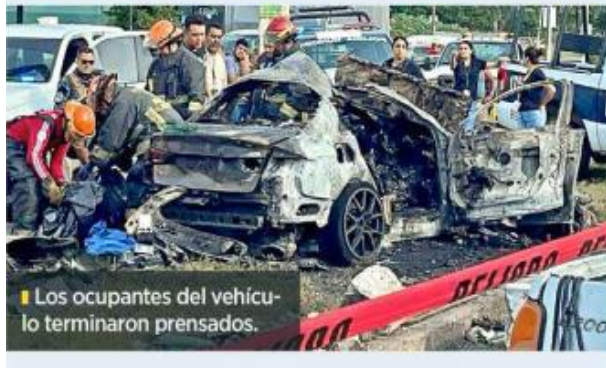
Los ocupantes del vehículo terminaron prensados.