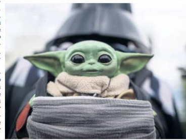
"GROGU". El personaje también conocido como "Baby Yoda" se hizo presente.