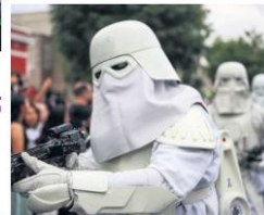
DISFRACES. La calidad de los atuendos es visible.