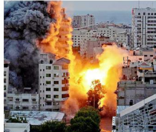
Hamas bombardeó territorio de Israel, que respondió con ataques a Gaza. Militantes del grupo islamista realizaron incursiones en las que mataron a civiles y militares israelíes.

La escalada dejó "más de 200 muertos" y mil heridos del lado israelí, mientras en Gaza se reportaron 232 fallecidos y al menos mil 700 lesionados por los contraataques israelíes.