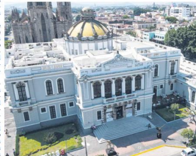
PAISAJE. Una mirada desde las alturas del MUSA.