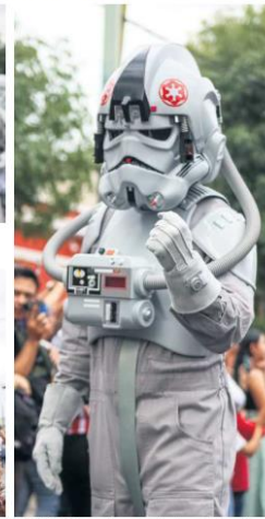
FAMILIA. Antiguos y nuevos fans de la saga estuvieron presentes.