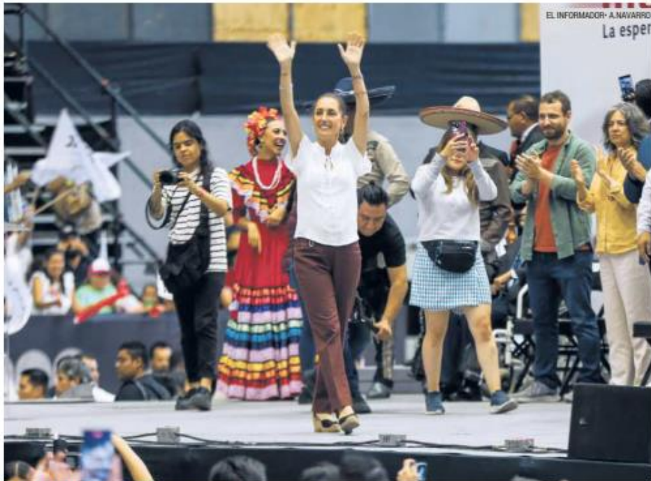
CONCENTRACIÓN. Claudia Sheinbaum se reunió ayer con 13 mil simpatizantes.

Al reiterar que es tiempo de transformación y de mujeres, Sheinbaum Pardo, exhortó a los morenistas a seguir formando comités de defensa y pronosticó: si hay unidad, movilización y se hace conciencia entre la población, en Jalisco va a ganar la Cuarta Transformación. "Vamos por la Presidencia, vamos por Jalisco y vamos por todos los diputados federales, locales y las presidencias municipales",