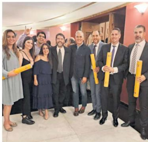
TALENTO. Arquitectos ganadores e invitados posan tras la entrega de los premios.