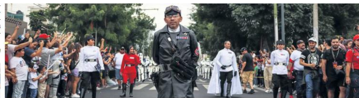
CALLES. La organización del evento reportó que el público estuvo a la altura del desfile.