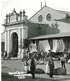
La construcción antigua del Mercado Alcalde estuvo a cargo del arquitecto alemán Ernesto Fuchs en 1896.

Aunque la estructura ha sido modificada y apropiada por los locatarios en su uso cotidiano, el inmueble está en buen estado de conservación. Los recintos de cemento y celosías del mercado fueron tapados, pero los parapetos de concreto en los interiores, así como las celosías de ladrillo se mantienen como vestigios de esa modernidad impudada a mediados del siglo 20 en Guadalajara.