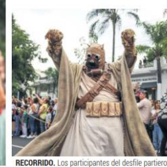
RECORRIDO. Los participantes del desfile partieron de Avenida Enrique Díaz de León y terminaron en la Glorieta Minerva.