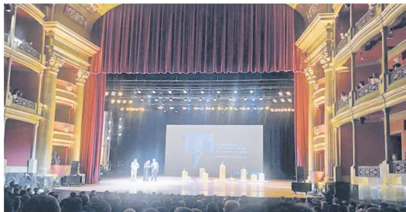
SEDE. La entrega de los reconocimientos a lo mejor de la arquitectura fue en el Teatro Degollado.