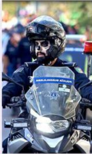
■ Elementos de la Policía de Guadalajara también desfilaron caracterizados.

Al desfile también acudió parte de las y los bailarines del Estudio de Danza Gabriela Rodríguez.