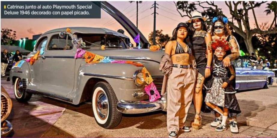
■ Catrinas junto al auto Plymouth Special Deluxe 1946 decorado con papel picado.