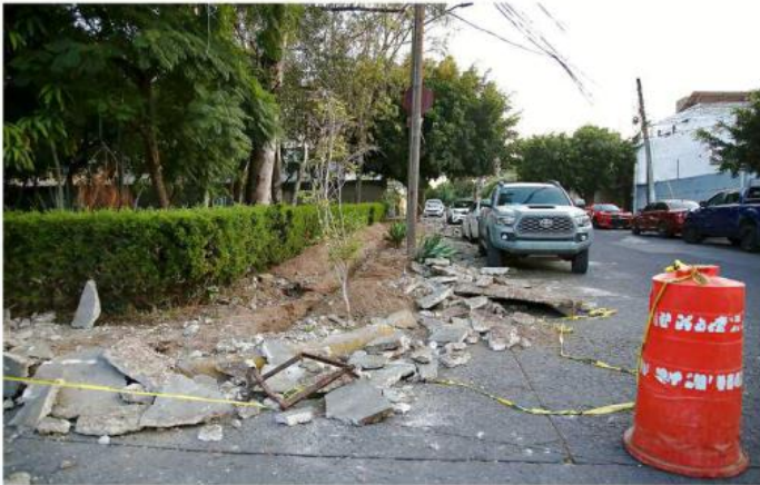
Vecinos señalan que excavación habría afectado el alumbrado público.

Vecinos aseguraron que, a pesar de hacer múltiples reportes telefónicos, estos no han sido atendidos. También tienen el registro de dos reportes realizados vía GuaZap: uno el 25 de octubre con folio 203189 y otro con el 20 de octubre con folio 202763.