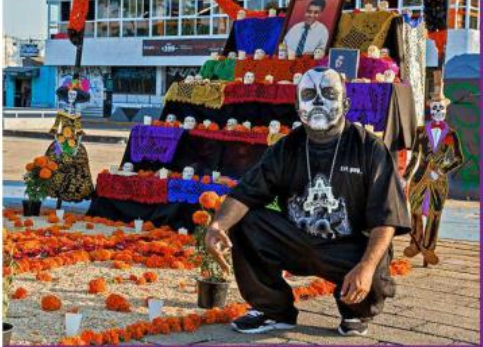
■ El Popeye a un lado del tradicional altar de muertos que se montó este año en el Parque de la Antigua Penal de Oblatos.

ÁNGEL LLAMAS El Día de Muertos se celebró con la tradicional reunión "pizzas and beers" convocada por GDLOW en el Parque de la Antigua Penal de Oblatos. Una vez al mes se reúnen los diferentes car clubs de autos lowrider y clásicos de la Zona Metropolitana de Guadalajara para una convivencia familiar al estilo chicano. La relación de grupos de tapatíos con la cultura chicana está arraigada desde hace años y se dan cita en dicho parque, apropiando el estilo de vestir, la música y el gusto por los autos lowrider y clásicos, característicos de esta cultura mexicano-estadounidense. La reunión se convierte en una verbena en donde se convive entre música, autos y amigos. En esta ocasión los vehículos se decoraron con motivos alusivos al Día de Muertos: rostros pintados de catrinas y calaveras celebran el Día de Muertos con danzas aztecas que evocan a Mictlantecuhtli, señor del Mictlán, lugar de los muertos, en un parque que se convierte en el centro de la cultura chicana en Guadalajara.