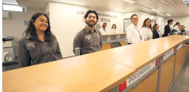
SERVICIO. Con la expedición de pasaportes en la Plaza Guadalajara, se busca que el servicio sea más eficiente en sus dos sedes en la ciudad.

La Secretaría de Relaciones Exteriores tiene una nueva sede en la Plaza Guadalajara