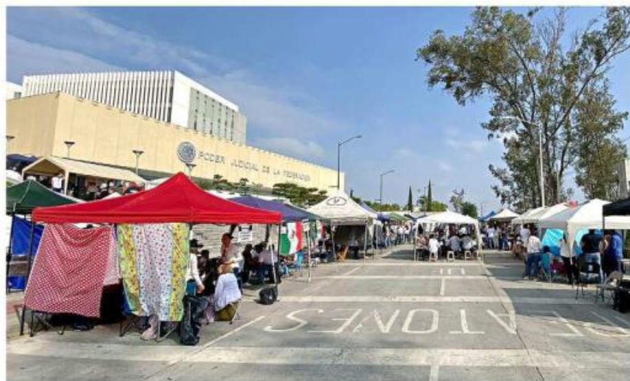
■ Durante octubre empleados del PJF realizaron bloqueos y manifestaciones.

Las deliberaciones y resoluciones de ese poder han sido clave en momentos en