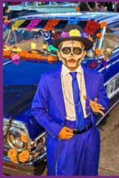
■ Un catrín pachuco posa en el coche decorado Chevrolet Impala 64.

ÁNGEL LLAMAS El Día de Muertos se celebró con la tradicional reunión "pizzas and beers" convocada por GDLOW en el Parque de la Antigua Penal de Oblatos. Una vez al mes se reúnen los diferentes car clubs de autos lowrider y clásicos de la Zona Metropolitana de Guadalajara para una convivencia familiar al estilo chicano. La relación de grupos de tapatíos con la cultura chicana está arraigada desde hace años y se dan cita en dicho parque, apropiando el estilo de vestir, la música y el gusto por los autos lowrider y clásicos, característicos de esta cultura mexicano-estadounidense. La reunión se convierte en una verbena en donde se convive entre música, autos y amigos. En esta ocasión los vehículos se decoraron con motivos alusivos al Día de Muertos: rostros pintados de catrinas y calaveras celebran el Día de Muertos con danzas aztecas que evocan a Mictlantecuhtli, señor del Mictlán, lugar de los muertos, en un parque que se convierte en el centro de la cultura chicana en Guadalajara.