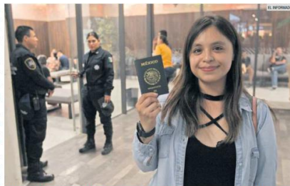
PROCESO. El trámite para obtener el pasaporte inicia de forma virtual en la página web de la SRE, luego se realiza el pago y después se asiste al módulo de atención.

En el caso de la renovación, se debe llevar copia simple de la Clave Única de Registro de Población (CURP), certificada por el Registro Civil, y entregar el pasaporte a renovar, acompañada de una copia de la libreta de pasaporte abierta que contenga la hoja de datos personales y el número de libreta; ambas