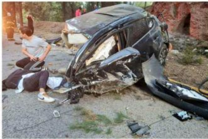
El conductor sufrió una fractura de pelvis que lo dejó grave.

está por Miguel León Portilla perdió el control, por causas no esclarecidas, y chocó contra un árbol, informó personal de Protección Civil y Bomberos de Guadalajara.