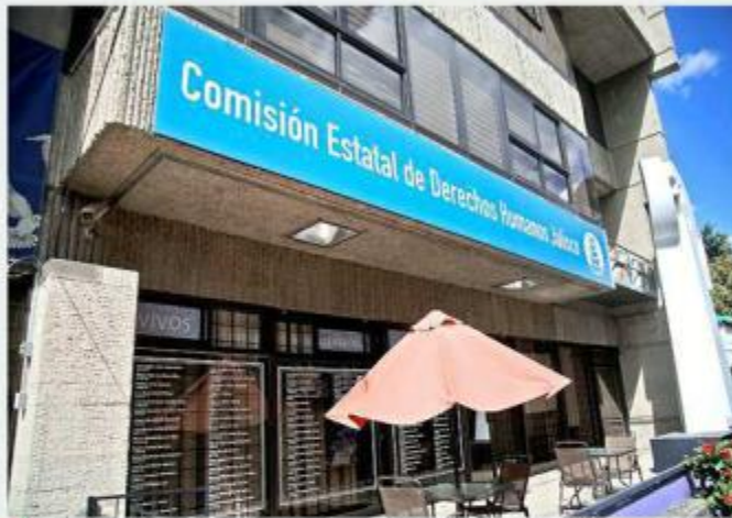
La Comisión acreditó que el agraviado fue acusado falsamente.

“Fue subido a una patrulla y trasladado al sector operativo de la Policía de Tlajomulco de Zúñiga, identificado como estación Chulavista, lugar donde los elementos sacaron una mochila, que contenía en su interior un arma, pastillas y cartuchos, e inculparon al agraviado de que él los