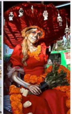
■ Los contrastes entre catrinas impactaron a muchos.