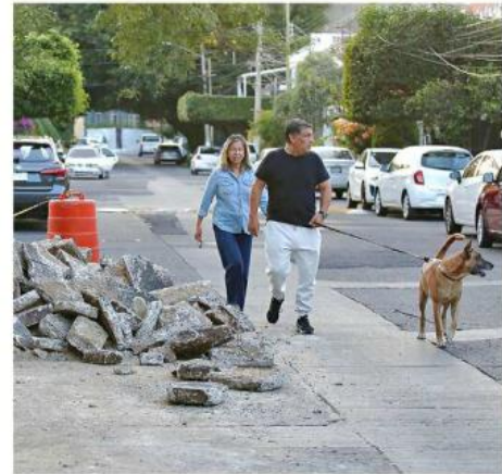
Peatones deben esquivar escombros y arena.