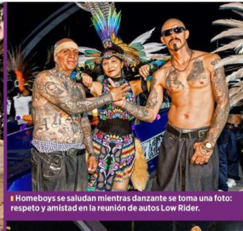
■ Homeboys se saludan mientras danzante se toma una foto: respeto y amistad en la reunión de autos Low Rider.