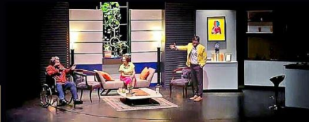
■ La obra "Basada en un texto de Juan Villoro "El Filósofo Declara", está en el Foro de Arte y Cultura.