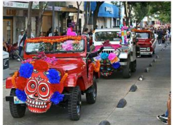
■ Vehículos clásicos y sus conductores también iban por la calle acorde al Día de Muertos.