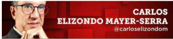
CARLOS ELIZONDO MAYER-SERRA @carloselizondom

En vez de empeñarse en superar injusticias sistémicas, AMLO dedicó su poder a sus obras y para concentrar más poder.