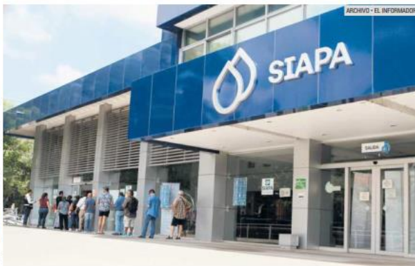
PRECIO. Diputados y la UdeG consideran que la tarifa no corresponde al servicio.

En febrero de 2022, la Comisión Estatal de Derechos Humanos de Jalisco (CEDHJ) emitió la Recomendación 10/2022, instando a diversas autoridades a tomar medidas para abordar la mala calidad del agua en diferentes colonias de