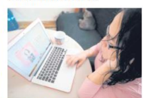
BENEFICIO. El estudio a distancia permite realizar otras actividades y aprovechar el tiempo.

Añadió que el cambio de visión, especialmente de la población joven, se ha trasladado no solamente a optar por trabajos home office, sino también a buscar mejores condiciones de estudio a través de la educación en línea. "Hoy eso es lo deseable, el poder combinar el trabajo, el estudio y el tiempo libre de una mejor manera. Esto es posible, precisamente, gracias a los programas de educación en línea, como lo es el Sistema de Universidad Virtual de la UdeG".