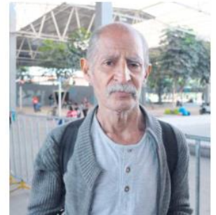
DISPERSIÓN. La entrega del apoyo para noviembre y diciembre se hará por orden alfabético.

En todos los años, tanto en el presupuesto aprobado como en el gasto ejercido, el Programa Pensión para el Bienestar de las Personas Adultas Mayores presenta incrementos respecto del año que le precede, "lo que generó una Tasa Media de Crecimiento Anual (TMCA) real de 28.9 por ciento en el presupuesto aprobado de 2019 a 2023. En tanto que, el gasto ejercido presenta una TMCA de 22.6 por ciento para el periodo 2019-2022. Es decir, superior a la TMCA real de los recursos de la Secretaría de Bienestar, que fue de 22.3 por ciento para lo aprobado y de 21.2 por ciento para la cantidad ejercida".