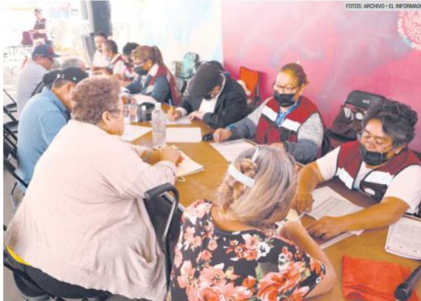
BENEFICIO. Cada día hay más adultos mayores inscritos al programa.

Para 2022 se observó la eliminación del S285 "Programa de Microcréditos para el Bienestar", con lo que quedaron 16 programas prioritarios, coordinados por seis entidades federales. Dicha configuración se mantuvo a inicios de 2023.