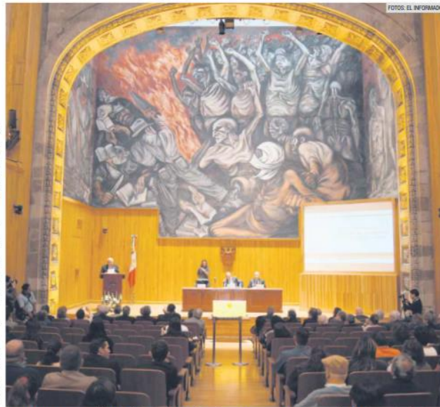
FUNCIONES. El Paraninfo ha sido sede de reuniones importantes como la de la Asociación de Academias de la Lengua Española, en 2014.