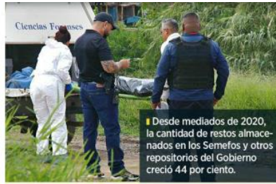
Desde mediados de 2020, la cantidad de restos almacenados en los Semeños y otros repositorios del Gobierno creció 44 por ciento.