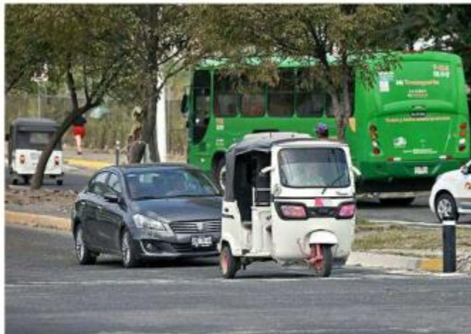
■ Sólo estarán permitidos los vehículos con dos ejes y cuatro ruedas, de acuerdo con la norma técnica publicada.

La Secretaría de Transporte tiene 90 días hábiles para actualizar el registro de estos operadores y formar un comité tarifario para fijar el precio del servicio. Los prestadores, tienen 550 días naturales para lograr su registro y cambiar sus unidades.