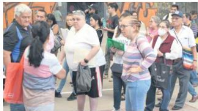
PRIORIDAD. El recurso es destinado a quien más lo necesita.

Por ese motivo, adelanta que la estrategia de atención del Consejo para el siguiente año se enfocará en cursos y ejercicios que permitan que estos programas delimiten las características de sus beneficiarios. "Vinculado al reto anterior, está que los programas prioritarios clasificados en la temática de Gestión logren