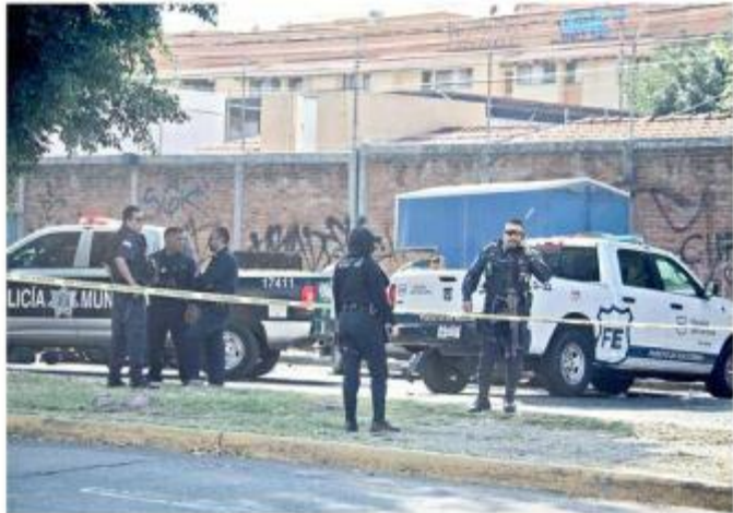
■ El accidente ocurrió en Jaime Torres Bodet e Isla Gomera.

La Policía de Tlaquepaque argumentó que la patrulla 17410 era manejada a exceso de velocidad porque los oficiales buscaban un vehícu-