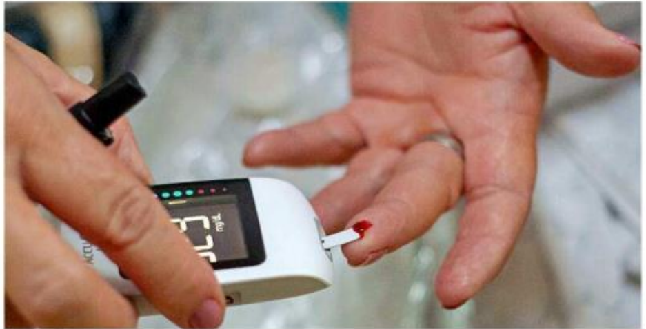
■ Recomiendan hacer chequeos de rutina para detectar anomalías.

La mortalidad de esta enfermedad va al alza. De 2012 a 2022 ha incrementado 11.12 por ciento, al pasar de 5 mil 277 defunciones a 5 mil 864.