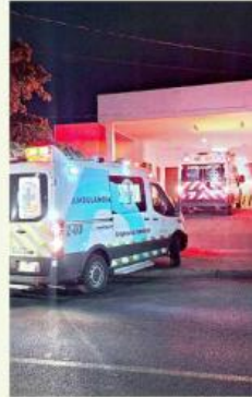
Un hombre falleció en la Cruz Verde Federalismo.

miento del centro comercial fue acordonado y se desplegaron varias unidades de la Comisaría y del Ejército en la zona.