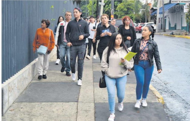
OPORTUNIDAD. Los jóvenes tendrán más espacios para estudiar gracias a la tecnología.