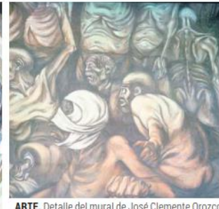
ARTE. Detalle del mural de José Clemente Orozco en el Paraninfo. Lleva por nombre "El pueblo y sus falsos líderes".