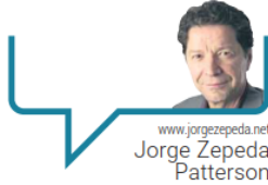
www.jorgezepeda.net Jorge Zepeda Patterson