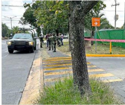
La mujer fue baleada en la Colonia Virreyes.