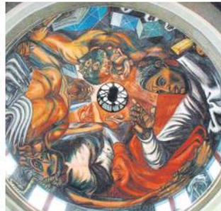
MURAL. Esta obra es titulada "El hombre creador y rebelde".