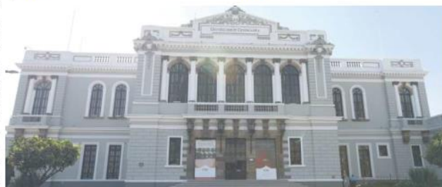
MUSA. Espacio cultural que alberga el Paraninfo.

de la universidad, en 1949, se la da un nombre popular al aula, algo que existía en las universidades norteamericanas, porque al hombre que vestía bien y que en un espacio de asamblea le daba la bienvenida a los estudiantes, se le conocía como paraninfo". Así que en la Universidad de Guadalajara acuñaron la palabra y asociaron al aula con paraninfo.