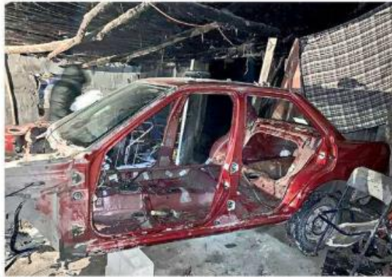
Delinquentes aprovecharían la renta del vehículo para desmantelarlo.