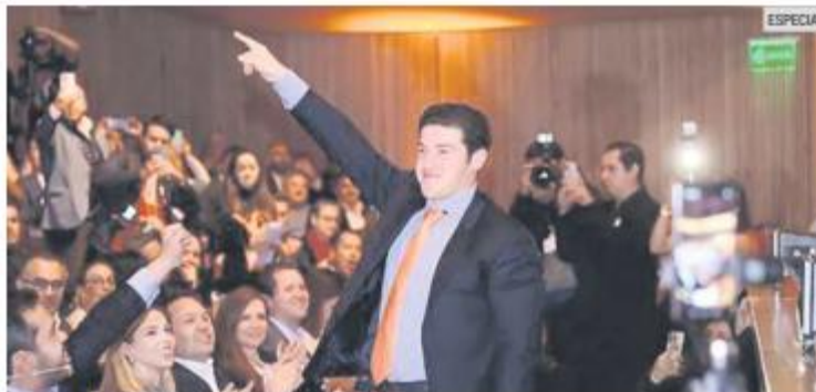
OPTIMISTA. Samuel García dice que "el futuro es naranja".

De acuerdo con fuentes cercanas al partido, Samuel García sí tenía previsto iniciar en Guadalajara, sin embargo, debido a los tiempos y procesos marcados por el INE, las figuras locales no podrían acompañarlo, pues esto sería motivo de sanción.