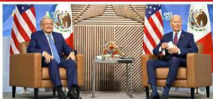
AMLO y Biden tuvieron su cuarta reunión bilateral.