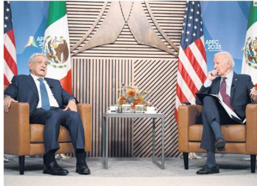
POSTURA. López Obrador y Biden dialogaron de migración, en un momento en que Estados Unidos pasa apuros en esta materia, y también sobre el tráfico de fentanilo, que se ha vuelto un problema de salud pública en el país vecino.