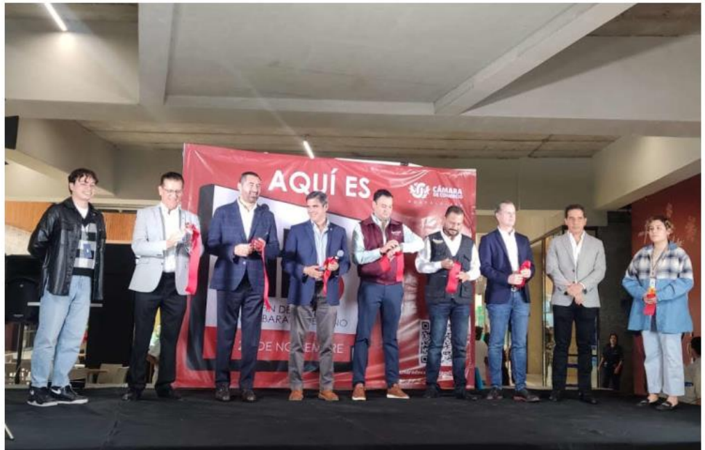
El arranque oficial del Buen Fin se realizó en Plaza Patria, en Zapopan. ANDREAMANZO

Tras el arranque oficial de Buen Fin 2023, en Plaza Patria, el líder empresarial dio recomendaciones para realizar compras inteligentes, “es planear la compra, venir a comprar lo que realmente necesitamos, lo decía la gente de Profeco, a revisar los precios, las garantías de ese artículo que queremos com-