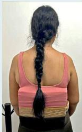
La mujer intentó viajar con paquetes de droga.

La Guardia Nacional notificó al Ministerio Público Federal sobre el hallazgo para que sus agentes abrieran una carpeta de investi-