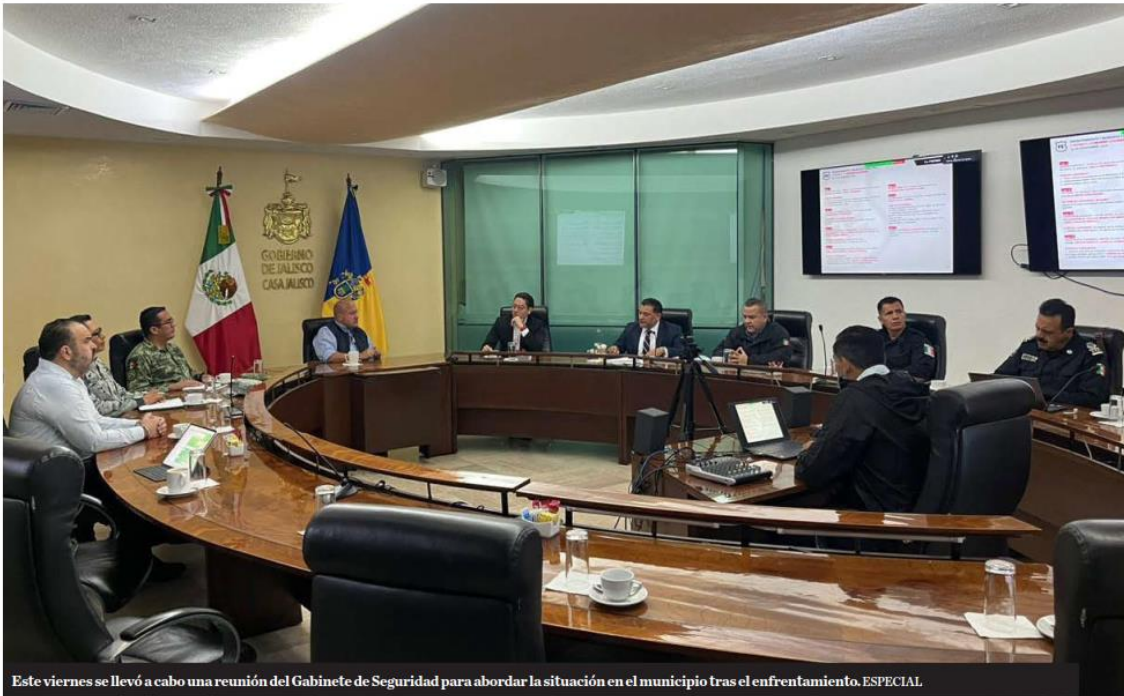
Este viernes se llevó a cabo una reunión del Gabinete de Seguridad para abordar la situación en el municipio tras el enfrentamiento. ESPECIAL