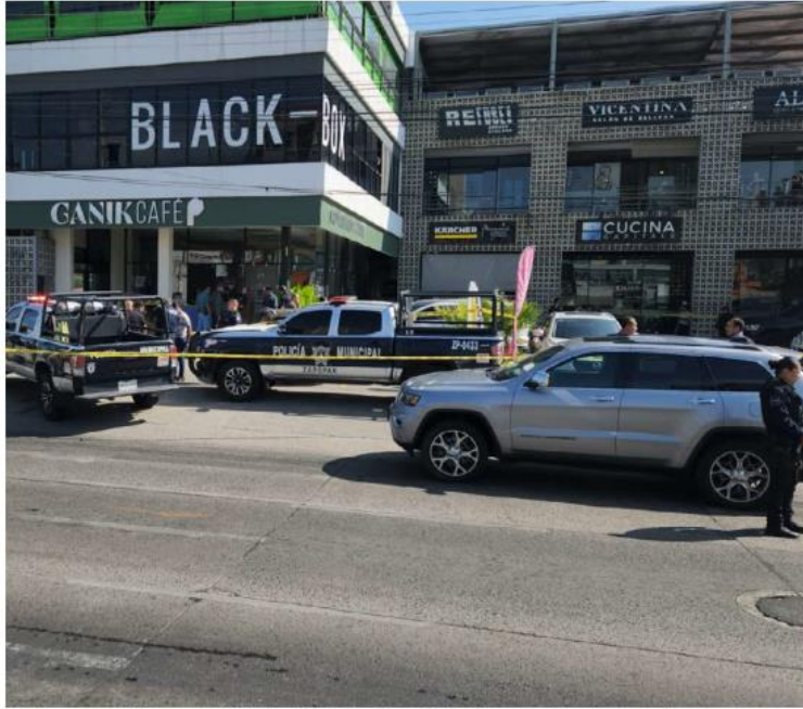
El ataque ocurrió en una cafetería de la colonia La Estancia. JUAN CARLOS MUNGUÍA