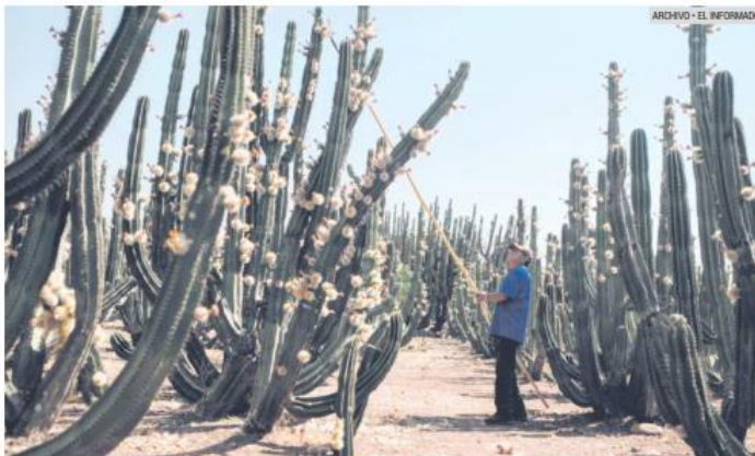
MUNICIPIO. Se distingue por estar ubicado en la zona sur de Jalisco y la producción de nuez, café y pitaya.

"Estamos interviniendo la unidad deportiva de Amacueca que tendrá una inversión de 14 millones de pesos. Se estará renovando el ingreso, los baños, las canchas de frontenis, se le va a colocar pasto natural a la cancha porque no contaba con pasto, se van a poner más juegos para los niños, se van a colocar mobiliario urbano como botes de basura, bancas". También colocarán pasto sintético a la unidad deportiva de la delegación Tepec, indicó.