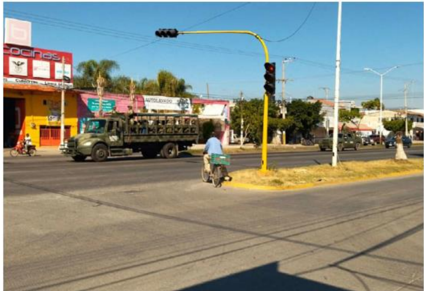
Aunque se reanudaron las actividades, en las calles había pocas personas. DIANA BARAJAS

“Cerramos nuestro negocio, cerramos nuestras cortinas y por ventanas pudimos ver cómo fue el enfrentamiento, fue un aproximado de entre 5 a 8 minutos (...) algunos tirados en el piso, otros viéndolo por la ventana y otros muy asustados, apartados en el