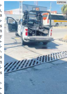
SALDO. El fallecido era uno de los atacantes.

El gobernador también aseguró que las cosas han regresado a la normalidad en la región de la Ciénega y pidió a los ciudadanos