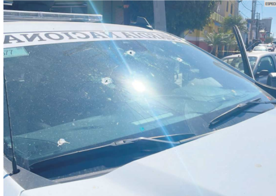
ATAQUE. Varias patrullas recibieron balazos de parte de los agresores.

Adelantó que tras el hecho, en el cual también habría participado un "carro mon-