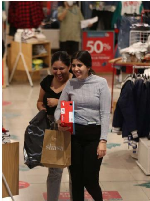
Ofertas en los centros comerciales. ESPECIAL