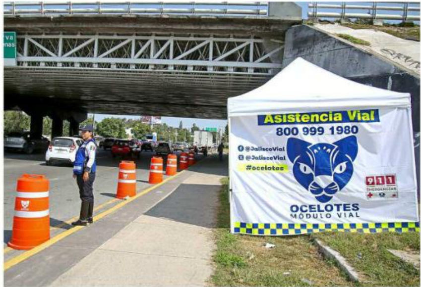
Vecinos afirman que tras dos semanas de operación, han sido días tranquilos.

“En lo personal, y también en el chat de Unión de Colonias Puerta Sur, la gran mayoría pensamos que el resultado de los módulos viales muestra una mejora visible