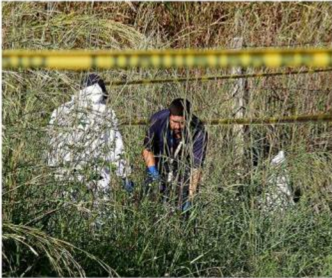
En Zapopan fue localizado el cuerpo sin vida de una mujer.