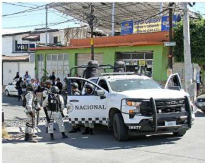
■ Sicarios dispararon contra unidades de la Guardia Nacional y la Policía del Estado en Ocotlán.

Agregó que hay operativos que parece que no están dirigidos directamente a la delincuencia, pero que afec-