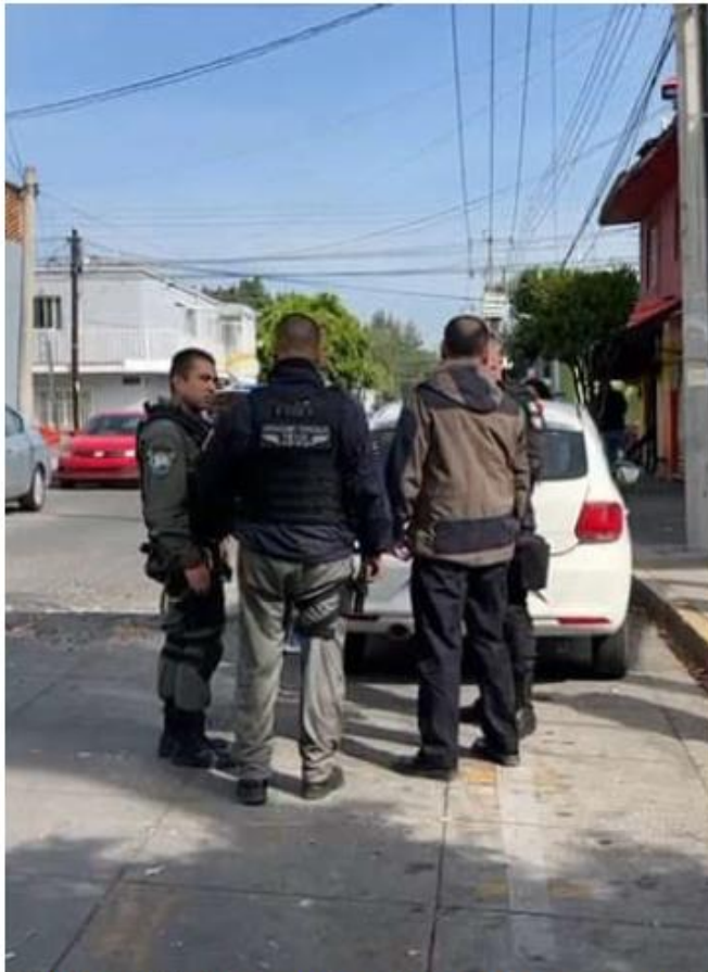
Oficiales municipales resguardaron la zona. JUAN CARLOS MUNGUÍA

Percance. El arma de alto poder se desprendió de la aeronave cuando sobrevolaba la colonia Villa Guerrero, no hay heridos