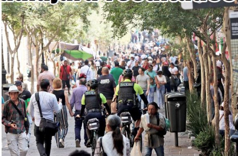
Entre los artículos más adquiridos destacaron ropa y calzado, electrónica, electrodomésticos, juguetes y artículos deportivos.