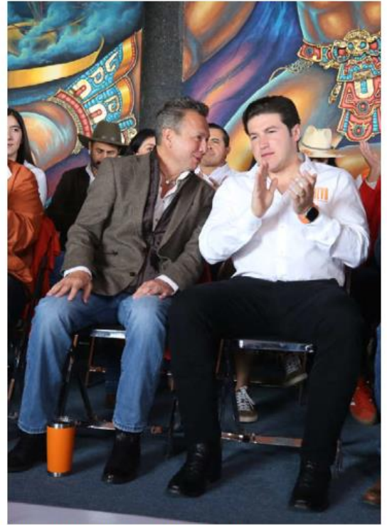
Lemus y García visitaron Tequila. ESPECIAL

El político emecista también celebró que la cuenta de Twitter de Vicente Fox haya sido deshabilitada tras las últimas declaraciones que realizó en la