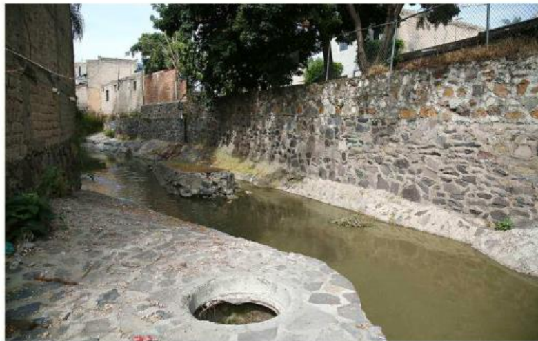
Ante hedor y proliferación de mosquitos, en la zona hay casos de dengue, enfermedades gastrointestinales y respiratorias.

Este arroyo, explicó, viene de la parte alta de colonias como El Briseño, Arenales y otras situadas entre el Anillo Vial y La Primavera.