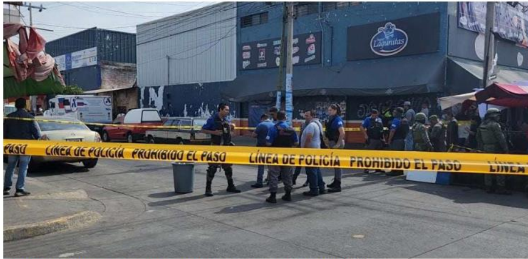
El hecho ocurrió en calles de la colonia Libertad, en el municipio de Guadalajara. PABLO NÚÑEZ

Seguridad. Los elementos fueron sorprendidos por seis sujetos armados que les dispararon y después les quitaron dos bolsas con dinero en efectivo; hallan a un hombre sin vida y otro herido y maniatado