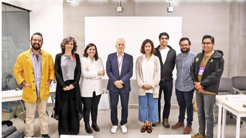
Especialistas pretenden fomentar el uso de la bicicleta con enfoque de género.

"Vemos una gran oportunidad en tres aspectos: el primero, fortalecer capacidades técnicas en el instituto, para realizar evaluaciones y actualizaciones a planes o estudios que los municipios metropolitanos actualmente contratan a empresas externas, lo que ayudaría a su sostenibilidad financiera; dos, que en Imeplan contamos con gran cantidad de datos para fortalecer este proyecto, como la Encuesta origen-destino que estamos por lanzar; y tres, que podremos brindar un modelo de referencia a otras ciudades o metrópolis para que impulsen sistemas de transporte compartido como MiBici",