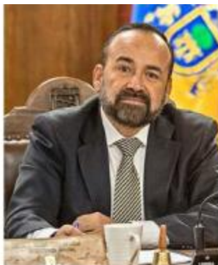
■ Sergio Chávez, Alcalde de Tonalá.