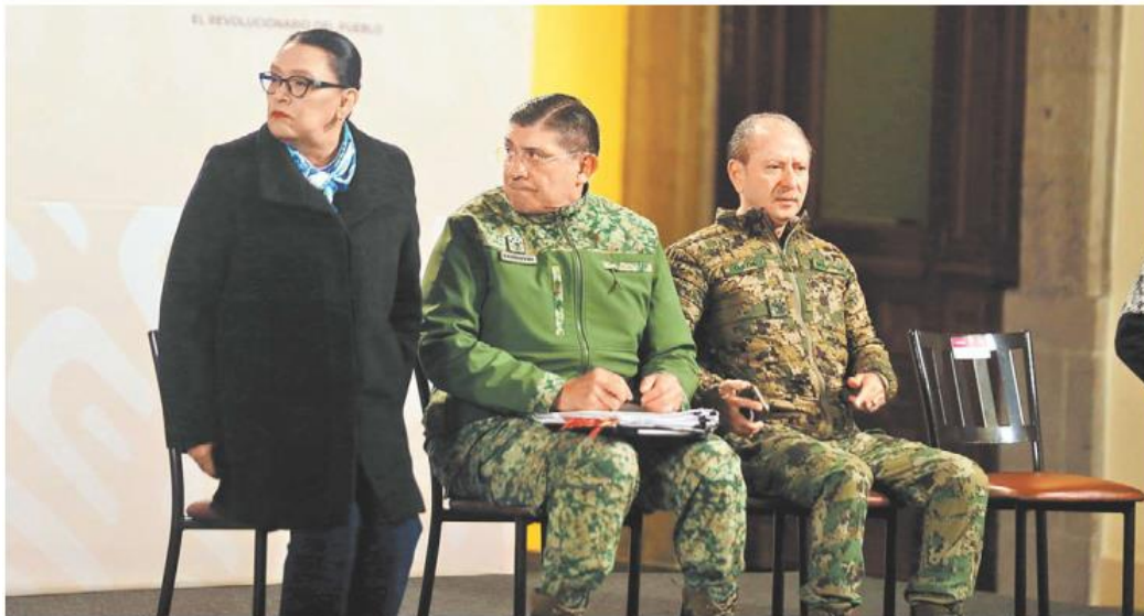
Rosa Icela Rodríguez, Luis Cresencio Sandoval y Rafael Ojeda, titulares de Seguridad, Sedena y Marina, en la mañana.

YO A MO ACAPULCO El Tianguis del Bienestar llega a Acapulco para reforzar apoyo