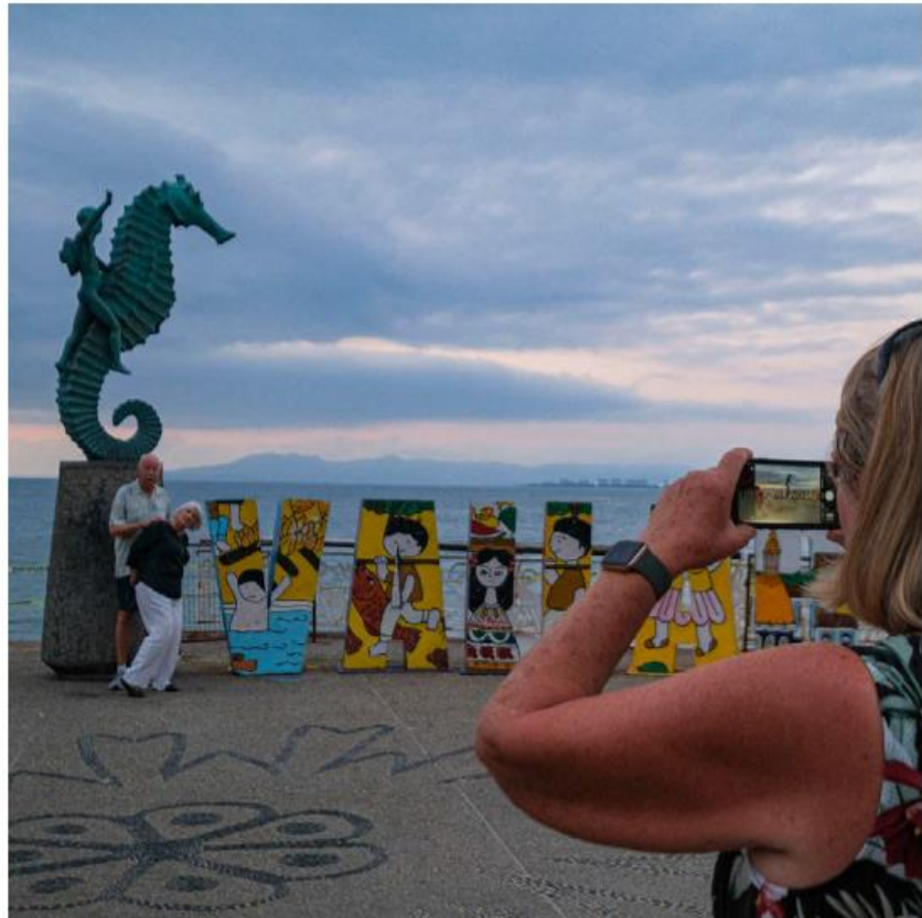
Puerto Vallarta es uno de los principales destinos turísticos del estado. ESPECIAL

Como resultado, la derrama económica generada por el sector turístico también se incrementó, un 6 por ciento con relación a 2022, al alcanzar 64 mil 472 millones de pesos de enero a octubre. Guadalajara generó 24 mil 950 millones de pesos y Puerto Vallarta suma 33 mil 997 millones de pesos, siendo el destino de playa el que más derrama económica