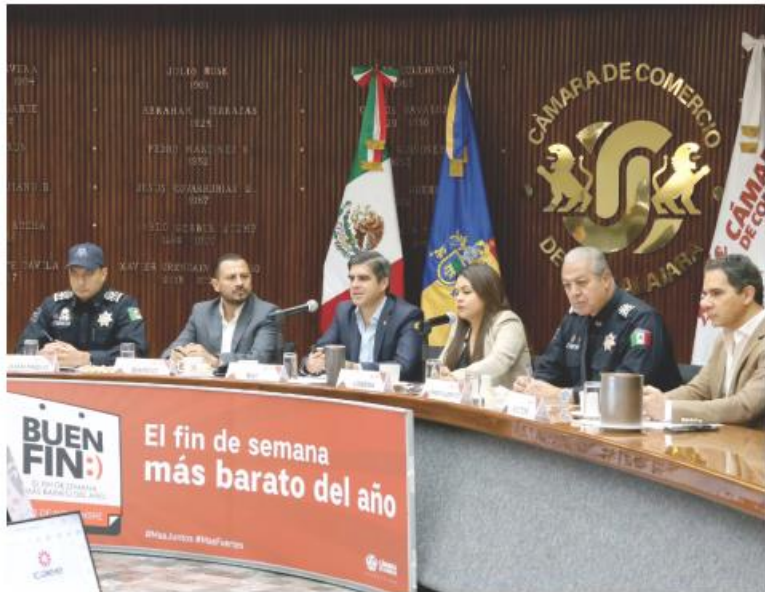
Casi una tercera parte de las compras que se realizaron fueron en línea.