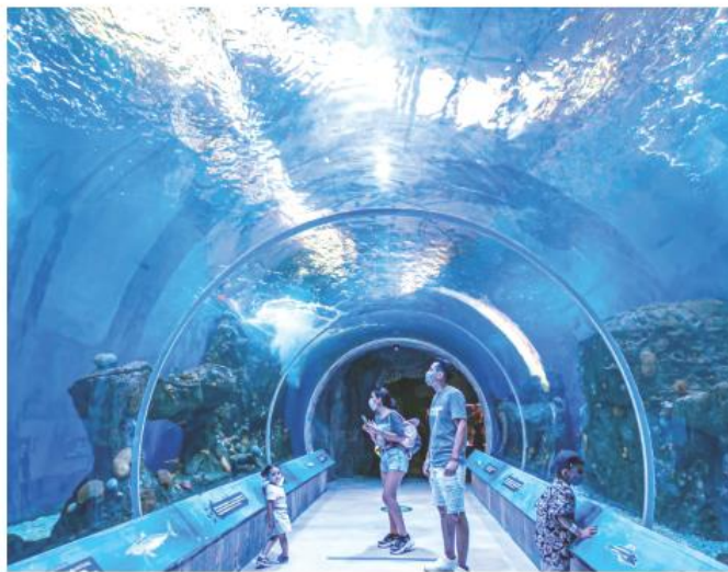
La derrama económica generada por el sector turístico alcanzó los 64 mil 472 millones de pesos.

En comparación con el mismo periodo del año anterior, el Estado superó la cifra de 28 millones 373 mil turistas