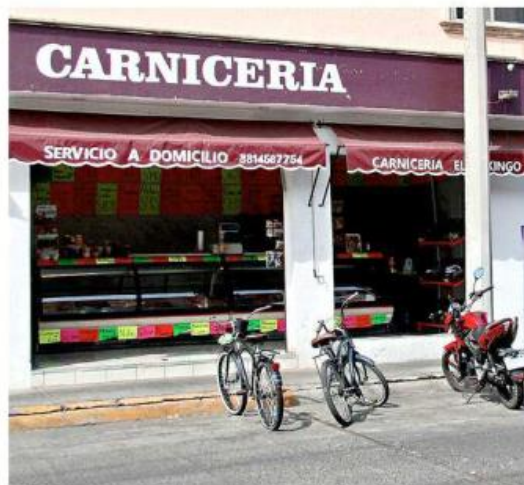
El arma cayó en las inmediaciones de una carnicería y dañó levemente un vehículo.

El arma cayó desde 150 metros, pero no golpeó a nadie. La Comisaría aseguró que continuará revisando las circunstancias en las que se dio el accidente.