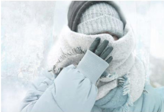
Poco a poco comienzan a sentirse bajas temperaturas en Jalisco.

Para ello, informó el médico de profesión, se tiene 60 mil vacunas como meta por aplicar en la región sanitaria, hasta el último día de marzo.