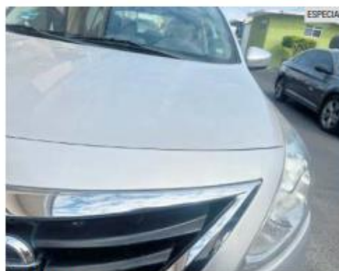
SALDO BLANCO. El arma sólo averió el cristal de este auto.