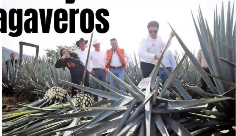
Pablo Lemus y Samuel García recorrieron los campos de agave en Amatitán y otros sitios turísticos de Tequila.

Tanto Samuel García como Lemus Navarro, escucharon las propuestas que permitan impulsar el desarrollo y la preservación del Patrimonio Mundial de Tequila y el sector turismo de todos los rincones de la entidad. El precandidato naranja a la Pre-