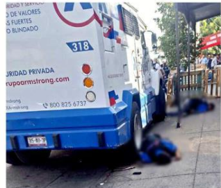
El vehículo blindado estaba estacionado mientras se cargaba dinero de una abarrotera para trasladarlo.

Unos delincuentes fingieron ser cargadores para robar un millón 400 mil pesos de un camión de valores en la Colonia El Porvenir, en Guadalajara. Para cometer el delito, mataron a dos guardias de la empresa de seguridad Armstrong y desarmaron a otra policía auxiliar. Alrededor de las 11:30 horas de ayer, el vehículo blindado estaba estacionado en la Calle Josefa Ortiz de Domínguez, cerca de Las Lagunas, pues los escoltas estaban cargando dinero de la abarrotera Lagunitas para trasladarlo. Según testigos, en la zona estaba estacionada una Nissan Quest tiritá y de ahí bajaron dos hombres con un díptico y caps. Al fingir ser cargadores, pudieron acercarse lo suficiente al camión blindado. Posteriormente, del interior de las cajas sacaron un arma larga y dispararon a los escoltas. El otro negocio estaba una policía auxiliar quien intentó detenerlos, pero le robaron su arma calibre .223. De acuerdo con información de la Fiscalía del Estado, el