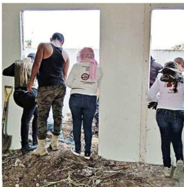
Las Madres Buscadoras encontraron restos humanos en Villa Fontana Aqua, en Tlajomulco.

“No pueden limitarnos a hacer un ‘en vivo’, a publicar la ubicación de los hallazgos