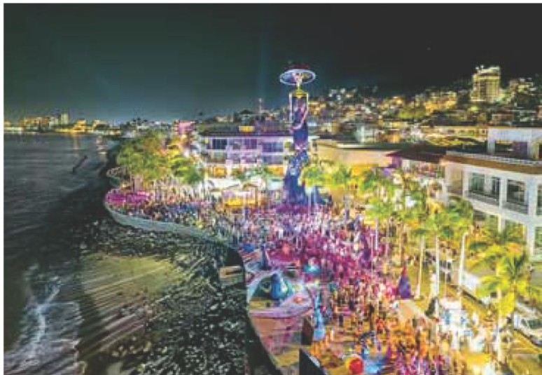
Sitios. Puerto Vallarta se consolida como el destino predilecto entre los visitantes.

Líder. El estado ha recibido 28 millones 373 mil visitantes de enero a octubre; Puerto Vallarta es primer lugar nacional en ocupación hotelera