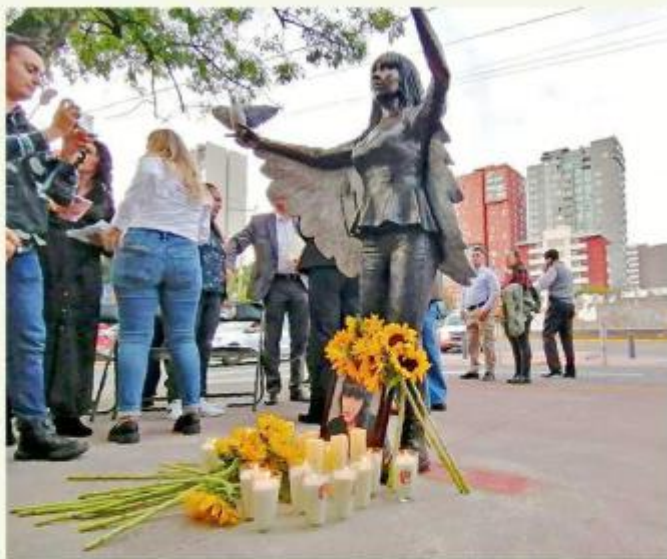
El memorial honra también a otras víctimas de feminicidio.