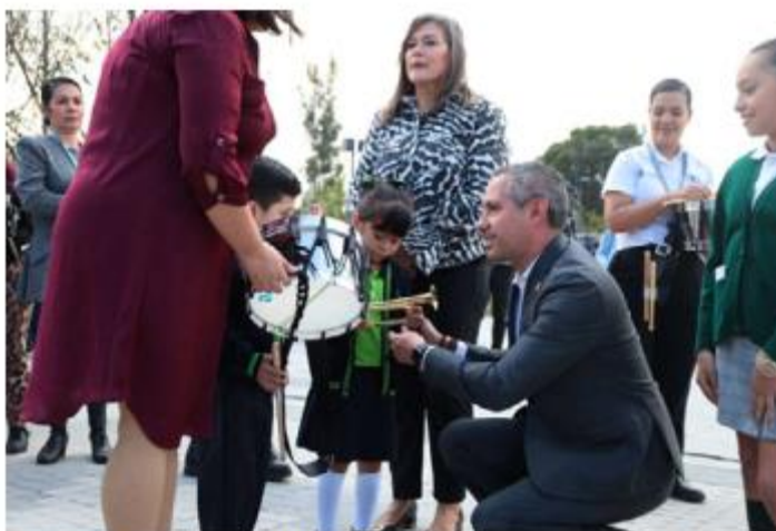
APOYOS. El gobierno de Zapopan entregó este jueves instrumentos musicales a las bandas de guerra de 20 escuelas del municipio. Cada kit entregado contiene un tambor y una trompeta.