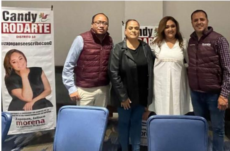
La empresaria y activista buscará la diputación del distrito 10. ESPECIAL

"Esas diputadas y esos diputados solo van a cumplir los capri-