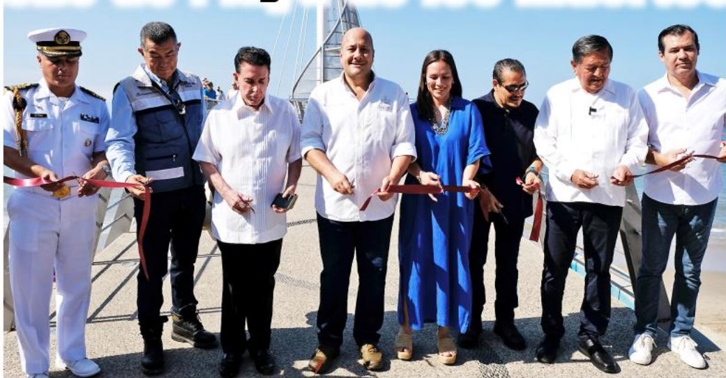
Puerto Vallarta es el destino turístico con mayor ocupación hotelera.

El gobernador Enrique Alfaro recordó el estado de abandono en el que se encontraba esta estructura, y que con esta intervención dará una mejor imagen y seguridad a quienes lo visiten: "Estamos literalmente en el paraíso, en la Playa de los Muertos, viendo cómo quedó una obra que iniciamos ya hace algunos meses con la rehabilitación y reconstrucción del muelle de la Playa de los Muertos, una obra espectacular que se hizo con motivo de los Juegos Panamericanos y que ya estaba padeciendo el paso del tiempo, la estructura estaba ya muy dañada y se tuvo que hacer una reconstrucción integral, una