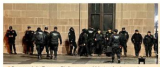
Personal de Fuerza Civil resguardó la tarde de ayer la puerta trasera del Palacio de Gobierno y después se retiró.

La elección del tercero en discordia debería ocurrir en sesión de Congreso del Estado con la votación de todos los partidos.