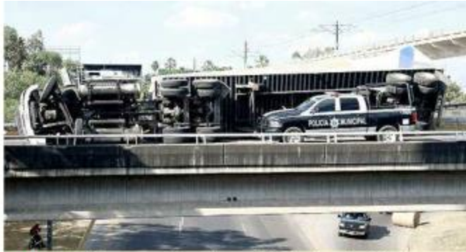
■ En el accidente registrado en el Nodo Revolución, los rollos cayeron hacia la Carretera libre a Zapotlanejo.