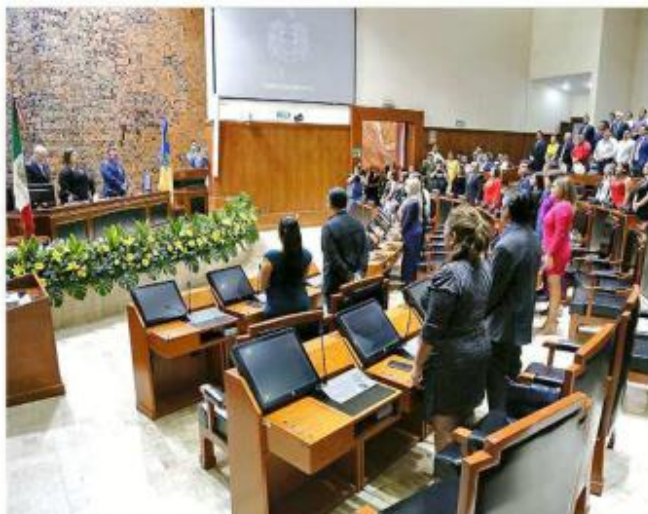
■ Diputados locales avalaron el incremento al predial.