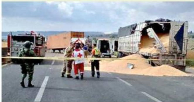
■ El tercer percance se dio en la Autopista GDL-Zapotlanejo; tres vehículos chocaron y una persona resultó herida.