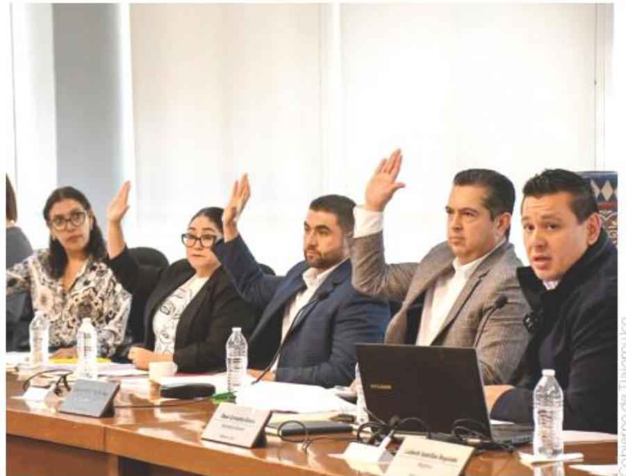
Se realizó una sesión de cabildo para realizar los movimientos de manera oficial.