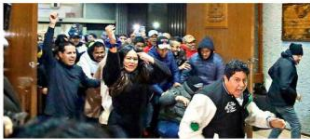
Emecistas dieron "portazo" el miércoles en el Congreso.

que si contempla acudir a Palacio y, aunque pugnará por consensos, advirtió que removerá del cargo a los funcionarios que entorpezcan la actividad del Gobierno. En contraparte, García afirmó que Navarro quedará como encargado del despacho por su licencia de seis meses, pero sin mencionar que esta figura sólo aplica por 30 días.