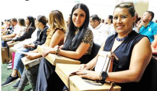
En Puerto Vallarta se entregaron 948 equipos de cómputo.

Ahí recordó que estas computadoras son un logro en conjunto de las secciones 16 y 47 del Sindicato Nacional de Trabajadores de la Educación (SNTE), y que ayudarán a mejorar tanto la calidad de la enseñanza pública, como en la profesionalización y adquisición de habilidades de los docentes: