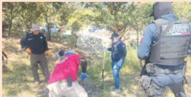
MES PASADO. El sitio de inhumación clandestina se comenzó a procesar el 8 de noviembre.

Adicionalmente, la agrupación mantiene gestiones ante la Comisión de Búsqueda de Personas del Estado de