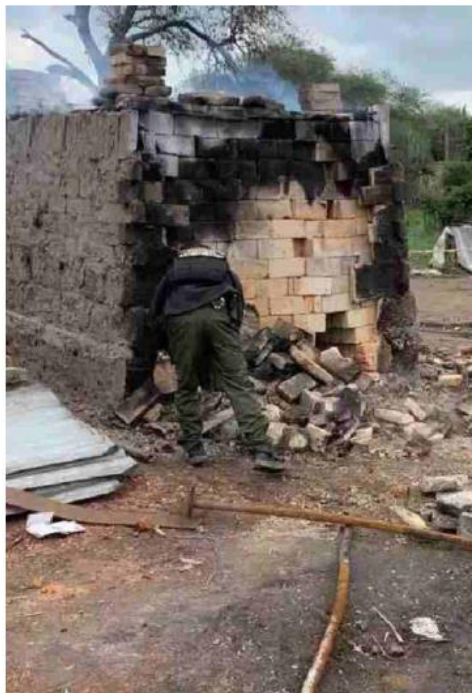
Autoridades investigan inmuebles. ESPECIAL