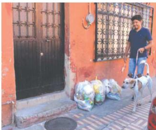
MEJOR FUERA. A las afueras de varias casas de la colonia hay montones de basura a la espera de ser recogidos.

Durante el recorrido de este medio se observaron montones de basura en diferentes esquinas, así como a las afueras de algunas casas. Al respecto, vecinos reconocieron que no están dispuestos a almacenar desechos al interior de sus viviendas