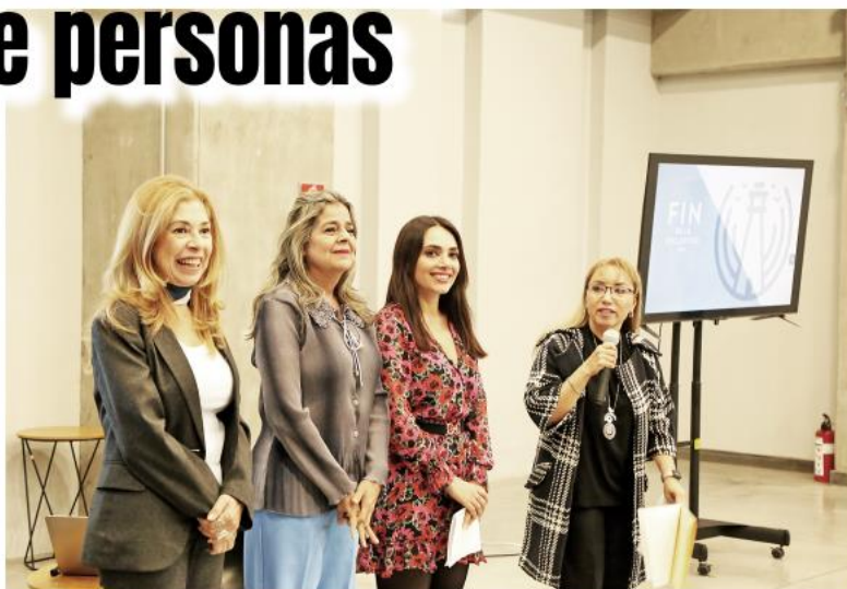
A la fecha suman cerca de 500 personas capacitadas en este rubro.

"Es necesario que trabajemos más y nos involucremos en esta lucha desde la trinchera