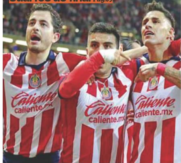
Rumbo a semifinales. El rebaño sagrado hizo valer su localía en el estadio Akron, ganando 1-0 a los de la UNAM.