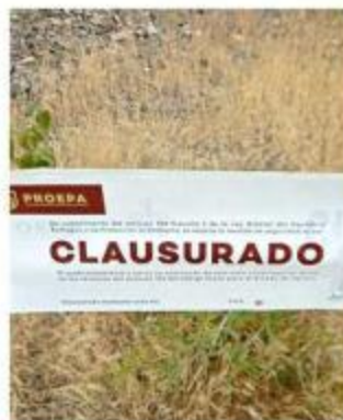
El banco de materiales está en Lagos de Moreno.

“Ante la ausencia de la documentación oficial requerida y el no aplicar las medidas correctivas, se considera una violación a la legislación ambiental vigente”, detalló la dependencia estatal con respecto a la sanción.