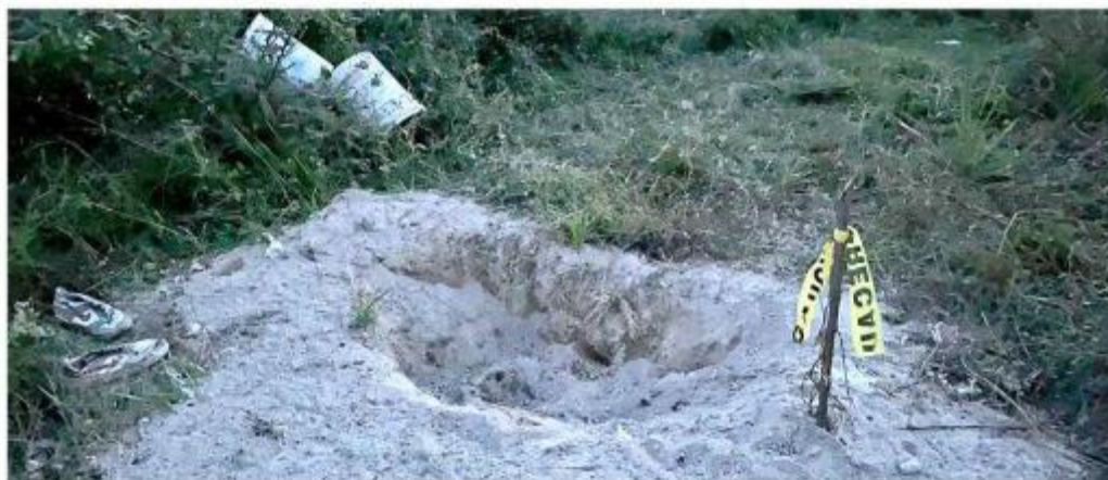
Las autoridades y Luz de Esperanza continúan buscando en las fosas.