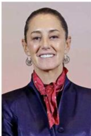
■ Claudia Sheinbaum