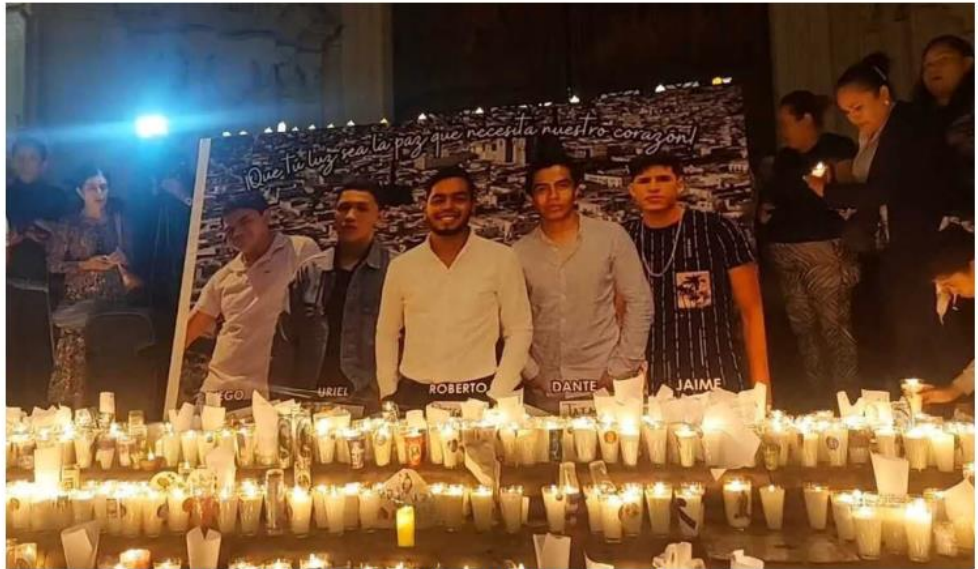
Habitantes del municipio se han manifestado para exigir el regreso de los amigos.

Los jóvenes fueron vistos por última vez el 11 de agosto, cuando se reunieron para ir a la Feria del municipio de Lagos de Moreno. Tres días después el caso dio un vuelco cuando se viralizó