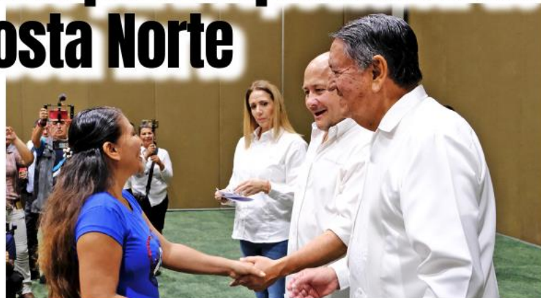
Tomatlán fue el municipio donde se dieron mayores apoyos.

Alfaro afirmó que a diferencia de gobiernos anteriores en los que tardaban hasta tres años en apoyar a afectados por fenómenos naturales, en esta administración la entrega de los recursos para