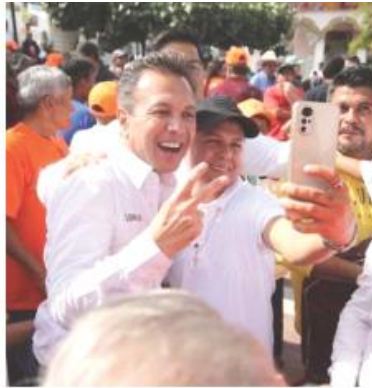
Pablo Lemus resaltó la importancia del turismo.