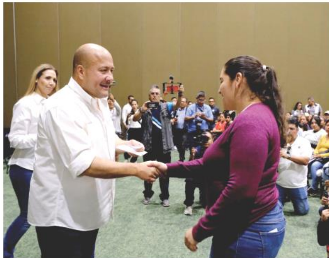
Puerto Vallarta, Cabo Corrientes y Tomatlán fueron los municipios beneficiados.

A mes y medio del huracán, 4 mil 213 familias reciben apoyos para adquirir un total de 20 mil 309 artículos dañados durante el fenómeno