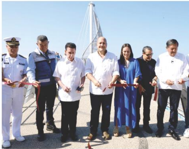
El Gobernador dijo que se dotará el lugar de la infraestructura Red Jalisco.