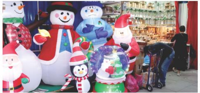
Este tianguis navideño cuenta con 500 comerciantes.

Este año se habilitarán un total de 25 tianguis navideños en distintos puntos del municipio. La instalación de estos espacios comerciales inició, de manera paulatina, el 8 de noviembre; el 24 de diciembre será su último día de operación.