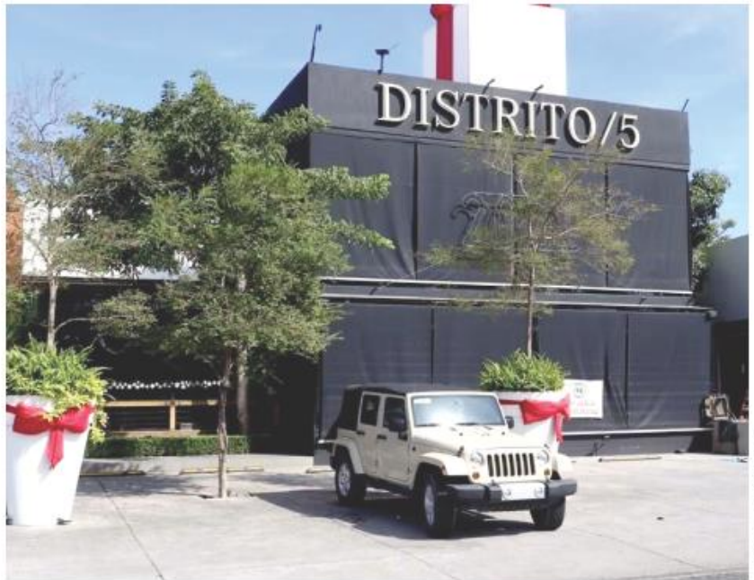
Aristóteles Sandoval Díaz fue asesinado en la madrugada del 18 de diciembre de 2020.