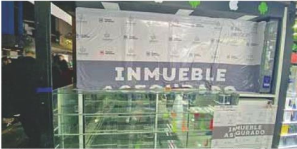
Atención. Las autoridades retiraron aparatos y accesorios que se encontraba en el sitio.

La Fiscalía del Estado (FE) aseguró 400 objetos al parecer de procedencia ilícita, en un cateo judicial llevado a cabo por efectivos del área de Robos Varios, en la Plaza de la Tecnología de la zona centro de Guadalajara, como resultado de investigaciones que se llevan a cabo en atención a una denuncia.