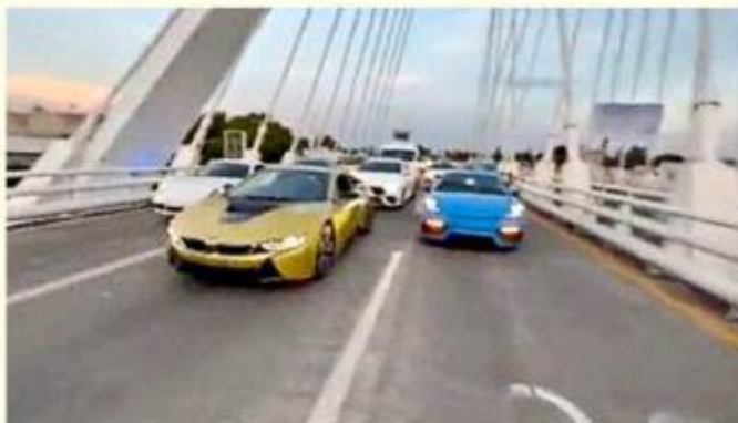
Trasmada via jalisco

Con los cambios legales avalados por el Congreso, se estableció sancionar con hasta seis años de cárcel, multa máxima de 500 Unidades de Medida y Actuali-