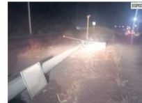
CONGRESO. Apuestan a invertir para restablecer los equipos dañados y para adquirir más.

Hoy día, un sistema de videovigilancia es fundamental para contribuir a la estrategia de seguridad de cualquier municipio o Entidad. Sin embargo, para que pueda operar de manera efectiva, es necesario que los gobiernos inviertan los recursos necesarios, no sólo para la instalación del sistema, sino también para impulsar la mejor tecnología y contratar el personal suficiente que monitoree y actúe ante algún hecho de inseguridad.