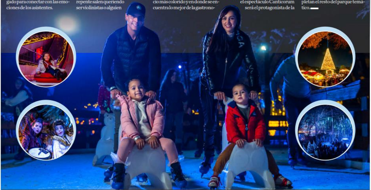
El Parque Temático cuenta con más de 35 atracciones en cuatro espacios diferentes.

Arcos del Lago, un nacimiento gigante, música en vivo en su espectáculo, cabañas, luces y un majestuoso árbol de Navidad artesanal de 16 metros de altura, construido con más de 15 mil fajas de madera reciclada, completan el resto del parque temático. —