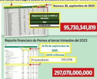
Reporte mensual sobre pagos y adeudos con proveedores y contratistas de Petróleos Mexicanos

La Asociación Mexicana de Empresas de Hidrocarburos (Amehi) advirtió en una carta enviada a los titulares de Energía y Hacienda, copia tiene Reuters, que la situación de impago a proveedores es "crítica" para la industria petrolera. Ninguna de las tres, ni Pemex, respondió a solicitud de comentarios. El llamado de Amehi se sumó al de la Asociación Mexicana de Empresas de Servicios Petroleros (Amespac), entre cuyos miembros están SLB, antes Schlumberger;