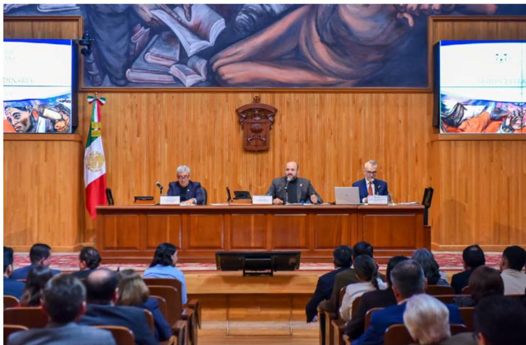
El presupuesto fue aprobado por el Consejo General Universitario de la UdeG.

El Festival Papirolas tendrá una aportación de un millón de pesos y