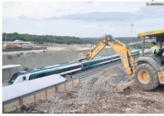
A MARCHAS FORZADAS. Mientras se llevaba a cabo el recorrido del Tren Maya en el tramo inaugurado, los trabajadores continuaban con las obras.

Pese a que en un inicio se afirmó que los trabajos costarían 120 mil millones de pesos (MDP), ya van en más de 480 mil MDP.