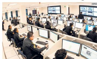
CONTROL. Observan más de 64 mil cámaras.

Uno de los casos más recientes fue el registrado la madrugada