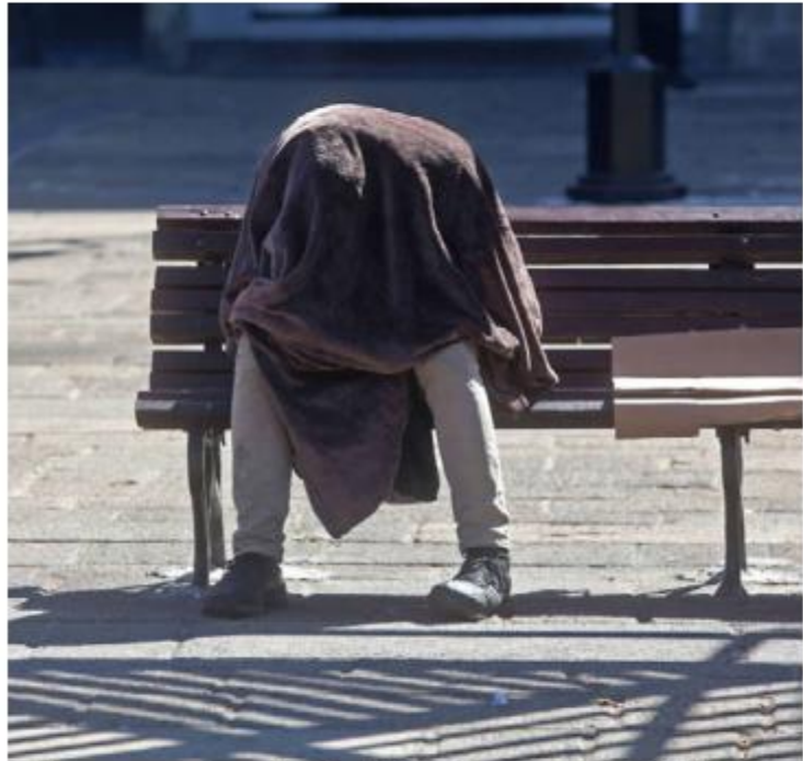
Estiman que en la capital de Jalisco hay al menos mil 700 personas en situación de calle. FERNANDO CARRANZA

La diputada local admitió que desconoce cuál es la población aproximada de personas en situación de calle en el municipio de Guadalajara, pero aseguró que en los últimos días han muerto cuatro personas en esta condición, en la zona de Mercado Alcalde, Parque Rojo y La Ja-