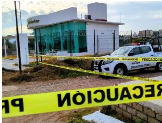
La sucursal se ubica en fraccionamiento La Milagrosa.