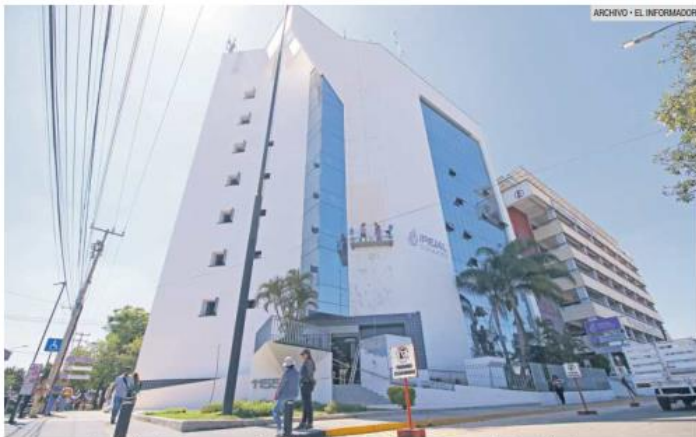
IPEJAL. Desde noviembre de 2022 el ex funcionario permanece bajo resguardo domiciliario.