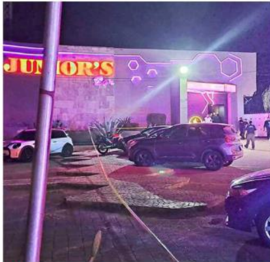
El ataque ocurrió en un negocio situado en la Avenida López Mateos Sur, a la altura de la Colonia Santa Anita.