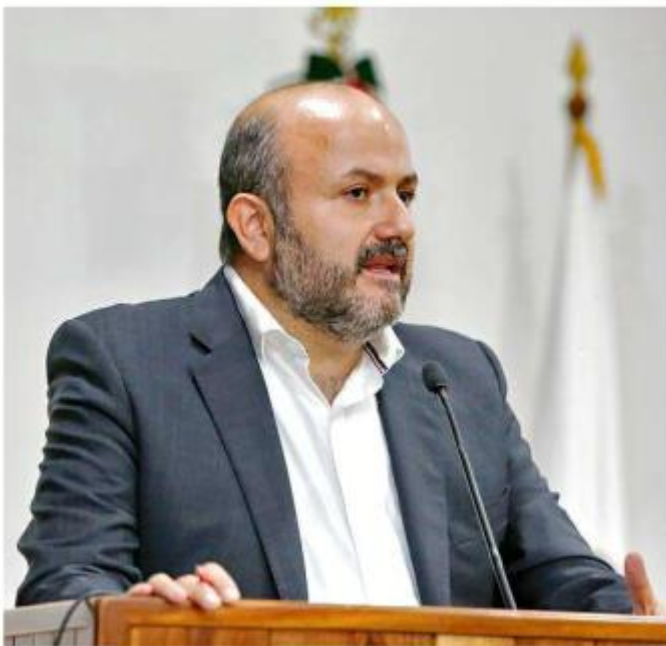
■ Villanueva señaló que falta crecer la plantilla docente.

“Si se logra el presupuesto constitucional sería un gran precedente el que vamos a dejar”, afirmó Villanueva.