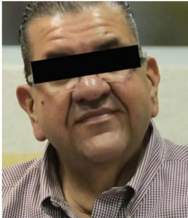
Fue acusado de dos delitos el ex director del Ipejal.