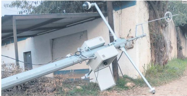
DESTROZOS. En Jalisco han vandalizado cámaras y postes del C5.

Los equipos tienen fallas eléctricas, daño en la fibra óptica o fueron siniestrados