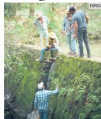
RIESGO. La agroindustria deja sin agua a los habitantes del lugar.

Las otras seis empresas son Aguacates Triple R, IMIDE Construcciones, El Limón, Campos Gaia, Agronegocios Dasla y Avo Amecatil.