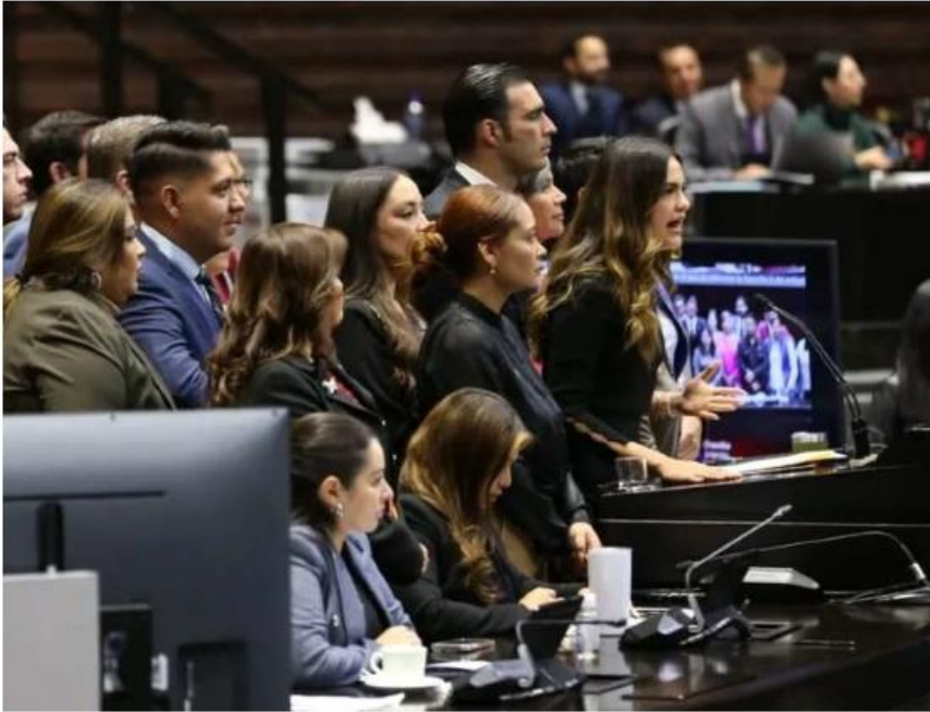
La edad mínima pasó de 21 a 18 años. ESPECIAL