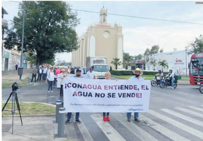
EN PIE DE LUCHA. Habitantes de la Sierra de Quila han acudido a la Conagua para que los ayude.

Los pobladores creen que hay permisos irregulares a empresas agrícolas en esa región