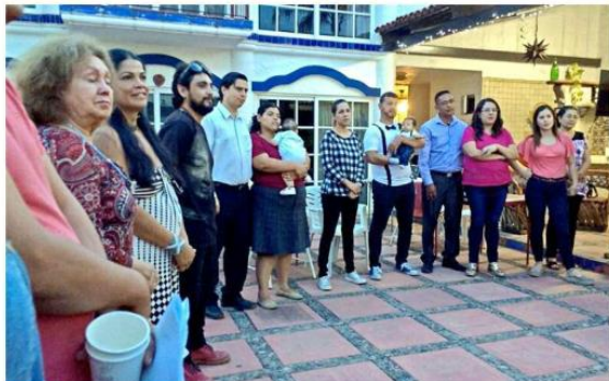
El grupo ayuda a las madres a identificar el dolor y vivir su duelo.

“Socialmente era una estadística, entonces empiezo a formarme profesionalmente en esta área y cuando empiezo a hablar del tema, un montón de personas ‘oye, yo también lo viví, a mí también me pasó’ y te das cuenta de que fue un duelo que muchas vivimos en soledad y silencio