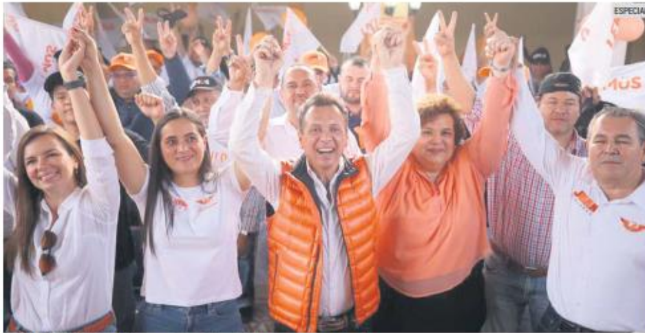
CONSTANTE. Pablo Lemus (centro) visitó Tamazula de Gordiano.