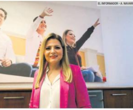
CLAUDIA DELGADILLO. Aspirante a la gubernatura de Jalisco por parte de Morena y aliados.

"He trabajado con todas las bases de todos los partidos. Aquí hay unidad, todos cabemos. Y este trabajo que se hará en los municipios, con los candidatos o candidatas, también sumará para que en Jalisco llegue la Cuarta Transformación".