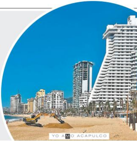
YO A MI ACAPULCO