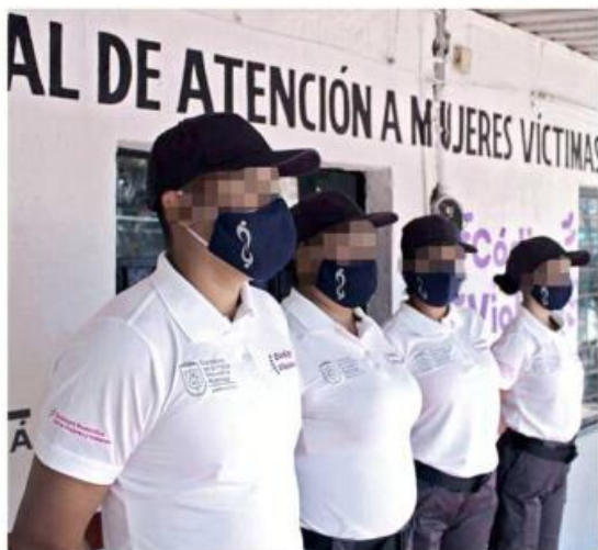
La Unidad Especializada de Atención a Mujeres Víctimas de Violencia fue inaugurada en 2021.

El Ayuntamiento de Tonalá indicó que se recibió una queja anónima