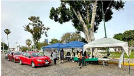
■ El módulo se ubica en la Plaza Brasil, entre el Estadio Jalisco y la Plaza de Toros Nuevo Progreso.