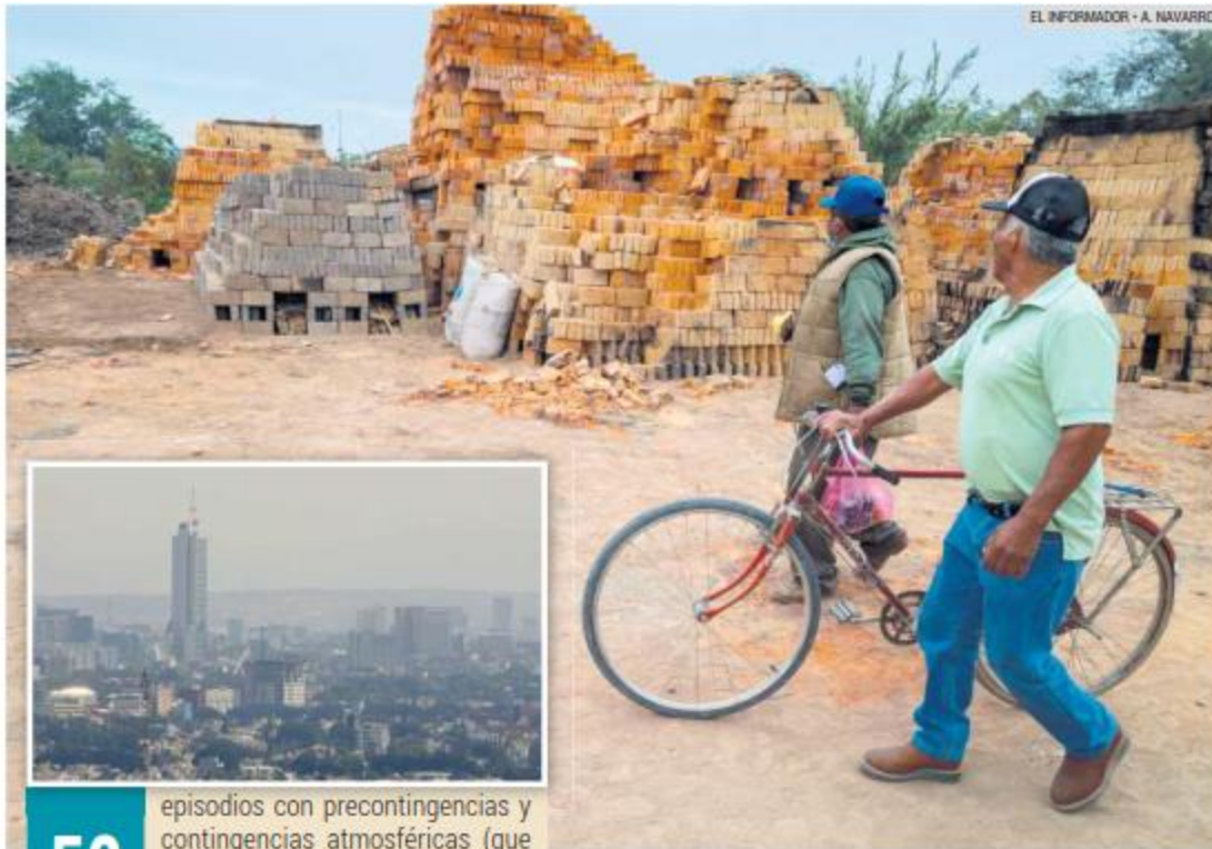
EL INFORMADOR • A. NAVARRO