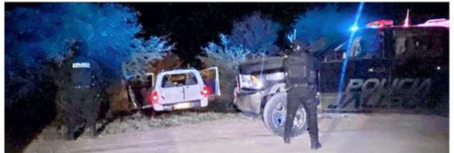
Policias estatales descubrieron un homicidio en Encarnación de Díaz.

Uno de los hombres, de 28 años, murió en un hospital, mientras que el estado de