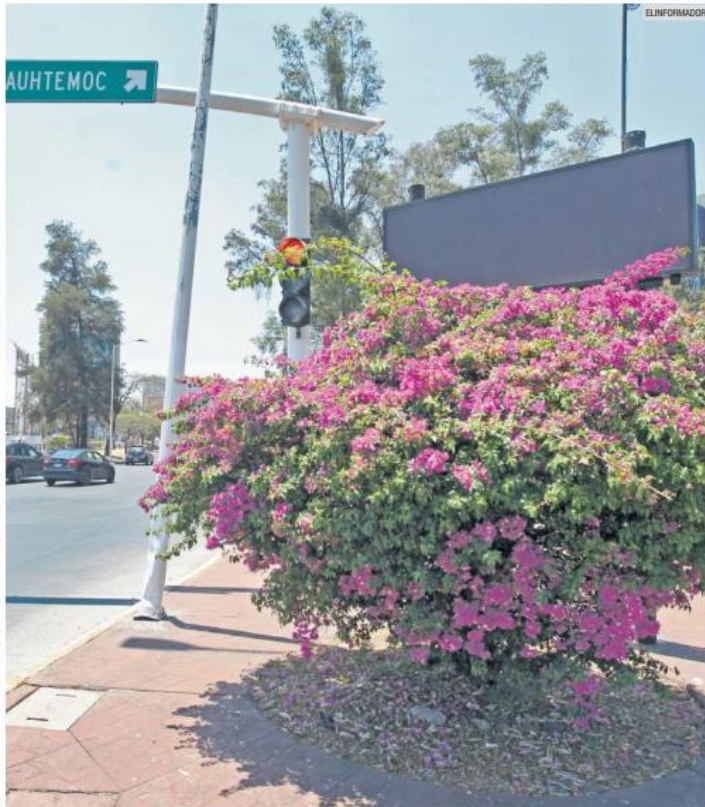
FALLAS. Estación ubicada en el cruce de las avenidas López Mateos y Mariano Otero.

Por eso, una de las acciones proyectadas fue implementar medidas de intervención socioambiental para el control de fuentes de área en la Entidad. "Se reordena y tecnifica la fabricación artesanal de ladrillo y cerámicos: Reconfigurar al sector de producción de ladrillo artesanal y cerámicos, proponiendo opciones tecnológicas más sustentables, con enfoque en la reducción de emisiones y vulnerabilidades socioam-