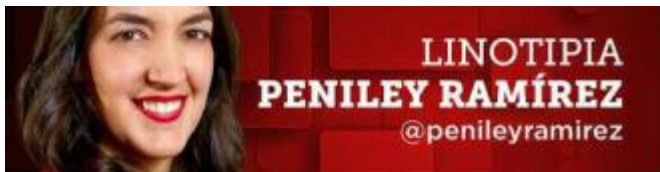
LINOTIPIA PENILEY RAMÍREZ @penileyramirez

En el AICM hay un boquete por donde todos los días entran kilos y kilos de droga, entre ellos, los precursores de fentanilo para el Cártel de Sinaloa.