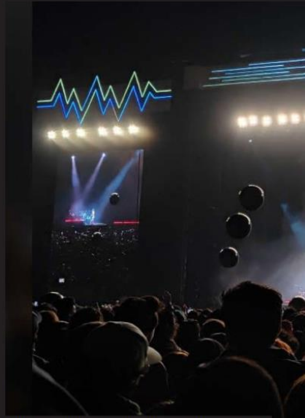
Miles de espectadores disfrutaron de los múltiples conciertos que hubo durante 2023.

En este sentido destaca también la labor de UETC-Training Center de Arden Colectivo AC, único en centro de América Latina respaldado por Epic Games, para capacitar a interesados en el programa Un Real Engine, que brindó mil 414 capacitaciones presenciales a interesados de diversos países de América Latina.