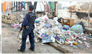
En la Colonia Progreso, policías vigilan que se tire la basura en el horario permitido, de las 9:00 a las 17:00 horas.