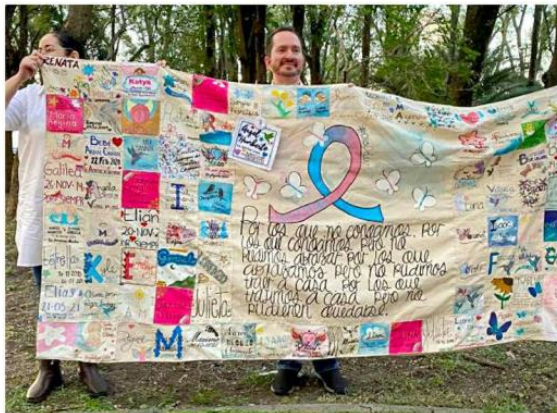
Mediante diversas actividades se apoyan para superar la pérdida.