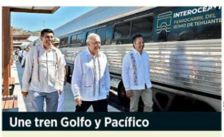
Una tren Golfo y Pacífico