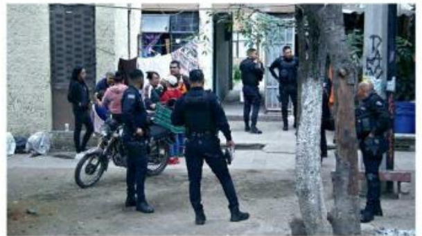
En la Colonia Miravalle fue asesinado a balazos un hombre.

La Comisaría de Tlajomulco informó, por su par-