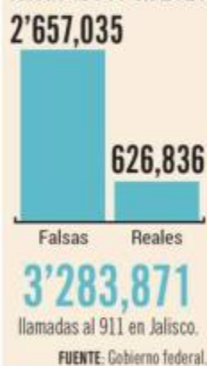
Dominan llamadas falsas al 911 en 2023

En su sitio de internet, la administración de Andrés Manuel López Obrador (AMLO) recuerda el caso de Sergio, un bebé que se estaba ahogando y su madre, al no saber qué hacer, llamó al número telefónico mencionado. Una vez que se consiguió el enlace, personal capacitado le explicó paso a paso las maniobras a realizar y pudo salvarle la vida.