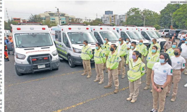
RECURSOS PÚBLICOS. El personal de emergencias está siempre listo para atender los llamados de la población.