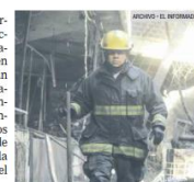
BOMBEROS. Arregnan su vida por la seguridad de la ciudadanía.

Por último, el oficial hizo un llamado a la ciudadanía a permanecer alerta en su camino, sobre todo a las personas automovilistas, pues ceder el paso a las unidades de emergencia es clave para que puedan llegar a tiempo. El no estar atentos e intentar ganarles el paso, ade-