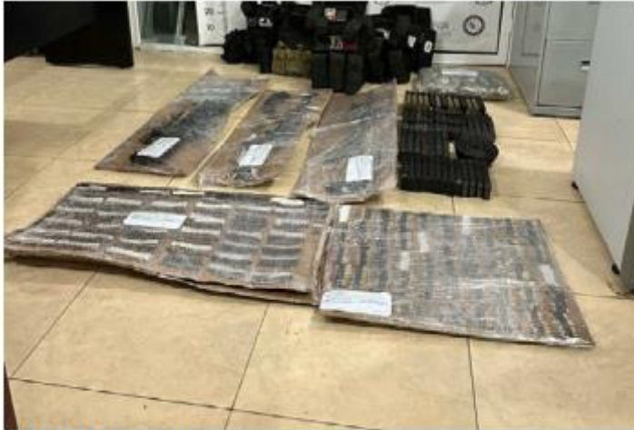
SEGURIDAD. Elementos de la de la Secretaría de la Defensa Nacional aseguraron armas largas, cartuchos, chalecos balísticos y dos vehículos en el poblado de Casa Blanca, en Poncitlán.