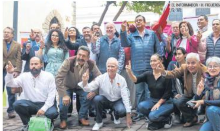
EQUIPO. Preparan la estrategia rumbo a las elecciones de 2024.

Ayer fue presentado el Comité Ciudadano X Xóchitl (CCXX) Jalisco, mediante el cual se busca promover el voto a favor de Xóchitl Gálvez, la candidata de Fuerza y Corazón por México a la Presidencia del país.