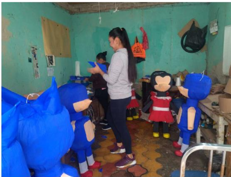
Comerciantes de la zona de Obregón señalan que han tenido buenas ventas. DALIA ROJAS