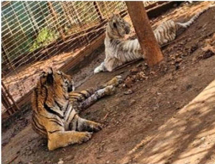
HALLAZGO. Dos tigres y cinco jaguares fueron asegurados en un cateo realizado por la Secretaría de la Defensa Nacional. Los animales se localizaban en un terreno ubicado en Jamay.