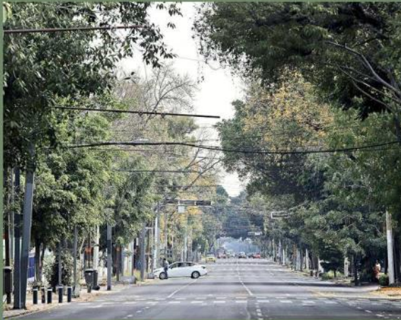
Las calles, como Av. Vallarta, estaban prácticamente vacías.