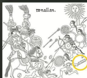
3 En la reconstrucción histórica digital de “El Lienzo de Tlaxcala” se documenta a un guerrero con esta arma.

de dos manos, entonces tenemos la imagen del Lienzo de Tlaxcala y tenemos gente que estuvo en la en la batalla que menciona que había armas de dos tamaños, por eso en la réplica hicimos los dos formatos”. Durante sus indagaciones descubrieron que el pomo redondo