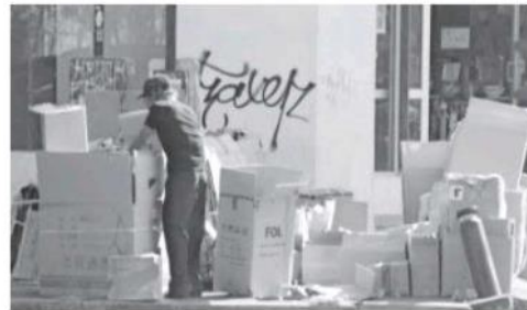
Habitantes exigen que la empresa Caabsa cumpla.