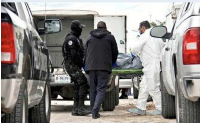
■ Uno de los crímenes fue en la Colonia Francisco I. Madero.

Los informes médicos señalaron que la víctima presentaba impactos de bala en el tórax, el abdomen y la pierna derecha.