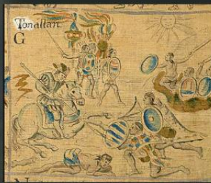
2 Lámina 55 de “El Lienzo de Tlaxcala”, donde se muestra el arma que es objeto de investigación.

Un diseño único y más efectivo del macuahuitl sería la clave para profundizar en las guerras prehispánicas de Occidente