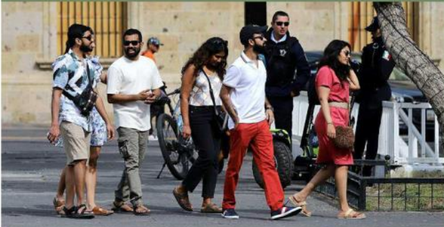
Los turistas disfrutaron el Centro a sus anchas.

La mañana de Navidad en la Ciudad se vivió en paz, con personas visitando el Centro, así como con imágenes no tan agradables.