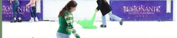
En la pista de hielo ubicada en Paseo Alcalde hubo muchas risas.