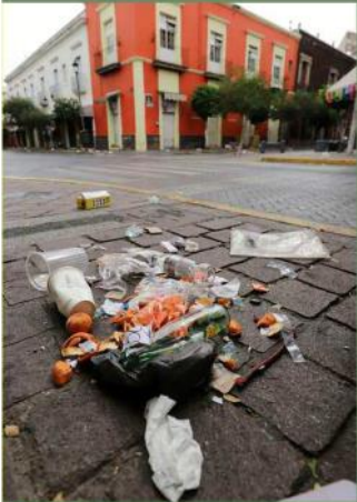
La basura en la calle tampoco faltó.