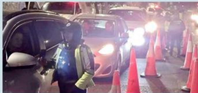
■ Se hicieron 2,258 pruebas en el Operativo Salvando Vidas.

La Policía Vial hizo un llamado a la ciudadanía a abstenerse de conducir luego de haber ingerido alcohol, pues