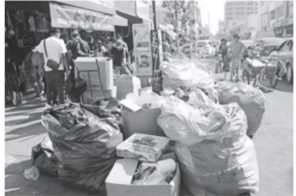
El acúmulo conlleva diversas problemáticas.