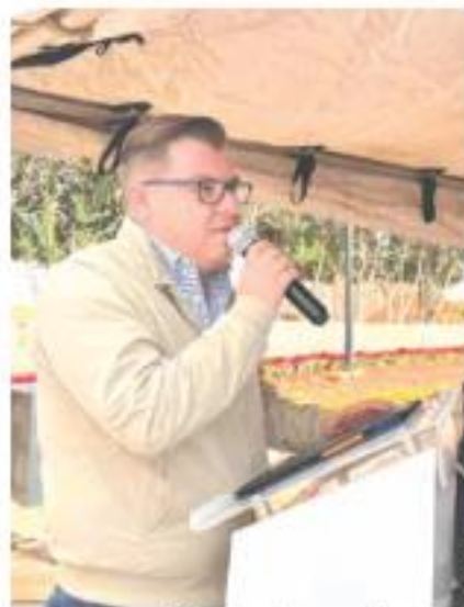
PROMESA. El funcionario prevé un 2024 sin desabasto de medicamentos en centros de salud.

“Sabemos que hay localidades muy difíciles como Colotlán, como Cihuatlán, en diferentes regiones sanitarias donde por más que tenemos el dinero, el recurso, los contratos, no contamos con especialistas que se quieran ir a lugares tan alejados”, detalló sobre la falta de personal.