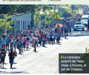
La caravana avanzó de Tapachula a Huixtla, al sur de Chiapas.

Durante su mensaje de Navidad desde El Vaticano, el Papa Francisco pidió a políticos de América hacer frente al problema de la migración. El Pontífice argentino se dijo esperanzado de que el mensaje navideño de paz los inspire a resolver conflictos sociales, así como a combatir la pobreza. "Que el hijo de Dios inspire a las autoridades políticas y a todas las personas de buena voluntad del continente americano para hallar soluciones idóneas que lleven a superar las disensiones sociales y políticas", pidió el Papa Francisco.