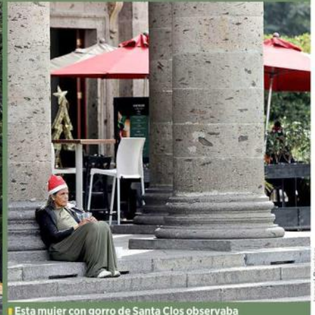
Esta mujer con gorro de Santa Ctos observaba la Plaza Liberación.