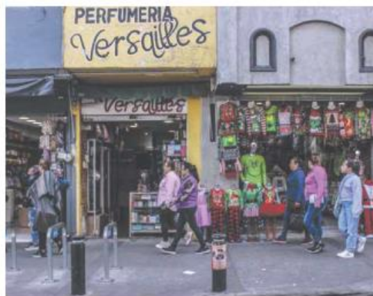
SEÑALA VENDEDORA. Uno de los factores de las bajas ventas sería la economía de las personas.