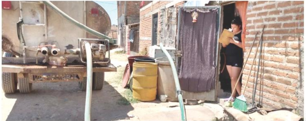
El Siapa comunicó que se llevan a cabo trabajos de instalación de dos válvulas.

Ciudadanos afectados por corte de agua debido a las obras del Siapa contarán con el servicio de manera gratuita