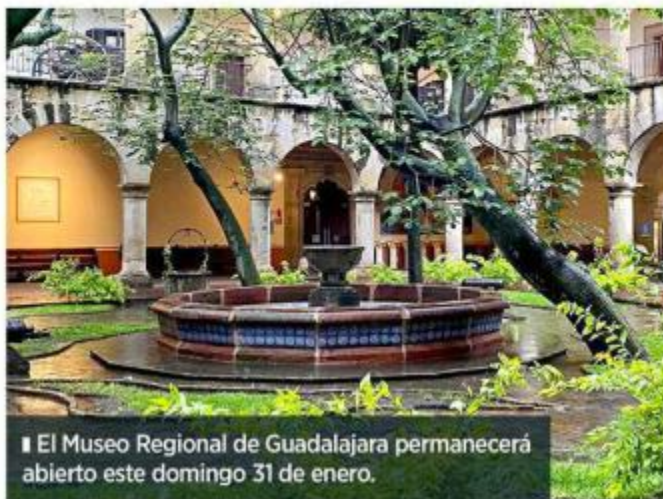
El Museo Regional de Guadalajara permanecerá abierto este domingo 31 de enero.

Esta zona arqueológica, ubicada a 90 minutos de Guadalajara, fue una de las 12 más visitadas del País, por debajo de Chichén Itzá, en Yucatán, la más popular a nivel nacional, que recibió este