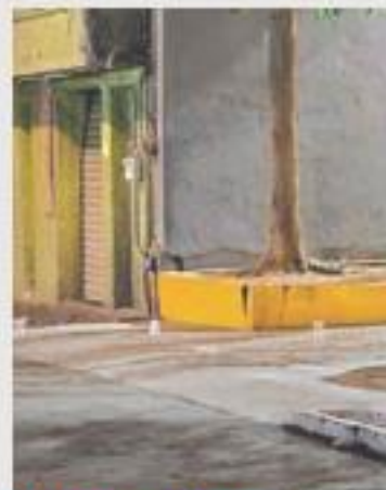
EN LA ZONA CENTRO. Una de las agresiones fue doble y ocurrió en Tlaquepaque.

Las agresiones registradas entre la noche del miércoles y la tarde de ayer no arrojaron personas detenidas