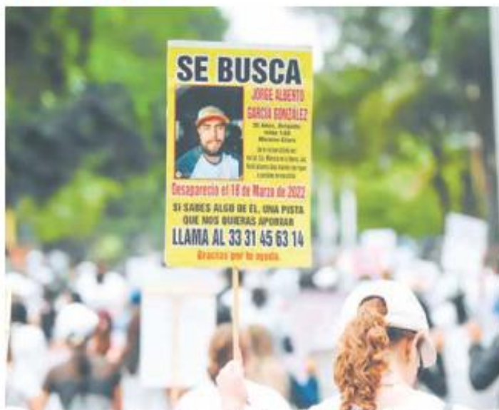
PROBLEMA. El sólo reportar los casos de desaparición al Sisovid genera un margen de discrecionalidad muy alto, según Ramírez Plascencia.

De enero de 2022 al 30 de noviembre de 2023 se contabilizaron los casos de 3 mil 667 personas desaparecidas en la entidad que siguen sin ser localizadas, pero al registro federal sólo se le informó de 681