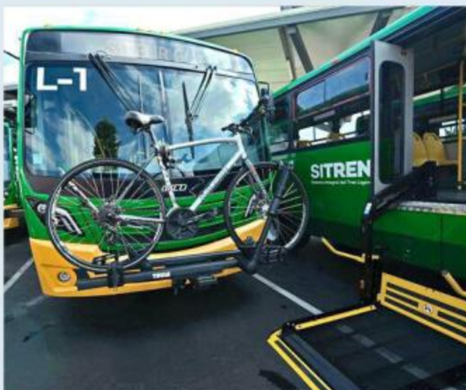
■ Enrique Alfaro compartió las unidades en redes sociales.