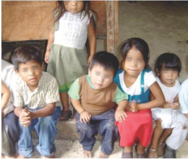
La SSAS informó que esta política pública se aplica a través de tres ejes.

Durante el año el Estado de Jalisco ha destinado casi 50 millones de pesos para atender diversas necesidades de la población en situación vulnerable