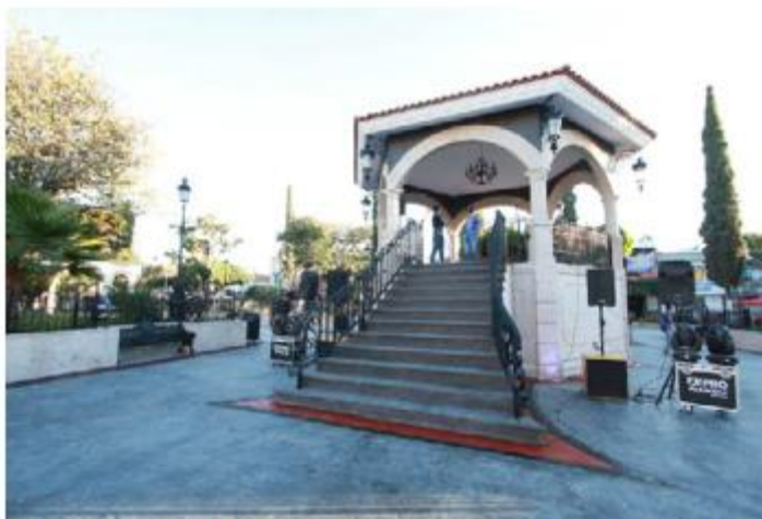
TLAJOMULCO. Con una inversión de 2.23 millones de pesos se demolió y construyó un quiosco en la plaza de Cajititlán. La estructura del original resultó afectada por un sismo en 2022.