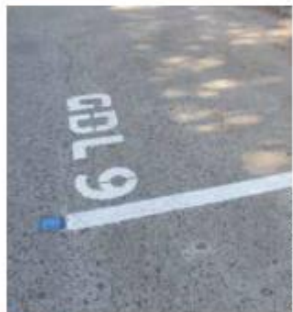
NUEVA. Los nuevos parquímetros conforman la zona GDL9 Providencia.

“La activación de la zona se tenía prevista para el 22 de enero de 2024; sin embargo, con la finalidad de reforzar la socialización y aclarar las dudas que puedan tener vecinos de la colonia, se aplazará el arranque de operaciones”