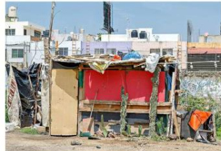
Viviendas en el borde de canales forman parte de los asentamientos irregulares.

Expertos dijeron al medio que detrás de la elaboración de estas pastillas estarían los cárteles de la droga, que sofisticaron su producción de pastillas falsas.