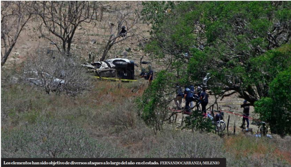
Los elementos han sido objetivo de diversos ataques a lo largo del año en el estado.