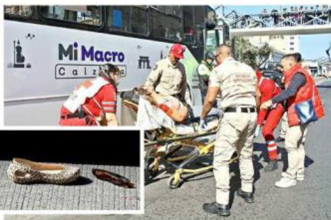
El accidente ocurrió en el Centro de la Ciudad.

En los números de emergencias recibieron reportes que alertaban acerca de una persona atropellada y lesionada, por lo que paramédicos de la Cruz Roja del Par-