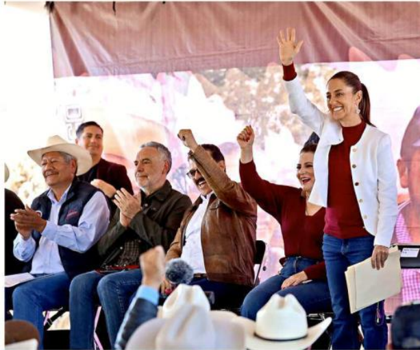
Productores apoyaron a Claudia Sheinbaum en su paso por Atotonilco El Alto.