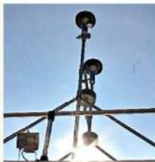
■ La estación de monitoreo Santa Fe no opera desde julio.

Además, se trata de datos incompletos, ya que de 10 estaciones de monitoreo atmosférico solo funcionan siete y entre las descompuestas figura Santa Fe, que suele padecer altas concentraciones de partículas en época invernal.