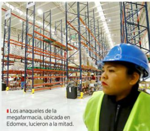
Los anaquelos de la megafarmacia, ubicada en Edomex, lucieron a la mitad.

Ayer fue abierta en Huehuetoca, Estado de México, la megafarmacia bajo control de Birmex, empresa del Sector Salud administrada por el Ejército. Se trata de una bodega con capacidad de almacenamientos de 286 millones de piezas.