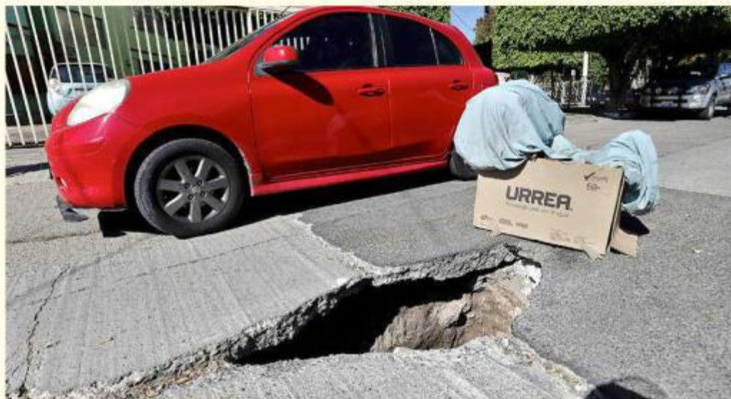
Una caja alerta a los automovilistas sobre la zanja.

“Yo esperaré que le den prioridad y urgencia (...) es un área vecinal muy concurrida y está peligrosa