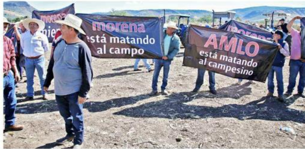
Manifestantes acusaron que la 4T no ha cumplido con apoyos al campo.

zantes con la 4T e invitados en el presidium se levantaron del asiento y trataron de contrarrestar la protesta con el coro: “Presidenta, Presidenta”.