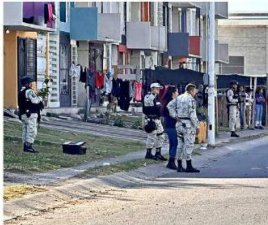
Un joven fue asesinado a balazos en Los Cántaros.

Por otro lado, en Tlajomulco ocurrió otro asesinato a tiros a las 21:30 horas del jueves. La víctima fue un hombre, cuyo cadáver quedó en la Calle Villa Fabrisa, cer-