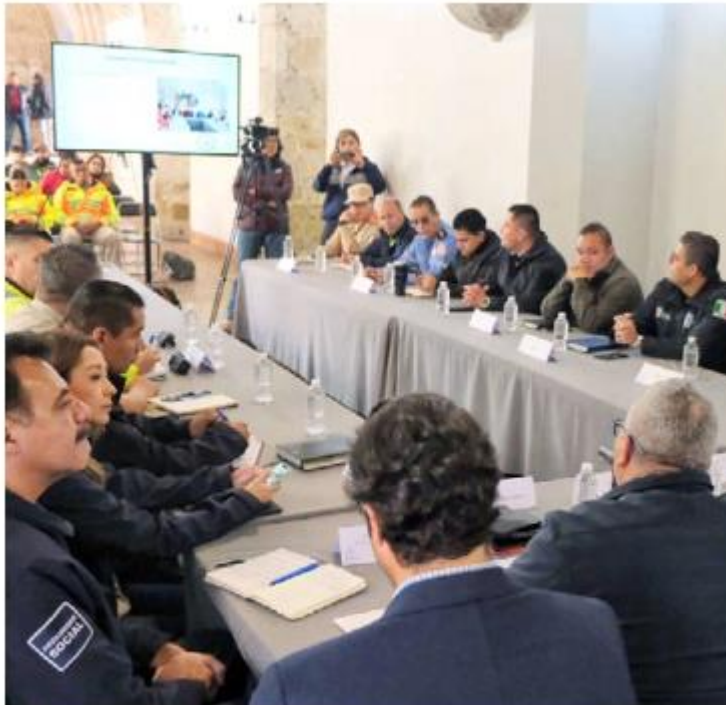
Autoridades de los tres niveles de gobierno acordaron acciones para evitar incidentes este fin de semana. ESPECIAL

Entre los principales acuerdos de esta reunión, se estableció el reforzar el llamado a la población y recorridos de vigilancia para la concientización a evitar el encendido de fogatas así como el uso de pirotecnia, especialmente la noche del 31 de diciembre, esto, principalmente en las colonias dentro del área metropolitana que se tienen detectadas como recurrentes en la mala práctica de estas actividades, en los nueve municipios. ■