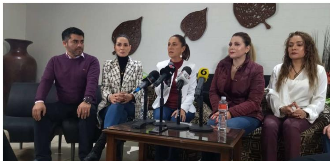
Realizó su última visita del año a Jalisco este viernes; se reunió con aspirantes morenistas a cargos públicos en 2024. DIANA BARAJAS

Posicionamiento. La precandidata única a la Presidencia por Morena asegura que se hizo un proceso de búsqueda; señala falta de coordinación entre autoridades federales y estatales en seguridad