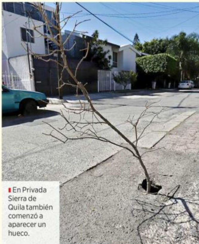
En Privada Sierra de Quila también comenzó a aparecer un hueco.

MURAL había publicado el pasado 27 de diciembre que en Las Águilas, colonia contigua a La Calma, dos trabajadores que precisamente se encontraban reparando una zanja en la zona, fueron rescatados luego de que ésta colapsara.