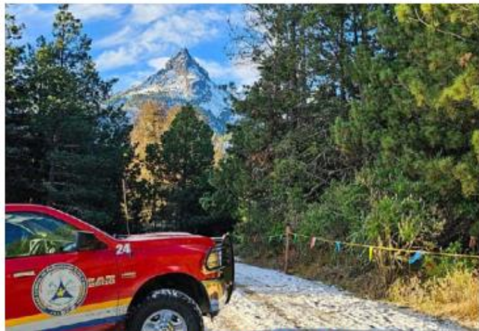
PARQUE. El ingreso al Nevado de Colima está limitado a 200 vehículos por día. No se permite el ingreso a RZR o cuatrimotos.