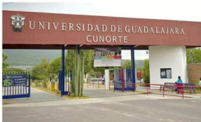
Una de las observaciones corresponde a la primera etapa de una obra en el CUNorte de Colotlán.