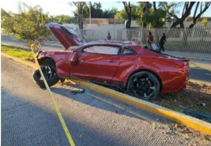
PERCANCE. Un Camaro fue abandonado tras volcar en el camellón de la avenida Belenes, pasando Periférico Norte, en Zapopan.