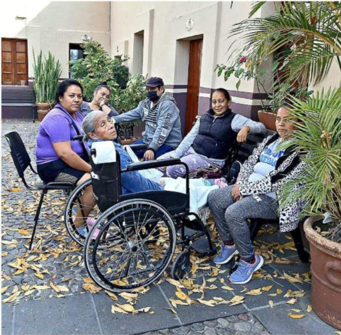
El hogar temporal se extiende a pacientes ambulatorios y cuidadores.

Los primeros pasos de Galilea 2000 se enfocaron en brindar hospedajes gratuitos a las personas enfermas y sus familias, aunque desde 12 años atrás hasta la fecha también se brindan gratuitamente apoyos para medicamentos, insumos como sillas