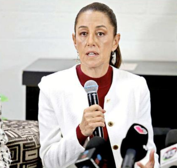
En Tlaquepaque, Sheinbaum reconoció que hubo "jalones de oreja".