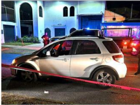
■ Una mujer recibió un impacto de bala durante un altercado vial, en Prados Tepeyac.