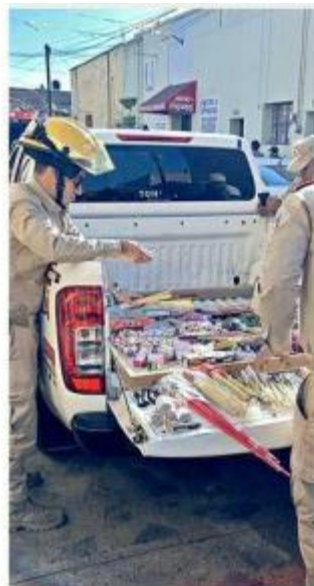
■ En Tonalá decomisaron 10 kilos de pirotecnia.

A nivel federal será la Guardia Nacional la corporación involucrada en este operativo.