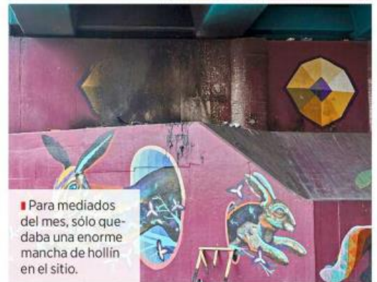
Para mediados del mes, sólo quedaba una enorme mancha de hollín en el sitio.

can el protocolo intermunicipal para la temporada invernal. Las Comisarías, Servicios Médicos Municipales y la Comisión Estatal