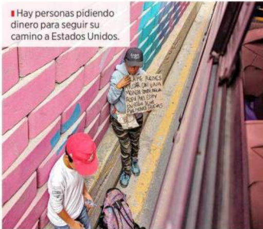
Hay personas pidiendo dinero para seguir su camino a Estados Unidos.

"Hola, me puedes ayudar con una moneda, comida, agua, ropa, pues estoy enferma de mis pulmones. Gracias", se leía en el letrero que una niña sostenía.