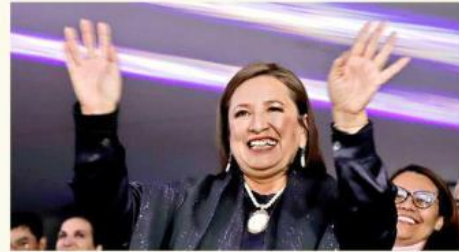
Xóchitl Gálvez estará el miércoles en Guadalajara.