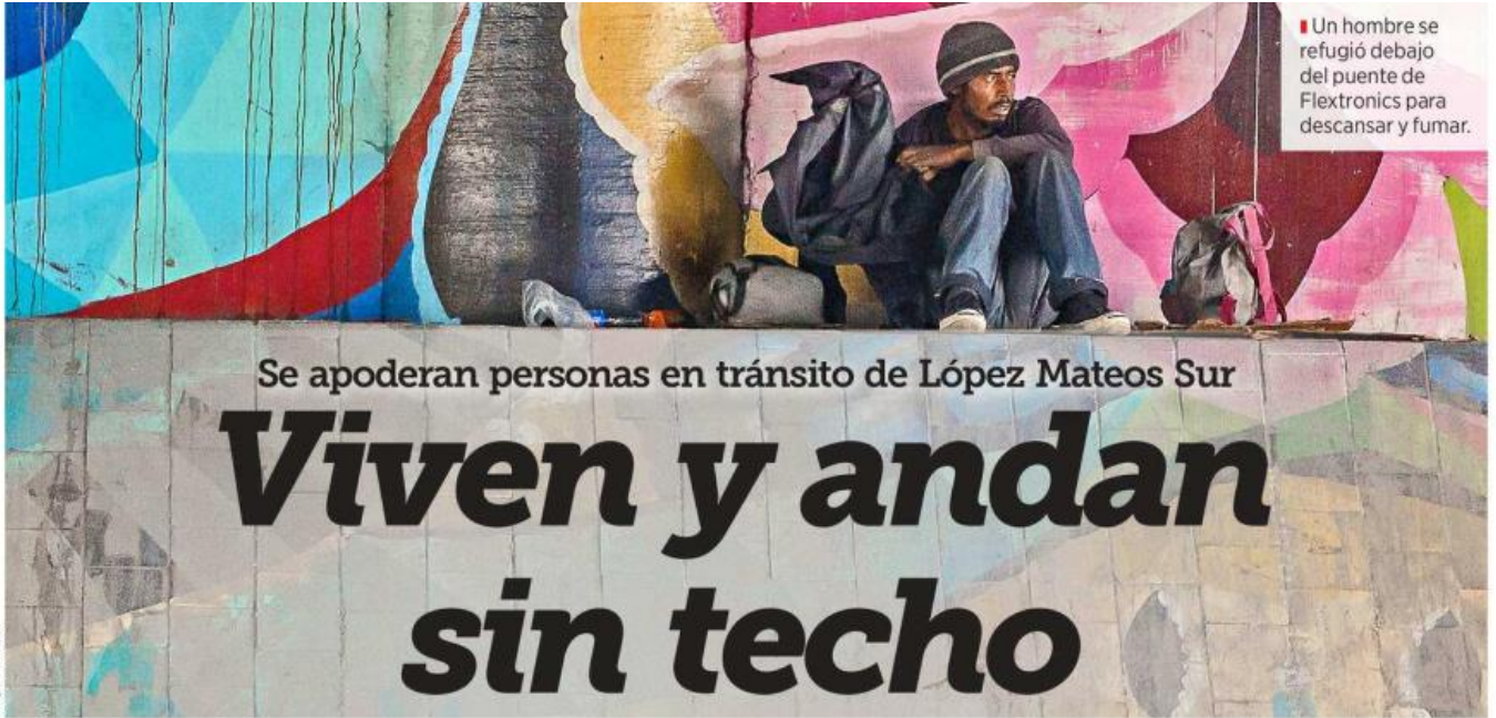
Un hombre se refugió debajo del puente de Flextronics para descansar y fumar.

Se apoderan personas en tránsito de López Mateos Sur