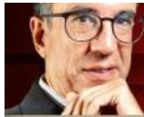
CARLOS ELIZONDO MAYER-SERRA @carloselizondom

El reto de México para el 2024 es elegir a un gobierno que pueda aprovechar mejor un entorno económico positivo.