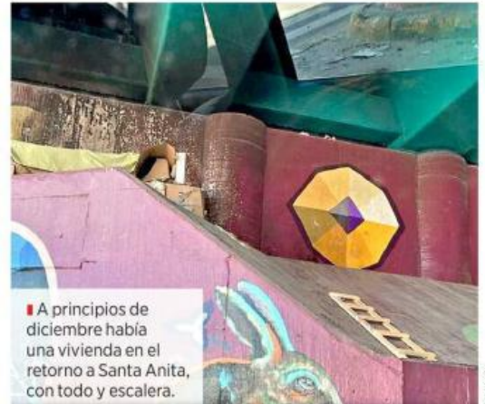
A principios de diciembre había una vivienda en el retorno a Santa Anita, con todo y escalera.