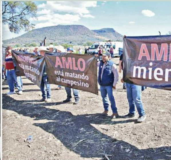
En Atotonilco, productores se manifestaron contra la 4T.