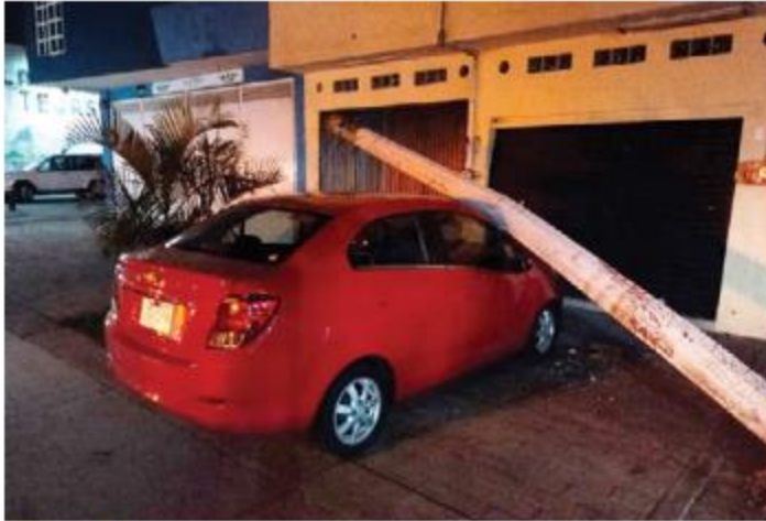
CHOQUE. Siete postes derribados, tres vehículos impactados y una luminaria dañada fue el saldo que dejó el paso de un tráiler en Anillo Periférico Norte, a la altura de Lomas del Paraíso.