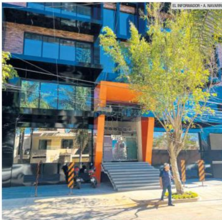
EMPRESA. Se estima que Yox Holding tiene alrededor de 40 mil inversionistas principalmente en Jalisco, Chihuahua, Durango, Nuevo León y Querétaro.

En el audio, el directivo asegura a sus empleados que no se esconde y que sacará adelante a la empresa. "Yo no me desaparezco ni nada por el estilo, sigo dando la cara, es un tema que tengo que resolver, hay muchas cosas que no puedo hablar todavía porque estamos bajo temas que se irán enterando, pero sí vamos a sacar esto adelante", dijo.