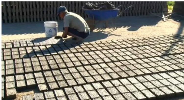
Durante estos días, realizaron producción en espera de poder usar los hornos. DALIAROJAS