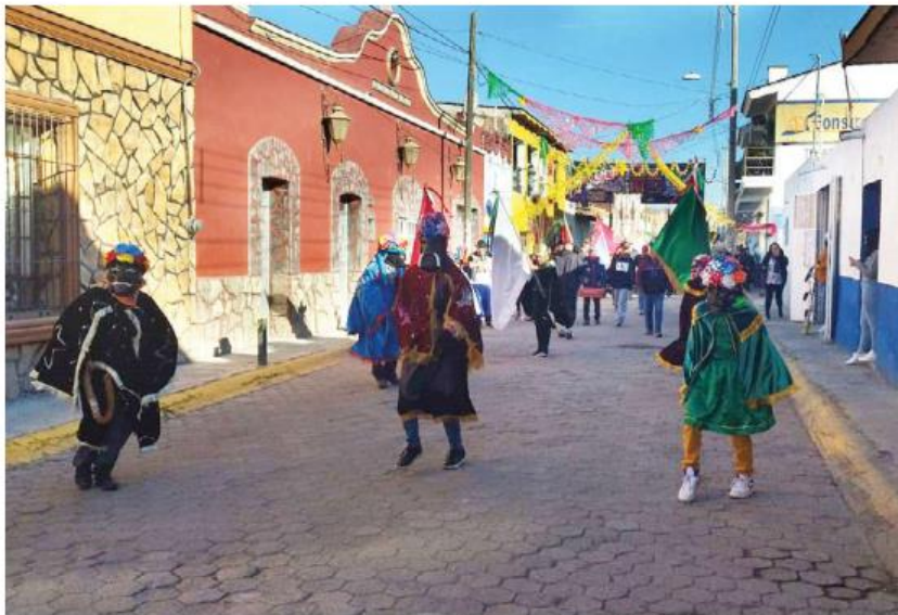
Los grupos de danzantes encabezan la peregrinación hacia el templo. DIANA BARAJAS

A nadie se le niega la comida, no importa si participaron o no en la peregrinación. Este viernes,