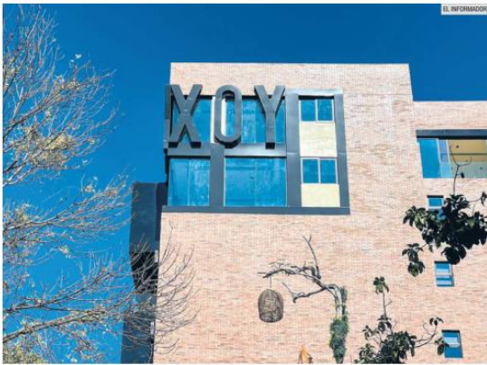
YOX HOLDING. Inversionistas indican que la oficina está cerrada y los ejecutivos no saben qué decir.