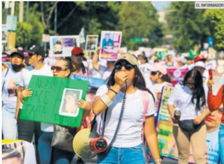
DOLOR. Miles de familias siguen buscando a sus seres queridos y recurren principalmente a las organizaciones civiles.