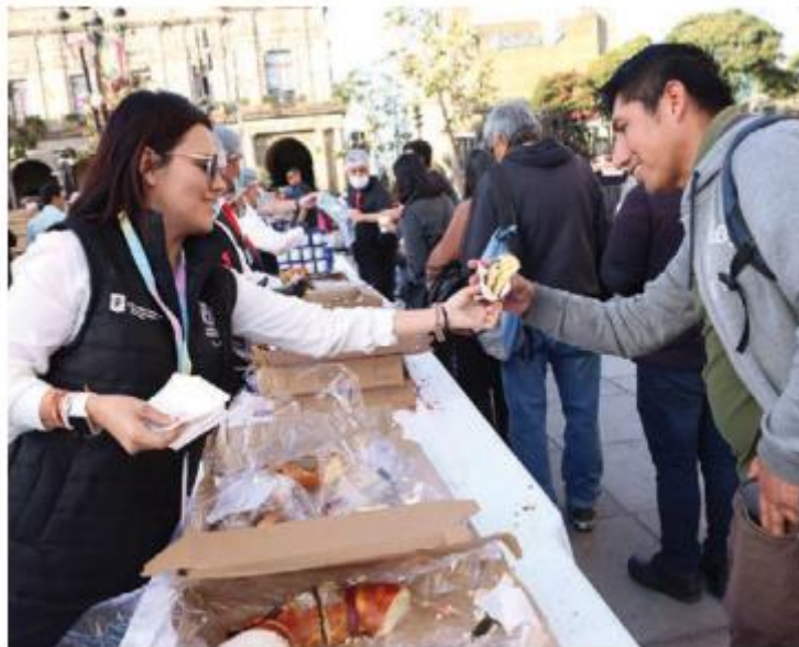
Instalan módulos en plaza y portales del ayuntamiento.