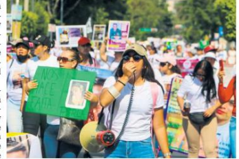
DOLOR. Miles de familias siguen buscando a sus seres queridos y recurren principalmente a las organizaciones civiles.

Tras documentar 122 casos en los que personas desaparecidas han sido borradas del Registro Nacional de Personas Desaparecidas y No Localizadas, madres buscadoras del norte del país promovieron amparos para evitar que sus familiares sean invisibilizados desde las bases de datos del Gobierno federal. Luego de que más de 70 familiares de víctimas no lograran rastrear a sus familiares en el sistema, Delia Quiroa, activista y fundadora del Colectivo 10 de Marzo, promovió esta iniciativa para la cual diseñó un formato de amparos individuales con los que cualquier persona pueda solicitar un juicio contra el borrado de sus familiares.