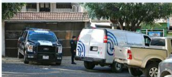
■ En Miravalle fue asesinado un joven de 25 años.