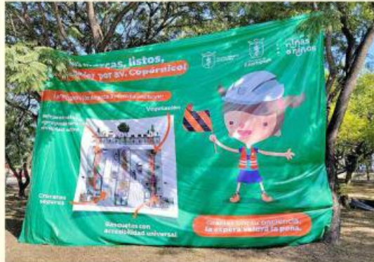
Lonas se han colocado en la zona para indicar en qué consiste el proyecto "Calle Completa".

"La obra beneficia a las personas más vulnerables