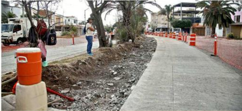
Vecinos de Paseos del Sol se han mostrado en contra de la construcción, alegando que habría "reducción de carriles".