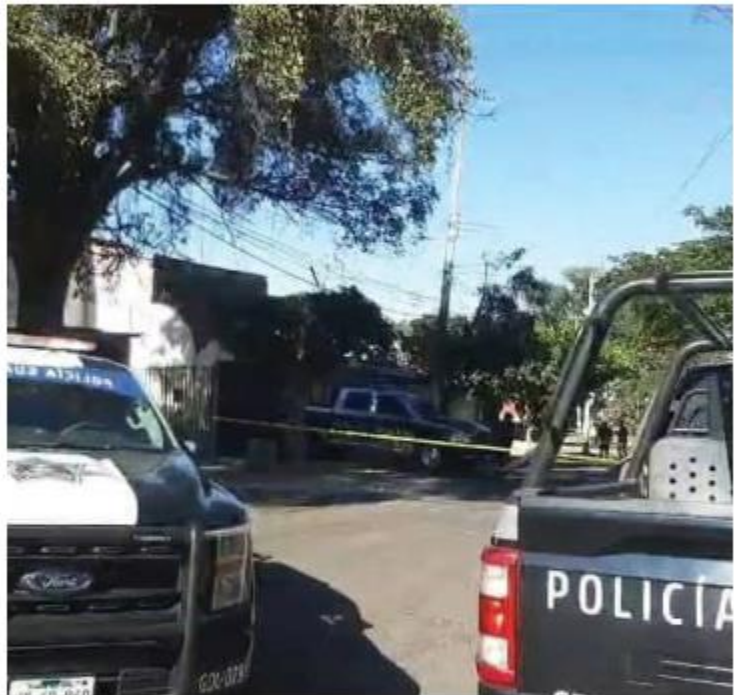
Una de las víctimas fue asesinada mientras transitaba por la colonia Miravalle, en Guadalajara. JUANCARLOSMUNGUÍA

La violencia se trasladó hasta la colonia Parques de Santa María de Tlaquepaque, donde fueron atacados a balazos dos hombres por sujetos desconocidos. Uno de ellos logró sobrevivir, pero el otro perdió la vida mientras recibía atención médica. Trasciende que quienes dejaron a la persona que falleció en el