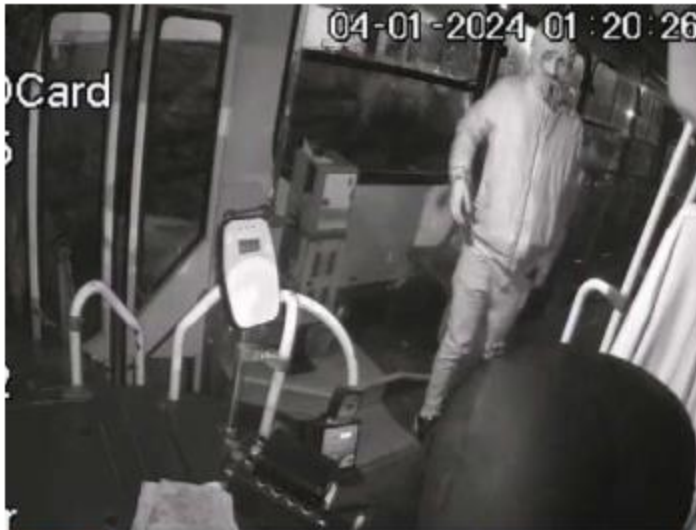
HECHO. Dos hombres robaron una unidad del transporte público en el Fraccionamiento Misión del Campanario, en Tonalá. El hecho fue captado por una cámara de seguridad de ese camión.