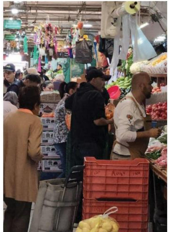
La mayoría gastó de 500 a mil pesos en la cena.

La encuesta se realizó del 1 al 18 de diciembre a 602 hogares, de los cuales el 73.4 por ciento pertenecen a la Zona Metropolitana de Guadalajara. —