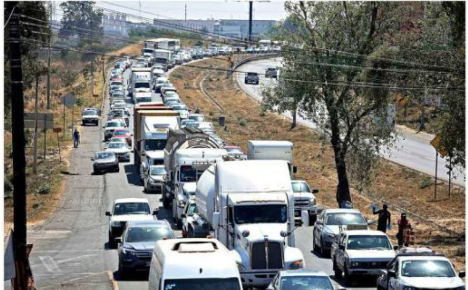
La Carretera a Nogales enfrenta un severo problema de congestión vial.

“Es decir, que se le entregue al Gobierno del Estado cuando menos yo diría hasta el entronque con la autopista a Puerto Vallarta y pues una vez más, si la Federación no ayuda a Jalisco, pues Jalisco se tiene que hacer responsa-