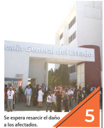
Se espera resarcir el daño a los afectados.

También lamentó que no es la primera vez que se dan este tipo de casos donde decenas de personas caen en financieras que les ofrecen ganancias fuera de la realidad y suelen perder sus patrimonios como ocurrió con AJP.