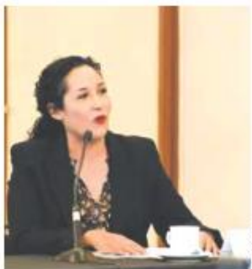
A LA CABEZA. La alcaldesa estará al frente de la JCM por seis meses.

El alcalde destacó su participación en la realización de la Biciescuela Todas en Bici y otras acciones.