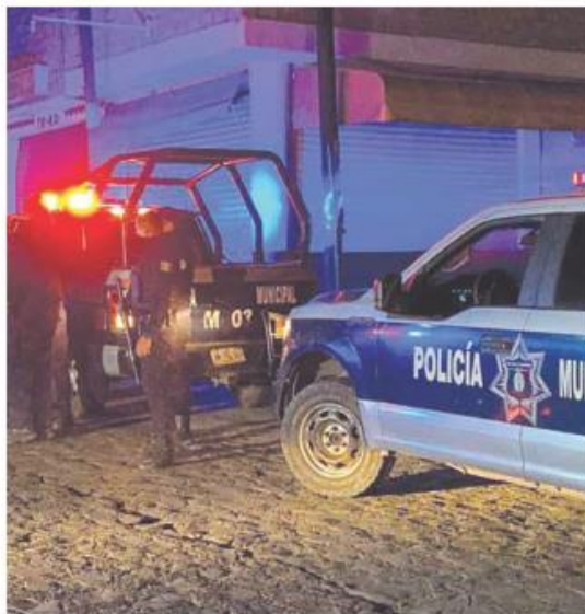
EN LAS HUERTAS. Los elementos municipales detuvieron al agente agresor entre las calles Piña y Sandía.

Al resistirse a ser revisado y luego de identificarse como elemento de la Fiscalía, el sujeto se habría mos-