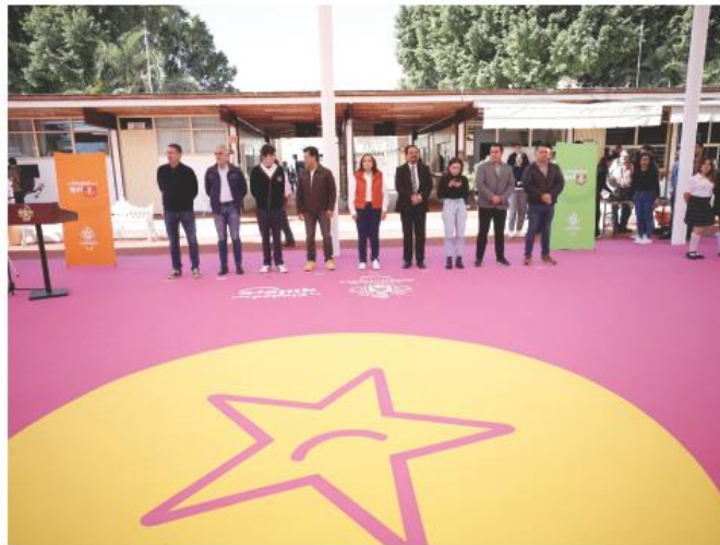
La inversión fue de 2.4 millones de pesos.

El programa Escuelas a Todo Color tiene el objetivo de ofrecer entornos educativos dignos que estimulen el aprendizaje y permanencia escolar