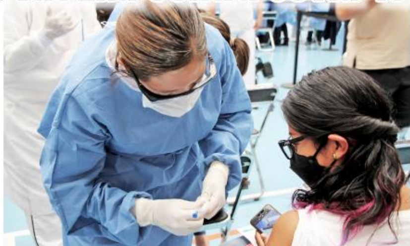
Las interesadas pueden registrarse en la plataforma estatal.

Después de registrarse, será necesario dar seguimiento a través del sitio web o las redes oficiales de la Secretaría de Salud Jalisco para informarse de las sedes y horarios de aplicación de la vacuna. Las personas inscritas deberán cubrir con los requisitos establecidos en la página