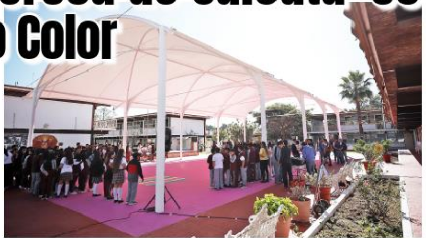
El programa busca ofrecer entornos educativos dignos que estimulen el aprendizaje y permanencia escolar.