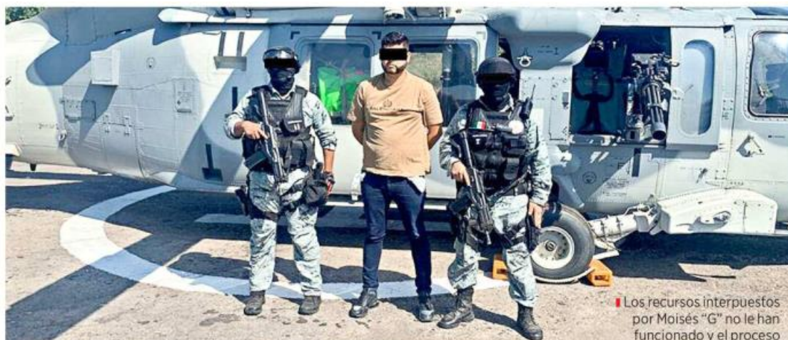
Los recursos interpuestos por Moisés "G" no le han funcionado y el proceso deberá continuar.