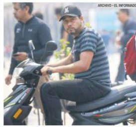
MOTOS. En la ZMG los motociclistas abundan sin respetar el reglamento.

El diputado local de Morena, Óscar Vázquez, descartó que sea suficiente con incrementar las sanciones y multas para quienes cometen infracciones y se enfoca en la educación y mejorar la cultura vial de la población.