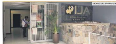
USUARIOS. Las personas pueden acceder a la justicia como derecho.

Llevar un proceso por medio de Justicia Alternativa es para los especialistas mediadores llevar un proceso más humano en comparación con el sistema tradicional, gracias a las acciones impulsadas por el Instituto de Justicia Alternativa (IJA).