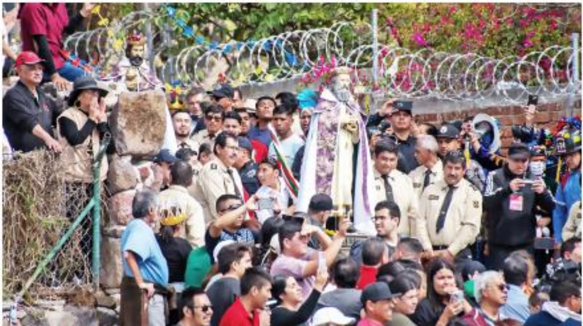
Se espera llegar a 2 millones de visitantes con las semanas restantes de enero.

Las festividades se han llevado a cabo con saldo blanco, gracias a que desde el pasado 28 de diciembre el municipio estableció un operativo conformado por hasta 750 elementos de distintas dependencias municipales, estatales y federales, con la finalidad de garantizar la seguridad de los asistentes.