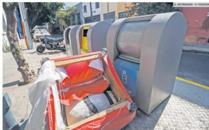
CONTENEDORES. Este medio hizo un recorrido por las calles del Centro de Guadalajara y fue posible ver que los contenedores están repletos de basura en algunos casos y, en otros, se muestran objetos abandonados.

"Hemos tenido muchos problemas desde que los instalaron, cada rato los incendian, es un cochinerero y ya hay vagos, contaminación", explicó.