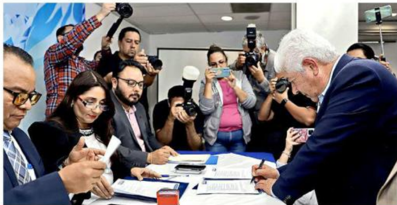
El ex Gobernador panista se registró como precandidato de mayoría relativa al Senado.