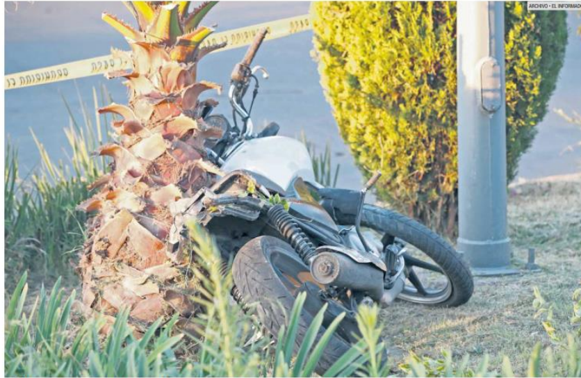
CAÍDAS. Durante 2022, 71 motociclistas murieron en accidentes de tránsito y 562 resultaron con lesiones graves.

Las caídas no son accidentes y tienen más que ver con la falta de pericia del conductor