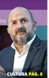
CULTURA PÁG. 6