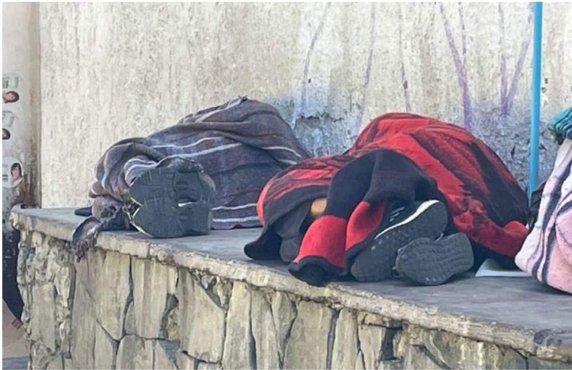
Han aumentado las personas en situación de calle en los últimos años. ESPECIAL

El jefe del departamento de CADIPSI informó que Guadalajara cuenta ya con dos albergues para la atención de las personas en situación de calles, además de brigadas que hacen recorridos por todo el municipio para brindar apoyo a quien lo requiere.