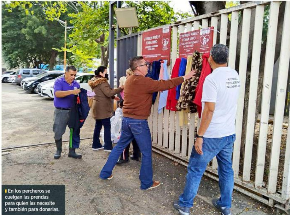
En los percheros se cuelgan las prendas para quien las necesite y también para donarlas.

Ramírez invitó a la población a sumarse a esta campaña ya sea apoyando en la elaboración de los percheros, la cual inicia en mayo, o donando material para su construcción.