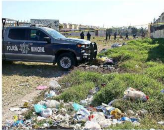
■ En Lomas del Mirador fue localizado un cadáver.