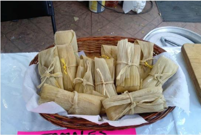
Los tamales los pagan las personas que le sale el niño Dios en la rosca.