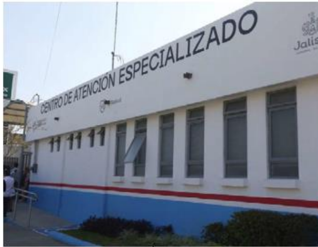
Los Centros de Salud operarán en su horario normal. ESPECIAL