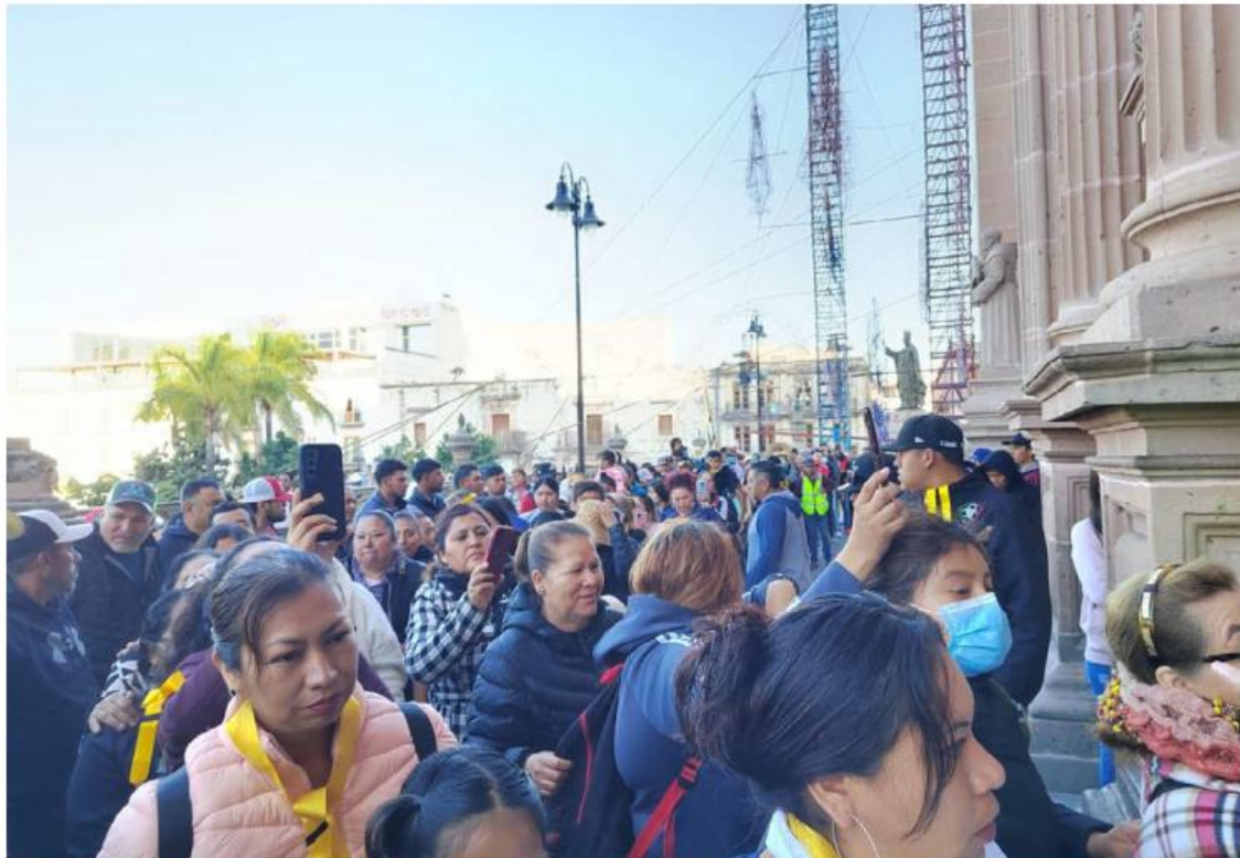
Al mediodía se ofreció la misa principal en la Catedral Basílica de San Juan de los Lagos. DALIA ROJAS

“Estamos muy contentos de recibir a estos peregrinos que vienen de diferentes partes de nuestro país, solo este fin de semana espe-