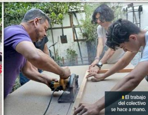
El trabajo del colectivo se hace a mano.