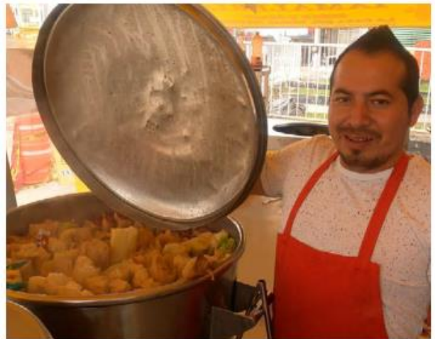
Otro de los tamales exóticos que ofrece el lugar son el “chori queso” y el “pizzatamal”. ENRIQUE VÁZQUEZ

“Como último eco de la Navidad, en el 2 de febrero tienen lugar dos recuerdos, uno dentro de la liturgia, consiste en la bendición de velas al inicio de la misa y la realización de una procesión con esas velas encendidas, por lo cual se le da el título de Día de la Candelaria y la otra es la Presentación del Niño en el Templo o la Purificación de María”, recordó el experto. —