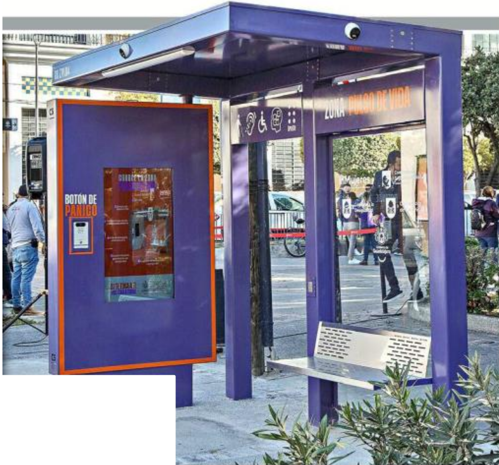
El Alcalde tapatío interino señaló que en el sitio son constantes las situaciones de acoso y robos.