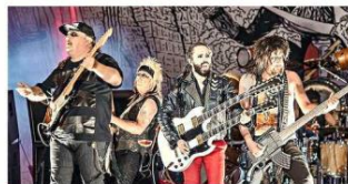
El concierto de Moderatto fue cancelado.