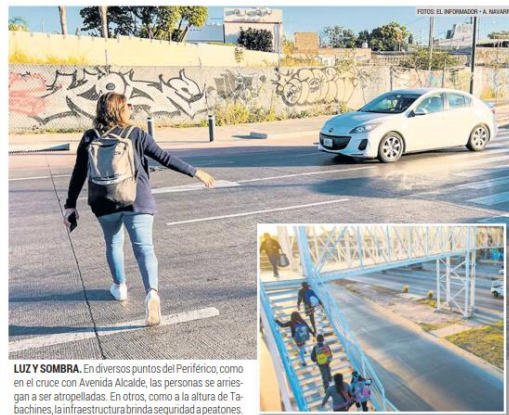
LUZY SOMBRA. En diversos puntos del Periférico, como en el cruce con Avenida Alcalde, las personas se arriesgan a ser atropelladas. En otros, como a la altura de Tabachines, la infraestructura brinda seguridad a peatones.

Por la falta de infraestructura, las personas tienen que esquivar a los coches en los cruces de Alcalde y Juan Gil Preciado