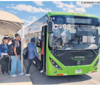
LLOLLENAN. Este medio observó que estudiantes del CUTonalá son los principales usuarios de la ruta C-98, que termina su ruta en el aeropuerto tapatío.