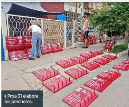
Proa 31 elabora los percheros.