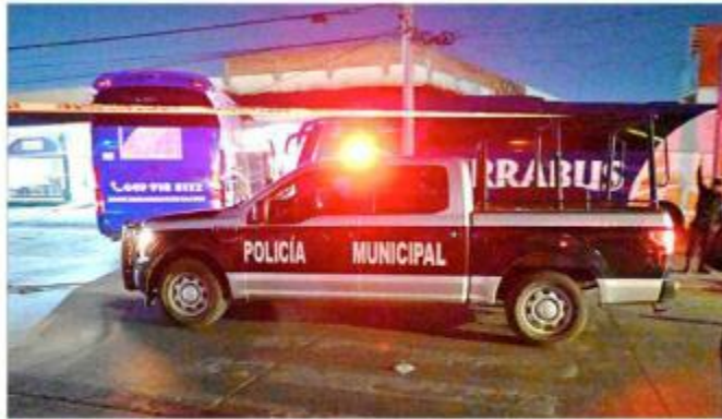
■ La agresión ocurrió en la Nueva Central de Autobuses.