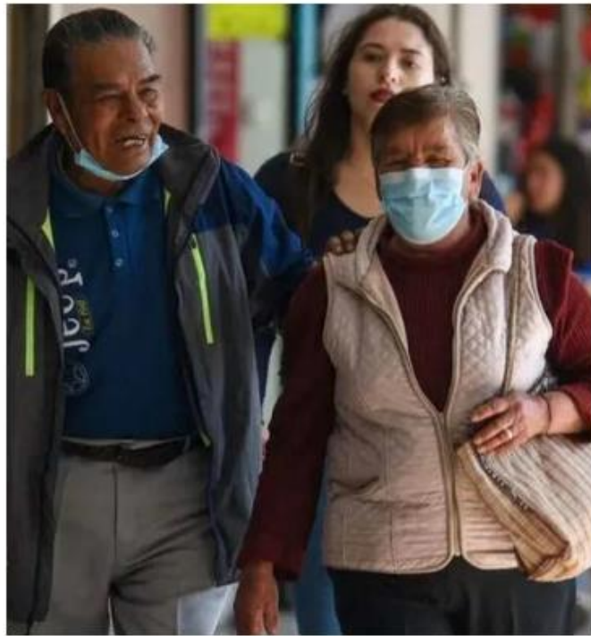
Piden a la población no bajar la guardia.

“Se va agravando hasta poderte causar una neumonía y que esta neumonía incluso te puede llevar una dificultad respiratoria, que tengas fiebre y esto pueda condicionar ya a un nivel de oxigenación bajo que requiera de oxígeno suplementario”, precisó Nuño Bonales, quien agregó que la vacuna es esencial.