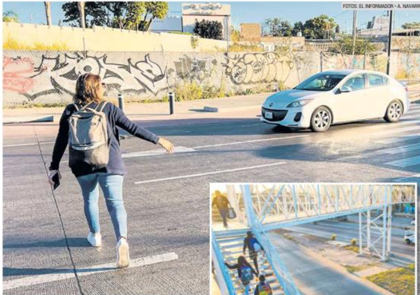
LUZ Y SOMBRA. En diversos puntos del Periférico, como en el cruce con Avenida Alcalde, las personas se arriesgan a ser atropelladas. En otros, como a la altura de Tabachines, la infraestructura brinda seguridad a peatones.