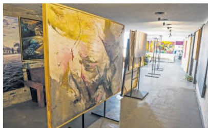
ESTUDIO. El espacio donde crea la artista está lleno de luz.