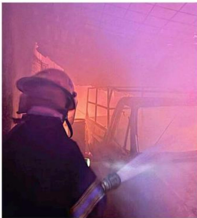
■ Bomberos de El Salto hallaron a la víctima.

La carpintería colapsó porque el techo era de lámina; también se quemó una camioneta estacionada. El origen del incendio se investiga.