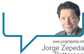
www.jorgezepeda.net Jorge Zepeda Patterson