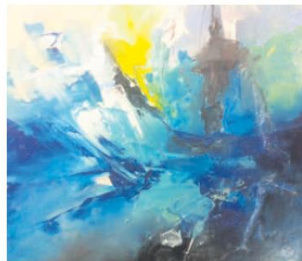
OBRA. La artista crea piezas llenas de sutileza en sus trazos y colores.