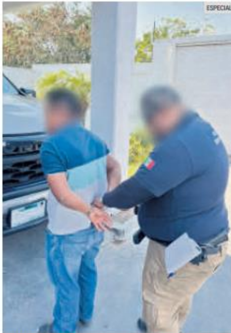
DETENIDOS. El delito señalado ocurrió en 2019 en el fraccionamiento Valle de los Molinos.