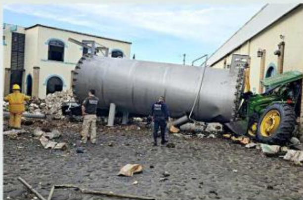
La explosión ocurrió en la zona de autoclaves.

En la empresa quedó un contenedor abollado, el cual impactó un tractor.