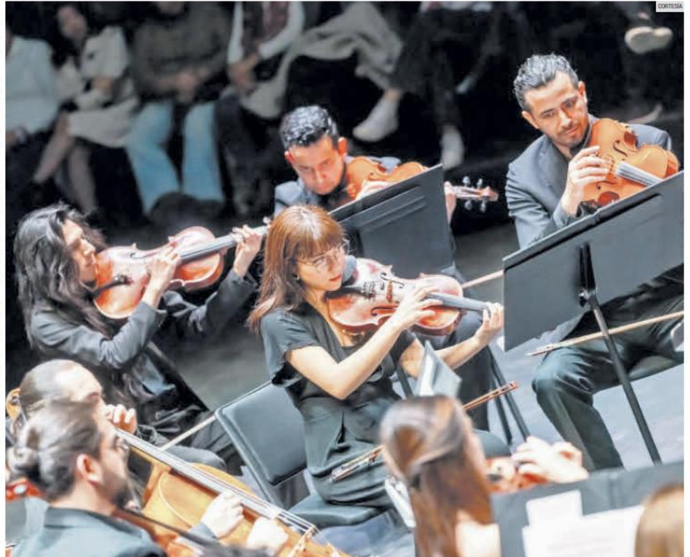
OHIR. La agrupación se caracteriza por su trabajo de formación y perfeccionamiento de alto nivel.

El programa será presentado en dos sedes, la Preparatoria Regional de Chapala y el Conjunto Santander de Artes Escénicas.