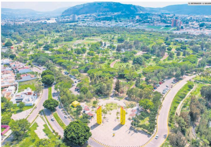
PARQUE METROPOLITANO. Una de las apuestas de las autoridades de Guadalajara y Zapopan es cuidar los espacios públicos para que la gente se apropie de ellos.

Con nuevas actividades y talleres, Zapopan y Guadalajara buscan que los ciudadanos se apropien de espacios que han sido recuperados