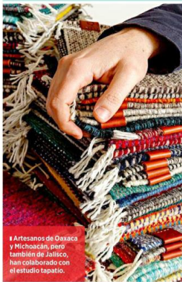
Artesanos de Oaxaca y Michoacán, pero también de Jalisco, han colaborado con el estudio tapatío.

Elizalde Urzúa señala que este cambio de tendencias ha permitido que los artesanos se integren al proceso creativo, lo que ha garantizado que su conocimiento ancestral no solo se conserve, sino que también se transforme dentro del diseño contemporáneo.