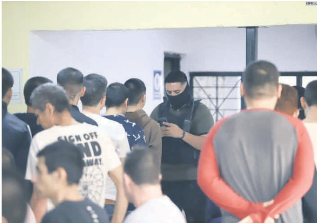
FISCALÍA. Autoridades del Estado intervienen albergue para buscar a personas con reporte de desaparición.

La Fiscalía realiza inspecciones regulares para verificar el cumplimiento de normativas