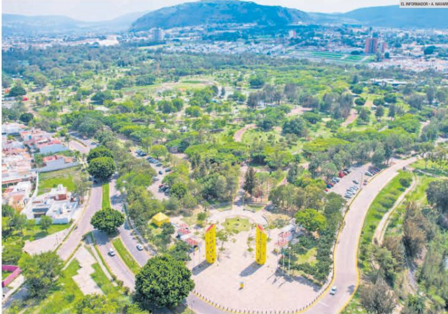
PARQUE METROPOLITANO. Una de las apuestas de las autoridades de Guadalajara y Zapopan es cuidar los espacios públicos para que la gente se apropie de ellos.

Con nuevas actividades y talleres, Zapopan y Guadalajara buscan que los ciudadanos se apropien de espacios que han sido recuperados