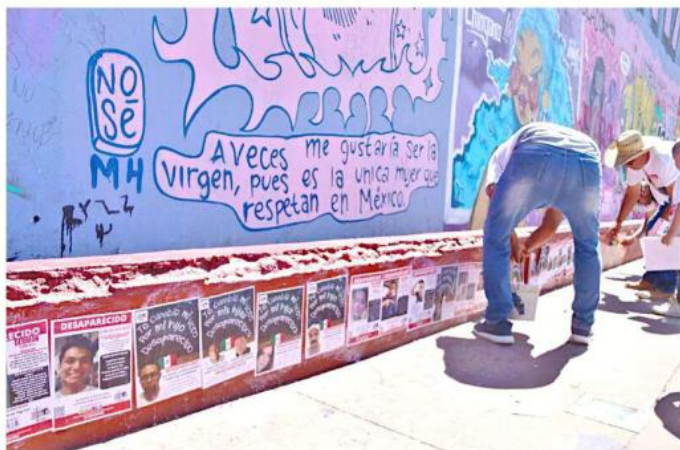
En la actualidad sólo hay dos vías de difusión: Facebook y la pega de carteles.

Cree morenista que resolvería el retiro y pinta de los carteles