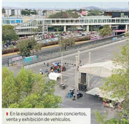
En la explanada autorizan conciertos, venta y exhibición de vehículos.

"Los tenemos encima, casi, casi. Luego está el hospital (San Francisco), luego está otro coto. Todavía el circo no hace ese escándalo. Que no se permitan este tipo de eventos, donde, de veras, no podemos ni escuchar el teléfono, nos es muy molesto. Aparte, son demasiadas horas y varios días", añadió la mujer.