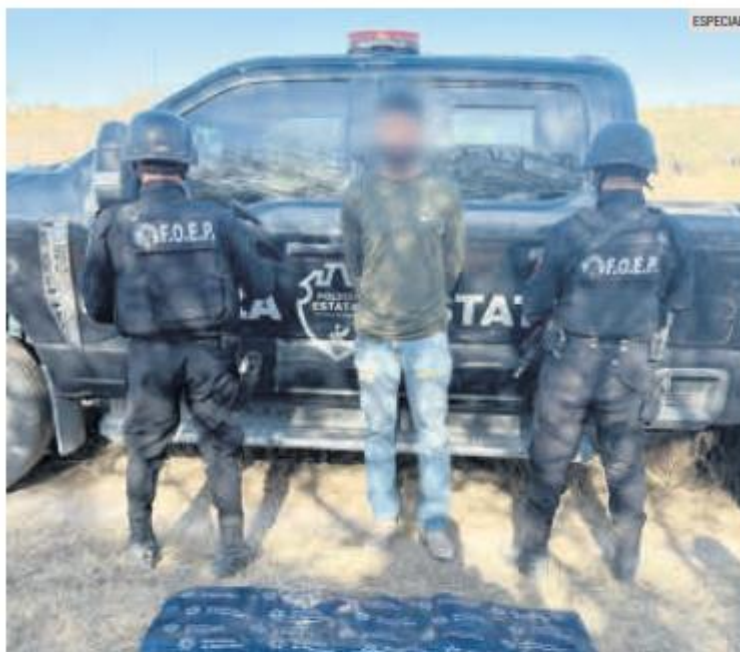
DETENIDO. El sospechoso portaba un fusil de combate.