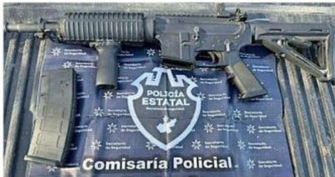
■ El hombre sujeto intentó ocultarse entre la hierba.

En coordinación con la Guardia Nacional y el Ejército, la Secretaría de Seguridad Jalisco tiene desplegados cerca de 400 elementos en la Región Altos Norte para mantener vigilancia en la zona que colinda con otros estados.