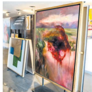
TÉCNICA. El arte abstracto y el impresionismo están presentes en su obra.

Para ella, el uso de herramientas digitales ha sido clave en esta etapa de su carrera. "Antes recordaba revistas o usaba acuarelas en papel para bocetar, pero desde que empecé a usar el iPad, todo cambió. Ahora hago una idea previa digitalmente, lo que facilita llevarla al lienzo con óleo o acrílico".