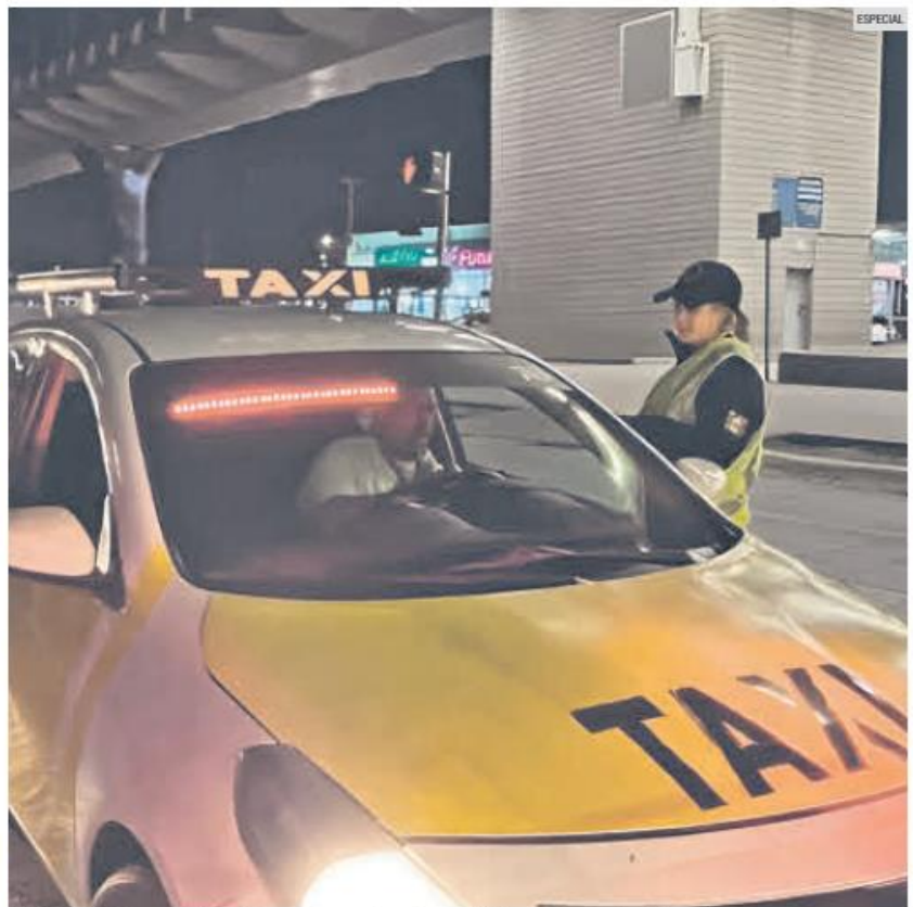
OPERATIVO. Busca ordenar el transporte y mejorar la seguridad en puntos de alta afluencia.

De las infracciones registradas, 503 corresponden a vehículos de Empresas de Redes de Transporte, como Uber, Didi y Cabify; 274 a taxis; 308 a camiones y una a una motocicleta. Además, se retiraron seis unidades que prestaban servicio de transporte público