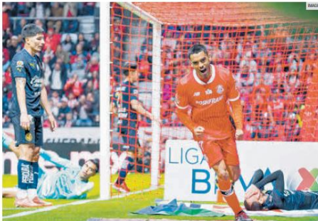
DECEPCIONADOS. Chivas no logra hacerse del triunfo en el Estadio Nemesio Díez desde el Apertura 2019. Su siguiente compromiso será el sábado 22 de febrero frente Pachuca en el estadio AKRON.