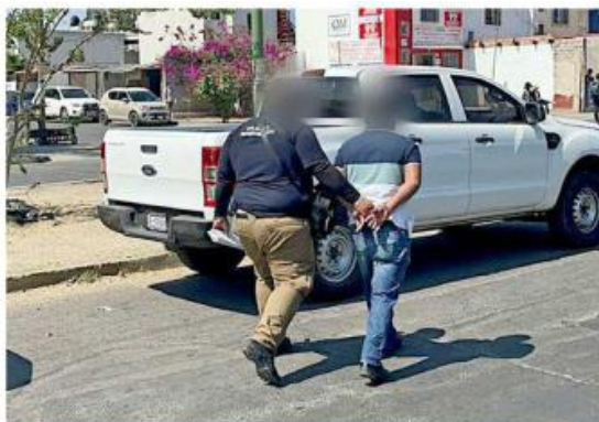
La Fiscalía del Estado ejecutó órdenes de aprehensión en contra de dos policías de Zapopan.