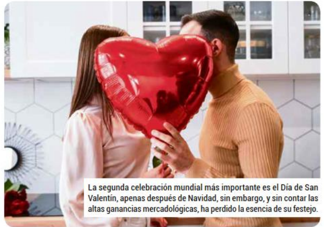
La segunda celebración mundial más importante es el Día de San Valentín, apenas después de Navidad, sin embargo, y sin contar las altas ganancias mercadológicas, ha perdido la esencia de su festejo.

Se ha difundido ampliamente la idea de cambiar de pareja por el menor motivo y ha desaparecido la ilusión de formar