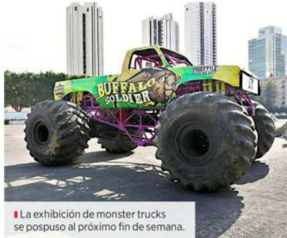
La exhibición de monster trucks se pospuso al próximo fin de semana.