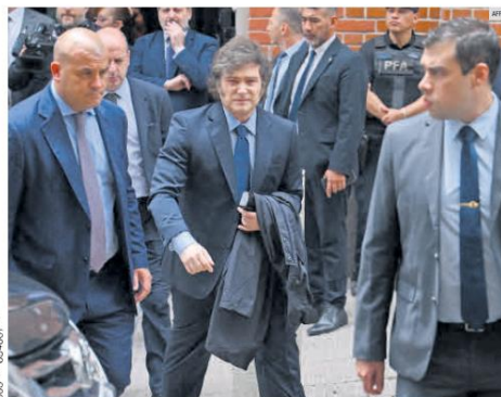
JAVIER MILEI. De nueva cuenta, el presidente de Argentina se ve envuelto en el escándalo. En esta ocasión por hacer promoción de una criptomoneda que no cuenta con sustento económico real.