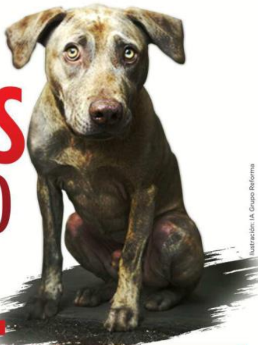
Ilustración: I.A. Grupo Reforma

De 582 denuncias, en lapso de 5 años, solo un caso tuvo sentencia