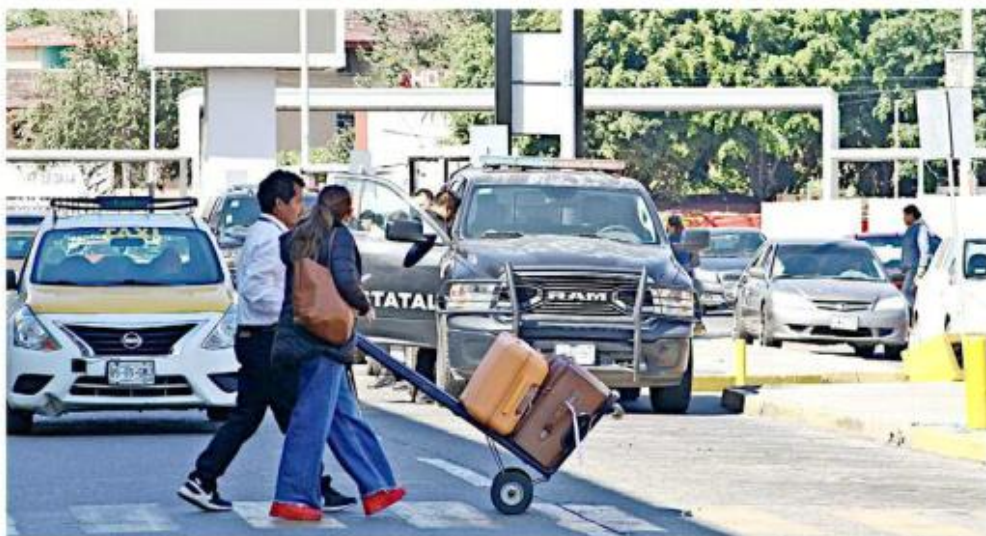
Retiraron 6 vehículos y sancionaron a 503 taxis de plataforma, 274 taxis amarillos y 308 autobuses.

En total multaron a 503 vehículos de empresas de re-