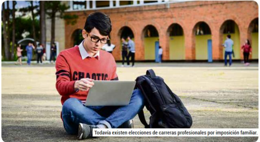
Todavía existen elecciones de carreras profesionales por imposición familiar.

"Hay una alta tendencia en carreras que tienen que ver con sistemas virtuales e inteligencia artificial, cada vez habrá más campo laboral; y según la demanda será la oferta y el tabulador de honorarios", comentó la especialista.