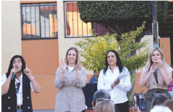
Con esta intervención, se busca también fortalecer los vínculos comunitarios.

"Empezamos en el Sauz en la parte de Guadalajara y hoy era una deuda con Tlaquepaque que este año terminamos de saldar. ¿Saben por qué?, porque nos quedan 131 módulos del Sauz y ya está etiquetado el presupuesto del gobierno