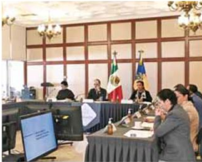
Gestión. Los acuerdos se alcanzaron por unanimidad.

Residuos. Las principales atribuciones será la operación y ejercicio de facultades relacionadas con la limpia, recolección, manejo y traslado