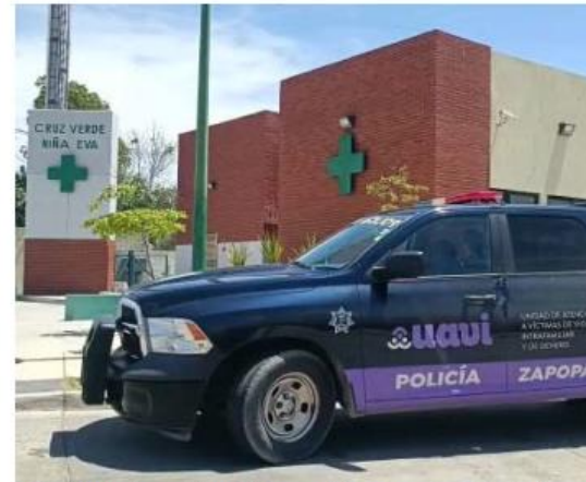
Autoridades investigan el deceso de la menor. J.C. MUNGUÍA

Tras varios minutos de atención médica, la niña perdió la vida. Agentes del puesto de socorros de la Fiscalía del Estado se hizo presente para comenzar las investigaciones correspondientes, mientras que personal del Instituto Jalisciense de Ciencias Forenses llevó el cuerpo a sus instalaciones. ■