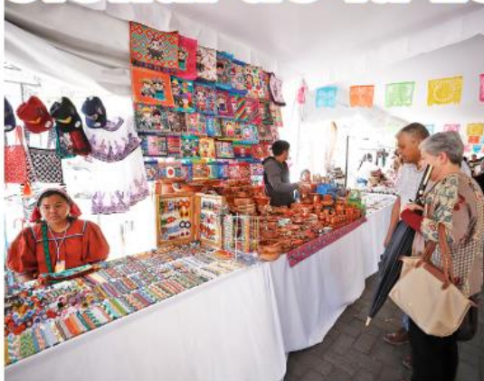
El festival se lleva a cabo hasta el 1 de marzo en el Andador Pedro Loza, en el Centro Histórico.

"Vamos a seguir trabajando por una Guadalajara incluyen-