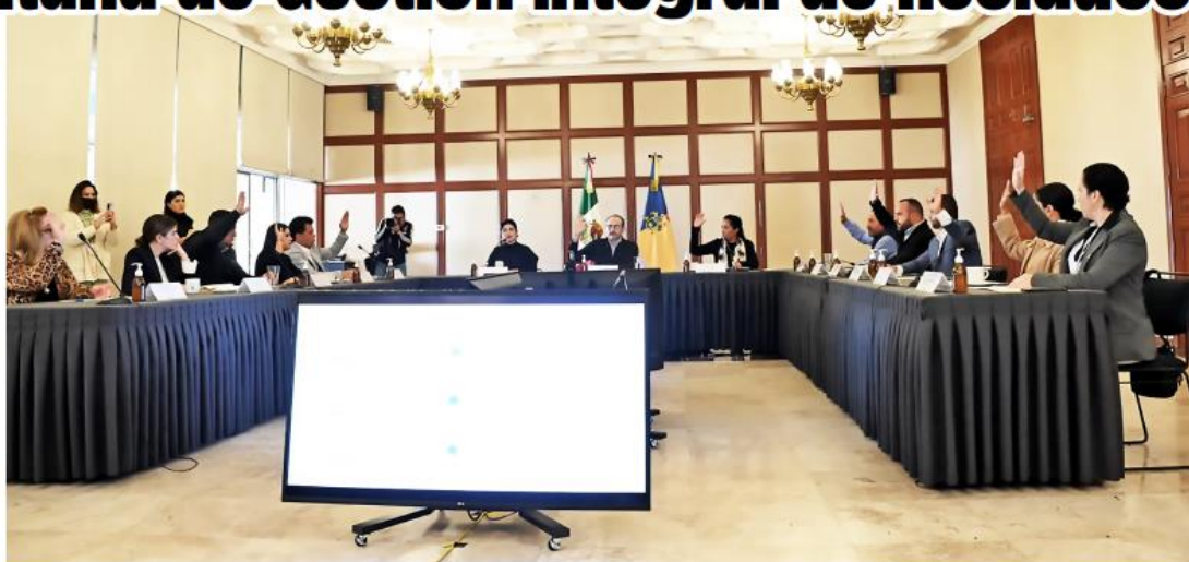
La aprobación deberá pasar por los cabildos de los municipios que se integren.

Entre las principales atribuciones definidas está la ope-