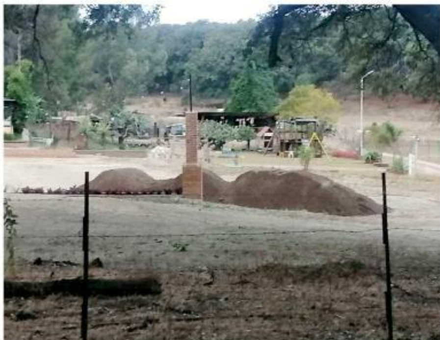
Un cargamento de material se vertió en un predio con obras en proceso, pese a estar prohibido.

Se trata de zonas forestales ubicadas a un costado del rancho La Cebada, en Zapopan, donde se volcaron los