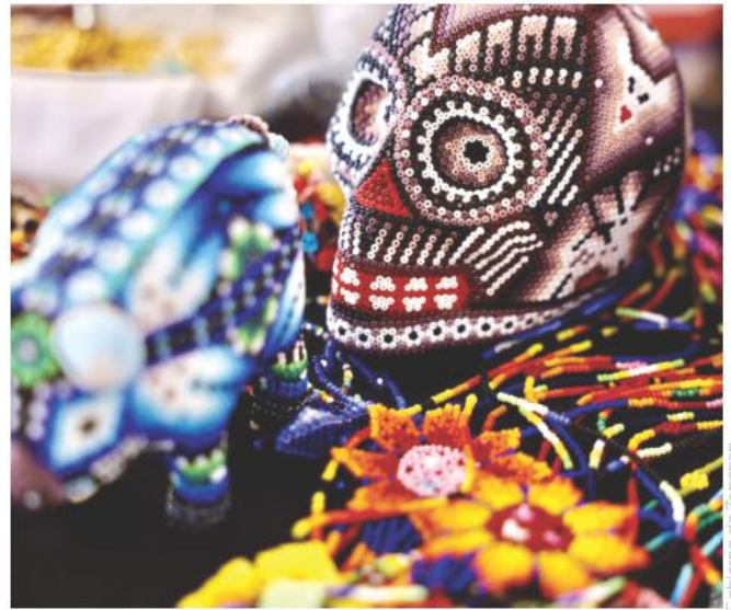
El evento se realizará, desde este miércoles y hasta el próximo domingo 25 de febrero.

El Festival de las Lenguas Maternas en Zapopan se instalará del 21 al 25