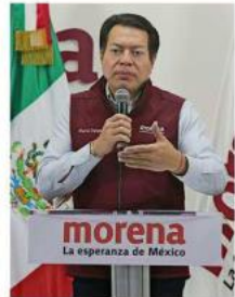
Mario Delgado, presidente nacional de Morena.

El orden de las candidaturas que se registren en el INE no será el mismo que estos resultados, aclaró Mario Delgado. Antes habrá posiciones reservadas por la Comisión Nacional de Elecciones; los lugares restantes se repartirán entre los seleccionados ayer.