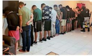
Autoridades establecieron que los agresores eran parte del grupo élite del cártel tras encontrar chalecos con las leyendas "Deltas" y "CJNG" bordadas.

Los guardias hallaron una casa de seguridad en Brigada Norte y Brigada Po-