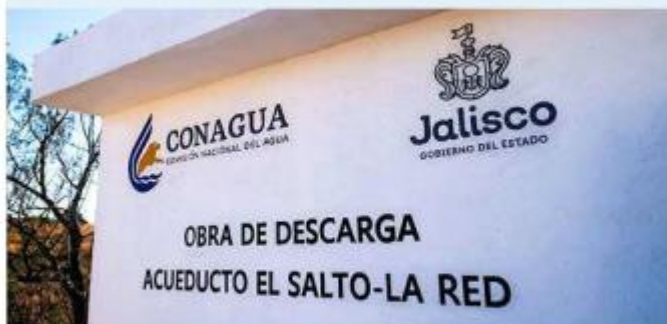
■ Rehabilitan el sistema de conducción El Salto-La Red-Calderón.