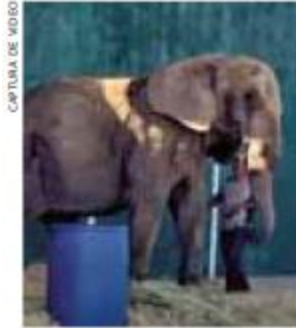
CAPTURA DE VIDEO