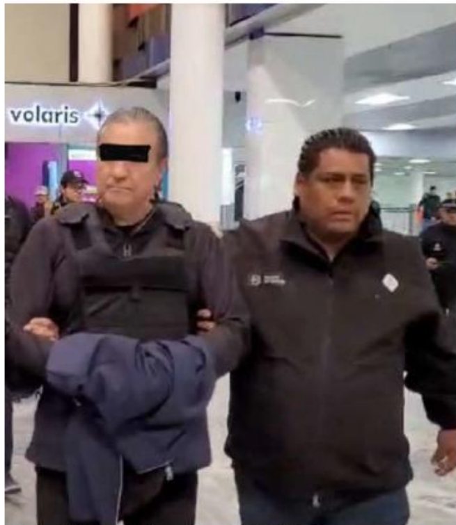
Fue trasladado a Jalisco el pasado 17 de febrero.

El detenido, de 56 años de edad, se desempeña como director ejecutivo en Dotmedia. Además del cargo en la administración estatal, trabajó como coordinador de Dependencias Auxiliares del Gobierno del Estado, y de áreas de