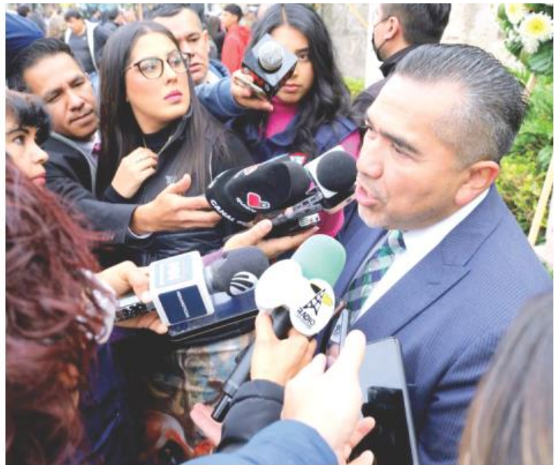
El titular del STJ dijo que la defensa de Lamas ha alargado los tiempos legales.

“Los inimputables ya no pueden estar en el interior de los reclusorios, antes había un área específica para personas con problemas psiquiátricos, hoy ya no pueden estar allí porque la Ley lo impide, lo prohíbe, se requiere un centro de internamiento