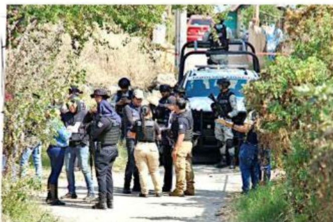
■ Luz de Esperanza detectó restos humanos enterrados.

“Están a unos metros, desgraciadamente, del ha-