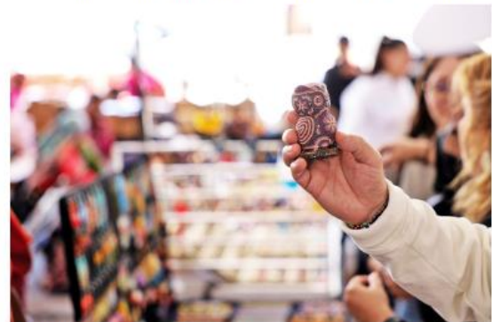
La muestra se instalará del 21 al 25 de febrero en la Plaza de las Américas

El Festival de las Lenguas Maternas en Zapopan se instalará del 21 al 25 de febrero, de 10:00 a 21:00 horas, en la Plaza de las Américas-Juan Pablo II. En esta muestra participan más de 60 expositores con gastronomía, artesanías y música, entre otras actividades. Existen 24 módulos para venta de artesanías distribuidos en Plaza de las Américas, Plaza la Perla y en la Estación Zapopan Centro de la línea 3 del tren ligero, y espacios de venta semanales en Plaza Andares y Plaza Patria.