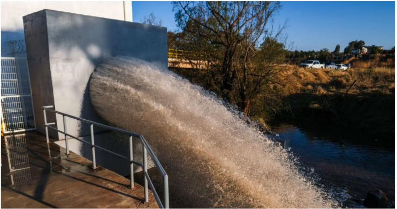
Estiman que el sistema llevará un metro cúbico por segundo de agua a la metrópoli.