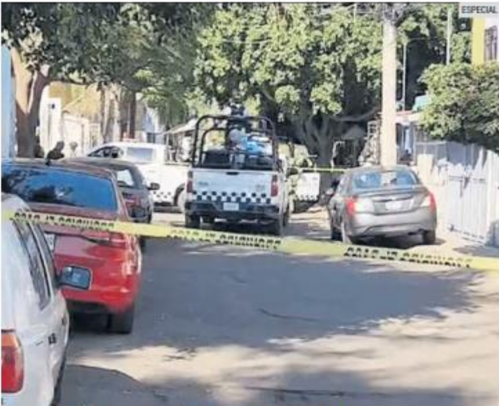
PATRULLAJE. Los agentes de la Guardia Nacional fueron agredidos mientras recorrían calles de la Colonia El Tapatío, en Tlaquepaque.

Tras la balacera, los uniformados lograron capturar a cuatro, entre ellos una mujer, y comenzaron un patrullaje por la