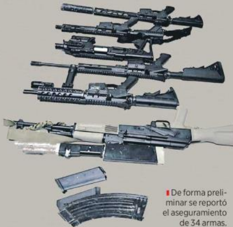
■ De forma preliminar se reportó el aseguramiento de 34 armas.

Entre ellos había una mujer que recibió un bal-