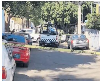
PATRULLAJE. Los agentes de la Guardia Nacional fueron agredidos mientras recorrían calles de la Colonia El Tapatio, en Tlaquepaque.

Tras la balacera, los uniformados lograron capturar a cua- tro, entre ellos una mujer, y co- menzaron un patrullaje por la