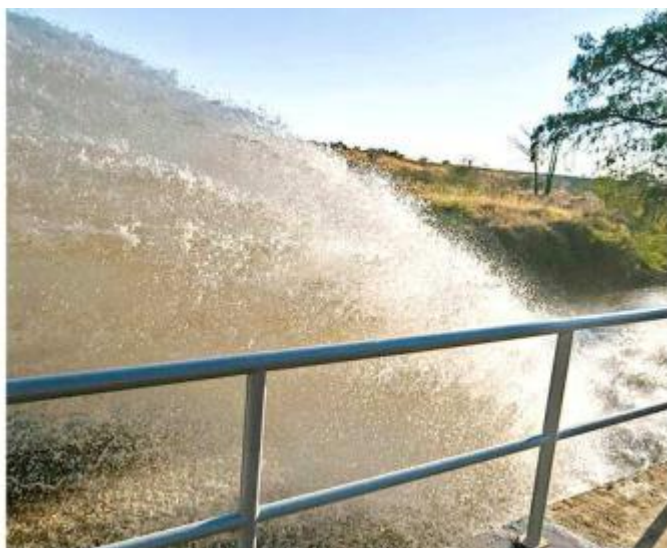
■ La obra será inaugurada este viernes por el Presidente Andrés Manuel López Obrador.

Sin embargo, eso dependerá del llenado del Zapotillo, toda vez que su fuente es el Río Verde y actualmente la mayor parte del País atraviesa una sequía severa, por lo que los principales cauces se encuentran con niveles precarios. No obstante, Alfaro se ha dicho confiado en que la sequía no afecte y la presa suministre el volumen esperado, aunque no ha precisado cuánto demorará en hacerlo.