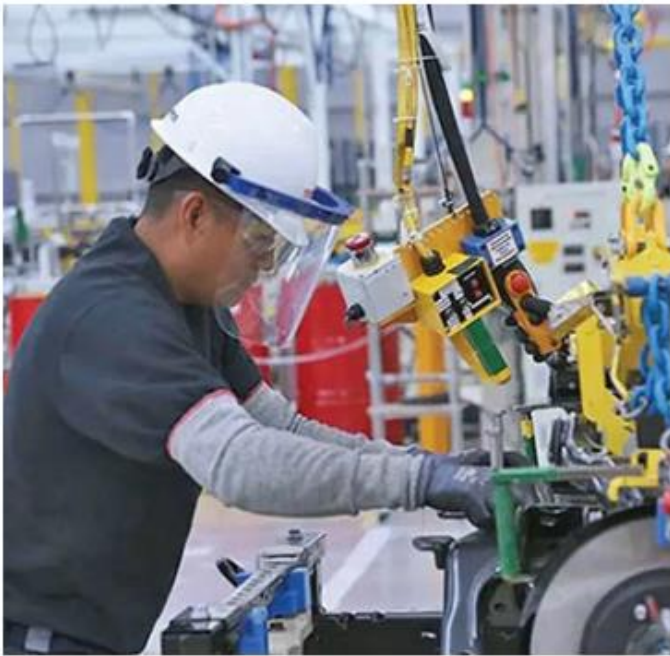
Destacan que durante la emergencia sanitaria por covid-19 se tuvo mayor inversión en la entidad. ESPECIAL