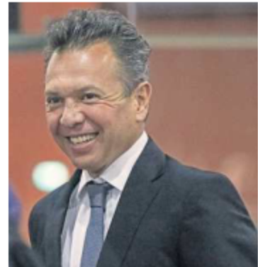
Pablo Lemus , candidato de MC a la gubernatura de Jalisco.

“Tenemos todas nuestras esperanzas puestas en que sí se apruebe”, comentó.