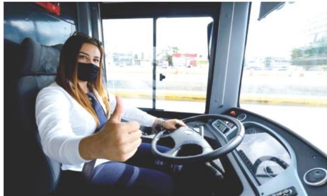
Esta sería la cuarta generación de operadoras.