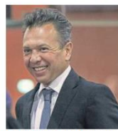
Pablo Lemus, candidato de MC a la gubernatura de Jalisco.

“Tenemos todas nuestras esperanzas puestas en que si se apruebe”, comentó.