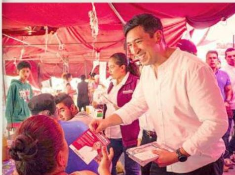
■ Kumamoto afirmó, de igual manera, que renovarán las tuberías del sistema de agua potable.

"Nos vamos a comprometer en que la Línea 3, en coordinación con la Federación, llegue hasta Tesistán y tenga una solución, una ruta alimentadora, para Valle de los Molinos, para La Magdalena", subrayó.