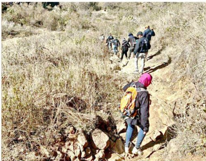
Integrantes de colectivos han localizado fosas clandestinas en el Cerro del Cuatro.