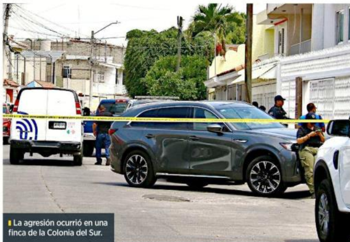
La agresión ocurrió en una finca de la Colonia del Sur.

En el reporte de los primeros tres meses del año, Jalisco sumó 459 víctimas de homicidio doloso y continúa entre las seis entidades