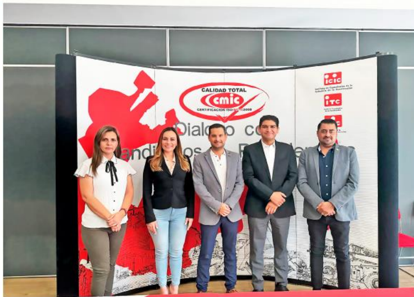
Los candidatos de la coalición Fuerza y Corazón escucharon las necesidades de los constructores.

Durante esta reunión el abanderado anunció la creación del Instituto de Estudios Urbanos de Zapopan (IEUZ) que entre otras cosas tendrá la principal función de entender el crecimiento de la ciudad, las