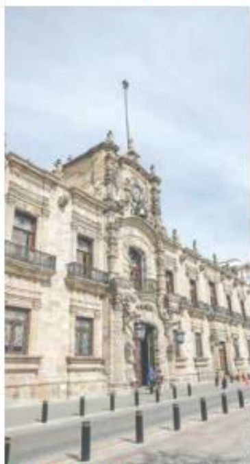
MILES DE MILLONES. La administración estatal tiene 26 créditos vigentes por 30 mil 968 millones de pesos.

La primera licitación, LPN 07/2024, tuvo como objeto contratar el "servicio de evaluación y calificación crediticia al gobierno de Jalisco y a la estructura de los financiamientos constitutivos de deuda pública directa y los programas de financiamiento para el año 2024". El fallo, por un total de 14 millones 299 mil 537.72 pesos, se dio el 4 de marzo.