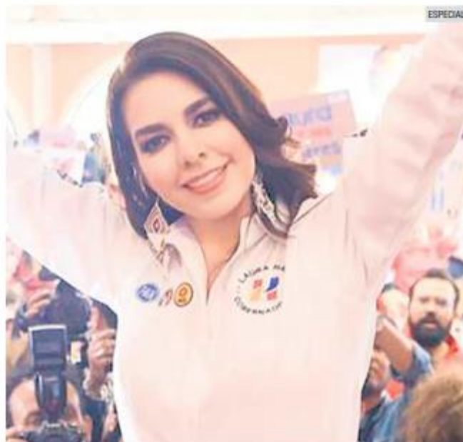
TRABAJO EN CONJUNTO. La aspirante a la gubernatura dijo que colaborará con Xóchitl Gálvez para reducir la violencia contra las mujeres.

Haro retomó sus iniciativas como la "Tarjeta Fuerza y Corazón", un apoyo económico para mujeres jefas de familia; así como programas de capacitación y apoyo a emprendedoras.