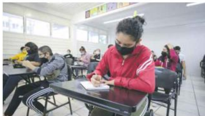
PARA ARRIBA. Las investigadoras encontraron que el porcentaje de repetición en prepas pasó de 4.9 a 49.3 por ciento.

Por otro lado, el porcentaje de cobertura pasó de 73.7 a 71.6 por ciento; el de