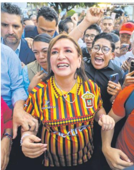
VISITA. Al terminar el diálogo con miembros de la comunidad universitaria, la candidata recibió una playera de los Leones Negros, el equipo de fútbol de la UdeG que compete en la Liga de Expansión.