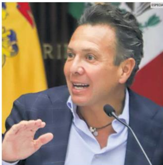
TEMAS. Lemus ha presentado propuestas en asuntos como seguridad, infraestructura vial y salud.

También se plantea la creación de un Sistema Estatal de Inteligencia que conecte a los 125 municipios de Jalisco.