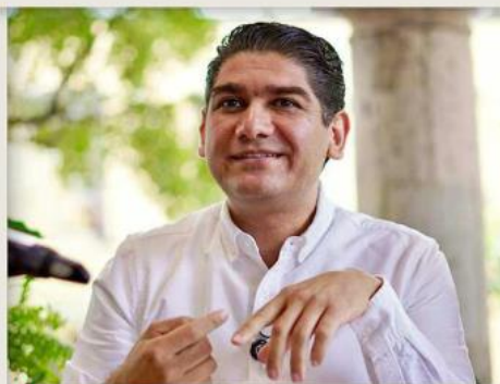
■ Santos advirtió que, de triunfar el 2 de junio, rescindiré el contrato de alumbrado público concesionado en Zapopan.