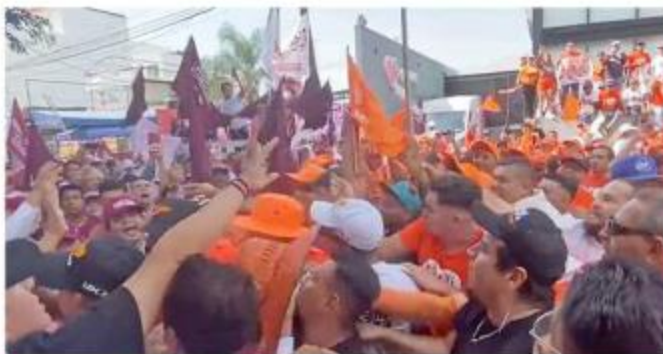
■ La riña ocurrió fuera de una televisora.

La candidata de la coalición Sigamos Haciendo Historia a la Presidencia Municipi-