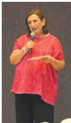
SE DESMARCÓ. La aspirante apuntó que aunque representa al PAN, PRI y PRD, no milita en esos partidos.

Lemus recordó que busca recuperar el proyecto de aeropuerto de carga en Lagos de Moreno, mientras que en el rubro de transporte público buscará la ampliación y mejora del Tren Ligero con planes que incluyen la construcción de la Línea 5 y la ampliación de las líneas 1 y 3. Ilse Martínez / Guadalajara