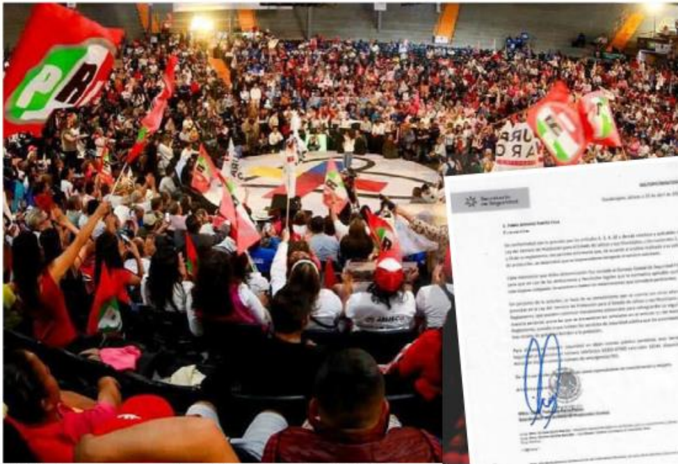
Militantes aseguran que han sido amenazados.

Contienda. El presidente del partido en Jalisco manifestó que han dejado solos a candidatos; autoridades argumentan que no se aportaron pruebas de amenazas