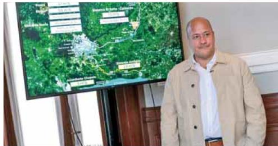
Estructura. La inversión permitió que no se afecte a millones de habitantes en el AMG.

“Lo que hicimos fue que al empezar a meterle agua en febrero de este año, logramos que esta línea (de la estadística) bajara menos rápido y nos va a permitir llegar hasta este punto que es julio de este año en el que pasarán dos cosas importantes, primero empezará a llover, inicia el temporal de lluvia; pero segundo, ya vamos a tener nuestro sistema de bombeo operando al 100% porque la CFE está por terminar obras del a subestación que nos va a permitir que todas las bombas trabajen y podamos llevar agua hacia la presa Calderón hasta 3 m 3 /s”, indicó. PUBLIMETRO