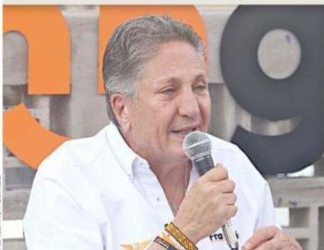
■ Frangie pretende que el centro sea operado por el Municipio y sea de acceso público.

Los candidatos a la Presidencia Municipal de Zapopan expusieron ante los ciudadanos algunos de sus objetivos de triunfar el 2 de junio, como actividad deportiva, transporte masivo y un mejor cuerpo policiaco