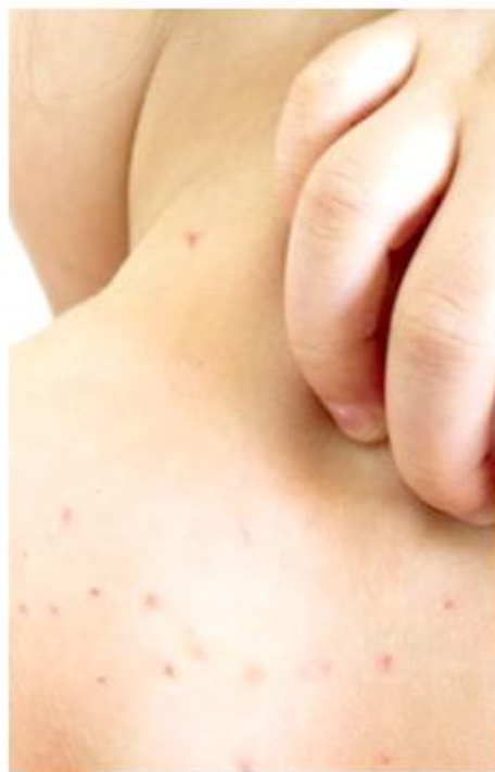
Los primeros síntomas suelen durar entre 4 y 7 días.