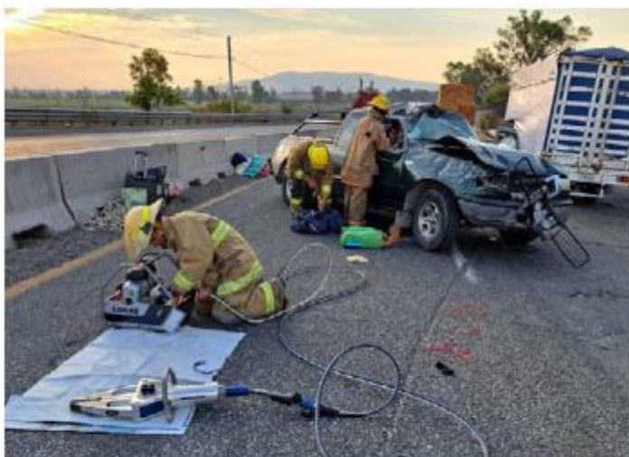
ACCIDENTE. Sobre la carretera Santa Rosa-La Barca, a la altura de La Curva de Najar, se registró el impacto entre dos autos en el que resultaron lesionadas dos personas de una camioneta.