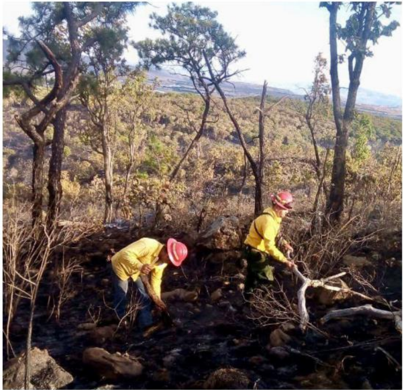
El área afectada se localiza dentro de la Zona de Uso Restringido. ESPECIAL

Quedó establecido que el área afectada se localiza dentro de la Zona de Uso Restringido, cuyas zonificaciones tienen como ob-