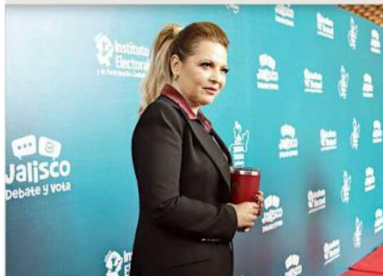
Delgadillo señala que el esquema "Hoy No Circula" sería para los automóviles que no verifiquen.

Los candidatos a la Gubernatura de Jalisco explicaron con mayor profundidad en qué consisten las propuestas con las que planean gobernar el Estado, de triunfar en las urnas el próximo 2 de junio.