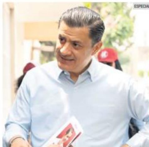
RECORRIDO. El morenista estuvo haciendo campaña en la Colonia Morelos.