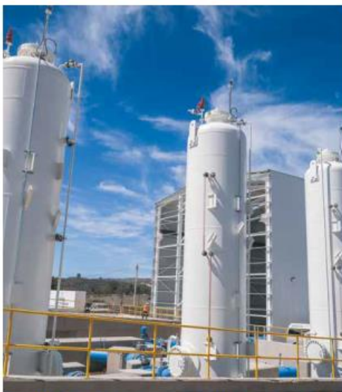
MEGAOBRA. El acueducto de las presas El Salto, La Red y Calderón se inauguró el viernes 23 de febrero.

Con la obra concluida, añadió el gobernador, la presa ahora recibe