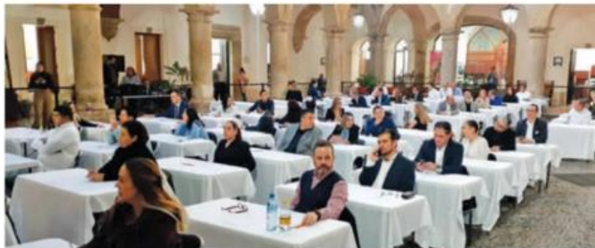
El Congreso local ha incumplido con los tiempos establecidos.

Solo si alguno de los 69 aspirantes pretende mejorar el resultado de su examen de conocimientos, podría realizar de nuevo la prueba. (Ignacio Pérez Vega)