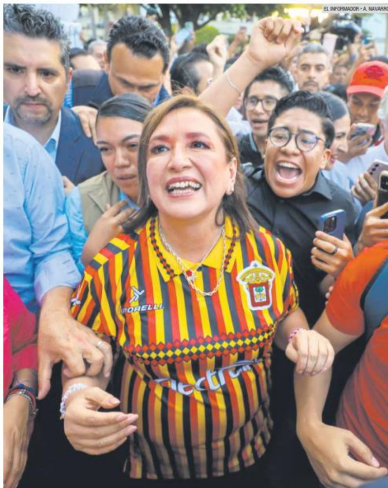
VISITA. Al terminar el diálogo con miembros de la comunidad universitaria, la candidata recibió una playera de los Leones Negros, el equipo de fútbol de la UdeG que compete en la Liga de Expansión.