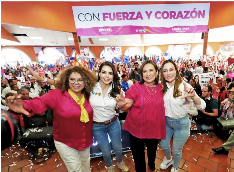
Xóchitl Gálvez Ruiz sostuvo un encuentro con mujeres en San Pedro Tlaquepaque.

"Justicia y verdad, cero impunidad a los agresores. Vamos a castigar a los agresores. Quien se meta con una mujer, se va a meter con la Presidenta, se los advierto y aplicaremos la tres de tres contra la violencia. Ningún agresor al poder, eso sí,