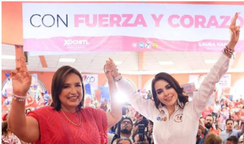
Las candidatas de Fuerza y Corazón estuvieron en Expo Ganadera. ESPECIAL

En su discurso, Gálvez Ruiz también planteó como iniciativas: mejorar el presupuesto de las universidades públicas; el rescate del