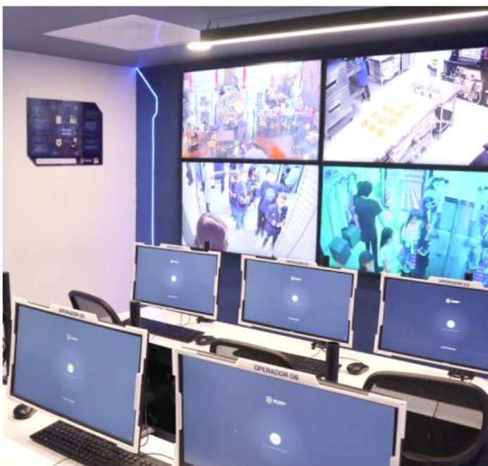
El denunciante debe ubicarse en un lugar seguro y mantener la calma.

El proceso de concientización tiene que incluir el hecho de que las niñas, niños y adolescentes serán cuestionados por la persona operadora del 911 con preguntas como las siguientes: ¿Qué sucedió?, ¿En dónde estás? y ¿Quién necesita ayuda? Por eso deben memorizar información como el nombre completo y edad de los integrantes de la familia, dirección