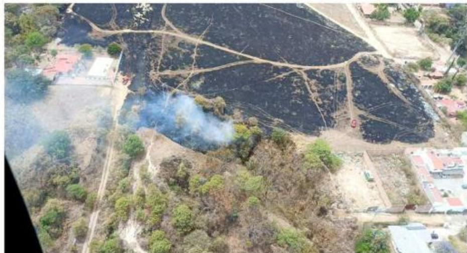
Este año, 30 por ciento de los incendios forestales han sido intencionales.

“En esos incendios deliberados lo que queda es aplicar la ley y sancionar, es difícil porque si no hay flagrancia se puede caer el proceso, pero