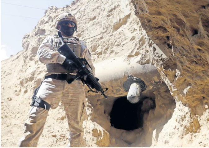
FALLAS. El plan del Gobierno federal para frenar las fosas clandestinas, principalmente a través de la supervisión de más elementos de seguridad, no ha funcionado.

En un día, encuentran seis tomas clandestinas en Zapotlanejo y aseguran 86 bidones con gasolina presuntamente robada en Tonalá