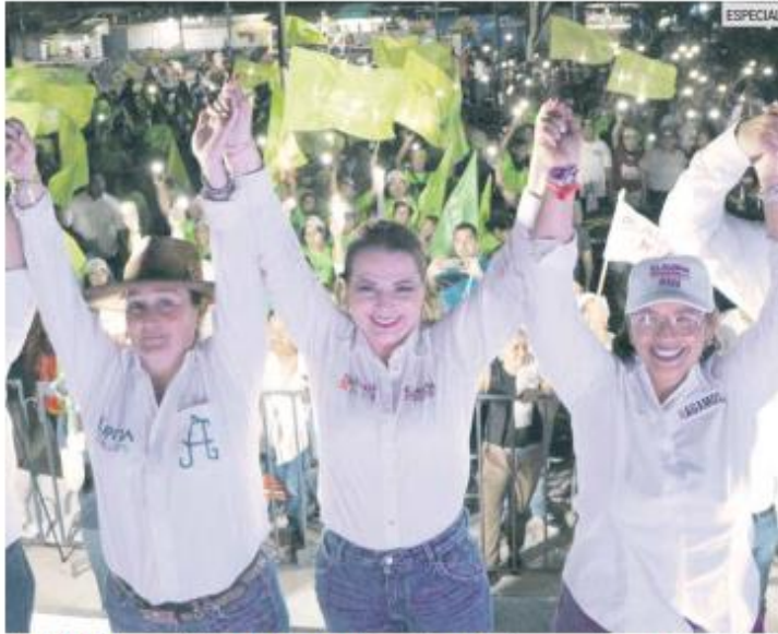
EQUIPO. La candidata de Morena dijo que trabajará en coordinación con Claudia Sheinbaum en beneficio de Tlaquepaque.