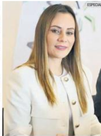
PLAN. La aspirante escuchó a integrantes del CCIJ.

En cuanto a la seguridad, González destacó el eje “Guadalajara Segura”, donde se compromete a trabajar incansablemente para fortalecer la seguridad pública, colaborando estrechamente con las fuerzas del orden y pro-