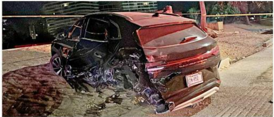
Una camioneta ajena a los hechos resultó dañada.

Las autoridades se enteraron que el día del ataque fueron alcanzadas por el ocupante de un Mercedes-Benz blanco, quien escapó tras realizar los disparos. El vehículo en el que iban las adolescentes chocó después con una camioneta.