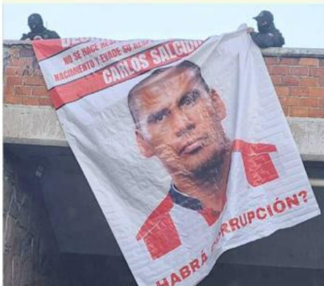
Los mensajes señalaban al ex jugador como deudor.