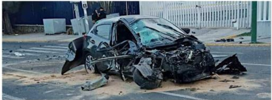
Las jóvenes viajaban en un vehículo compacto.

La menor tuvo una sola lesión, mientras que la mayor recibió dos impactos en el estómago, así como algunas contusiones.