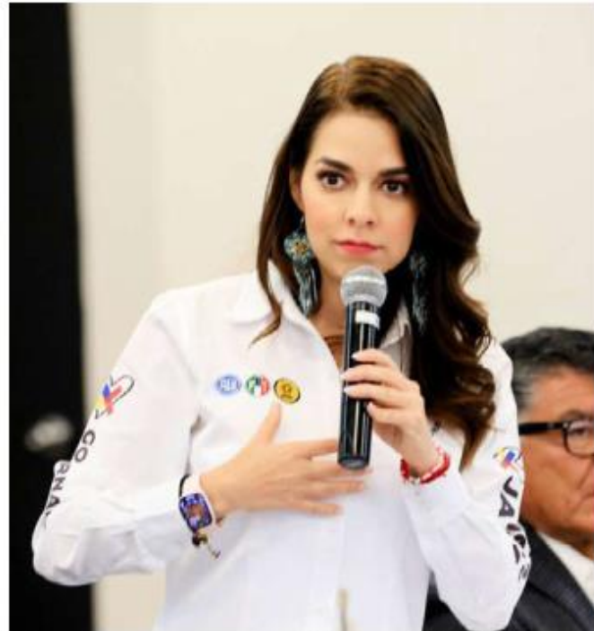
Necesario recuperar apoyos del campo.

Haro reiteró la necesidad de recuperar los apoyos al campo, la educación, las mujeres, la innovación y la tecnología, ya que, dijo, estos apoyos permiten subir el desarrollo de los jaliscienses en las 12 regiones del estado. ■