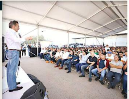
Pablo Lemus tuvo un recorrido este viernes por Zacoalco de Torres, Atemajac de Brizuela y Tapalpa.