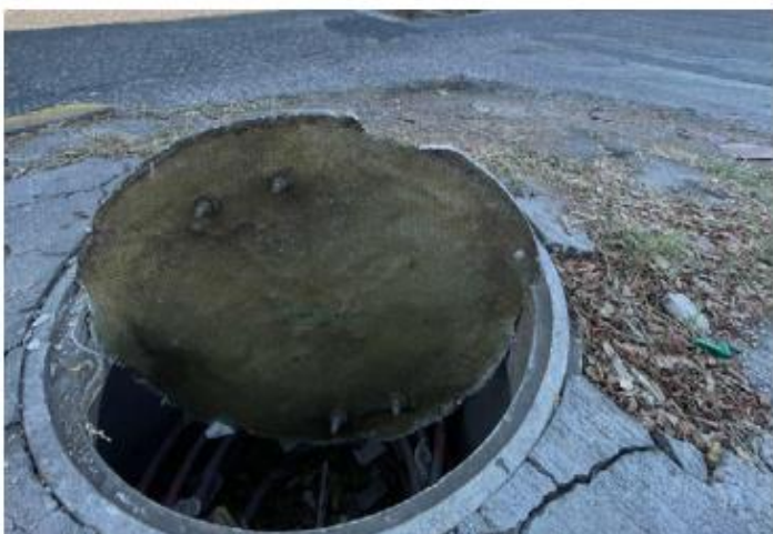
VIALIDAD. Más de un mes llevan estos registros sin tapa sobre la lateral de Lázaro Cárdenas, a una cuadra de la clínica 46 del IMSS.