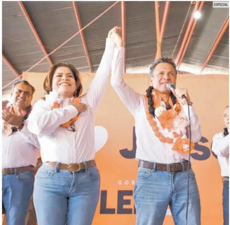
NARANJA. En Zacoalco de Torres, el aspirante recibió un collar que significa apoyo y respaldo.

Para impulsar el desarrollo económico, el candidato emecista refirió que se promocionará este municipio "para invitar a las personas a disfru-