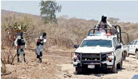
Integrantes de colectivos hallaron a una víctima.