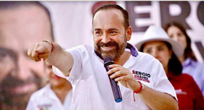
El morenista estuvo con pobladores de las colonias de Zalatlán, Fuente de San Elías y Rey Xólotl.

Candidatos a la Presidencia Municipal de Tonalá tuvieron reuniones con pobladores de diferentes colonias del Municipio para prometerles mejoras en sus entornos y abogar por servicios que le competen al Estado