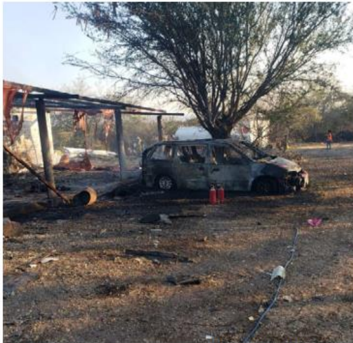
Es el segundo día consecutivo que explota un taller dedicado a la pirotecnia en esta entidad. UT