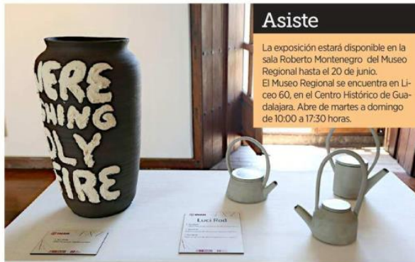
■ Obras de Luci Rod que son parte de la muestra "Dentro de la carne hay una forma espaciosa".

emergentes u otras ya no tanto, que merecen mostrar su trabajo porque han reflexionado sobre temas muy importantes. Aquí la mayoría de las artistas son muy jóvenes con un potencial que estamos tratando de alentar. En ese sentido trabajamos el discurso con algunas de ellas para adaptarlo a esta sala del museo", explica Rubén Méndez.