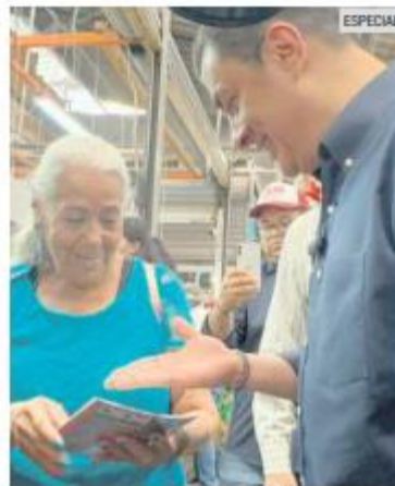
VISITA. “Chema” se entrevistó con locatarios del Mercado Felipe Ángeles.

Los comerciantes también destacaron la necesidad de abordar temas como la gestión de residuos, la seguridad y, especialmente, el mantenimiento y la revitalización de los espacios comerciales.