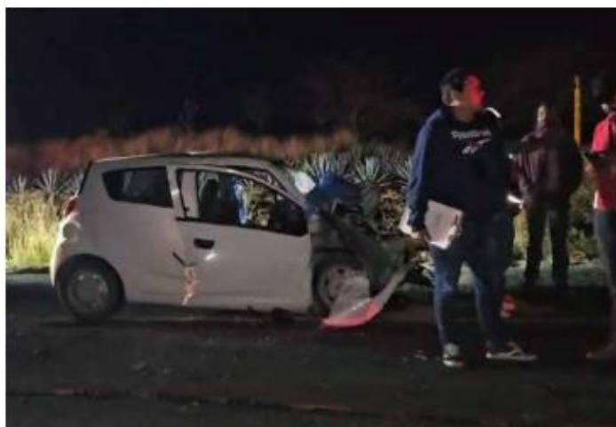
CARRETERA. Una pareja que viajaba a bordo de un vehículo particular falleció luego de impactarse en contra de un camión.