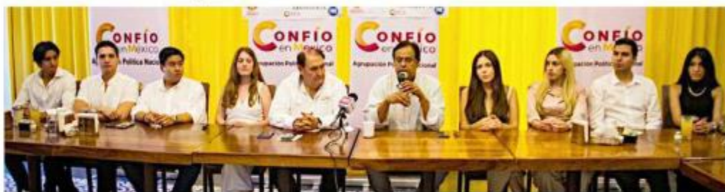
Integrantes de Confío en México, en Puerto Vallarta, promovieron la campaña de Voto Útil.