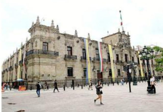
■ En diciembre concluye la gestión de Enrique Alfaro.

“Empezamos esta semana con los simulacros de entrega a la Sección Constitucional y esto lo hicimos con los enlaces de todas las dependencias del Ejecutivo, dí-