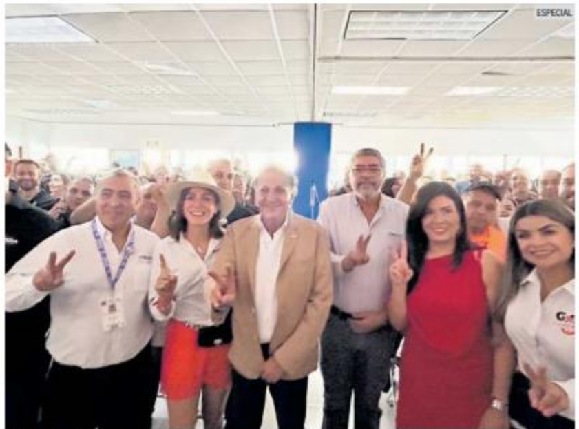
DIÁLOGO. El aspirante prometió la creación de un Escuadrón Vial.

El candidato subrayó que durante su gestión se realizaron más de mil 800 compromisos, de los cuales se ha cumplido 95%. Sin embargo, reconoció que aún queda mucho por hacer en Zapopan, especialmente en áreas co-