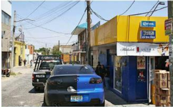
Los hechos ocurrieron en Loma Bonita Ejidal.