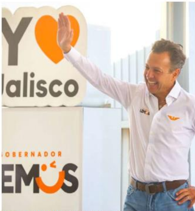
Crearé un tren eléctrico.