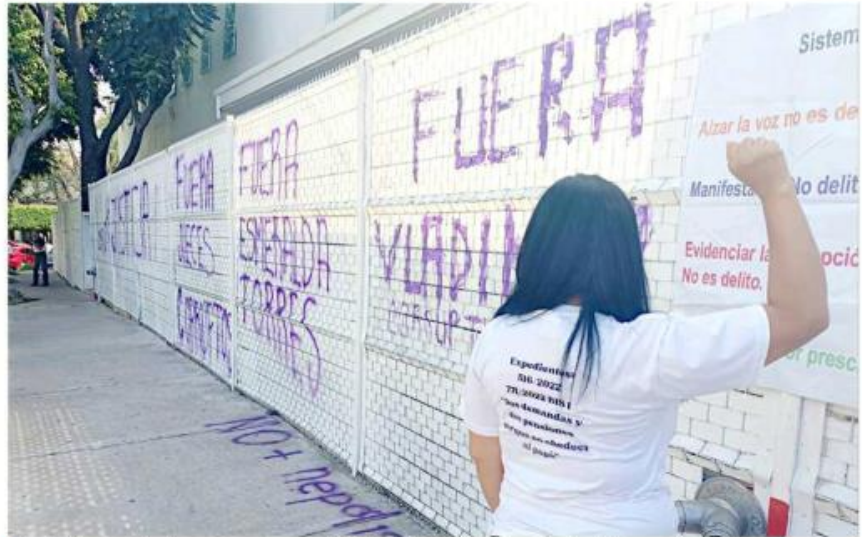
Activistas protestaron por el caso de Gabriela en el Centro de Justicia para las Mujeres.

tracorrente ante un sistema que beneficia más a los agresores que a las víctimas.