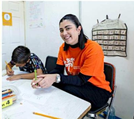
El objetivo que se tiene es ayudar a comunidades que están en situación de vulnerabilidad.

torado, y coordinados por académicos expertos en distintas áreas.