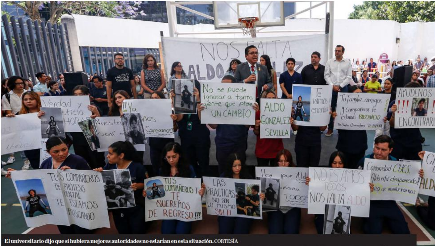
El universitario dijo que si hubiera mejores autoridades no estarían en esta situación.