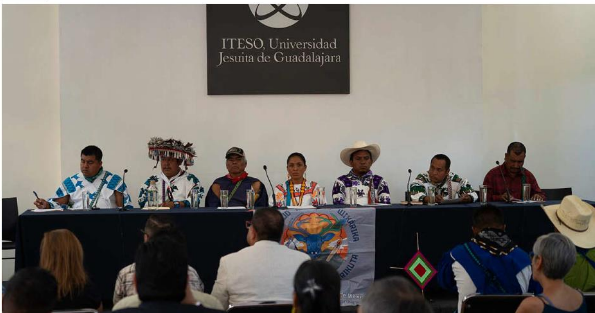
Foro "Wirikuta: 13 años en defensa del territorio sagrado" en el ITESO.