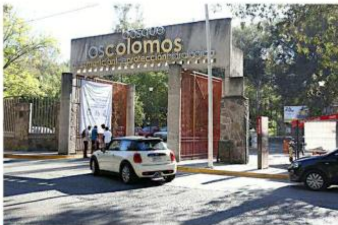
Los trabajos comenzarán el 30 de abril.

Además, el organismo puso a disposición de la ciudadanía la línea de SIAPATEL 333-668-2482 y las redes sociales oficiales para conocer las acciones que realiza el Siapa y para cualquier duda, queja o aclaración X: @siapagdI y Facebook: siapagdI.