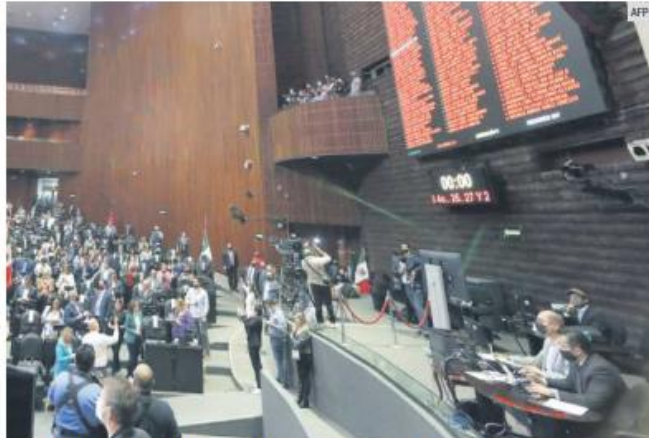
OBSERVADOS. El pleno del Congreso de la Unión podría determinar si procede o no esta reforma.

Se prevé que las modificaciones a la Ley de Amparo sean discutidas en el Congreso de la Unión donde los diputados de oposición ya advirtieron que tramitarán una acción de inconstitucionalidad.