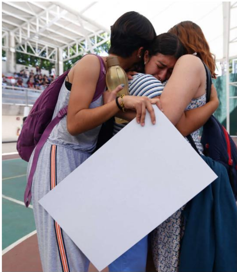
Acusan de revictimización a las autoridades.

En punto de las 12:00 horas, la comunidad estudiantil y ad-