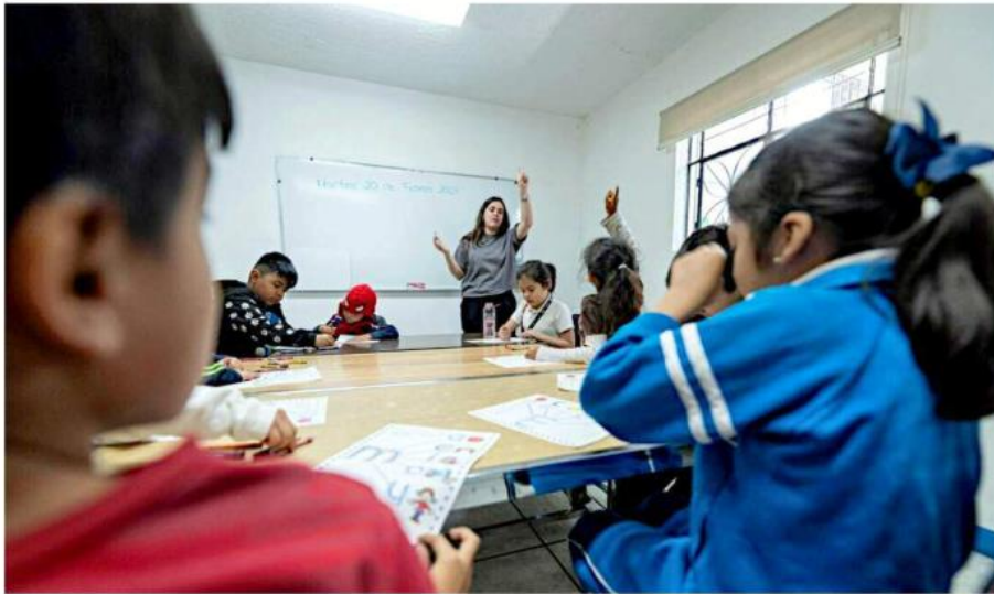
En dicho Centro se dan apoyos psicoeducativos a través de diferentes proyectos.