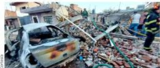
■ En el estallido resultaron con daños varias casas y vehículos.

En el rescate participaron Bomberos de La Barca, Jamay, Atemilco y Ocotlán. Además, oficiales de la comandancia de Poncitlán de Protección Civil y elementos del grupo USAR de Guadalajara, con perros entrenados acudieron para buscar personas atrapadas.