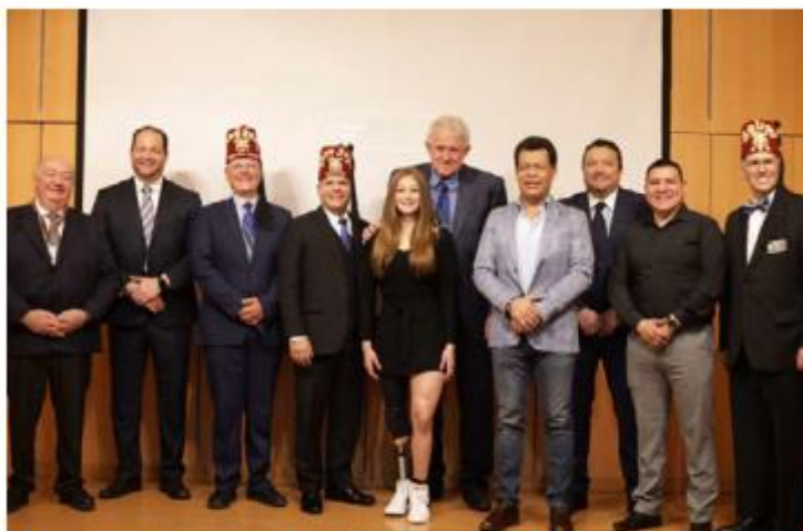
SALUD. Fue inaugurada la clínica ortopédica-pediátrica de Shriners Children's, la cual brindará atención médica especializada, independientemente de la capacidad de pago de las familias.