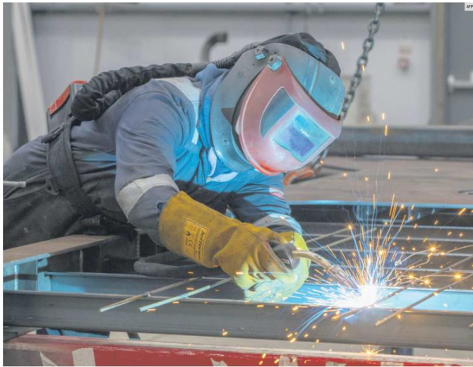
ENCABEZA LA GENERACIÓN DE EMPLEOS EN EL ESTADO. De acuerdo con datos del Instituto de Información Estadística y Geográfica de Jalisco (IIEG), la industria de la transformación es una de las que más puestos laborales generó en la Entidad durante el primer trimestre de este año.

Experto de la Coparmex señala que esto se debe al incremento de la productividad, capacitación y mejora de habilidades