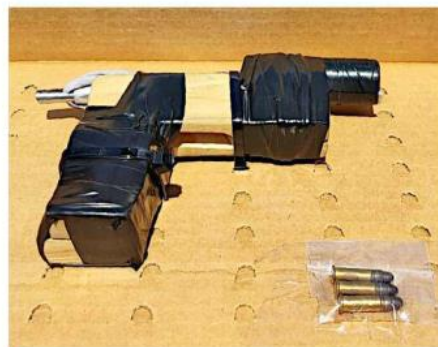
La elaboración de armas hechizas se ha sofisticado.

Aunque el académico estimó que las armas hechizas pueden ser utilizadas por pandillas o criminales que no tienen la capacidad económica para comprarlas en el mercado negro, recordó que en la ciudad ya se han registrado aseguramientos de este tipo de armas junto con otras originales.