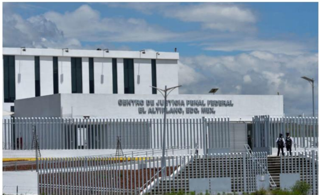
La madrugada de este martes, el hermano de El Mencho salió por su propio pie del penal del Altiplano, en el Estado de México.