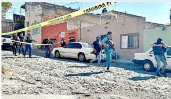
Los hechos ocurrieron en la Colonia Las Huertas.

El hombre, quien era buscado por homicidio, fue abatido.