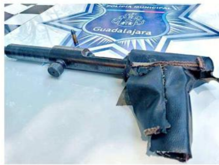
No tienen número de serie, lo que dificulta su rastreo.