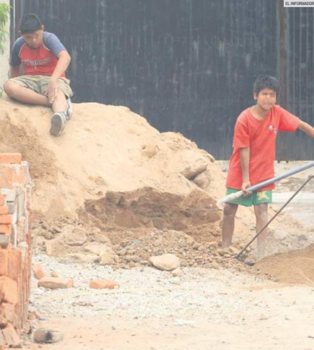
NIÑOS EN EL MERCADO LABORAL. Expertos señalan que la crisis económica que provocó la emergencia sanitaria por el COVID-19 provocó que más menores salieran a buscar trabajo para ayudar a sus familias.

"El crimen organizado ve en ellos un recurso humano manipulable, prescindible, de bajo costo y cuya ausencia en la actividad criminal no afecta la operación ni la estructura delictiva", se acentuó en el documento.