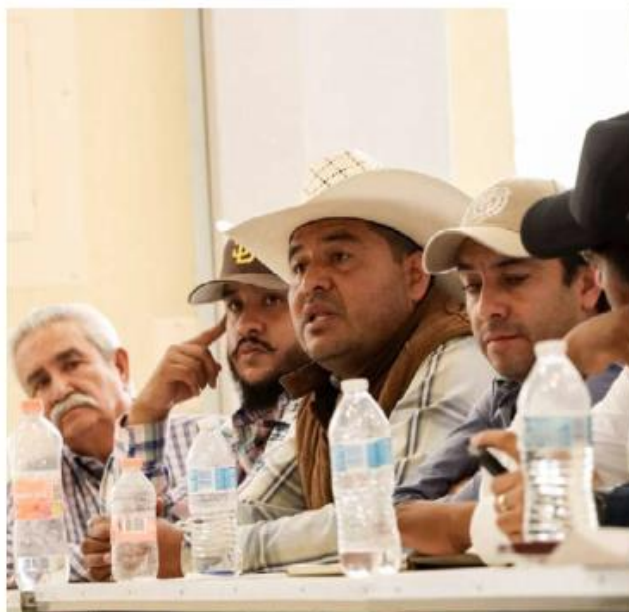
Representantes del movimiento "Amigos del Campo" se reunieron este martes con las autoridades estatales. ESPECIAL