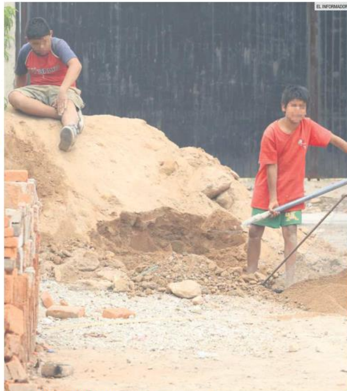
NIÑOS EN EL MERCADO LABORAL. Expertos señalan que la crisis económica que provocó la emergencia sanitaria por el COVID-19 provocó que más menores salieran a buscar trabajo para ayudar a sus familias.

"El crimen organizado ve en ellos un recurso humano manipulable, prescindible, de bajo costo y cuya ausencia en la actividad criminal no afecta la operación ni la estructura delictiva", se acentuó en el documento.