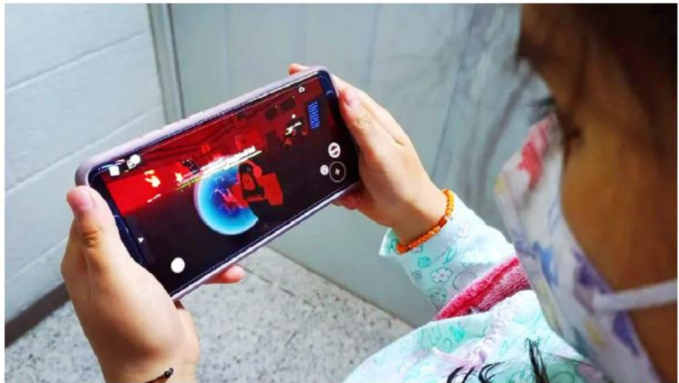
Estudios revelan que algunos niños pequeños mejoran en sus síntomas cuando los padres eliminan el uso de las pantallas.