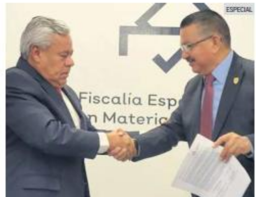
CONVENIO. Las Fiscalías que combaten delitos electorales y corrupción se ayudarán entre sí.