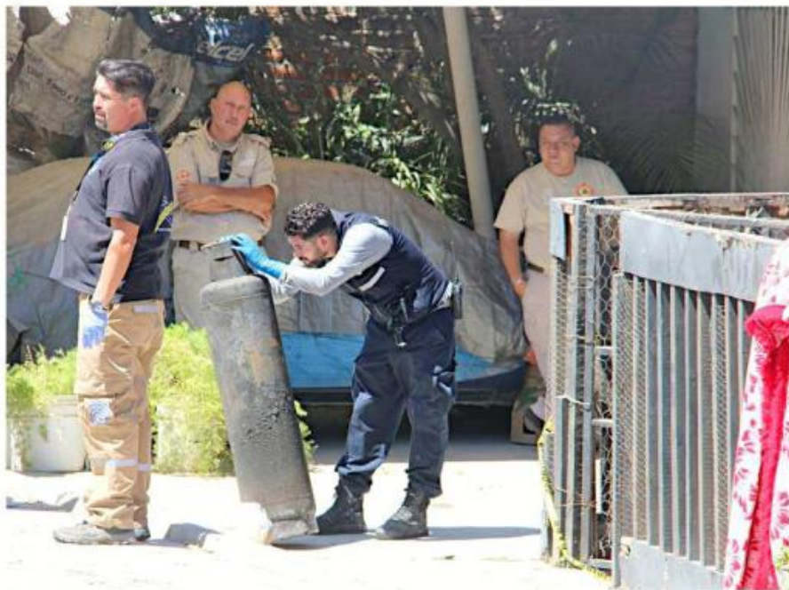
Los rescatistas aseguraron un cilindro de gas.

De acuerdo con los familiares de las víctimas, en la casa vivían ambos con la mamá del niño.