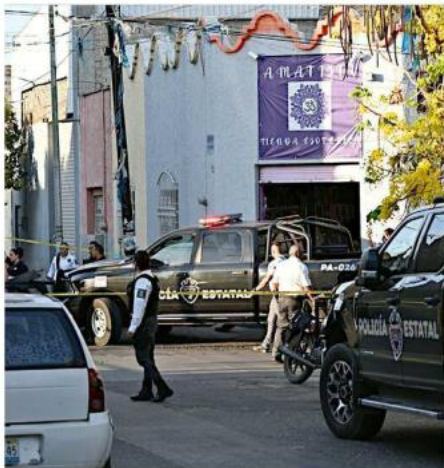
La víctima fue localizada en una tienda esotérica.