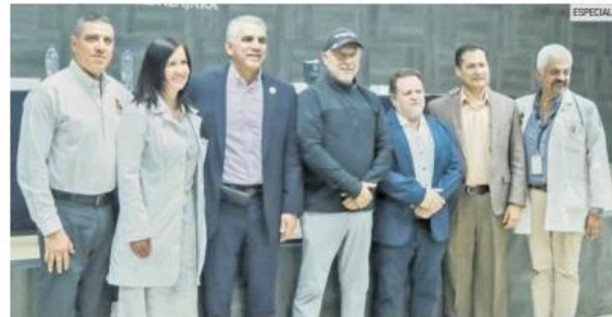
META. Tanto el Nuevo Hospital Civil de Guadalajara como los clubes rotarios que respaldan la iniciativa “Vivan los Niños con Cáncer”, esperan superar el millón de pesos en recaudación.

Becerra explicó que hay una meta a superar: el promedio de curación de los pacientes. En la ac-