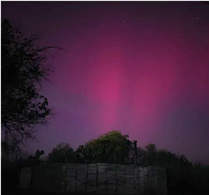
Las tormentas solares no representan un daño directo a la salud de las personas. ESPECIAL

Astronomía. Académico explica que la intensificación del fenómeno podría causar alteraciones en satélites y dispositivos