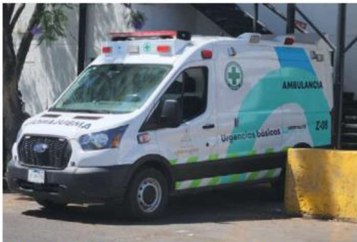
ATROPELLO. Una ciclista de 54 años iba por la glorieta de Boulevard Bugambilias y Circuito De Las Flores, cuando un hombre la embistió. Más tarde murió en la Cruz Verde de Las Águilas.