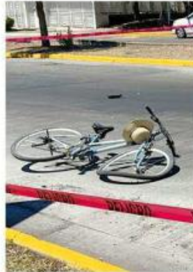
La bicicleta fue asegurada.