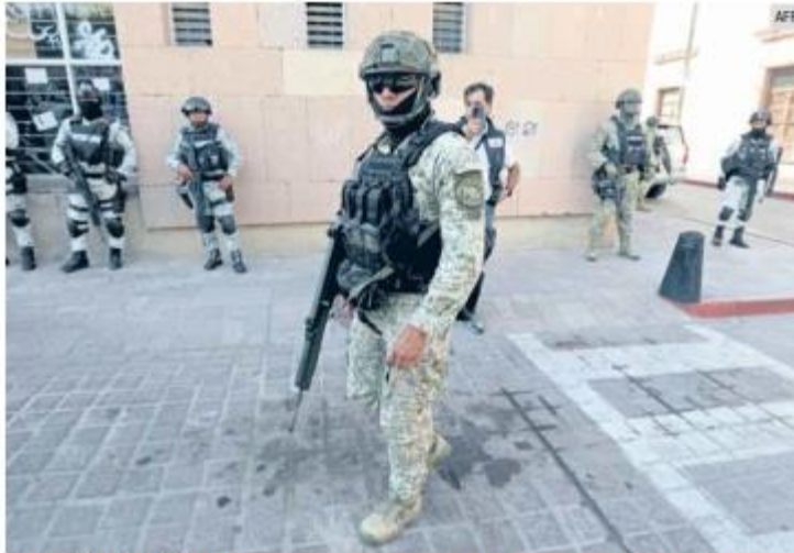
GUARDIA NACIONAL. El organismo se encarga de proteger a los candidatos al Senado, gubernatura estatal y diputaciones federales.