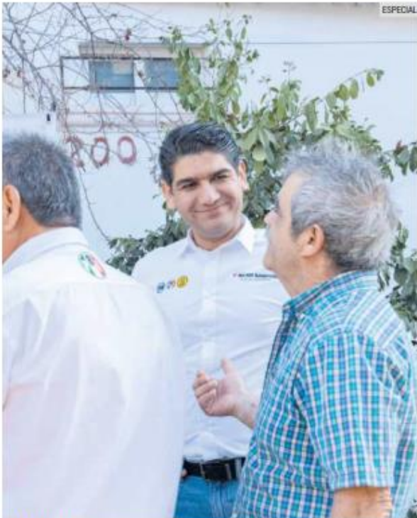
DIÁLOGO. El priista habló con los vecinos.