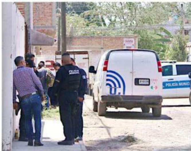
■ El crimen ocurrió en Lomas del Aeropuerto.