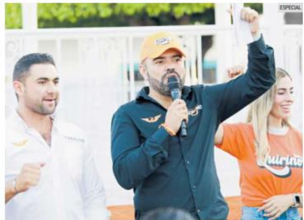
PROTECCIÓN. A las costumbres y sitios con tradición histórica.

Dijo que esta propuesta que tiene en plan sumaría a los dueños de los ranchos y habitantes de ejidos, con quienes promoverá las acciones a seguir y con ello también busca una mayor cercanía con los habitantes de estas localidades.