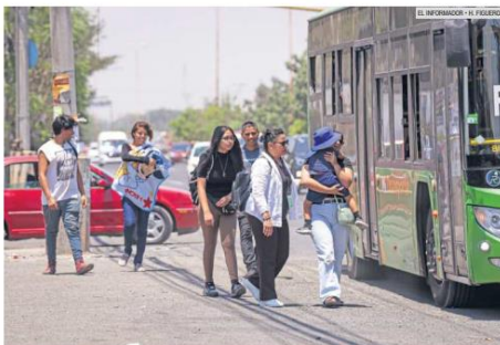
ESTUDIO. Mientras en Guadalajara solamente 1 de cada 10 calles no tienen banqueteta, en El Salto son la mayoría.

Un estudio del organismo Coalición Movilidad Segura indicó que ambas vialidades son las dos más peligrosas en cuanto a los accidentes viales.