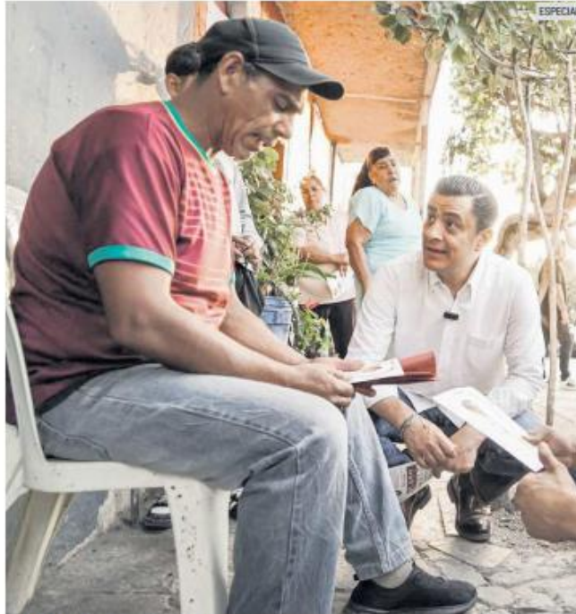
VISITA. El aspirante al Gobierno tapatío se reunió con vecinos.