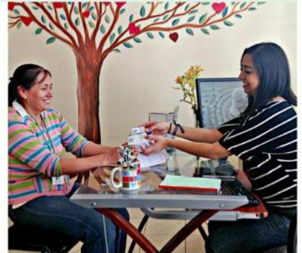
Con el paso de tiempo, ha ido ampliando sus servicios y ahora apoya con estudios e incluso asesoría legal a quienes no reciben su tratamiento.