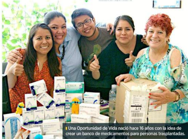
Una Oportunidad de Vida nació hace 16 años con la idea de crear un banco de medicamentos para personas trasplantadas.

"En principio se enfocaba sólo en pacientes trasplantados o que estaban en proceso de, pero las demandas de servicios y la creciente de pacientes en enfermedad re-