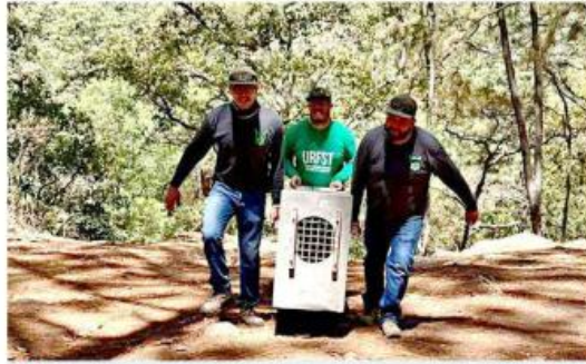
El puma fue trasladado a la Sierra de Quila.