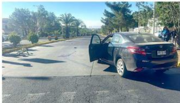
El conductor de un automóvil compacto fue retenido.

Personal del área de puesto de socorros de la Fiscalía del Estado indagará cómo ocurrieron los accidentes.