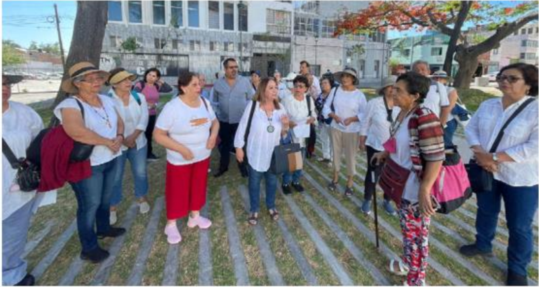
Los inconformes dicen que los únicos afectados fueron los de esta dependencia. KARLAV. RODRÍGUEZ