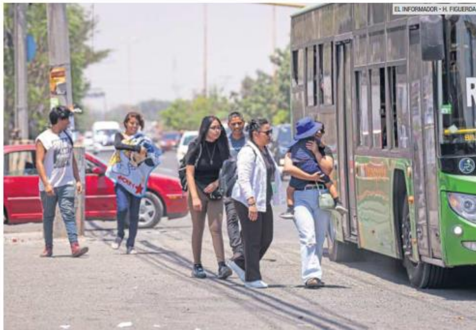
ESTUDIO. Mientras en Guadalajara solamente 1 de cada 10 calles no tienen banqueteta, en El Salto son la mayoría.

Un estudio del organismo Coalición Movilidad Segura indicó que ambas vialidades son las dos más peligrosas en cuanto a los accidentes viales.