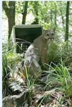
Expertos consideran que huía de los incendios.

A pesar de ser carnívoro, no agredió a animales