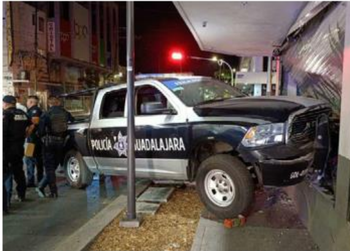
GDL. Una patrulla chocó contra una tienda de pinturas ubicada en Enrique Díaz e Hidalgo, en la colonia Americana. Una conductora trató de dar vuelta cuando fue impactada por la camioneta.