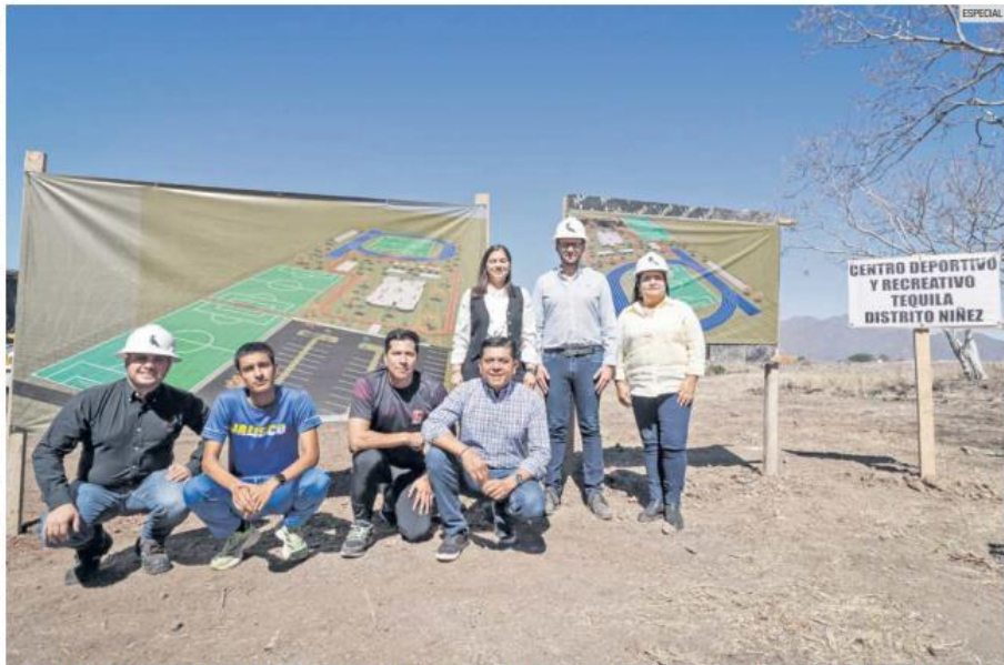
OBRA. El complejo ocupará más de 15 mil metros cuadrados y se enfocará en el desarrollo físico y mental de las familias de Tequila y municipios aledaños.

no de más de 1.5 hectáreas y de suministrar a su equipo especializado de ingenieros para la obra.