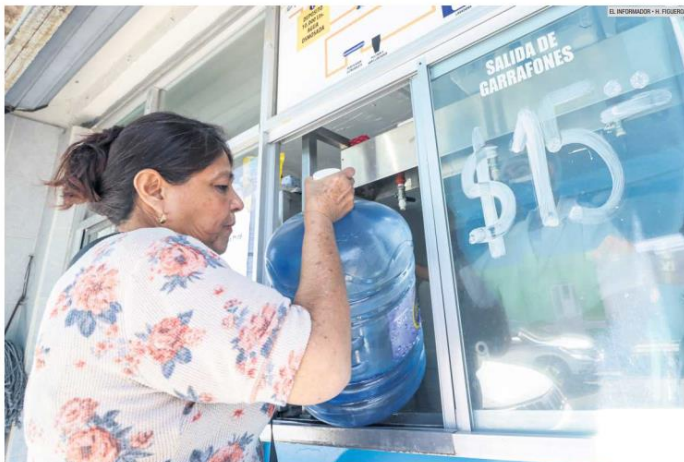
TENDENCIA. La población opta por rellenar los garrafones en estos establecimientos, con un costo de entre los 11 y 26 pesos.

Cada día incrementa la cantidad de estos negocios en la ciudad, ante la demanda de consumidores debido a su bajo costo