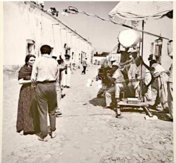
■ Fotografías tanto de la película de Luis Buñuel tomadas por Manuel Álvarez Bravo, como de otros episodios del cine mexicano, con María Félix.