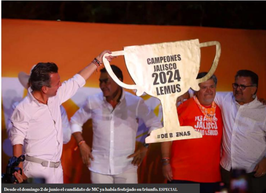
Desde el domingo 2 de junio el candidato de MC ya había festejado su triunfo.