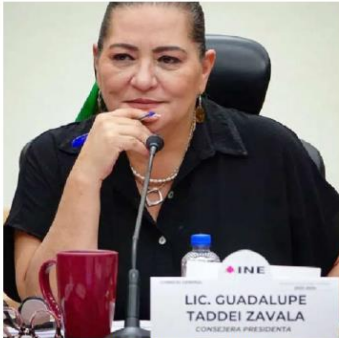
Pidió a los actores políticos de Jalisco guardar la calma. ESPECIAL

“Nuestra recomendación es que guarden la calma los actores políticos en el estado de Jalisco y que dejen trabajar de manera tranquila, que permitamos el trabajo de manera