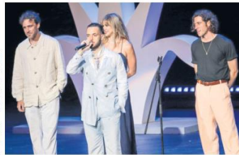
C. TANGANA. El músico (al centro) llegó a la ciudad para presentar su documental: "Esta ambición desmedida".