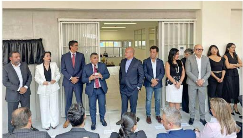
La nueva sede se ubica en Paseo del Rincón del Diablo número 38.

“Aquí van a estar las oficinas de 5 consejeros de la