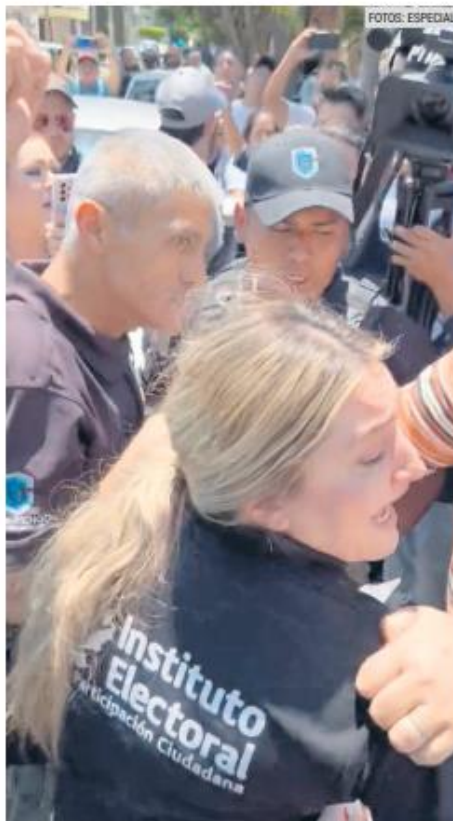
TRIFULCAS. En la ciudad se han presentado disturbios en las juntas distritales al señalar “un fraude”.

“Desde luego no voy a renunciar a mi trabajo. Yo soy funcionaria electoral desde hace más de doce años, le he dedicado buena parte de mi vida profesional a esta función, y yo estoy convencida del profesionalismo con el que desem-