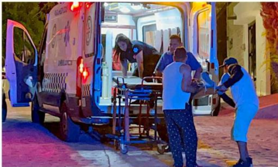
■ Cuatro hombres fueron atacados a balazos en la Colonia El Tapatio.

Los hechos ocurrieron en Calle Mariano Escobedo y Bugambilias, donde quedó sin vida una de las víctimas,