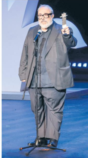
ALEX DE LA IGLESIA. El director español recibió el Mayahuel Internacional.