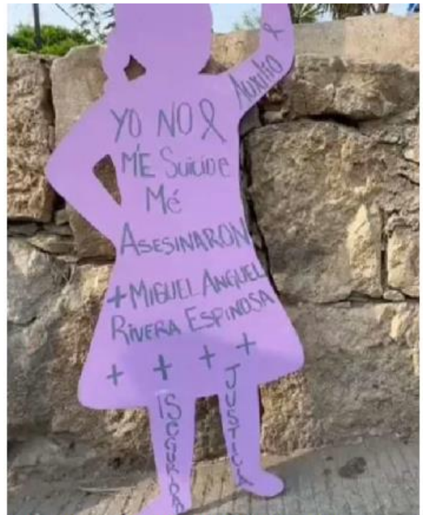
Ven retroceso en lucha contra la violencia de género. ESPECIAL

En respuesta a esta falta de acción legislativa, se espera que grupos como "Madre yo sí te Creo" y el Frente Nacional Contra la Violencia Vicaria emitan un comunicado en los próximos días, expresando su postura y anunciando posibles acciones para abordar esta preocupante omisión en la legislación estatal. —