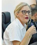
Ramírez Höhne ya presentó denuncias ante las autoridades correspondientes.

Ayer por la tarde, ante el reclamo de Morena de que el INE contabilizara los votos de Jalisco, debido a presuntas irregularidades en el proceso comicial, la presidenta de ese organismo federal, Guadalupe Tadei, afirmó que ya no es el momento jurídicamente oportuno ni viable.