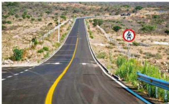
La carretera Colotlán-Aguascalientes tiene una longitud de 36.5 km y se invirtieron 436 millones de pesos.

La inversión en ambas carreteras supera los mil 600 millones de pesos.