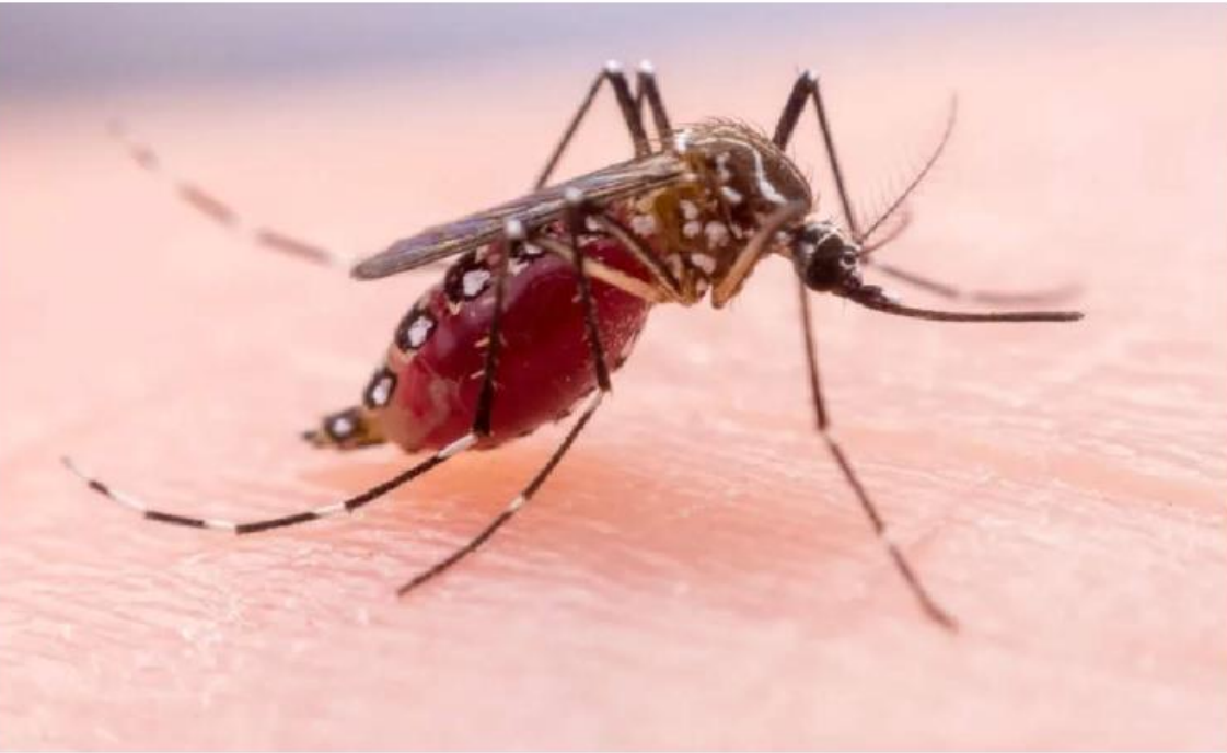
Humedad y calor crean condiciones perfectas para reproducción del mosquito. ESPECIAL