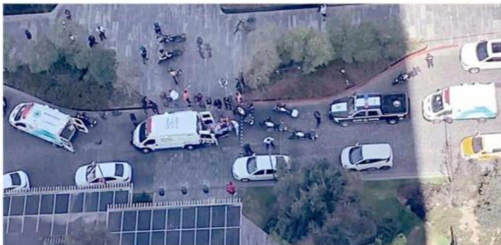
■ El ataque del jueves dejó heridos a un abogado y un mesero.

“Es una lástima que la seguridad no esté al nivel, pues no bastan elementos de seguridad corporativa; se requieren elementos de seguridad capacitados y entrenados que resguarden la zona del centro comercial y cierto perímetro fuera de él, que blinden y brinden protección, vigilancia y sea una zona segura para todos”.