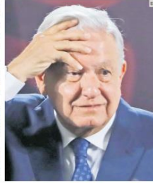
"Lo que propongo es que se espere a que se cuenten los votos (en Jalisco), que se revisen las actas. Que no se hagan juicios adelantados"

"El IEPC informa que, en el curso de los cómputos, en todas nuestras sedes distritales y municipales, metropolitanas, se encuentran personas manifestándose y, en algunas de ellas, se verifica la presencia de personas armadas que dicen pertenecer a un partido político. Nuestro personal ha sufrido agresiones físicas durante el desempe-