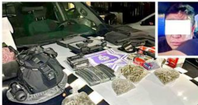
El ex empleado portaba un arma y cartuchos.

No se detalló si el arma pertenecía a la dependencia estatal.