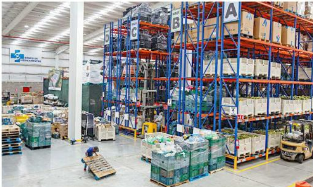
■ Los alimentos que reciben de comerciantes y productores son aquellos que no son “atractivos” comercialmente.

“Nosotros consideramos que todavía tenemos mucho más que hacer porque hay todavía muchísimas más personas en inseguridad alimentaria (...) hay una necesidad enorme y nosotros queremos hacer nuestro trabajo cada día mejor”, apuntó Romo Rivas.