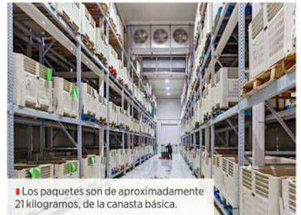
■ Los paquetes son de aproximadamente 21 kilogramos, de la canasta básica.

comunidad detectamos a las personas que están en esta condición, les aplicamos un estudio socioeconómico y una vez que tenemos ya identificada la necesidad, programamos la entrega de paquetes alimentarios”, detalló Romo Rivas acerca de la logística.