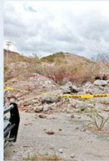
■ En Los Colorines fue localizado un hombre semienterrado.

ron apoyo a personal de Protección Civil y Bomberos para extraer los cuerpos y entregarlos al Servicio Médico Forense.