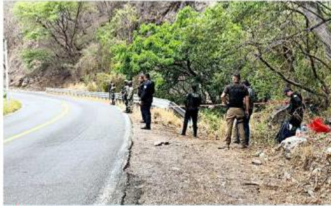
■ Dos cuerpos en avanzado estado de descomposición fueron hallados junto a la Carretera a Saltillo.