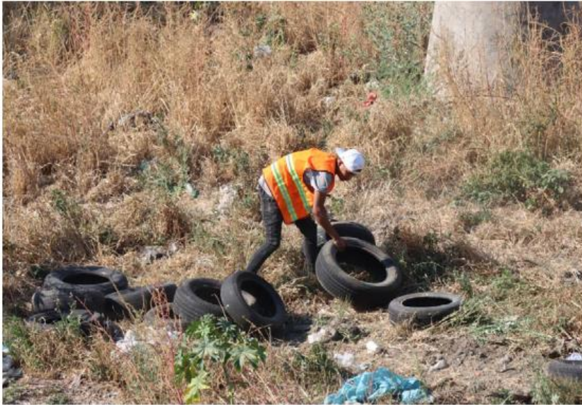
Personal municipal realiza labores de limpieza para evitar inundaciones.