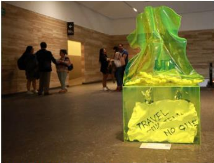
INICIATIVA. En Zapopan promueven la cultura al aire libre con la Ruta Escultórica en la plaza comercial Midtown, con 10 obras de siete artistas internacionales en su novena edición.