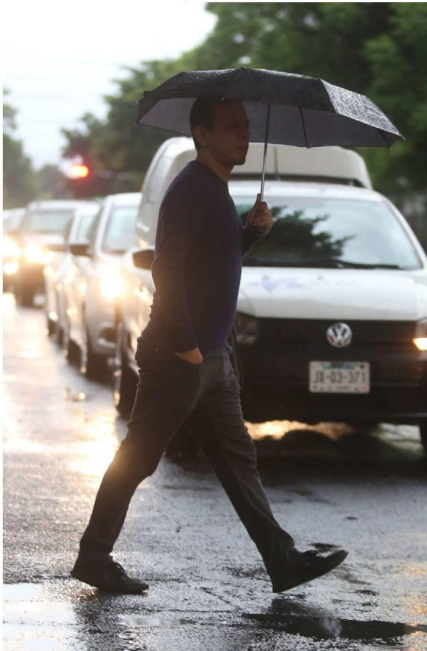
Ya comienzan las precipitaciones en la ciudad.

Operativos. Este año se han identificado 15 nuevos puntos de inundación en la Zona Metropolitana de Guadalajara; gobiernos implementan acciones para prevenir y atender emergencias de la ciudadanía