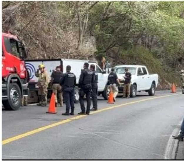
Se calcula que tenían 15 días de haber muerto. USITOLEDO