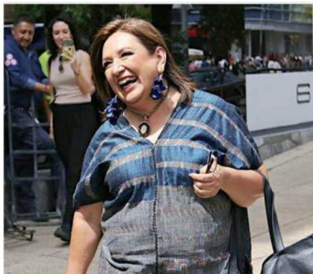
■ Gálvez visitará Guadalajara los días 4 y 5 de julio.

Obtuvo un total de un millón 384 mil 825 sufragios, 336 mil 96 votos menos que los que logró la ganadora de la contienda, la ex candidata de Sigamos Haciendo Historia, Claudia Sheinbaum.