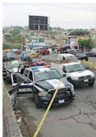
El accidente sucedió a la altura de la Colonia Agua Fria.

Después de tomar datos en el lugar, los peritos trasladaron el cadáver del peatón a