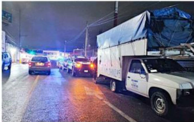
Los sujetos fueron interceptados por oficiales de Zapopan en la Avenida Juan Gil Preciado.

Ella llamó al 911 y descubrió, por medio de videos proporcionados por sus vecinos, que varios sujetos habían sacado muebles y otros objetos de valor para luego subirlos a una camioneta Nis-