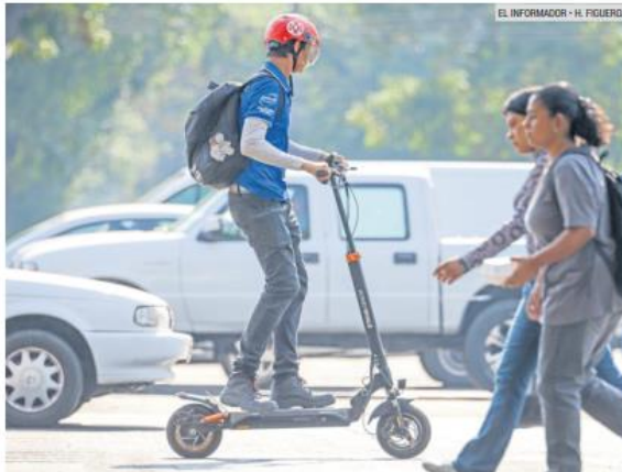
PRECAUCIÓN. Usuarios de patines deben utilizar medidas de protección.

Sin embargo, tanto en tiendas departamentales como en empresas que venden productos en líneas, se venden variedad de patines eléctricos que superan la velocidad estipulada, por ejemplo, el promedio observado por este me-