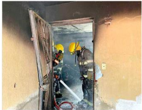
■ Otro percance similar ocurrió en Lomas del Paraíso I.

El fuego se propagó en la finca de un nivel de Ha-