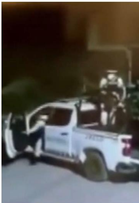
Elementos federales realizaron la detención.