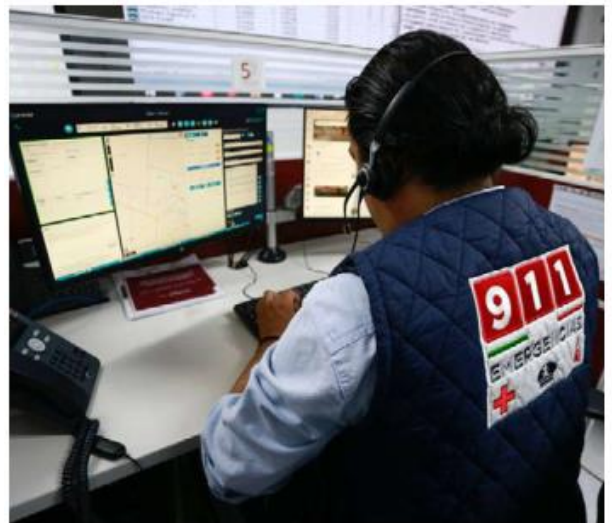
Emiten recomendaciones para el reporte.

Según el análisis, julio fue el mes en que más reportes se realizaron al sumar 582, seguido de agosto con 356 y septiembre con 92 llamadas. Mientras que las horas del día en que más inundaciones se reportaron ante el 9-1-1 fueron las 19:00 horas con 130 llamadas, 00:02 horas con 111 y las 00:03 horas con 94. —