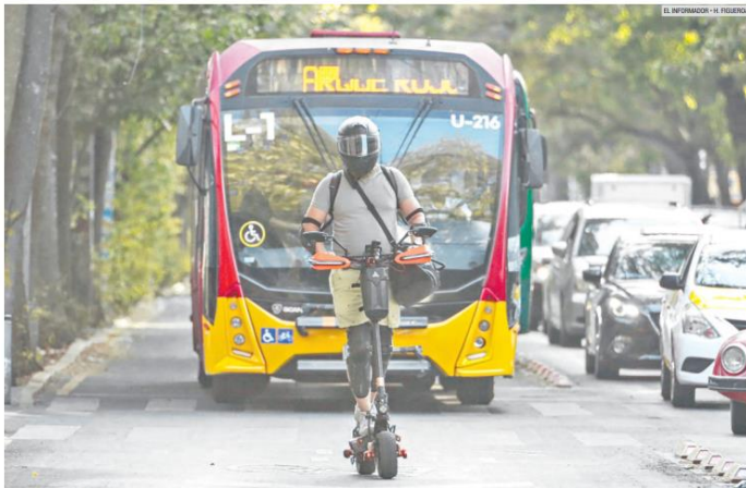
ECONÓMICOS Y RIESGOSOS. Mientras los patines eléctricos se ofertan desde los cinco mil pesos en la ciudad, el riesgo de accidente es alto. Hasta el momento no hay reglas claras ni sanciones contra estos conductores.

Hay un incremento de estos vehículos en las avenidas y centros históricos, por lo que organizaciones civiles piden regularlos