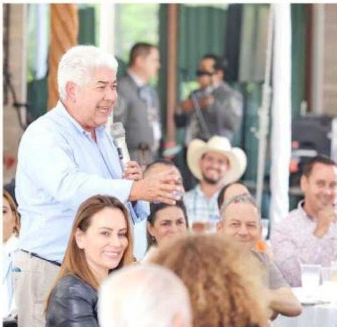
■ Ramírez Acuña indicó que necesitará la fuerza de sus partidos.

“Voy a cumplir una vez más con mi tarea en el Senado de la República. Seré la voz de los mexicanos, pero requiero de ustedes”, dijo el