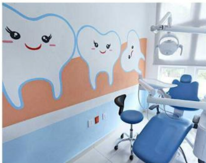
■ El objetivo es garantizar la salud bucal, en especial de niñas, niños y adolescentes.

Asimismo, propone que al inicio de cada ciclo escolar el Estado entregue un paquete de salud bucodental, a los alumnos de educación básica en planteles públicos.