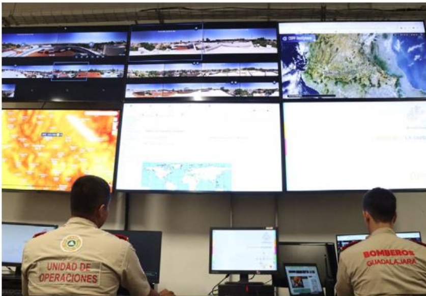
Instala Guadalajara el Centro de Monitoreo e Inteligencia para predecir afectaciones.

sencia del fenómeno, la Coordinación Municipal y el C5 de la Comisaría de Seguridad Ciudadana de Guadalajara emiten un aviso que deriva en el despliegue de personal operativo. El municipio cuenta con un análisis de los sitios de inundación en Guadalajara, los acumulados de lluvia y con qué intensidad cae la lluvia en estos sitios.