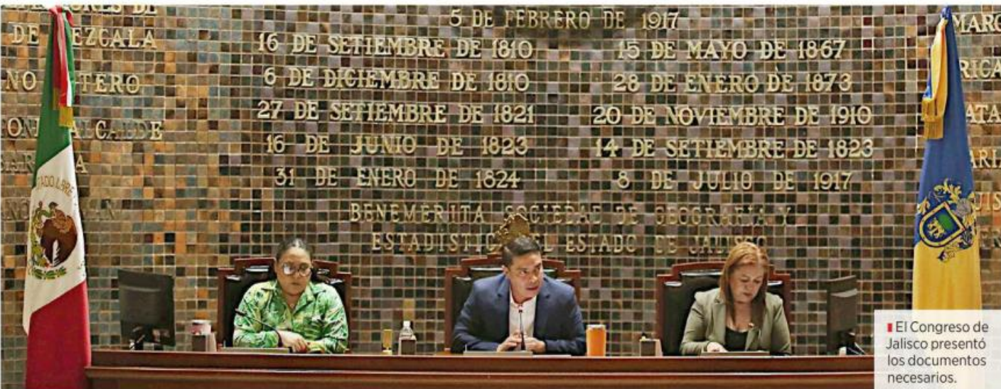
El Congreso de Jalisco presentó los documentos necesarios.

Solventó inconsistencias de la Cuenta Pública 2022