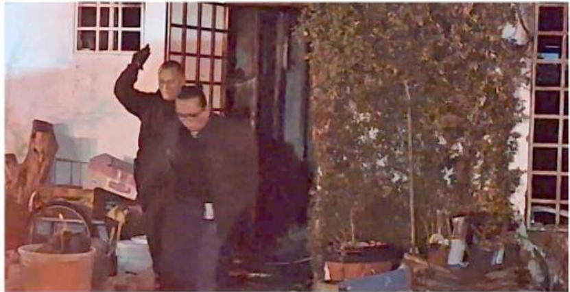
■ Dos personas fallecieron en la Colonia Altus Bosques.

Aún no se establecen las causas del incendio, pero a la vivienda acudieron peritos del Instituto Jalisciense de Ciencias Forenses para