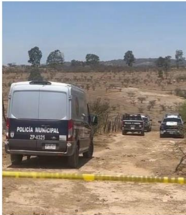
Autoridades investigan el hallazgo. JUAN CARLOS MUNGUÍA

Los oficiales municipales llegaron a un domicilio en el cruce de Valle manzano y Valle de Limón Real, donde localizaron a la víctima. Según las primeras investigaciones, dos sujetos llegaron a la finca y tocaron dos veces, al abrir la puerta, le dispararon directamente y huyeron. En el lugar se encontró un cargador abastecido,