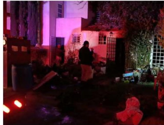
El siniestro fue en una casa de Tlajomulco. VICENTE TORRES

Según lo marca el protocolo, se solicitó la presencia de personal de Servicios Médicos Municipales; al llegar al lugar, los paramédicos confirmaron el deceso de ambas víctimas; policías municipales acordonaron el lugar y personal del Instituto Jalisciense de Ciencias Forenses realizó el peritaje en el sitio. Hasta el cierre de esta edición, se desconocía la causa del incendio. —