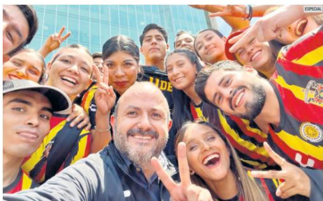
AVANCES. El rector Ricardo Villanueva destaca los programas de la UdeG, con reconocimiento internacional.

En el estudio se evalúan temas como fin de la pobreza, hambre cero, salud y bienestar, educación de calidad, igualdad de género, agua limpia y saneamiento, energía asequible y no contaminante, trabajo decente y crecimiento económico, industria, innovación e infraestructura, así como reducción de las desigualdades, ciudades y comunidades sostenibles y acción por el clima, entre otros.