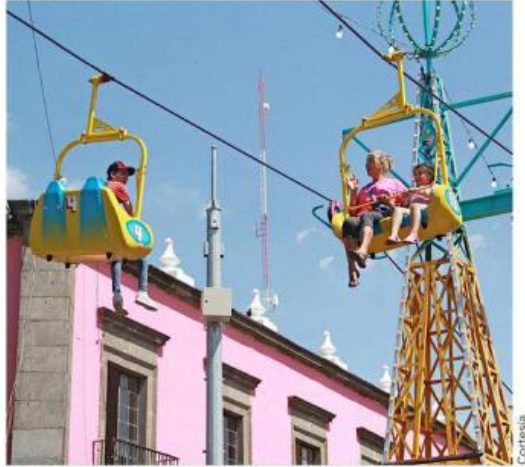
Diversas actividades se llevarán a cabo.