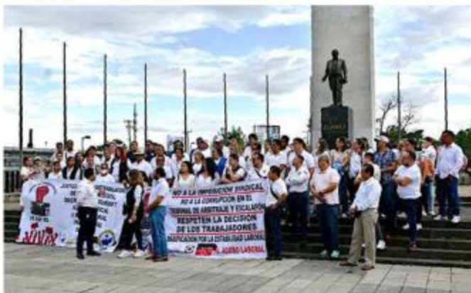
■ La protesta fue realizada en la Plaza Juárez.

“Estamos aquí manifestándonos, le estamos pidiendo al Gobernador que nos haga caso, que tome cartas