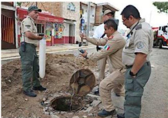
■ Ayer se realizaban análisis en el drenaje. Protección Civil y Bomberos del Estado descartó riesgo de explosividad.

Sostuvo que especialistas del Centro de Estudios de la Tierra, de la UdeG, hacen un estudio geotécnico de descar-