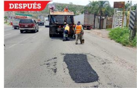
La SIOP realizó el bacheo entre Periférico y el Aeropuerto.

pero la SIOP precisó que este punto sería intervenido entre ayer y hoy.