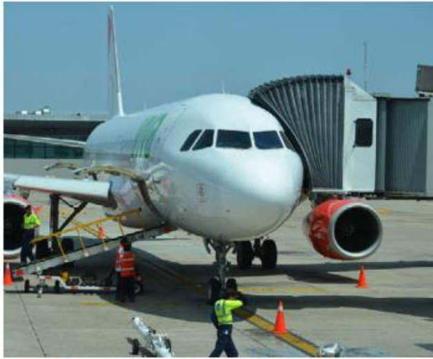
Los vuelos son un promedio de 1,200 asientos. ESPECIAL