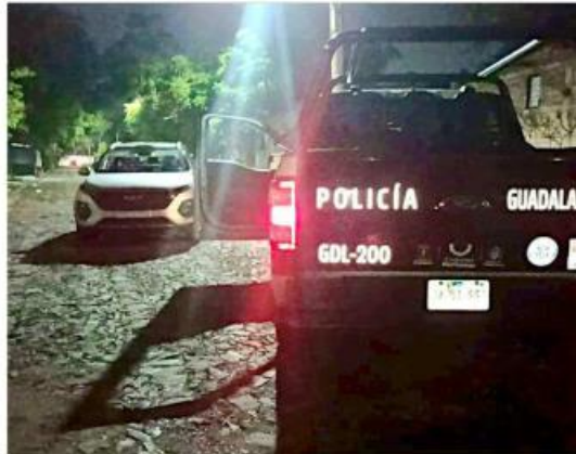
El sujeto fue detenido en la Colonia Artesanos.