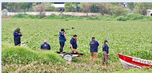
En la Presa de las Pintas fue hallada una bolsa con las piernas de un hombre.

No obstante, en el lugar son frecuentes los hallazgos