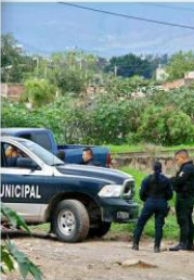
Uno de los casos ocurrió en la Colonia El Organo.

La Fiscalía del Estado inició una carpeta de investigación por cada caso.