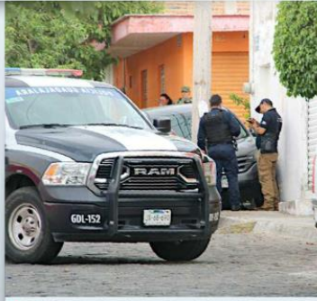
La víctima chocó tras la agresión a balazos.

Mientras tanto, un agente del Ministerio Público de la Fiscalía abrió una carpeta de investigación para tratar de esclarecer los hechos.