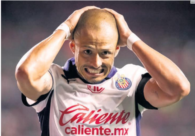
SIN SUERTE. Javier Hernández dio el que quizá sea su mejor partido desde su regreso al Guadalajara, abriéndose espacios y definiendo como en antaño, pero los dos ocasiones en las que perforó la meta de Jesús Corona no fueron al marcador, ya que en ambas jugadas se señaló posición fuera de juego.