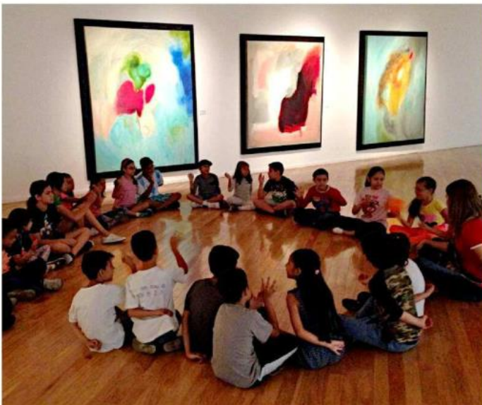
■ En el Museo de Arte Raúl Anguiano habrá cursos de verano.