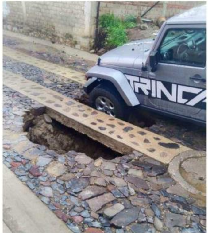
■ Aunque los trabajos debían concluir en enero de 2023, el martes pasado se reportaron hundimientos.

Ha pasado un año con ocho meses y la calle se mantiene sin abrir, a pesar de ser un desahogo para quienes intentaban atajar la congestionada salida de Bosques de Santa Anita a la Avenida López Mateos Sur. Los automovilistas usan una brecha, parte de Camino a las Moras y toman Enrique Limón para desembocar en el tramo final del bulevar donde se vuelve a doble carril.