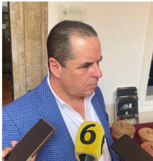
El diputado detalló que la eutanasia se explica como respuesta que repudia el dolor y sufrimiento del serpreciado. RH

“Que al solicitar a la persona que le ayuden a bien morir, no hay nadie que te inyecte, no hay nadie que te ayude, sino vas a un lugar, le ponen un suero, tú le abres y tú le cierras. No se trata de que alguien decida por otra persona, o sea nadie va a decir yo mi pariente está mal y yo quiero que ya le acaben sus dolores, eso no se puede. Uno mismo hace la solicitud, lo revisa un consejo médico, ven que no hay nada ni nadie que te pueda ayudar a curar tu enfermedad y entonces te dan un dictamen para que tú puedas acceder a parar con tu sufrimiento”, agregó. ■