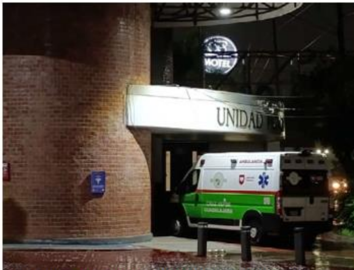
AGRESIÓN. Un joven de 20 años terminó en un puesto de socorros luego de sufrir una agresión por parte de varios sujetos en calles de la colonia La Esperanza, municipio de Guadalajara.