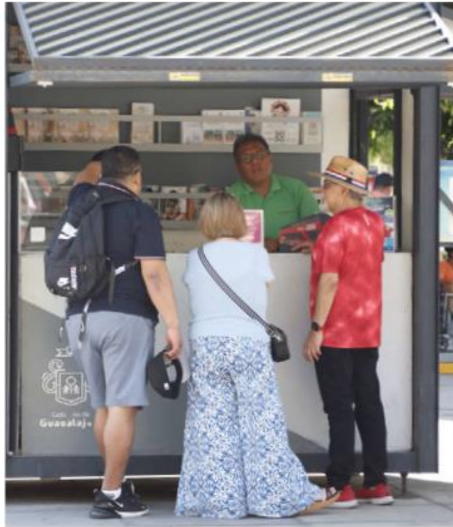
En el diplomado los guías se capacitaron en temas como arqueología y diversas artes. ESPECIAL

En el diplomado los guías se capacitaron en temas como arqueología, arte moderno y contemporáneo, arte prehispánico,