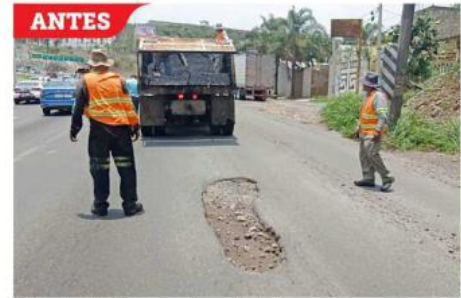
El daño a la vía se agravó con las lluvias.

En un recorrido realizado, se constató que el camino a Chapala está parchado y es circular, sólo se encontraba en mal estado el carril de ingreso al retorno que está a la altura de la terminal aérea,