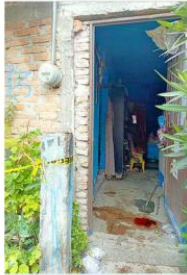
El ataque se registró en la Colonia España.