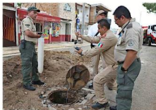
■ Ayer se realizaban análisis en el drenaje. Protección Civil y Bomberos del Estado descartó riesgo de explosividad.

Sostuvo que especialistas del Centro de Estudios de la Tierra, de la UdeG, hacen un estudio geotécnico de descartar