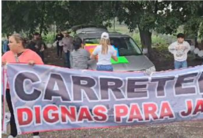
PROTESTA. Alrededor de 50 habitantes de Tamazula, Zapotiltic y Tuxpan realizaron este viernes un bloqueo en la carretera federal Jiquilpan-Manzanillo, para demandar su reparación.