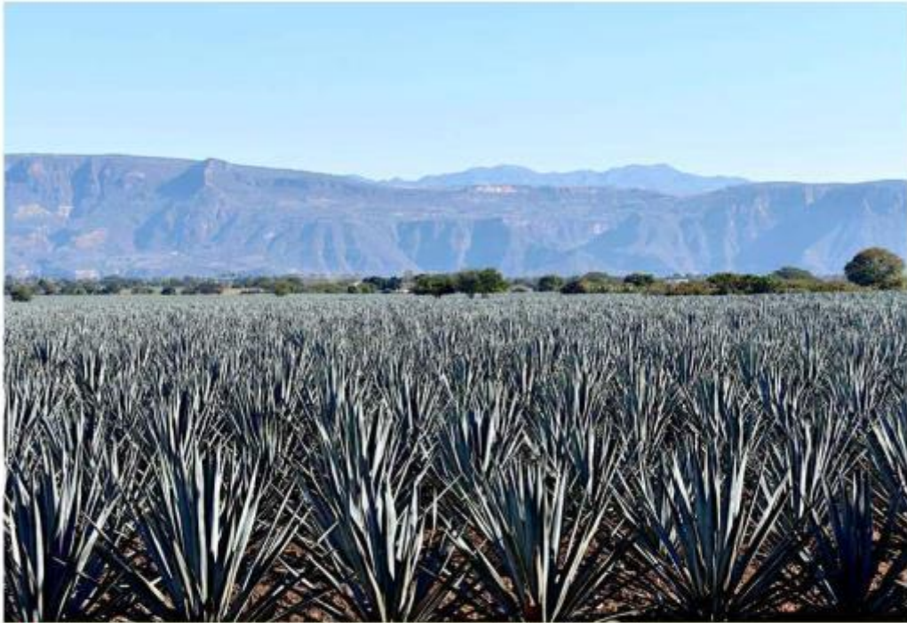
El Paisaje Agavero se ubica entre el volcán de Tequila y el valle del Río Grande.