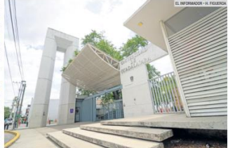
EDIFICACIÓN. El Centro Universitario de Arte, Arquitectura y Diseño es un ejemplo claro del estilo Brutalista.