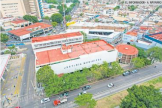
EDIFICIO DE LA POLICÍA MUNICIPAL. Una obra del arquitecto Fernando González Gortázar.