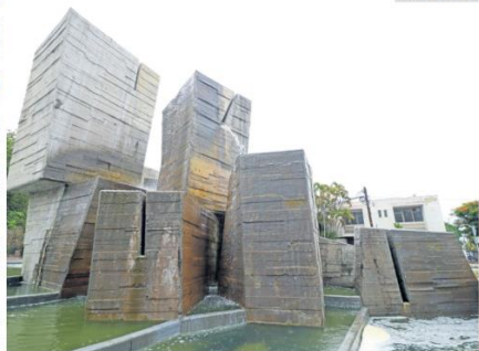
FUENTE DE LA HERMANA AGUA. Una obra de Fernando González Gortázar.