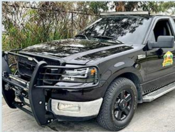
■ Los sujetos viajaban en una camioneta Ford Lobo.

magnéticas que usaban para "disfrazar" su camioneta con logos o también para taparle las placas.