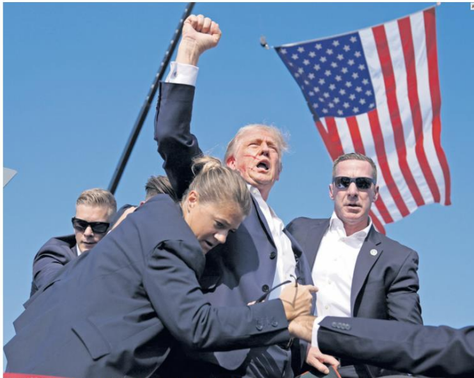
ATENTADO. El ex presidente y candidato presidencial republicano Donald Trump es rodeado por agentes del Servicio Secreto de Estados Unidos en un mitin de campaña en Butler, Pensilvania.

El atacante, Thomas Matthew Crooks, fue abatido en el lugar por un francotirador del operativo de seguridad del Servicio Secreto