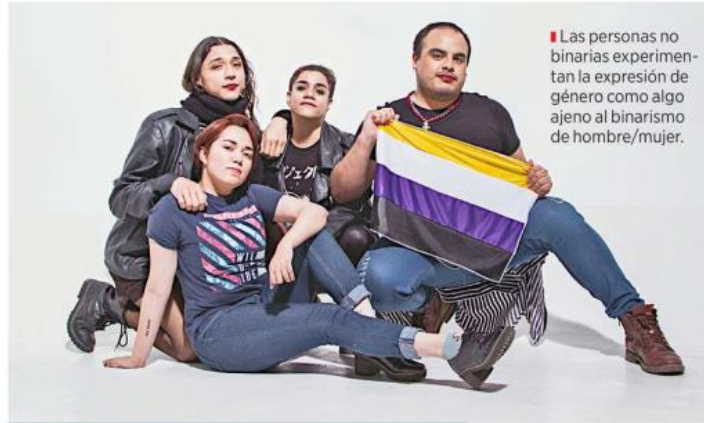
Las personas no binarias experimentan la expresión de género como algo ajeno al binarismo de hombre/mujer.