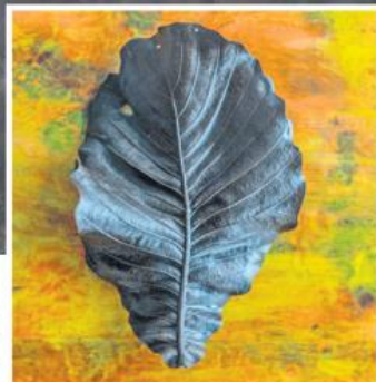
“DESPUÉS DEL FUEGO”. Fotografía montada en madera, de la autoría de Paola Ávalos.

“Después del Fuego” es una invitación a la reflexión: El cambio climático está en aceleración y también somos responsables de nuestra autodestrucción, por eso tenemos que poner manos a la obra antes que llegemos a un punto sin retorno.