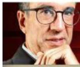
CARLOS ELIZONDO MAYER-SERRA @carloselizondom

La reforma que prohíbe la reelección consecutiva es, para los legisladores oficialistas, una prueba de lealtad.