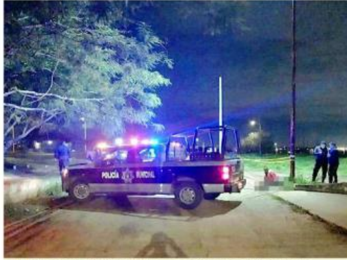
■ Un joven falleció durante un accidente en Tlajomulco.