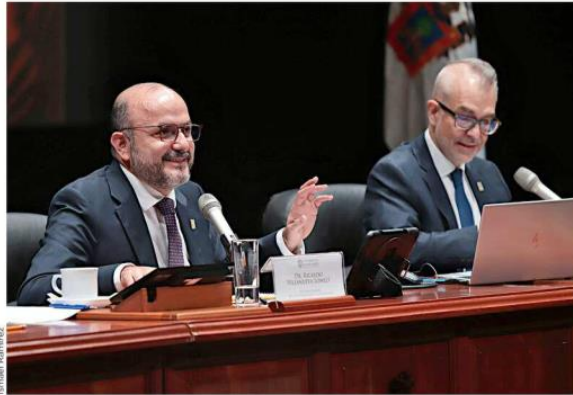
El Consejo General Universitario aprobó, en sesión extraordinaria, la creación del CUChapala.