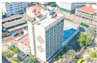
EDIFICIO SAN PEDRO. Una edificación construida en 1971.