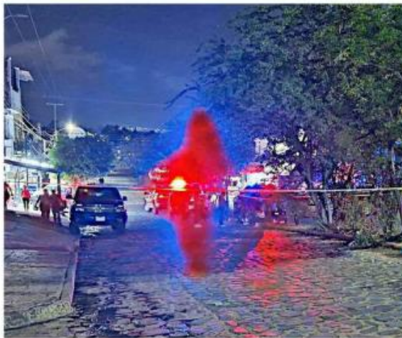
■ Dos personas fueron baleadas en Tlaquepaque, una murió.