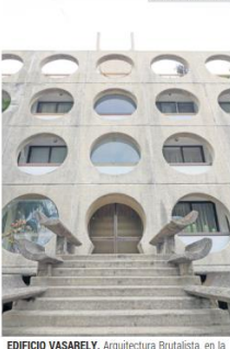
EDIFICIO VASARELY. Arquitectura Brutalista, en la Colonia Chapalita.