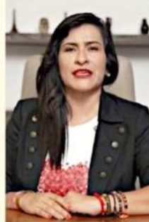
Citlalli Amaya aseguró que el Arzobispo emérito se entrometió en las elecciones con un video lanzado el 25 de abril.

La pelota para infraccionar a Juan Sandoval Íñiguez está, de nuevo, en cancha local.