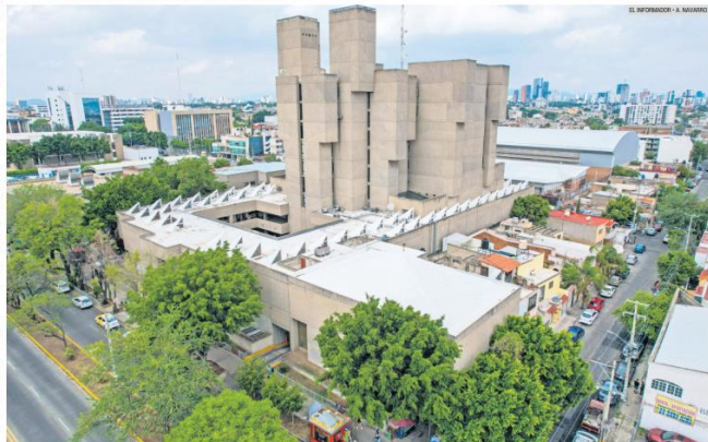
ARCHIVO HISTÓRICO DE JALISCO. Una construcción diseñada por Alejandro Zohn.

El Brutalismo también tiene que ver con una perspectiva industrial donde la filosofía de este tipo de arquitectura es asemejar ciertos aspectos de las máquinas y reflejar los procesos industriales de la producción del concreto. "Hay cierta relación de que la estética parezca que es obra negra, pero realmente eso no es el objetivo, sino que se entienda que esa parte tiene su belleza y que por ello vale la pena observar". Hay arquitectos que dejan texturas rugosas, explica Lozano, pero esto es porque es la visión de cada especialista sobre la estética, "pero hay quienes tienen más cuidado en los detalles".