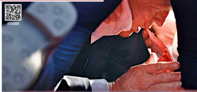
A las 18:10, hora local en Pensilvania (16:10, en México), un disparo impactó a Donald Trump (1) y el candidato fue herido en la oreja derecha (2) e inmediatamente se lanzó al suelo (3). Su equipo de seguridad lo retiró del mitin, en Butler (4).

"¿Dónde queda la responsabilidad de una empresa que maneja una cantidad tan alta de transacciones?", criticó otro.