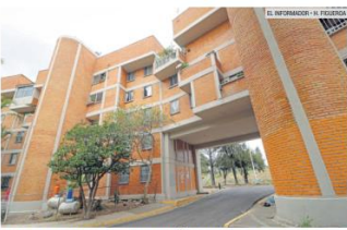
UNIDAD HABITACIONAL ESTATUTO JURÍDICO. Conocida también como "La muralla china".