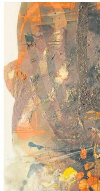
CULTURA. Expresión de los incendios desde la perspectiva de Adolfo Weber.