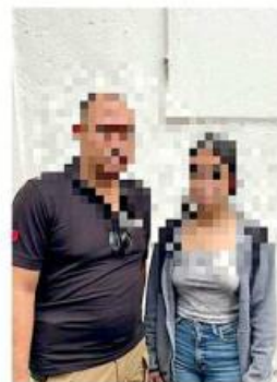
■ La joven fue localizada en Tomatlán.