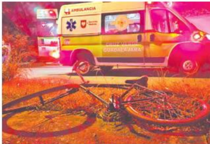
DECESOS. El año pasado cerró con 17 ciclistas fallecidos tras accidentes.

El también académico del Instituto Tecnológico y de Es-