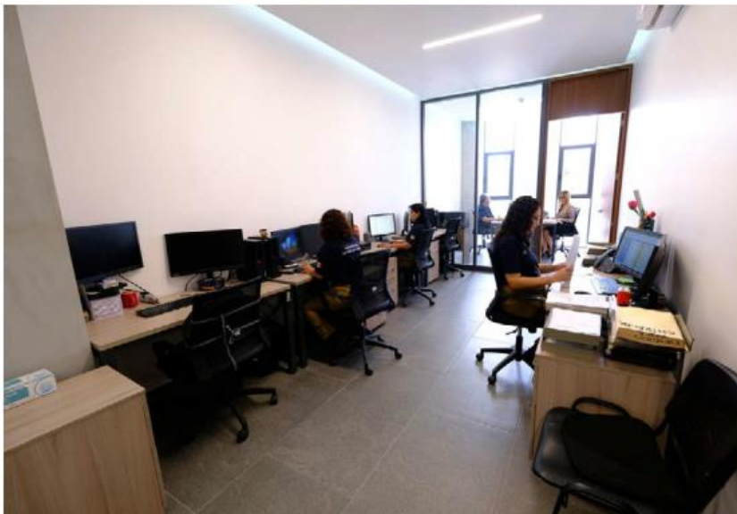
Las instalaciones serán utilizadas en su mayoría por el personal de delitos patrimoniales. ESPECIAL

dad, Ricardo Sánchez Beruben, mencionó que el común denominador de las voces de la retroalimentación que se hizo con las dependencias de seguridad en un inicio de la administración predominaba el abandono, deuda con la Secretaría de Seguridad y la Fiscalía: “Como parte de las acciones y como algo fundamental que se hizo el primer día de gobierno, fue que el Gobernador instaló la Comisión Ejecutiva del Consejo Estatal de Seguridad con una finalidad, encabezar él personalmente todas las acciones en la materia, y dentro de las acciones y agendas que se trataron fue el reforzamiento institucional y hoy, a lo largo de estos seis años