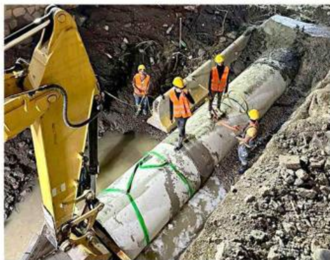
■ La obra registra un avance del 43 por ciento.

También se han llevado a cabo pruebas de soldaduras en 6 traveses de acero, mientras se procede con la habilitación y cimbrado de los cabezales. En el cuerpo norte se terminó el descabezado de las úl-