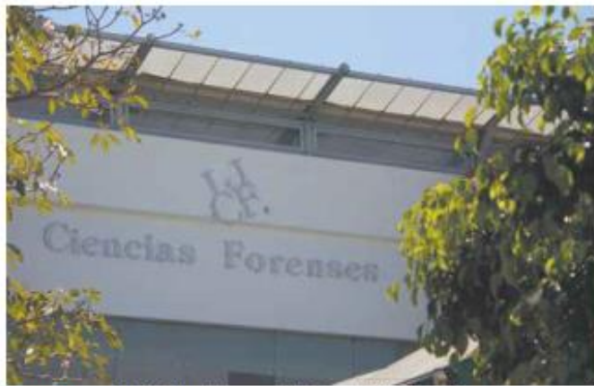
SEMefo. Cuando las familias de desaparecidos tienen indicios de que éstos se encuentran en el Servicio Médico Forense, el penar no acaba, pues deben esperar a que se los entreguen.

VÍCTIMAS más fueron halladas sin vida cinco años después de su desaparición