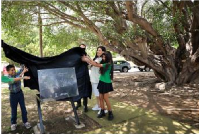
AMBIENTE. El gobierno de Zapopan develó la primera placa de un Árbol con valor Patrimonial y Cultural, el cual se ubica en el Parque de la Guadalupeana, en la colonia Real de Valdepeñas.