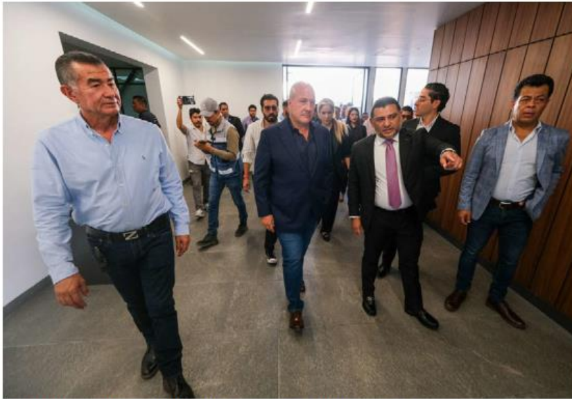
Autoridades estatales y municipales recorrieron el inmueble. ESPECIAL