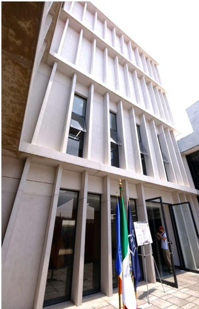
El edificio se encuentra dentro de las instalaciones de la Fiscalía Central en la Calle 14.

Infraestructura. En estas oficinas se atenderán principalmente delitos patrimoniales, competencia de la policía estatal, que se han reducido hasta 63% en los últimos cinco años, señaló el gobernador