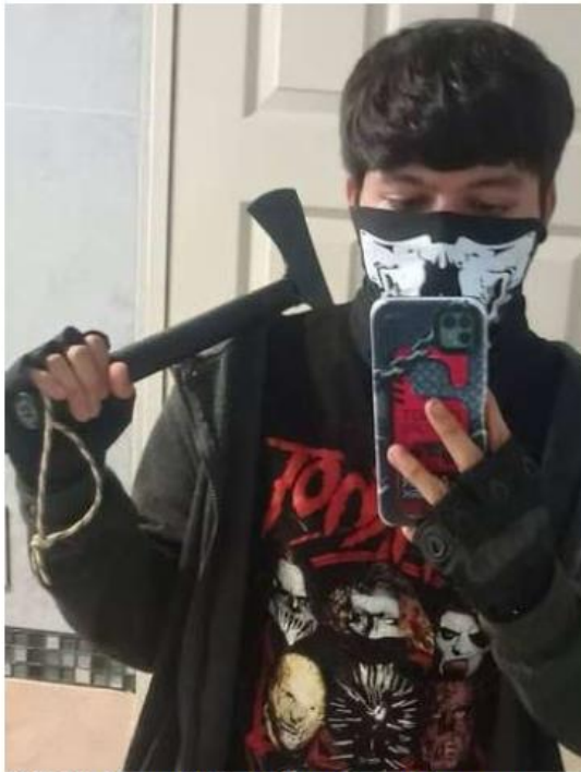
El día del crimen, publicó esta foto en redes sociales.