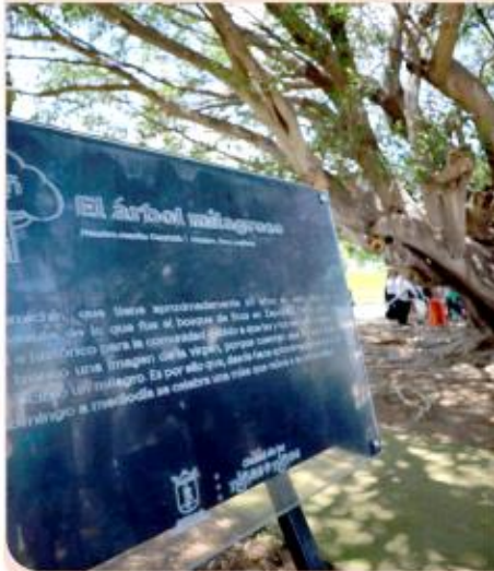
Gobierno de Zapopan