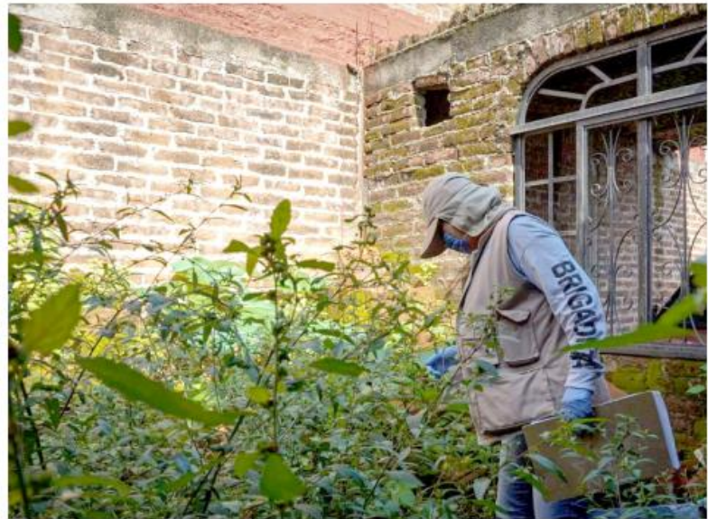
De los 1,547 casos acumulados de dengue en Jalisco, 1,041 son de Dengue No Grave.