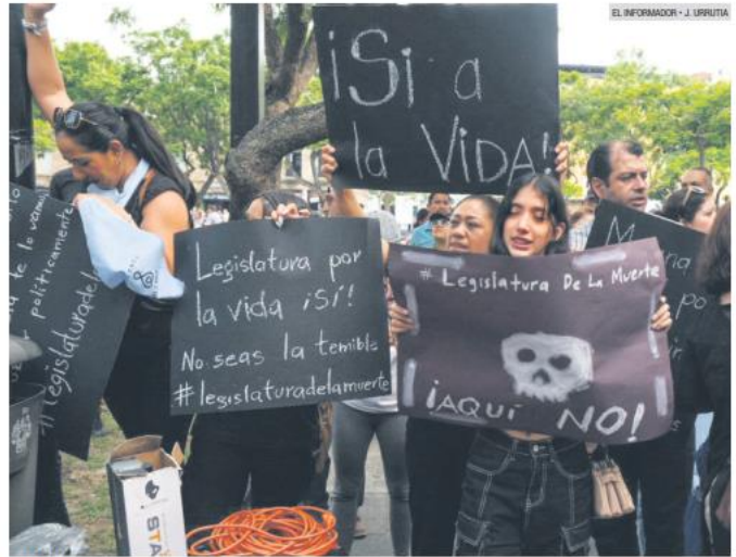
PROTESTA. Grupos contra la interrupción del embarazo se manifestaron al exterior del Congreso del Estado mientras en su interior se pretendía discutir su despenalización, lo que no ocurrió.

El pasado mes de abril, un tribunal colegiado determinó despenalizar el aborto en el Estado, además, de que hay una resolución de la Suprema Corte de Justicia de la Nación (SCJN) para despenalizarlo, por lo que el Congreso está obligado a acatar la orden.