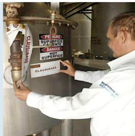
Proepa atendió una denuncia ciudadana.

Inspectores de la Proepa también encontraron deficiencias administrativas, pues no acreditó el adecuado tratamiento y disposición final de los residuos de manejo especial generados por su actividad.