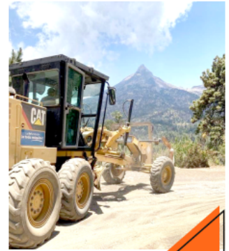
A Toda Máquina se conforma por un total 647 unidades.

Sostuvo que el ahorro de alrededor de 11 mil millones de pesos que A Toda Máquina generó en obras rurales a los municipios, permitió que los ayuntamientos tuvieran una mejor aplicación de sus presupuestos para obra pública, centrándose en las obras de mayor urgencia e impacto social.