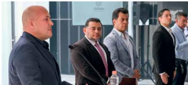
Tras ausentarse de sus labores por motivos personales, Enrique Alfaro Ramírez sigue trazando la ruta de su futuro político antes de concluir su administración en el Gobierno de Jalisco.

Una razón más para destacar lo urgente que resulta para Lemus Navarro tener ya en sus manos esa sentencia que despeje cualquier duda sobre su triunfo , en el caso, por supuesto, de que sea él quien ganó la batalla jurídica .