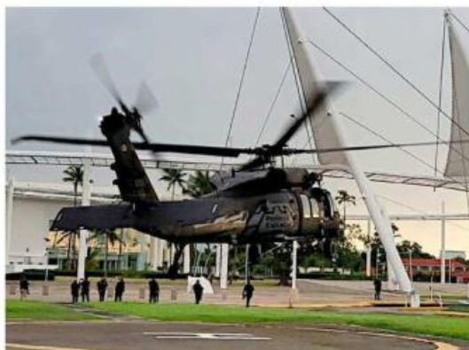
■ Un helicóptero fue usado para su traslado.

Se encontraba en Tomatlán; Kevin también regresa a casa