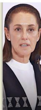
Claudia Sheinbaum Presidenta electa

davía hay definiciones en el Tribunal Electoral, pues estamos dejando (la reunión) para después (la plática). Es el caso, por ejemplo, de Jalisco, que después, ya que define el tribunal electoral, pues nos estaremos reuniendo". Sheinbaum comentó que las reuniones que sostendrá con los Gobernadores y Gobernadoras tienen un objetivo muy claro y es establecer los proyectos por los que apostarán las Entidades federativas para los próximos años. "¿Qué objetivo tienen estas reuniones? Revisar los proyectos prioritarios de infraestructura y otros temas", comentó. "Entonces, cada uno de los Gobernadores, Gobernadora, presentarán sus obras prioritarias, sobre todo de infraestructura, en materia de movilidad y carreteras, en materia de agua y, esencialmente, fueron los dos grandes temas que estudiamos". Por su parte, el Presidente Andrés Manuel López Obrador informó que de este fin de semana al próximo terminará de recorrer los Estados en su " gira del adiós" en compañía de la Presidenta electa, y uno de los Estados que visitaría es Jalisco junto con Colima, Michoacán y Nuevo León.