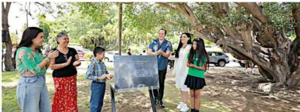
Este camichín tiene más de 60 años.

Por eso, este camichín, ubicado en el Parque de La Guadalupana, se convirtió