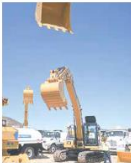
MILLONARIO. A Toda Máquina tuvo un costo de 3 mil 634 millones de pesos.

En el comunicado se detalla que las principales obras que se realizaron con estas máquinas fueron desazolve de cauces, construcción de bordos, ollas para captación de agua pluvial y abrevaderos, rehabilitación de caminos sacacosechas, así como la apertura de caminos rurales.