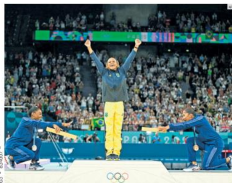
RECONOCIMIENTO. Simone Biles y Jordan Chiles tuvieron un buen gesto deportivo para felicitar el gran desempeño de su competidora, Rebeca Andrade, en la Final de suelo de la gimnasia artística de París 2024.