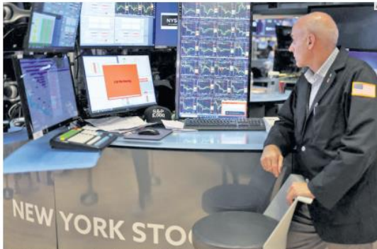
"LUNES NEGRO". Los mercados bursátiles del mundo, incluyendo Wall Street, tuvieron fuertes caídas en sus índices tras el aumento de las tasas de interés en Japón y el temor a que la economía de Estados Unidos entre en recesión.