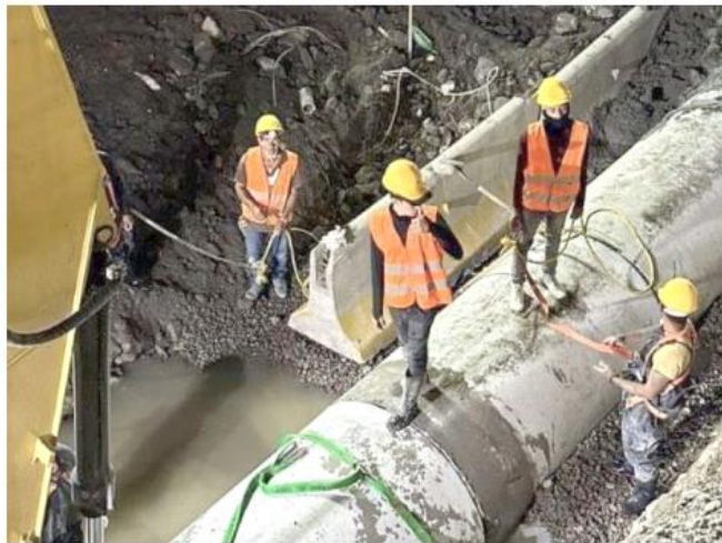
Se espera que la circulación quede reabierto el 11 de agosto.

Ya fueron sacados todos los escombros, y el personal de Siapa y la Secretaría de Infraestructura y Obras Públicas, iniciaron la colocación del colector