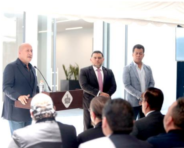
En estas oficinas se atenderán en su mayoría los delitos patrimoniales.

Se atenderán en su mayoría los delitos patrimoniales, competencia de la policía estatal