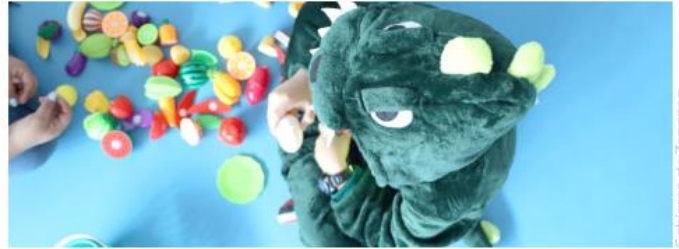
Con El Safari realizaron un recorrido didáctico.

"Para el tema Safari utilizamos todos los elementos de la jungla, en donde además de cumplir objetivos terapéuticos,