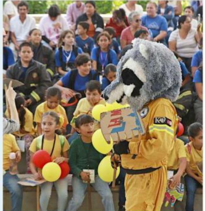
Los pequeños participaron en los cursos de verano de Protección Civil y Bomberos de Zapopan.