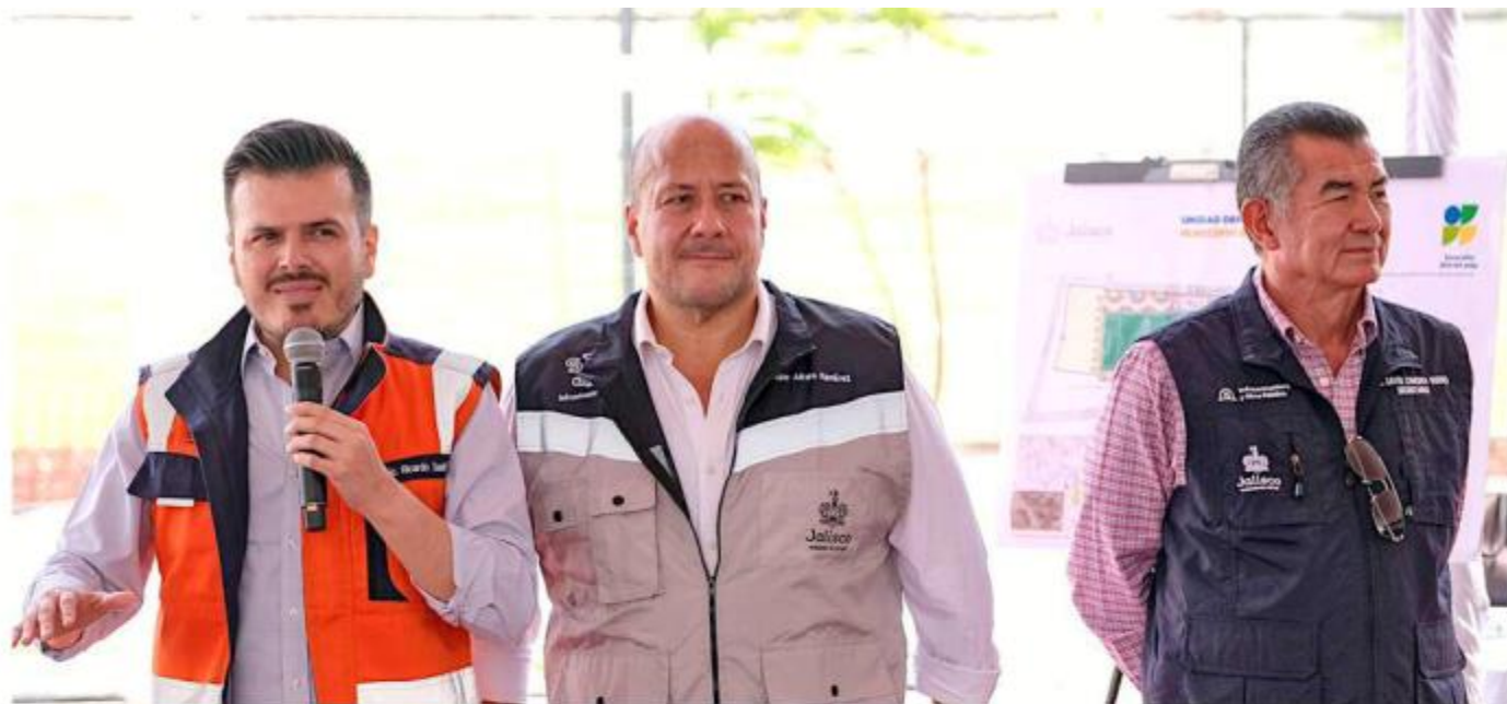
■ Enrique Alfaro participó en la entrega de la nueva Unidad Deportiva Minerales en El Salto.