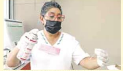
Mujeres. Autoridades llaman a hacer los exámenes.

asintomático; en cambio un paciente con una enfermedad avanzada va a tener problemas como impotencia sexual, eyaculación con sangre, fracturas patológicas, pero estamos hablando de una