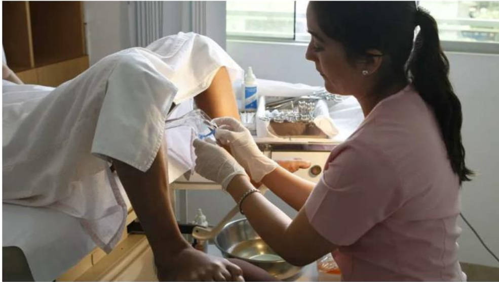
Algunos síntomas son sangrados irregulares, sangrados post relaciones sexuales, dolor pélvico y desecho fétido. ESPECIAL