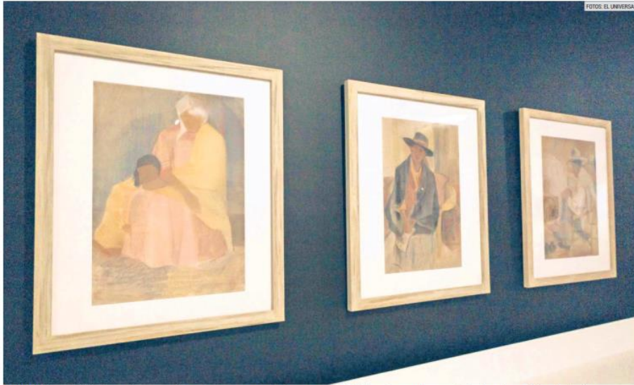
CULTURA. La exhibición desarrolla un recorrido en el que se muestran los lazos que estableció Siqueiros con diversos artistas durante sus viajes al extranjero.

El museo presenta una exhibición que deja ver la faceta más social del artista mexicano