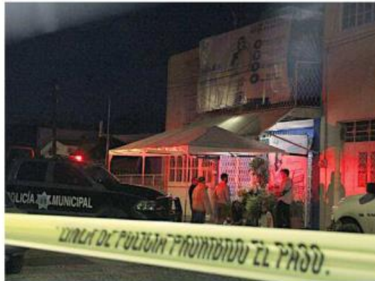
■ El crimen se registró en la Colonia Los Meseros.