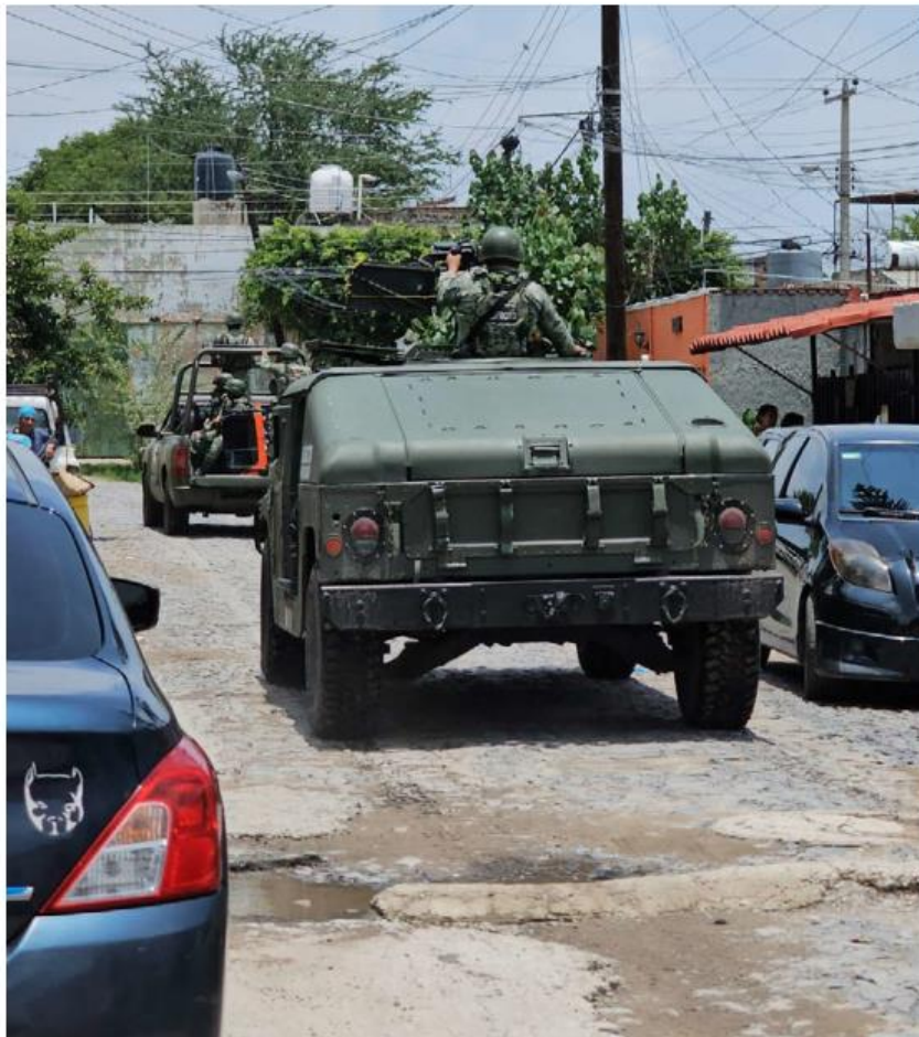
Tras las investigaciones y recorridos de vigilancia en la zona de la agresión a disparos, fue localizado el vehículo de los causantes, pero no se logró la detención. JUAN CARLOS MUNGUÍA

Hechos. El ataque directo sucedió en Tlaquepaque, sobre la calle Río Salado, entre Río Colotlán y la Avenida Acueducto