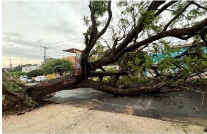
TEMPORAL. La tormenta que se desató en la madrugada provocó la caída de un árbol en la calle Francisco de Ayza y Ramón Blancarte, en la colonia San Juan Bosco, del municipio de Guadalajara.