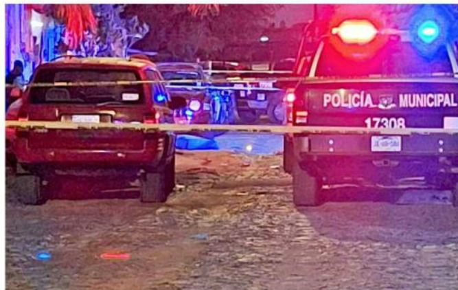
La agresión ocurrió la madrugada de ayer en la Colonia El Vergel.