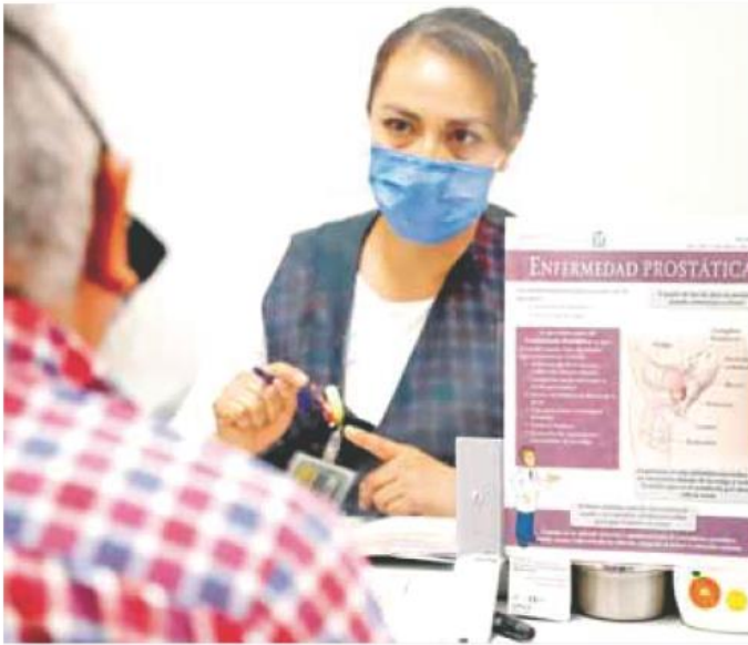
Hombres. Dejar avanzar los síntomas del cáncer de próstata reduce opciones de tratamiento.

Mediante una intensa campaña durante este mes de agosto, la Secretaría de Salud Jalisco (SSJ) insta a la población masculina de 45 años o más a conocer sobre el cáncer de próstata y acudir de mane-