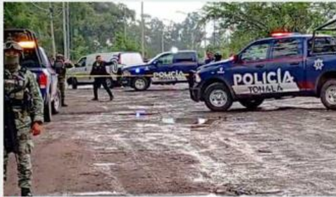
El cadáver de un hombre fue localizado en Hacienda Real.

Fuentes policiales indicaron que tenía una herida en el cuello realizada con arma blanca; además, los asesinos le colocaron