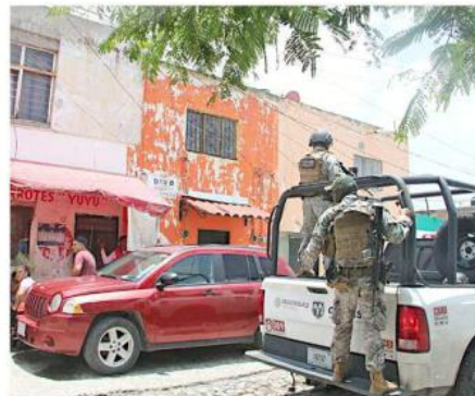
Los hechos se registraron afuera de una tienda.