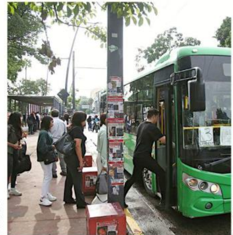
Algunos usuarios llegan a tomar hasta seis camiones al día.

“No todos los camiones están cumpliendo con las condiciones que deberían,