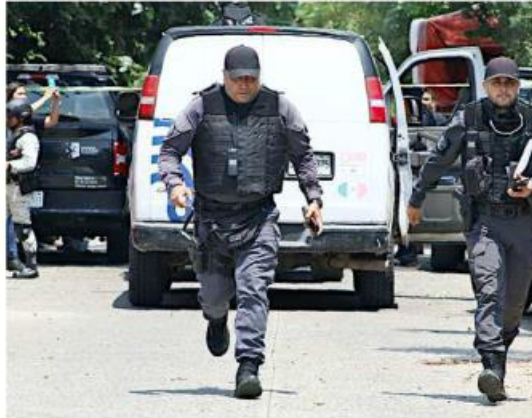
■ Oficiales montaron un operativo para capturar al agresor.