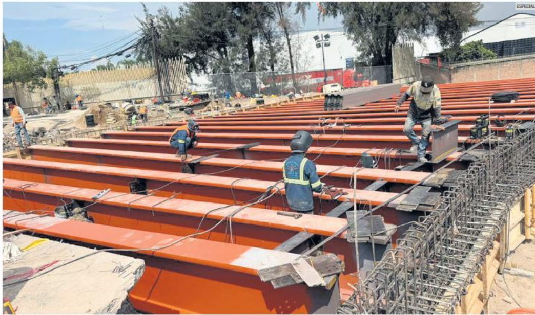
PISAN EL ACELERADOR. Si el clima lo permite, las labores de reparación en López Mateos concluirán este fin de semana.

Insistió en que el problema sólo afectó a una parte del puente, por lo que en el resto de los carriles no existe riesgo alguno.