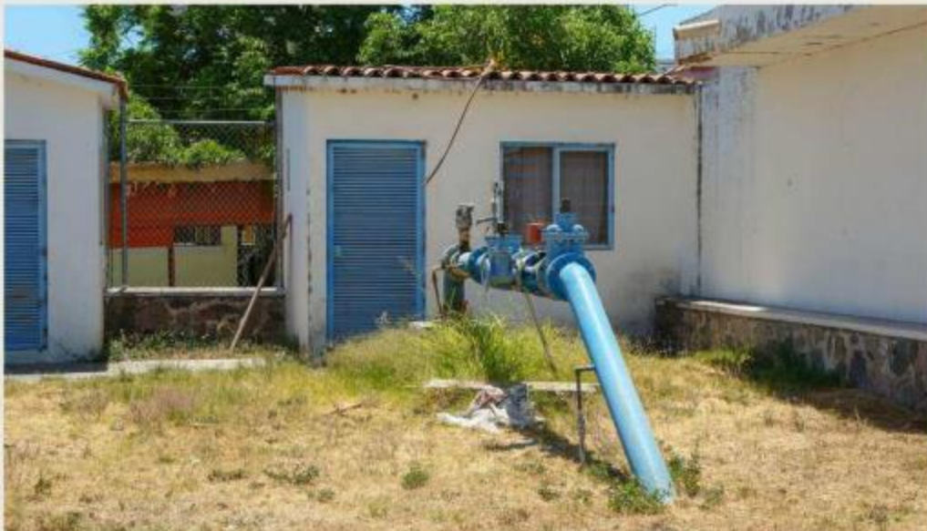
■ Actualmente Tlajomulco depende al 100 por ciento de pozos profundos.

El dictamen, salido de la Comisión Edilicia de Finanzas Públicas y Patrimo-