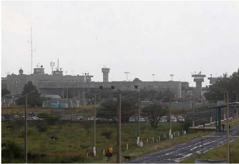
Ayer fueron trasladados a los juzgados de oralidad del complejo penitenciario. ESPECIAL