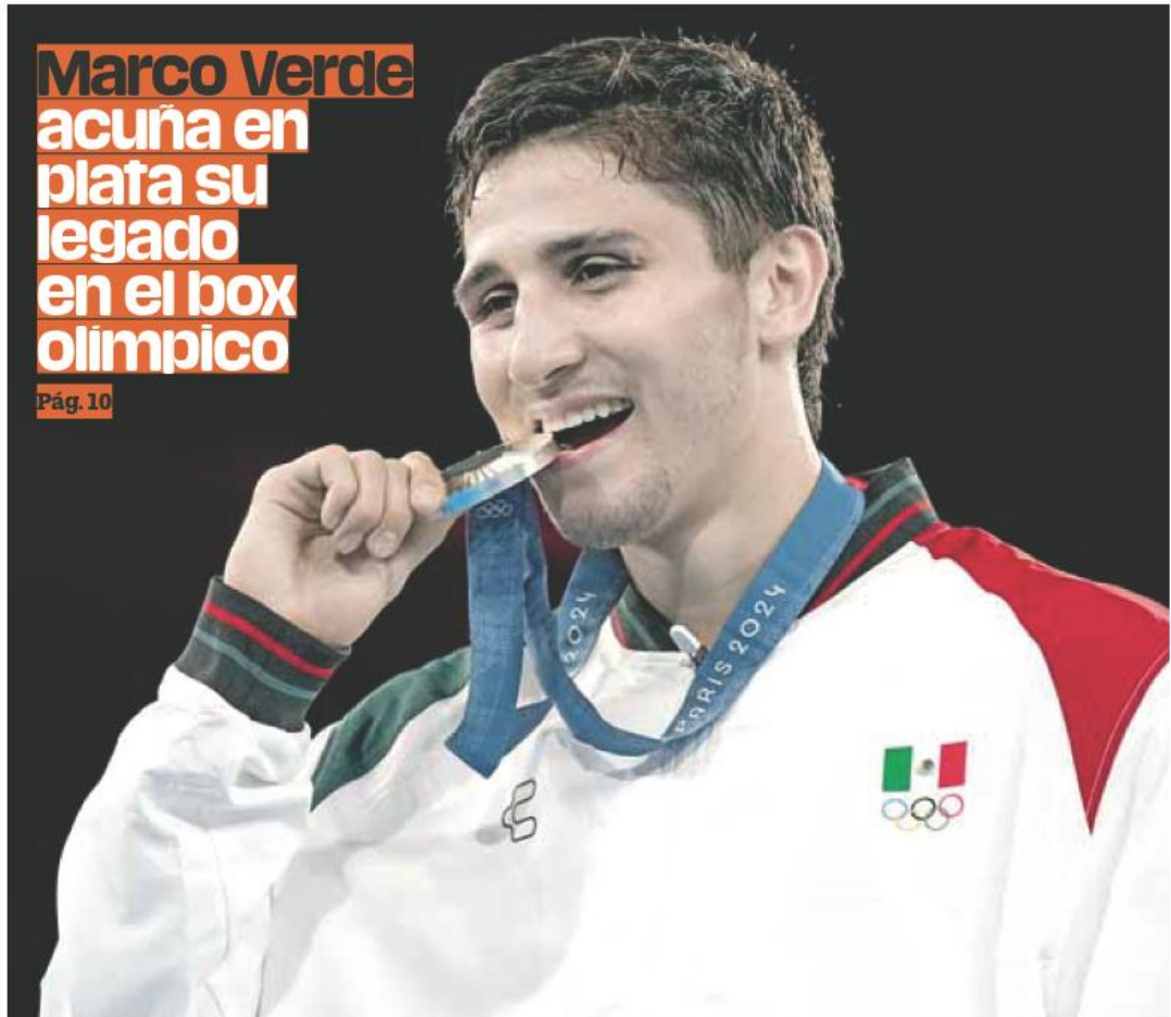
Pugilista. El mazateco de 22 años se convirtió en subcampeón en los Juegos Olímpicos de París 2024, tras enfrentar al uzbeko Asadkhuja Muydinkhujayev. / 10