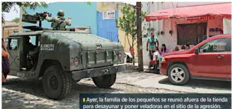
Ayer, la familia de los pequeños se reunió afuera de la tienda para desayunar y poner veladoras en el sitio de la agresión.