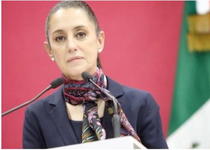
La morenista no invitó al gobernador de Jalisco a una reunión a la que asistieron sus homólogos. ESPECIAL