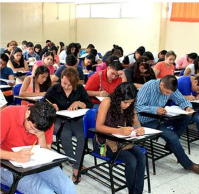
La UdeG publicó dictámenes para estudiantes no admitidos, quienes pidieron ingreso a otras licenciaturas. ESPECIAL

La UdeG alienta a quienes no lograron ingresar a no rendirse y a seguir intentando. Con perseverancia y dedicación, es posible alcanzar tus metas académicas. No te desanimas, considera todas tus opciones y sigue adelante. ■