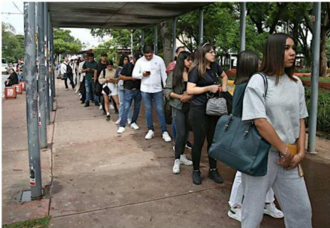
Entre las principales quejas está la frecuencia de paso.