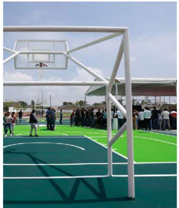
Se invirtieron 55 millones de pesos.

El servidor público recordó a los habitantes de El Salto las recientes obras hechas en beneficio del municipio como el Hospital Comunitario, la Unidad de Hemodiálisis, y las obras que abastecerán de agua a El Salto y el resto del Área Metropolitana de Guadalajara (AMG), por los próximos 50 años. —