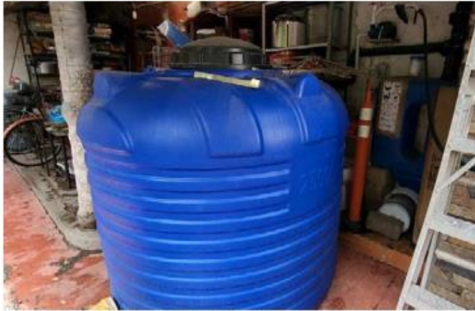
AGUA. El sistema “nido de lluvia” en la casa de Eduardo Becerra, en la colonia San Andrés, ha ahorrado más de 15 mil litros de agua por semana y asegura reservas durante los cortes en época de estiaje.