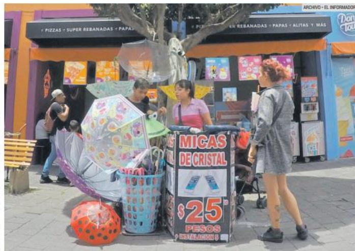
PERMISO. Comerciantes podrán ofrecer sus productos a partir de hoy en la vía pública.

El Ayuntamiento de Guadalajara comenzó con la regularización de ambulantes desde el año 2015, detectando un total de mil 114 comerciantes irregulares que vendían en el Centro, por lo que se estableció una comisión dictaminadora que emitió, varios años después, 100 permisos para que pudieran vender productos.