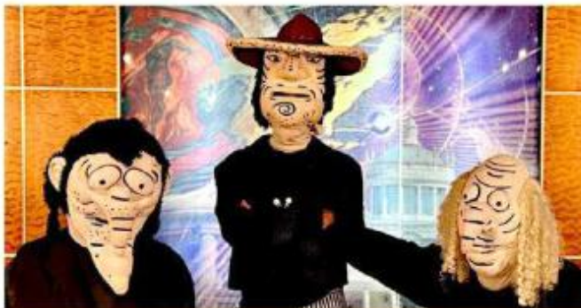
■ Escenas de la obra "Hidalgo, despertador americano".