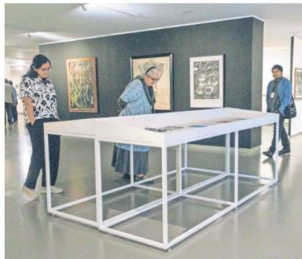
TALENTO. La muestra presenta obra de Siqueiros y de algunos contemporáneos, como: José Sabogal, Camilo Blas y Julia Codesido, entre otros.