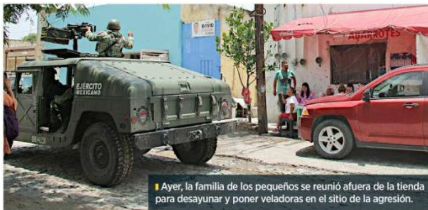
Ayer, la familia de los pequeños se reunió afuera de la tienda para desayunar y poner veladoras en el sitio de la agresión.

Además, cuatro víctimas fueron trasladadas a la Cruz Roja Toluquilla. Ahí fallecie-