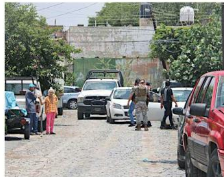
Autoridades montaron un operativo de vigilancia.

La mañana de ayer, la familia de los pequeños se reunió afuera de la tienda para desayunar y poner veladoras en el sitio de la agresión.