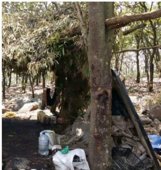
Uno de los casos más notorios fue el descubrimiento, en agosto de 2017, de los narcocampamentos en Tala.