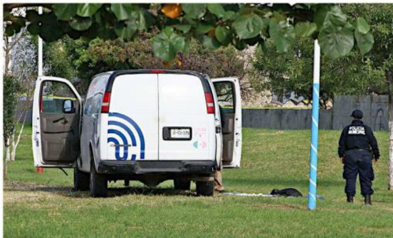
En Valle de Tejada fue hallada una víctima con lesiones de bala.

Los agentes del área de Homicidios Intencionales co-