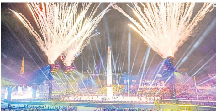
CELEBRACIÓN. La Plaza de la Concordia brindó el marco perfecto para la inauguración del evento, que reúne a más de cuatro mil paratletas.