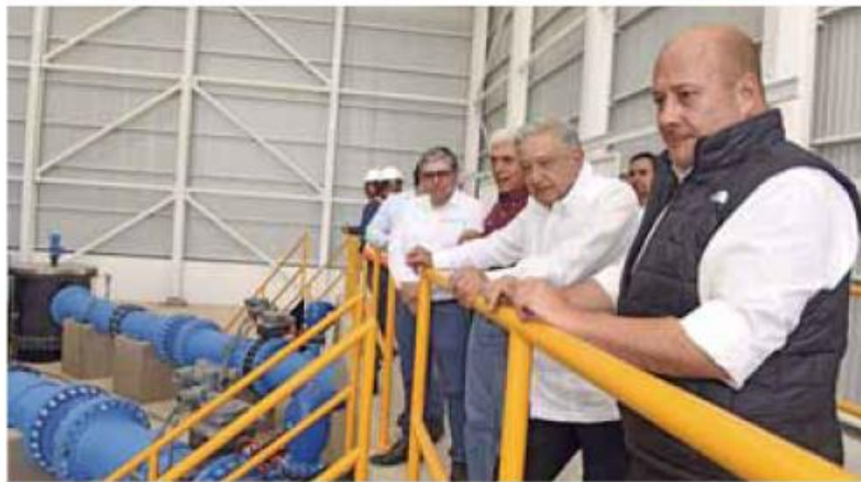
Trabajo. En febrero inauguraron el Acueducto El Salto-La Red-Calderón.

Impresiones. El gobernador de Jalisco comentó al finalizar el encuentro que regresaba “contento a Guadalajara”