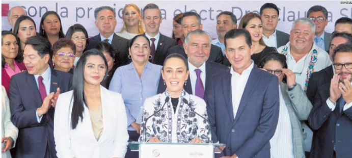
CAMBIO. Los dos senadores electos por el PRD afirmaron que su unión a Morena se debe a su ideología de izquierda, ante la inminente extinción de su anterior partido. Sin embargo, simpatizantes de la oposición y analistas afirman que este cambio pone en riesgo a los contrapesos de la democracia mexicana.

Dos perredistas "cambian de bando" y ahora representan al oficialismo en la Cámara Alta, donde ya tienen 85 senadores