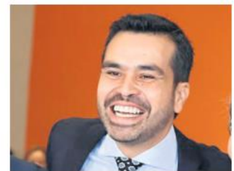
Clemente Castañeda, senador por MC.

"Es un día de fiesta para MC por la llegada de nuestros compañeros y compañeras a las legislaturas de los Estados y al Congreso de la Unión".