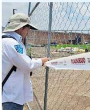
■ En el predio ubicado en Tlaquepaque se tiraba escombros.

Además de no acatar las órdenes de la autoridad para corregir las deficiencias presentadas, el personal técnico de la Proepa se percató que no tenía autorización en materia de impacto ambiental.