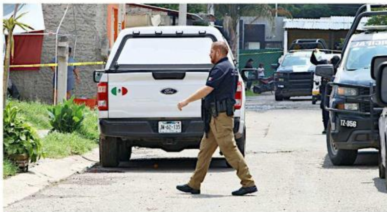
En Chulavista se encontró el cuerpo de una persona dentro de una casa.

menzaron las indagatorias para esclarecer los hechos.