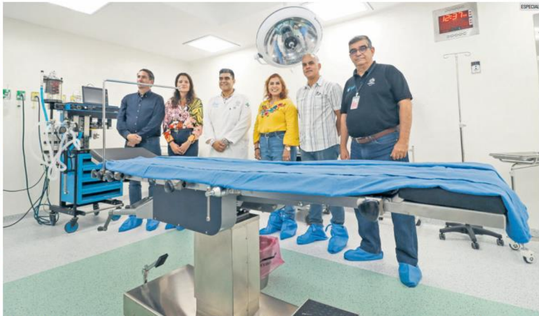
MÁS SERVICIOS. Con dos nuevos quirófanos la atención se extenderá para la población que requiere servicios de urgencia o de tratamientos especiales.

sustituidos por unidad central por unas de bajas emisiones de carbono, el área de selle, el área de autoclave, toda la parte de los quirófanos, los baños, todas las instalaciones son de altísima calidad y de primer nivel".