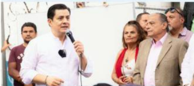
■ José María "Chema" Martínez