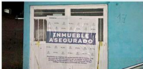
■ El inmueble fue asegurado por la Fiscalía estatal.

A él lo privaron de la libertad en el Centro del Municipio y, además de golpearlo, no lo habían alimentado, por lo que presentaba deshidratación.