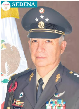
Ricardo Trevilla Trejo.

Viene de desempeñarse como jefe del Estado Mayor Conjunto de la Defensa Nacional, después de ocupar diversos cargos como coronel y general en el mismo Estado Mayor y al frente de concentraciones militares en Estados mexicanos como en Coahuila, Chihuahua, Michoacán, Puebla.