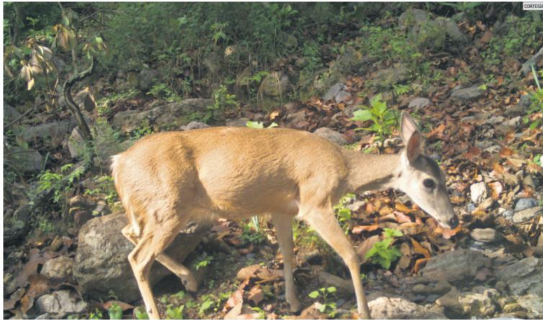
DESTILA VIDA. En "Senderos del Bosque" se podrá admirar la rica biodiversidad que habita en La Primavera.