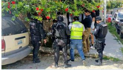
■ Policías municipales escucharon gritos en la casa.