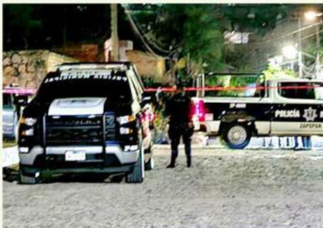
■ El tiroteo ocurrió en la Venta del Astillero.

Policías localizaron en el sitio a un joven de 29 años, quienes estaba lesionado y esposado en