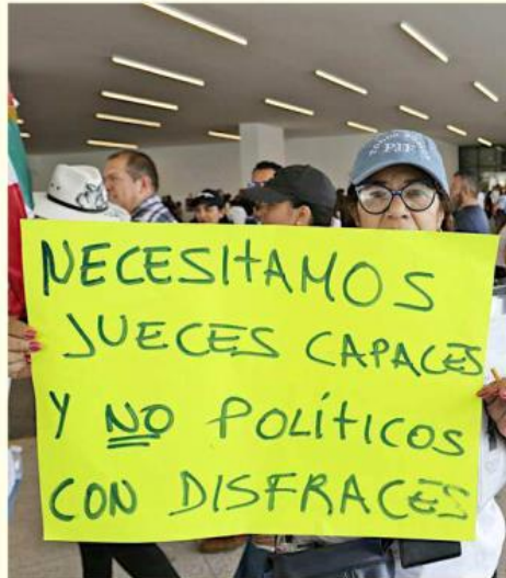
Empleados judiciales se colocaron en el acceso principal al aeropuerto.

Al arribar al Aeropuerto, los empleados judiciales