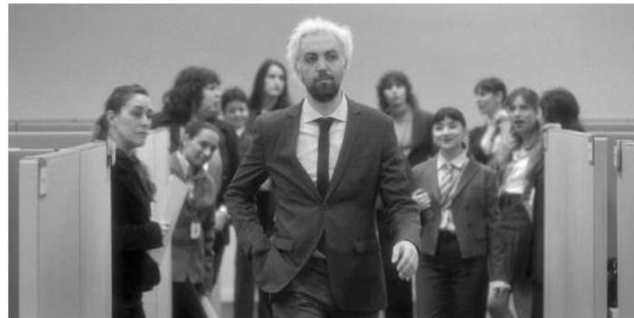
PEDRO DE TAVIRA. El actor protagoniza esta cinta, donde explora de forma peculiar el mundo laboral.

Quienes deseen ver la transmisión de la ceremonia 66 de los Premios Ariel, hoy, podrán hacerlo por el canal TNT (en televisión de paga) o por Jalisco TV.