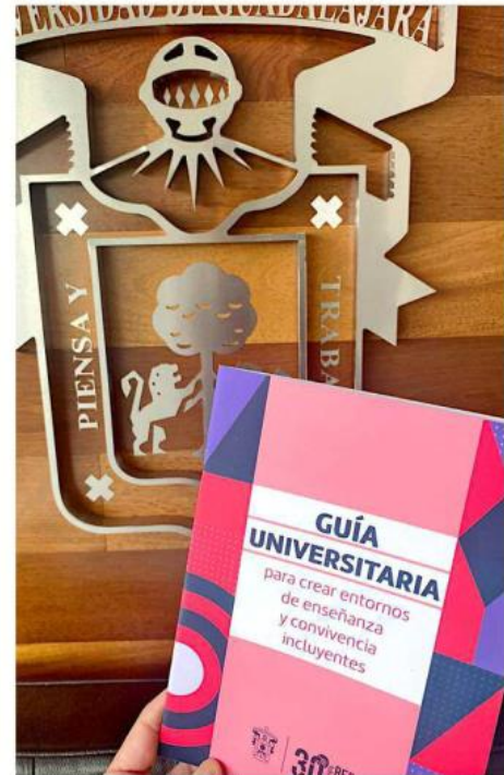
La guía plantea orientar a docentes y estudiantes para dejar de difundir discursos discriminatorios.

La guía completa puede ser consultada en la página web de la Unidad para la Igualdad en la dirección igualdad.udg.mx/publicaciones .