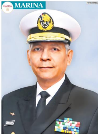
Raymundo Pedro Morales Ángeles.

Viene de desempeñarse como jefe del Estado Mayor Conjunto de la Defensa Nacional, después de ocupar diversos cargos como coronel y general en el mismo Estado Mayor y al frente de concentraciones militares en Estados mexicanos como en Coahuila, Chihuahua, Michoacán, Puebla.