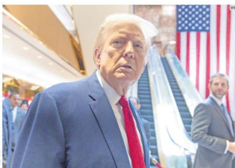
SATISFECHO. Donald Trump celebró el aplazamiento de la sentencia de su caso penal en Nueva York calificándolo como "una gran noticia" fruto de un proceso que, según él, "no debió comenzar jamás".