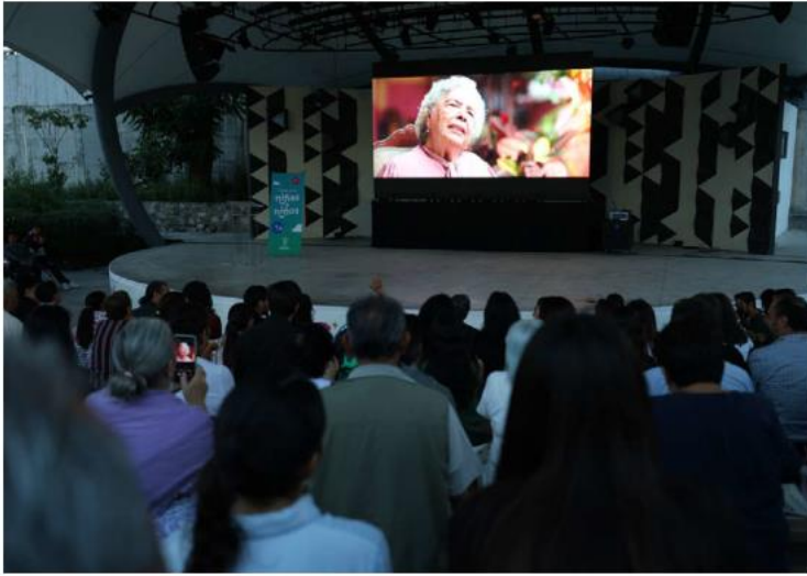
Durante 10 días de rodaje, el equipo realizó entrevistas con vecinos, locatarios y artistas. ESPECIAL