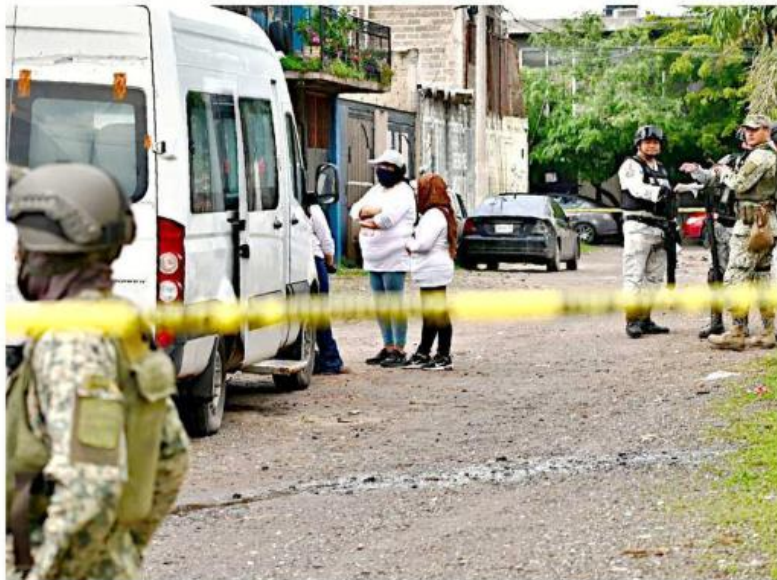
Activistas localizaron la fosa clandestina en Paraísos del Colli tras recibir reportes anónimos.

Tras los trabajos forenses se logró establecer que