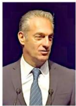
Carlos Slim Domit, ayer en el foro con becarios.

"Se va a poner peor ahora que están prácticamente parados, porque antes de pérdida se hacía 'home office', y ahora nadie está haciendo nada".