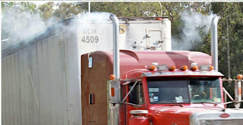
Las fuentes móviles son las responsables de la mayor parte de la contaminación atmosférica.

Y para muestra los datos que la plataforma Mide Jalisco tiene sobre la conta-