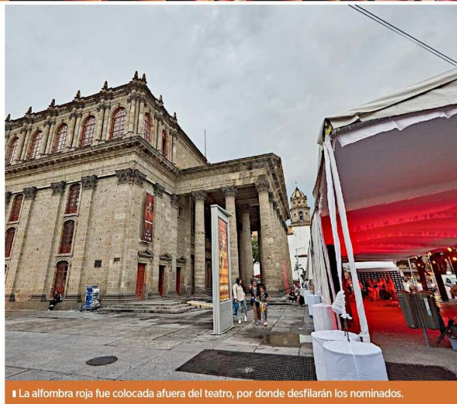
La alfombra roja fue colocada afuera del teatro, por donde desfilarán los nominados.

“Esto ya lo han hecho en los Premios Goya, que en los últimos años se han movido por varias ciudades de España. Este año, la Academia Colombiana de Cine