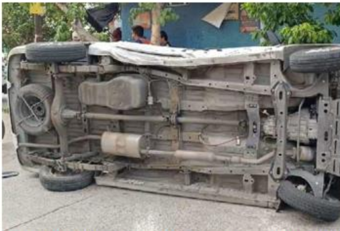
VOLCADURA. Una camioneta volcó tras chocar con una repartidora. El copiloto, de 25 años, sufrió dolor en el pecho y el hombro y fue hospitalizado con posible fractura en la clavícula.