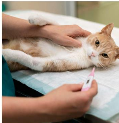
Piden hacer revisiones médicas constantes. ESPECIAL

Por último, la médica veterinaria exhortó a la ciudadanía a completar el esquema de vacunación desde cachorro, continuar con las vacunas anuales, dar una alimentación adecuada, evitar lo más que se puedan las marcas comerciales, mantenerlos hidratados y que tomen bastante agua, así como acudir con su veterinario si notan algo raro en sus gatitos, y evitar que salgan a la calle. ■