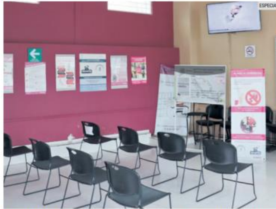
INE JALISCO. Tendrá una campaña de horario extendido hasta el próximo 15 de diciembre en 23 de los 57 módulos.

La Junta Local Ejecutiva del Instituto Nacional Electoral (INE) en Jalisco informó el inicio de la Campaña Anual Intensa del Registro Federal de Electores desde el pasado 1 de septiembre para aumentar los trámites de renovación de credenciales que perdieron vigencia.