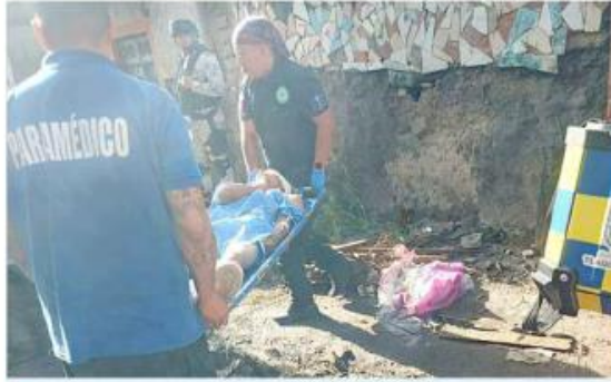
■ Un joven fue baleado y pidió ayuda en Tlaquepaque.