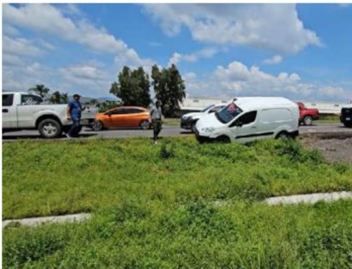
CHOQUE. En el Periférico, a la altura del Technology Park, una pipa de gas LP, una camioneta de carga y una pickup chocaron en cadena tras una frenada brusca.