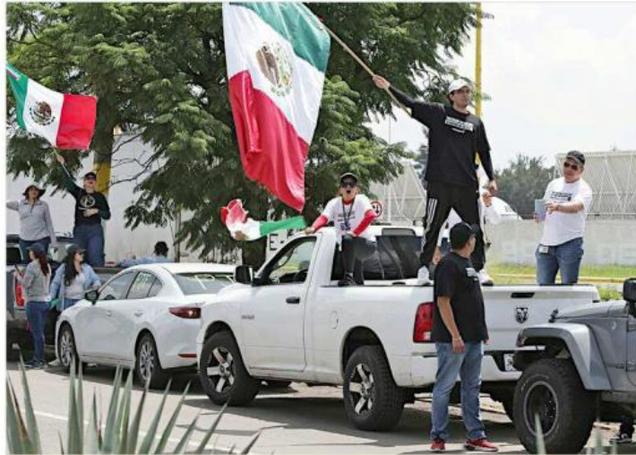
Manifestantes ondearon banderas de México e hicieron sonar las bocinas de sus vehículos.