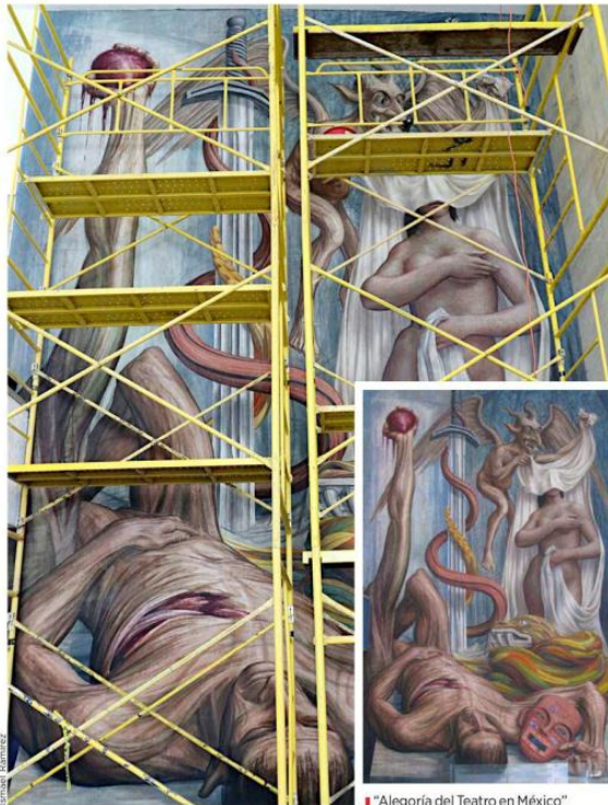
La obra requiere retirar polvo, smog y rellenar grietas por los sismos y el paso de camiones pesados.

La pieza que retrata los orígenes del teatro clásico mediante una analogía a partir del sacrificio humano en la era prehispánica, se representa a partir de un hombre que entrega su corazón a Quetz-