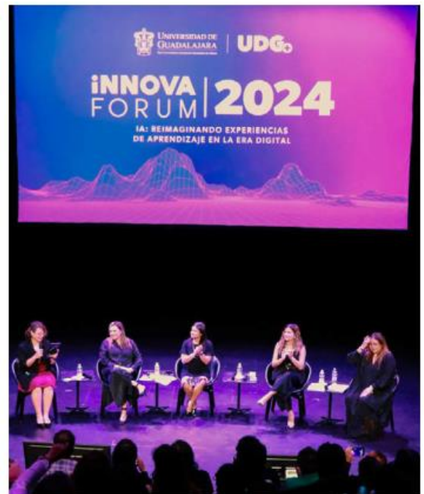
Ayer se llevó a cabo un panel sobre este tema.