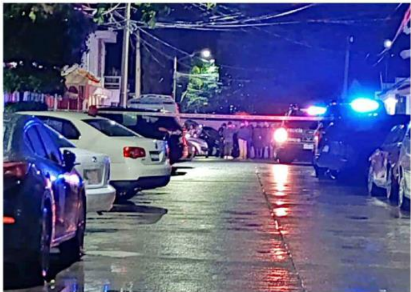
El atraco fue en el cruce de Cipriano Campos Alatorre y Efrén Hernández.

Después del ataque, uno de los ladrones se llevó la camioneta robada, mientras que los otros dos se fueron