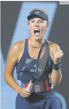
MAGDALENA FRECH. La polaca busca el título tras la derrota en la final de Praga.