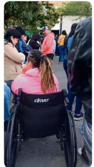
Fila de derechohabientes.