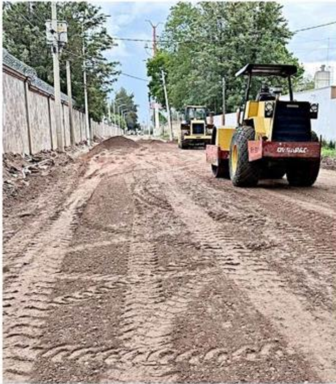
Las obras iniciaron en julio de 2023.

“El primer discurso: vamos a entregar la reconstrucción de una avenida importantísima: el Camino Antiguo