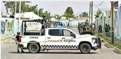
El caso quedó en manos de la Fiscalía del Estado.

La privación de la libertad y la persecución causó una intensa movilización de fuerzas federales en Lomas del Mirador.