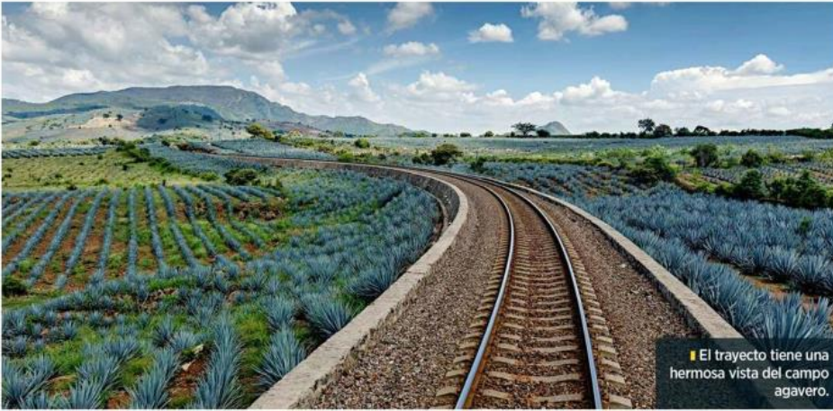
El trayecto tiene una hermosa vista del campo agavero.

Agregó que la posibilidad de este proyecto va más allá que sólo una ruta turística, pues se espera que en poco tiempo puedan anun-