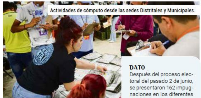
Actividades de cómputo desde las sedes Distritales y Municipales.

El Instituto Electoral y de Participación Ciudadana del Estado de Jalisco, es un organismo público autónomo encargado de la regulación, administración y ejecución electoral en Jalisco, en conjunto con el Instituto Nacional Electoral.