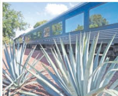
SALIDA. El tren se prepara para salir hacia Tequila, ofreciendo una nueva opción de transporte para explorar la rica tradición.