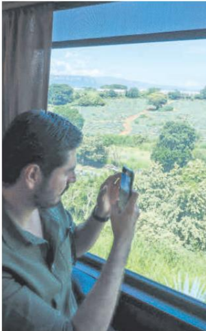
NUEVO RECORRIDO. El tren, recientemente remodelado, inicia su primera corrida del día.

EN IMÁGENES | Un viaje por la tradición del Estado