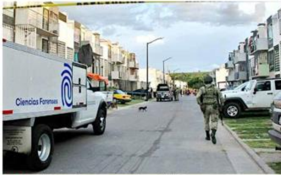
Uno de los crímenes ocurrió en Villa Fontana Aqua.