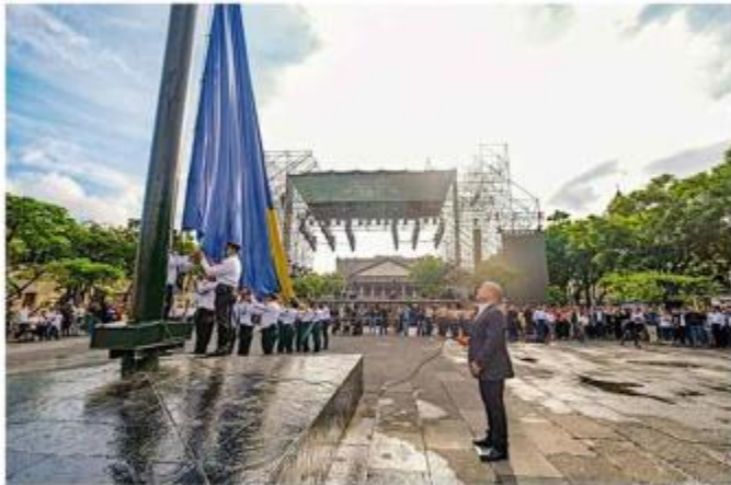
Alfaro acudió ayer a izar la Bandera de Jalisco.

“Desde Jalisco, en esta plaza, en el mes patrio (...) somos capaces de levantar la voz y de decir con firmeza: que aquí lucharemos por