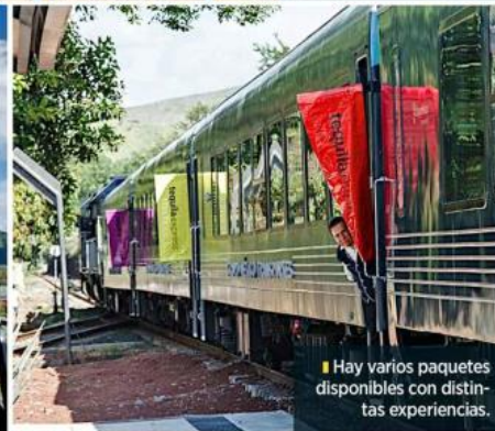
Hay varios paquetes disponibles con distintas experiencias.