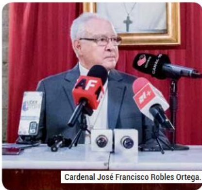
Cardenal José Francisco Robles Ortega.