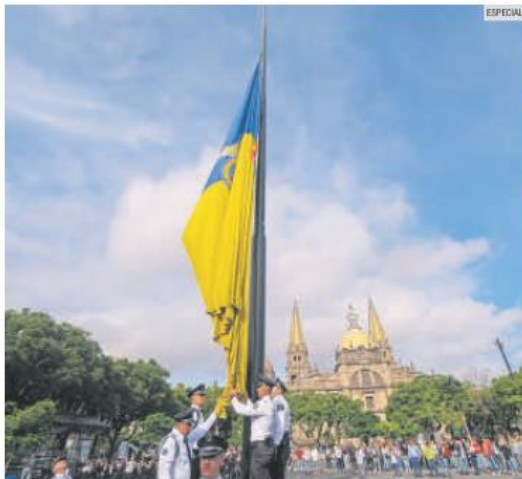
BANDERA ESTATAL. En la Plaza Liberación se realizó el izamiento.

“Por eso, en medio de los tiempos que vive este país, la decisión que tomó apenas unas horas el Congreso el Estado para no ser comparsa del desmantelamiento de la República, esa República que con tanto esfuerzo construimos, esa República de la que Jalisco forma parte con mucho orgullo, porque todos en esta plaza somos orgullosamente mexicanos y mexicanos, pero somos también orgullosamente jaliscienses”, indicó el mandatario.