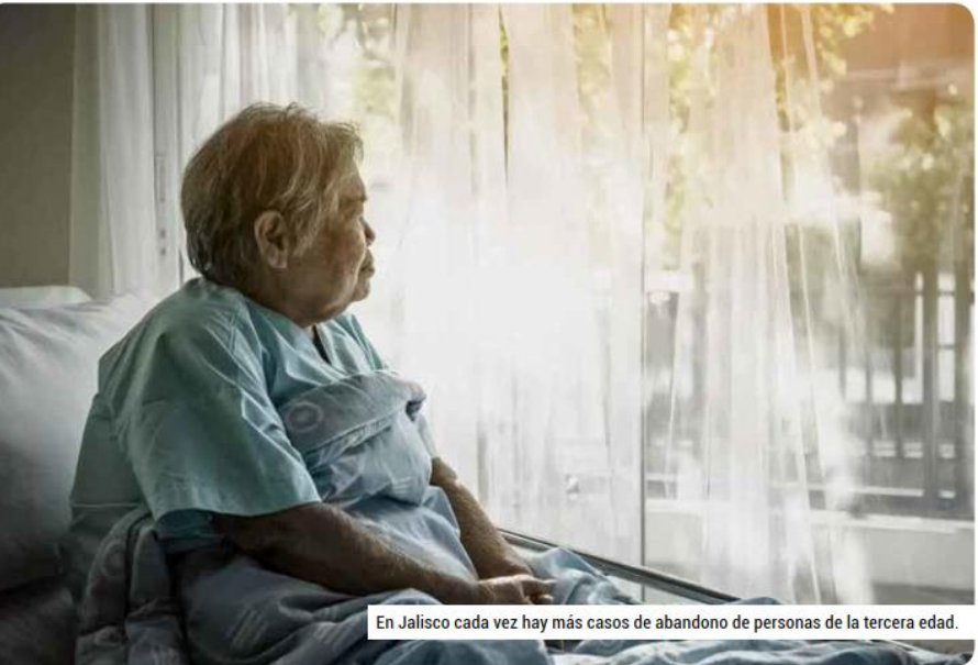
En Jalisco cada vez hay más casos de abandono de personas de la tercera edad.

No hubo, en aquellos que lo hicieron, ningún sentimiento que inhibiera o evitara que los hijos o esposos dejaran olvidados a sus familiares ancianos en el hospital.