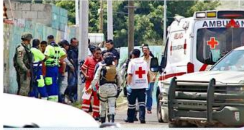
Agentes federales montaron un operativo en Tlajomulco.