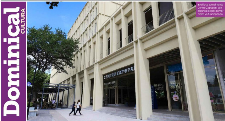
Así luce actualmente Centro Zapopan, con algunos locales comerciales ya funcionando.