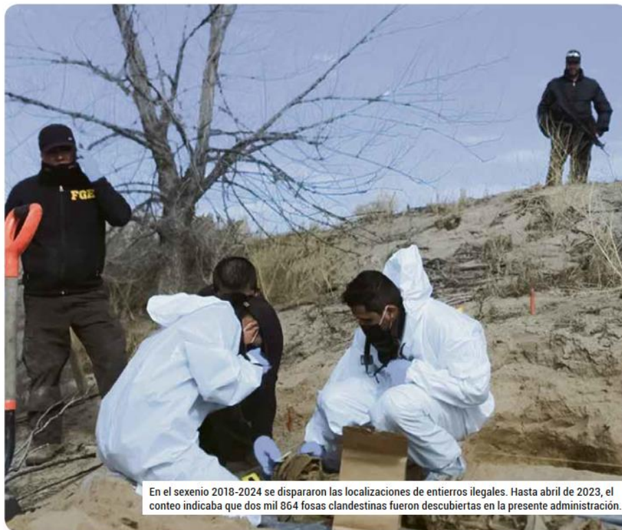
En el sexenio 2018-2024 se dispararon las localizaciones de entierros ilegales. Hasta abril de 2023, el conteo indicaba que dos mil 864 fosas clandestinas fueron descubiertas en la presente administración.

Con información del Observatorio Nacional Ciudadano (ONC), con el que Jalisco Cómo Vamos colabora, podemos sustentar, con cifras de algunos delitos, la incidencia de sucesos que cada cual trasladada a su sensación de inseguridad. De diciembre de 2018 a julio de 2024, el ONC tiene registrados, con datos del Secretariado Ejecutivo del Sistema Nacional de Seguridad (son los oficiales), 109 mil 272 víctimas de homicidio doloso, es decir, dos mil 703 asesinatos mensuales. La mayoría sigue impune. Más que en los sexenios de Calderón y Peña Nieto. Adicionamos cinco mil 379 feminicidios, asesinatos de mujeres perpetrados por ese motivo: ser mujeres, 79 mensuales.