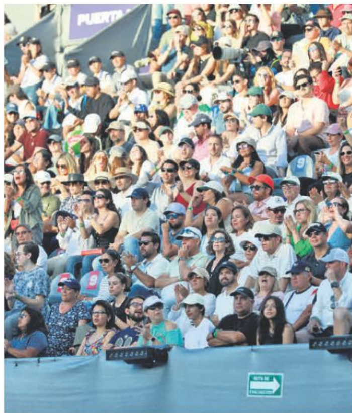
EVENTO IMPERDIBLE. El abierto tapatío se ha colocado en el gusto del público.