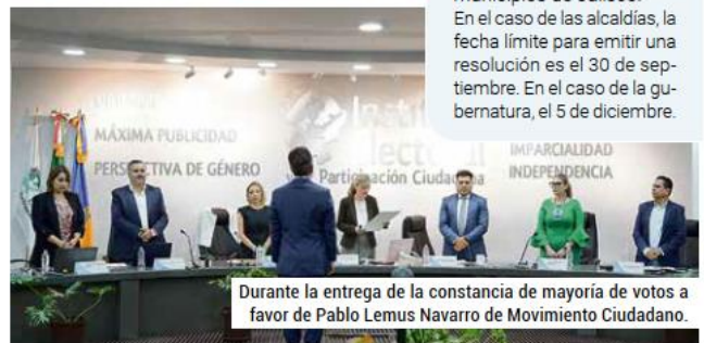
Durante la entrega de la constancia de mayoría de votos a favor de Pablo Lemus Navarro de Movimiento Ciudadano.

Después del proceso electoral del pasado 2 de junio, se presentaron 162 impugnaciones en los diferentes municipios de Jalisco. En el caso de las alcaldías, la fecha límite para emitir una resolución es el 30 de septiembre. En el caso de la gubernatura, el 5 de diciembre.