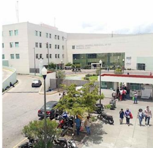
La agresión ocurrió en el Hospital General Regional 180.

“En cuanto se escabulle de este señor, que se le esca-