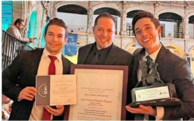
Los fundadores de Santas Alitas recibieron el premio.