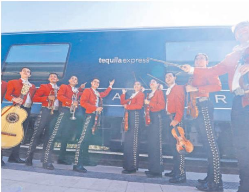
EXPERIENCIA. Visitantes disfrutaron de una degustación de tequila mientras viajan en el Tequila Express, sumergiéndose en la cultura agavera durante el recorrido.