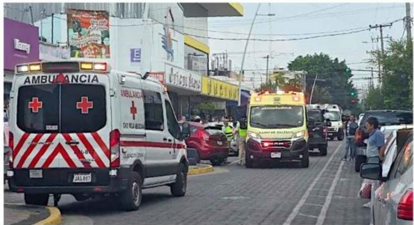
La riña provocó la movilización de policías y paramédicos.

“Tres jóvenes mencionan que venían caminando sobre la acera y, sin aparente moti-