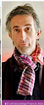
El artista belga Francis Alys será el encargado de inaugurar el espacio.

"Estuvimos insistiendo, se vino la pandemia y aunque interpusimos un Amparo que obligó al Consejo a decidir sobre el plebiscito, lo aprobaron pero lo dejaron en la congeladora... insistimos pero ya más nadie lo movió. No se trataba solo de detener la obra, de no hacerla, sino de consultar lo que la gente quiere y la