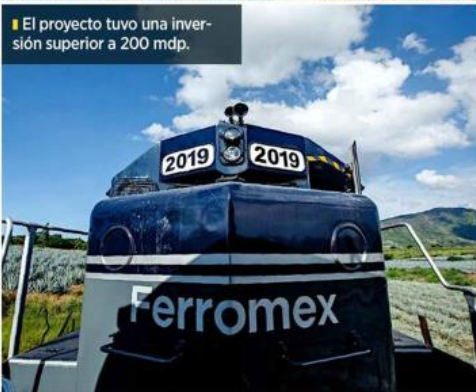
El proyecto tuvo una inversión superior a 200 mdp.