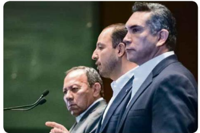
Dirigentes nacionales de partidos de oposición. De derecha a izquierda, Alejandro Moreno Cárdenas (PRI), Marko Cortés Mendoza (PAN) y Jesús Zambrano Grijalva (PRD).

Académico del ITESO. Correo electrónico: jermex@hotmail.com