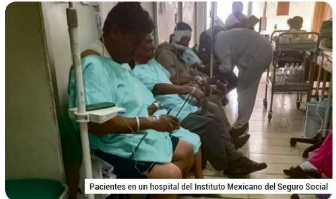
Pacientes en un hospital del Instituto Mexicano del Seguro Social

México enfrenta un envejecimiento progresivo de su población, lo que conlleva un aumento en la prevalencia de enfermedades crónicas como la diabetes, hipertensión, enfermedades cardiovasculares y cáncer. Estas enfermedades requieren atención médica continua y especializada por lo que se requerirán estrategias para responder a las crecientes demandas de atención médica para estas enfermedades. Esto incluye fortalecer la infraestructura hospitalaria, capacitar a más médicos especialistas y crear programas de prevención y promoción de la salud que ayuden a reducir la incidencia de estas enfermedades en la población más joven. A largo plazo, la prevención será clave para evitar que las enfermedades crónicas sigan saturando el sistema de salud.