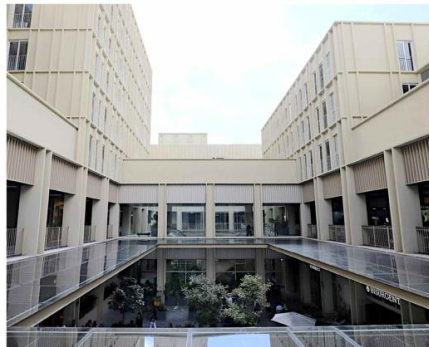
El espacio de Estación MAZ, será de 4 mil 200 metros cuadrados.

"Juegos de Niños" está conformada por una serie de piezas visuales que refieren cómo los niños y las niñas del mundo solían ocupar el espacio público para jugar antes de la modernidad.