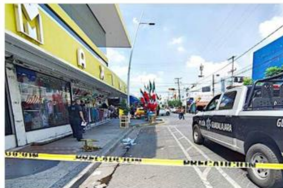
La Calle Andrés Terán fue cerrada por lo menos tres horas.

vo, otro grupo de masculinos llega y los agrede con pies y manos, resultado con heridas superficiales y con escoriaciones”, explicó un integrante de la Comisaría de Guadalajara.