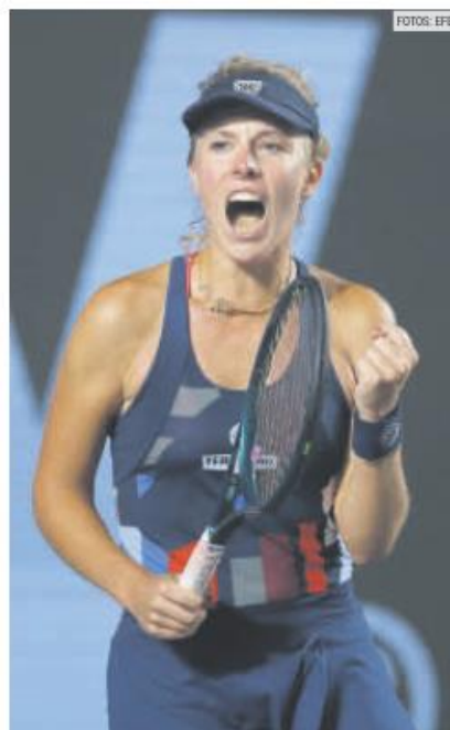
MAGDALENA FRECH. La polaca busca el título tras la derrota en la final de Praga.