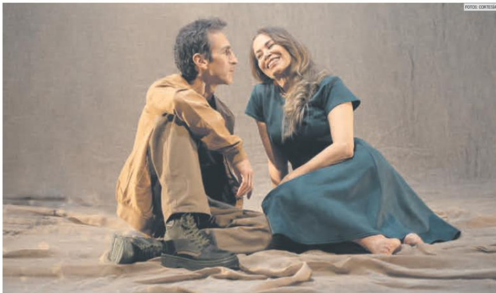
“PEQUEÑAS INFIDELIDADES”. Esta producción retrata el encuentro de una pareja luego de una terrible relación.