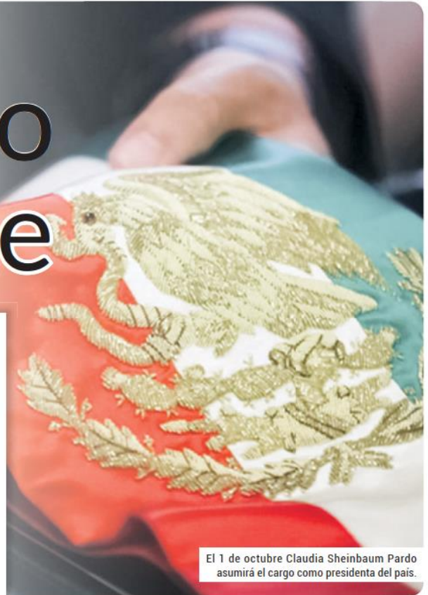
El 1 de octubre Claudia Sheinbaum Pardo asumirá el cargo como presidenta del país.

Desde luego, en esta prospectiva que Semanario ofrece a sus lectores, no se puede dejar de abordar el tema político