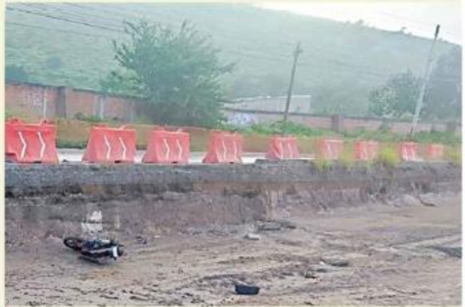
El sitio contaba con señalamientos y protecciones.

una clínica del IMSS, debido a la gravedad de sus lesiones. Mientras que el conductor fue retenido y quedó a disposición del Ministerio Público para deslindar responsabilidades.