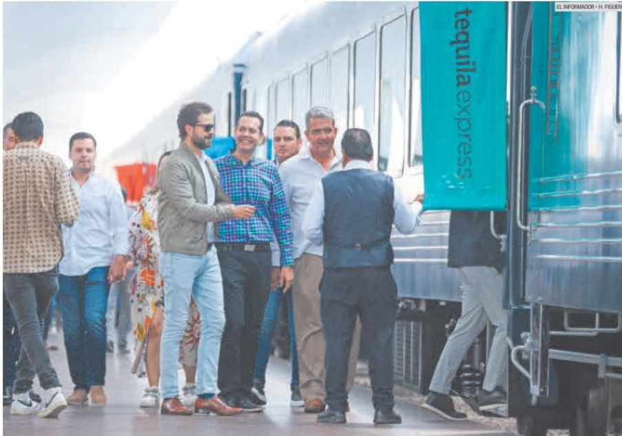
EN MARCHA. El icónico tren realiza su primer recorrido tras su relanzamiento, conectando a los visitantes con la cultura y tradiciones de Jalisco.

Prevén que se duplique la cantidad de turistas que visitan la región, así como un aumento en la derrama económica