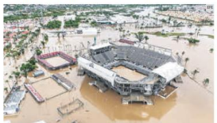
LA ARENA SUFRE AFECTACIONES. La sede del Abierto Mexicano de Tenis enfrenta daños severos en buena parte de sus instalaciones.