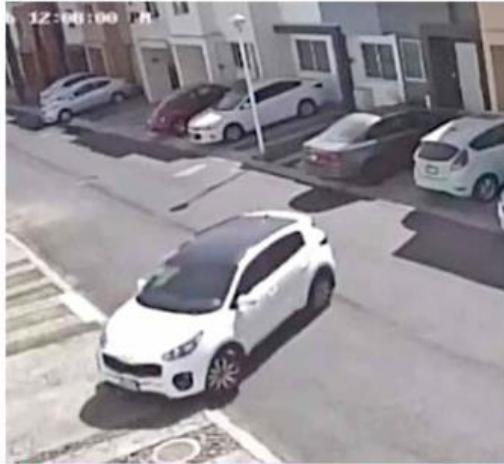
■ Alejandro "O" robó la camioneta de su ex pareja tras agredirla.