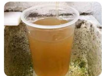
El agua potable en la ZMG no solo es turbia o "amarillenta" en múltiples colonias, sino que aunque las autoridades lo siguen negando, hay un problema de abastecimiento a toda la población.

Una de las soluciones que propone Gómez Reina a partir de este nuevo trienio que comienza en los municipios, es que los ciudadanos exijan un servicio de agua potable digno al que todos tenemos derecho y que las autoridades han dejado a deber porque es un tema que no pueden resolver ya que en la mayoría de los casos lo trabajan desde lo que cada municipio puede hacer y se les olvida que pertenecen a un Área Metropolitana y deben trabajar en conjunto.