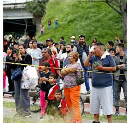
Los testigos no daban crédito de lo que pasaba.

Al cierre de esta edición, las autoridades no habían dado a conocer la superficie afectada, aunque la tienda tenía un área cercana a los 7 mil 200 metros cuadrados.