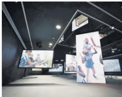
MUESTRA. La exposición cuenta con 30 pantallas, en las cuales se proyectan 19 videos en alta resolución.

La exposición ya ha recorrido varios países y ha sido bien recibida por el público. Roy mencionó que, aunque en EstaciónMAZ la disposición del espacio rompe con el recorrido más lineal que se había presen-