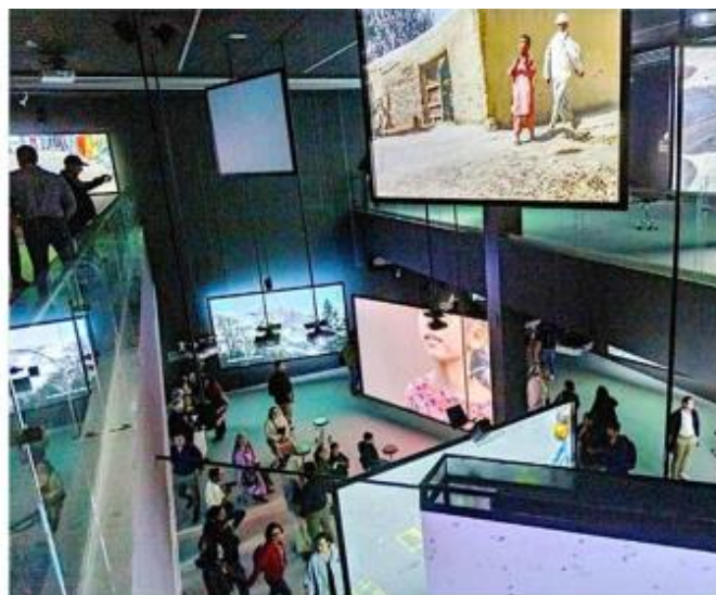
El nuevo museo, EstaciónMAZ, es un espacio de dos plantas ubicado en Centro Zapopan.

Con la exhibición que reúne la obra de 30 años del artista belga-mexicano Francis Aljés, inauguraron la EstaciónMAZ