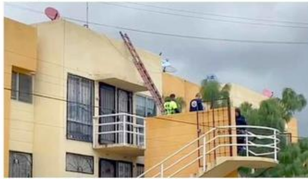
■ Una de las víctimas fue hallada en la azotea de unos departamentos en el Fraccionamiento Lomas del Mirador.

Las autoridades informaron que vecinos de un complejo de casas en la Avenida Sierra Nevada, cerca de Monte Elbrus, en la primera colonia, subieron a la azotea debido a que no había agua y querían ver las tuberías. En ese momento descubrieron el cadáver de un hombre que tenía heridas de bala y que estaba amarrado.