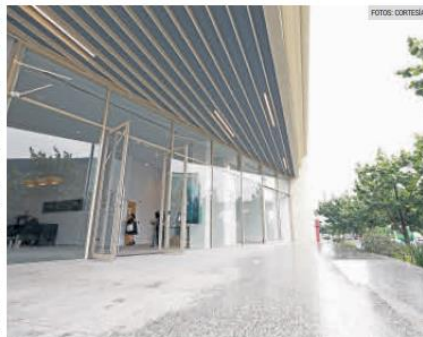
INSTALACIONES. Acceso al museo, en el cual se presentará muestras tanto nacionales como internacionales.