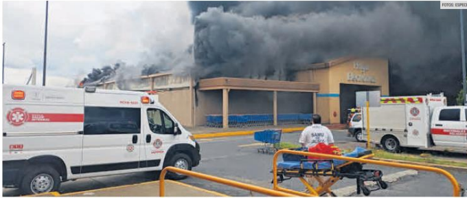
FUERZA. Acudieron casi 300 elementos de emergencias de 21 dependencias de los tres órdenes de Gobierno.

El fuego consumió prácticamente toda la tienda; 12 personas resultaron heridas, entre ellos seis elementos de bomberos