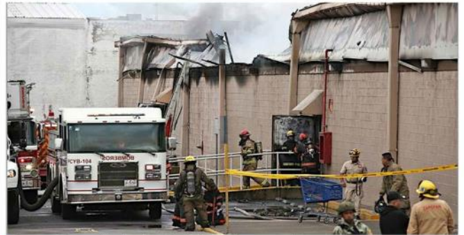
En unos minutos, el techo colapsó prácticamente por completo.

Todo el tiempo, miembros de la Guardia Nacional estuvieron atentos a que los accesos y salidas de la plaza estuvieran libres para que los conductores de los contenedores de agua no tuvieran dificultades ni se pusiera en riesgo a alguna persona.