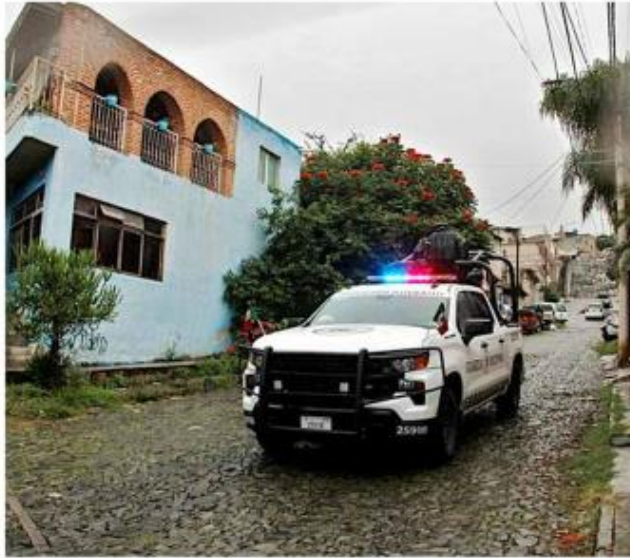
El fallecido quedó tirado atrás de un carro estacionado.