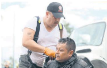
AGOTADOR. Combatieron el fuego por varias horas hasta que quedó controlado.

"Esta cadena de supermercados, en su estrategia y su forma de operar, ubica sus tiendas claramente donde hace falta un punto de consolidación y distribución de alimentos, y este es el caso que está en una zona en la periferia de la ciudad donde requiere de este servicio y de otro tipo de productos de consumo diario", agregó.