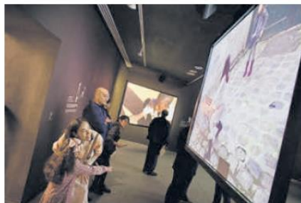
EXHIBICIÓN. "Juegos de niños" es un registro visual de cómo las infancias del mundo se divierten.