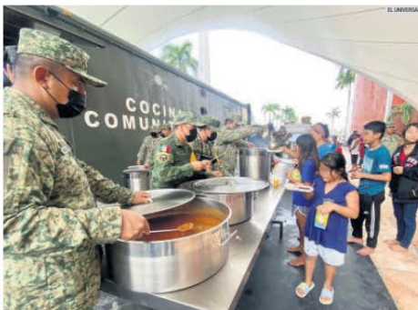
ALBERGUES. La Sedena instaló comedores comunitarios en Guerrero, Michoacán y Oaxaca, para atender a los damnificados tras el paso del huracán John.