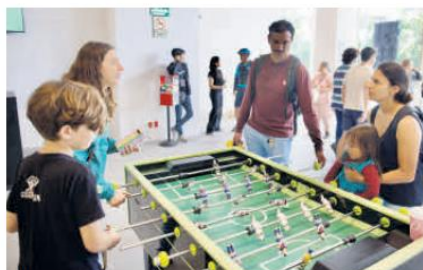
ÁREAS. El nuevo museo cuenta con espacios para el recreo, el descanso y la convivencia.