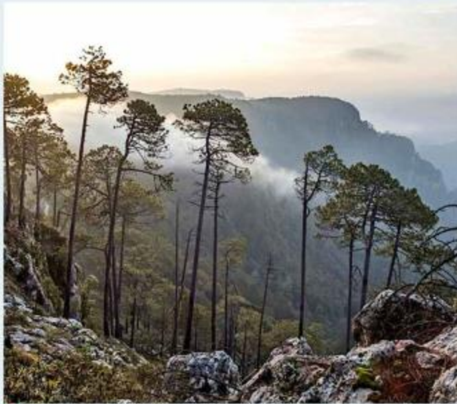
La mina que estaría en territorio de la comunidad indígena, se encuentra cerca de los límites de Sierra de Manantlán (foto).

“El Magistrado resolvió que como había terceros en conflicto que reclamaban que las tierras de la comunidad indígena eran suyas, entonces no iba a dar una resolución en tanto no se resolviera