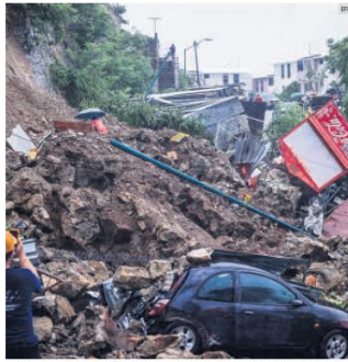
ESTELA DE DESTRUCCIÓN. Zonas urbanas de Guerrero y Oaxaca sufrieron daños.