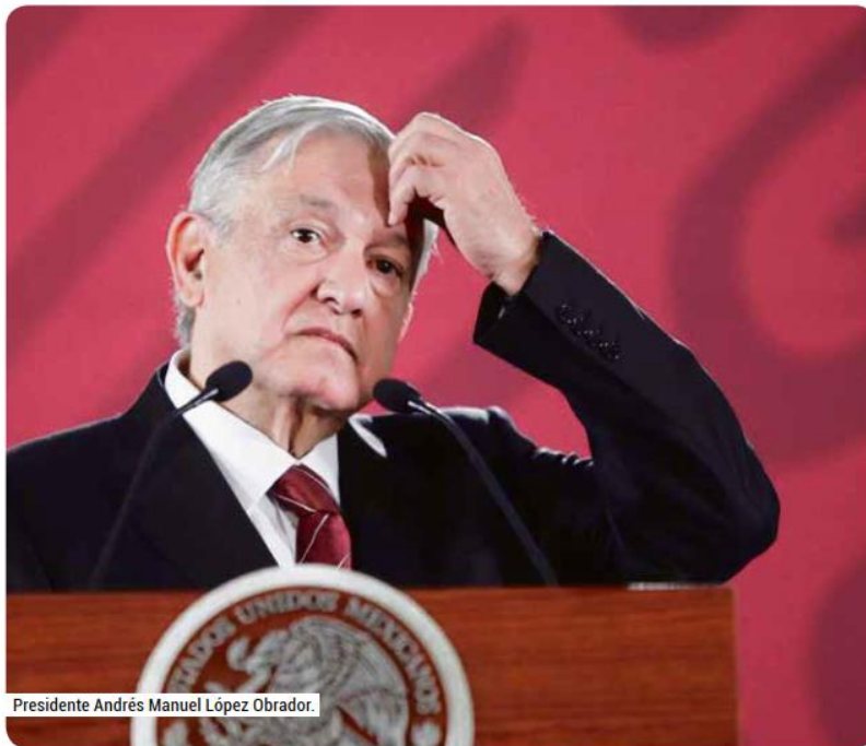
Presidente Andrés Manuel López Obrador.