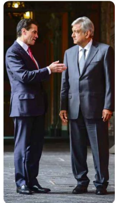
AMLO y el expresidente Enrique Peña Nieto, durante el periodo de transición en 2018.

El autor es LAE, diplomado en Filosofía y periodista. Académico de la Universidad Autónoma de Guadalajara.