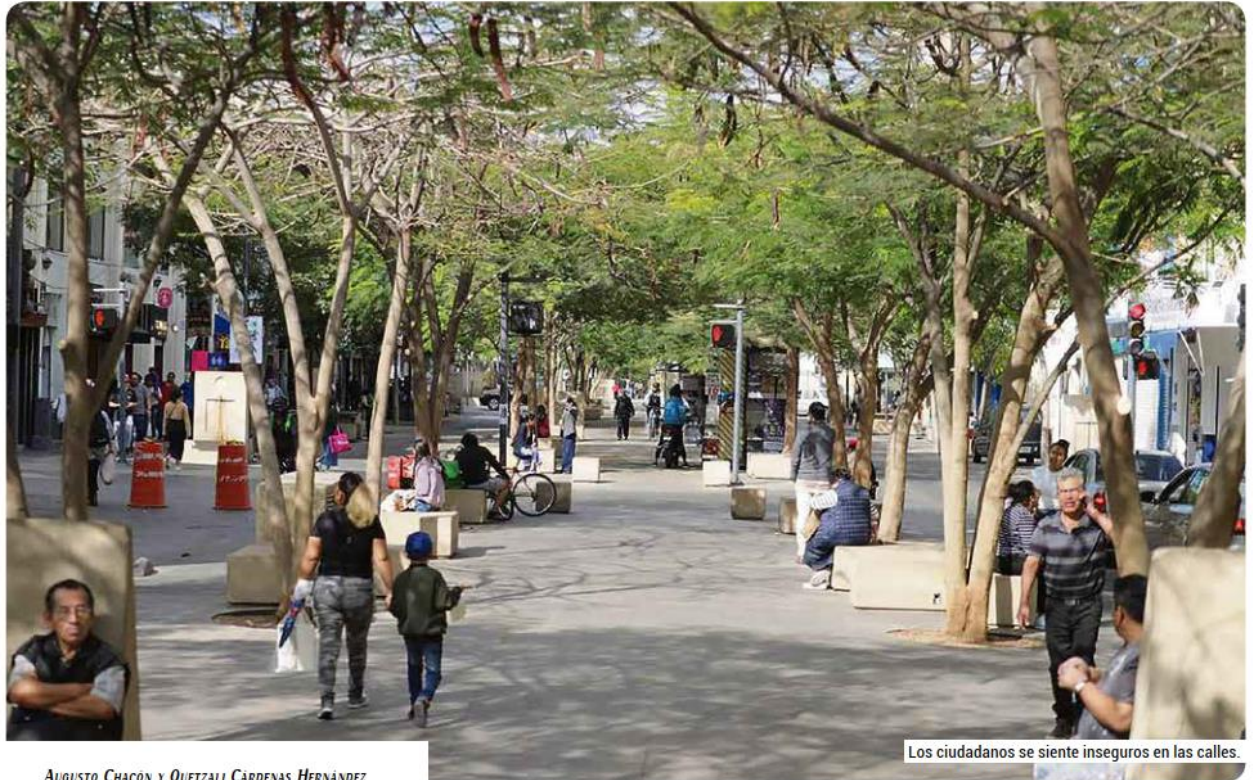
Los ciudadanos se sienten inseguros en las calles.