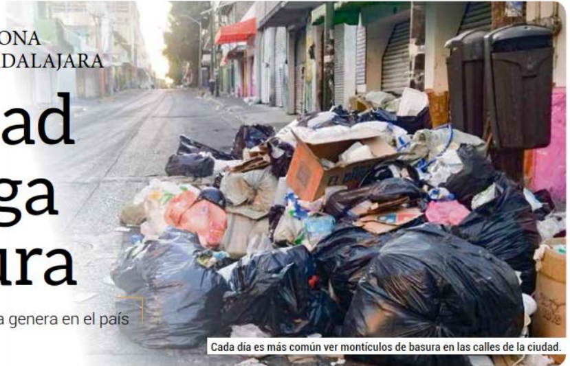
Cada día es más común ver montículos de basura en las calles de la ciudad.

Los gobiernos municipales no podrán por sí mismos resolver este problema. Necesitamos como ciudadanía hacernos responsables del reto de reducir la basura que tiramos, aprender a separarla y reciclar lo más posible.