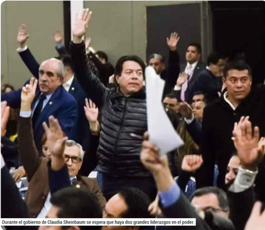
Durante el gobierno de Claudia Sheinbaum se espera que haya dos grandes liderazgos en el poder.

Lo que sucedió este fin de semana en la asamblea nacional de Morena siembra una gran duda y apunta a una situación diferente, Claudia Sheinbaum Pardo será la líder del gobierno, pero no será la líder del partido. La configuración de la nueva dirigencia apunta a que el liderazgo de Morena seguirá en López Obrador a través de su hijo y de su exsecretaría de Gobernación.