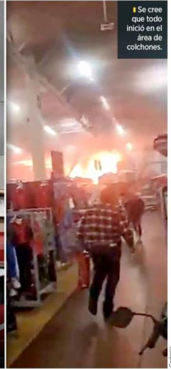
Se cree que todo inició en el área de colchones.