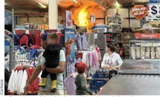
En redes sociales circularon videos tanto del interior como exterior del supermercado.