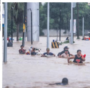
ACAPULCO BAJO EL AGUA. Los habitantes del puerto enfrentaron severas inundaciones en la zona urbana, así como el colapso del transporte público.