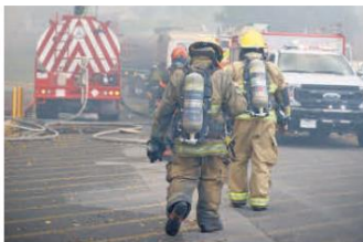
HERIDOS. Seis bomberos resultaron lesionados.