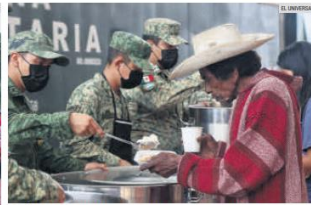
EJÉRCITO AL RESCATE. La Sedena ofreció comida a los afectados.