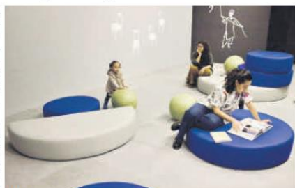
CULTURA. El museo EstaciónMaz busca acercar el arte a las niñas y los niños de la ciudad.

La disposición de la exposición en EstaciónMAZ, donde se juega con los elementos de altura y luz, permite una experiencia sensorial única, conectando los distintos países representados en los videos. Cabe señalar que uno de los aspectos más interesantes de la exposición es la experiencia inmersiva que ofrece. Se han dispuesto asientos para que los visitantes puedan observar los videos cómodamente, invitando a la reflexión sobre los juegos que conectan a las infancias de diversas culturas. Además, las pantallas de diferentes tamaños crean una sensación de inmersión, haciendo que el espectador se sienta parte del entorno lúdico.