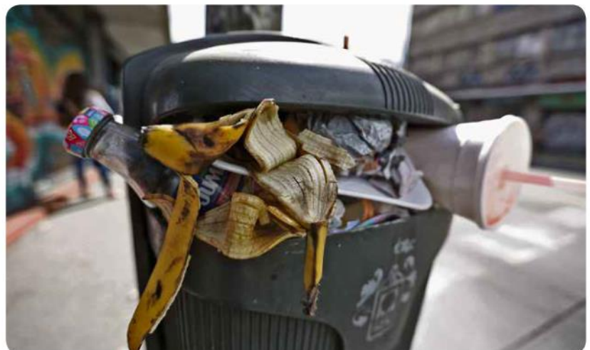
Uno de los principales retos es la separación de residuos.