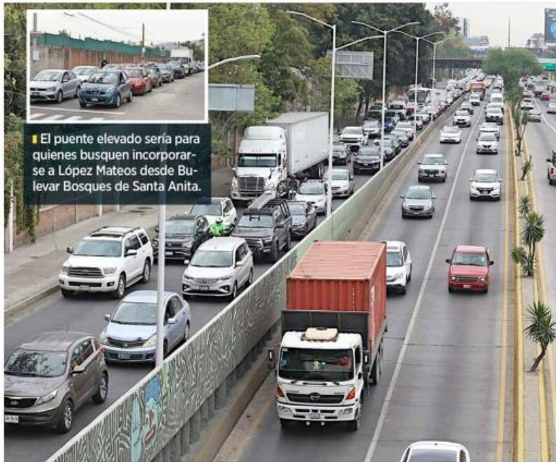
El puente elevado sería para quienes busquen incorporarse a López Mateos desde Bulevar Bosques de Santa Anita.