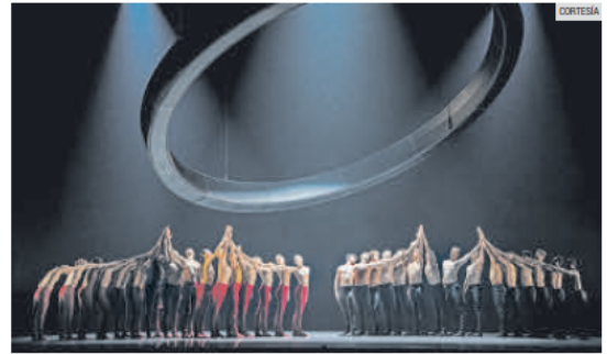
COREOGRAFÍA. Talento de la compañía de danza, Les Grands Ballets Canadiens.