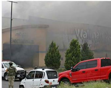
La tienda media alrededor de 90 por 80 metros cuadrados.

Los empleados del Walmart intentaron apagar el fuego ellos mismos con extinto-