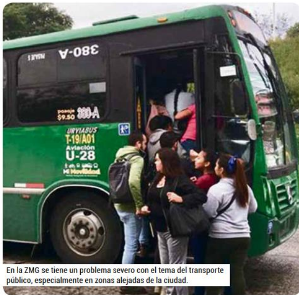
En la ZMG se tiene un problema severo con el tema del transporte público, especialmente en zonas alejadas de la ciudad.