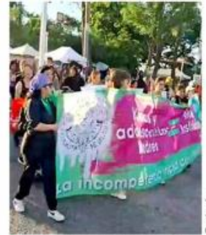
El contingente avanzó por Avenida Vallarta.

"Hoy nos enfocamos en visibilizar esta problemática porque a pesar de que el Estado es el encargado de brindar herramientas de protección y acceso al aborto para