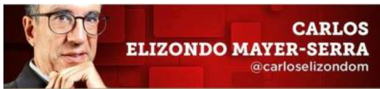
CARLOS ELIZONDO MAYER-SERRA @carloselizondom

El éxito político de AMLO está montado sobre un raquítico crecimiento y obras de poca utilidad.