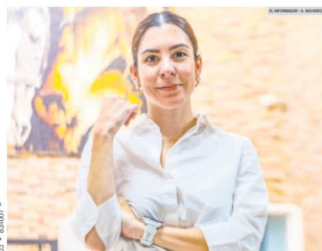
CINDY BLANCO. La próxima secretaria de Desarrollo Económico reforzará el Fondo Jalisco de Fomento Empresarial para beneficiar a más jaliscoenses.