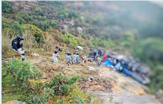
El autobús cayó a un barranco después del impacto con el remolque.