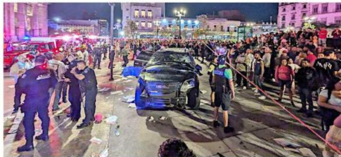
El presunto ladrón fue sacado del vehículo a golpes luego que arrolló a los manifestantes.