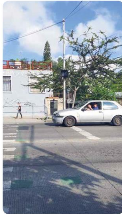
En la avenida Base Aérea hay por lo menos seis semáforos peatonales que, a decir de los vecinos, jamás han funcionado.

Prosiguió: "Aquí todos sabemos que los tránsitos solo están de adorno cuando vienen. ¿Usted cree que me ayudan a pasar cuando vengo con la carriola y alguno se le mete en la cara? No. Se hacen a un rincón porque el cruce con Juan Gil Preciado es muy peligroso; de mi vida a su vida, claro que van a preferir su vida; y aquí es donde deberían de poner esos semáforos, porque se necesitan".