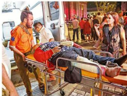
Los lesionados fueron trasladados a la Cruz Roja y a la Cruz Verde, aunque otros fueron dados de alta en el lugar.

empujada y arrollada. Un grupo de mujeres que presenció el hecho se agrupó a unos metros del cerco y comenzaron a rezar el rosario para agradecer que ninguna persona había fallecido y pe-