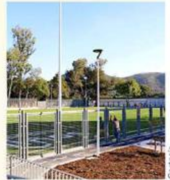
■ En la unidad invirtieron 20 millones de pesos.

Asimismo, renovaron todo el mobiliario urbano, construyeron áreas para picnic, una cancha de fútbol profesional, baños, una pista de trote y crucero seguros en los alrededores.