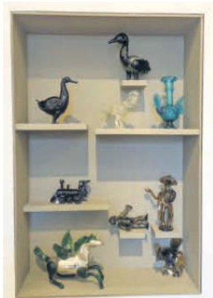
ARTE. Piezas de diversos materiales están presentes.