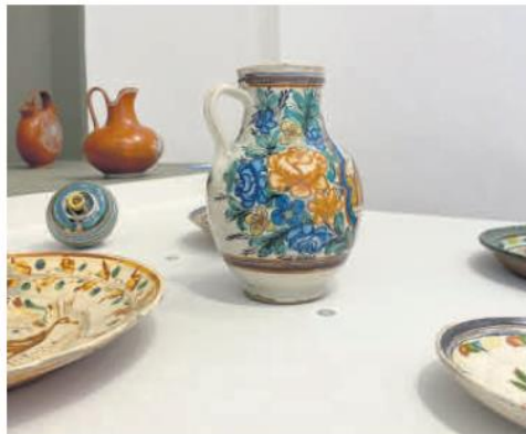
ARTE. El color está presente en cada pieza.