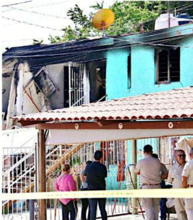
■ Una fuga de gas provocó la explosión en la casa.

“Soy policía y ahora sí que les digo: me tocó ser primer respondiente de mi propio caso, fui la primera en llegar y a mí me tocó firmar de los tres todo (...) ha sido devastador para mí, muy difícil, pero la familia y las amistades, compañeros de trabajo, me han apoyado muchísimo, no me han dejado sola para