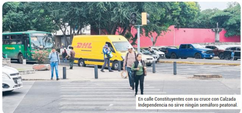
En calle Constituyentes con su cruce con Calzada Independencia no sirve ningún semáforo peatonal.

No obstante, está marcado el cruce peatonal en la carpeta asfáltica. Semanario fue testigo de cómo conductores insultaron a una pareja de personas de la tercera edad mientras caminaban y pedían consideración para que respetaran el paso al peatón.