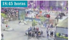
18:45 horas PERSECUCIÓN. Tras cobrar la camioneta, el responsable se dio a la huida por la plazaola.