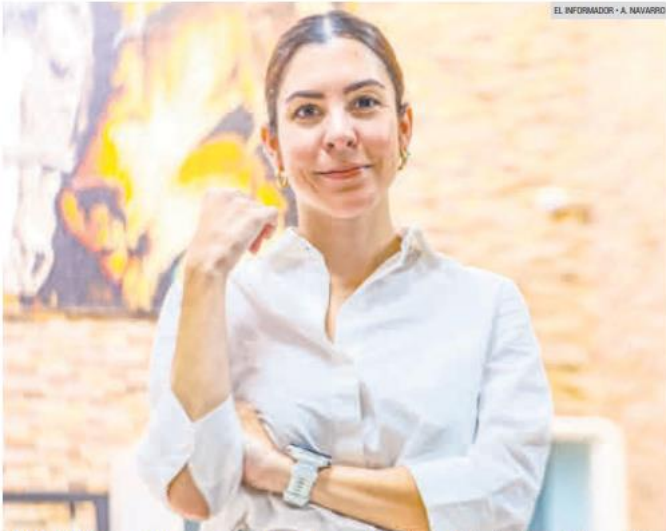
CINDY BLANCO. La próxima secretaria de Desarrollo Económico reforzará el Fondo Jalisco de Fomento Empresarial para beneficiar a más jaliscienses.