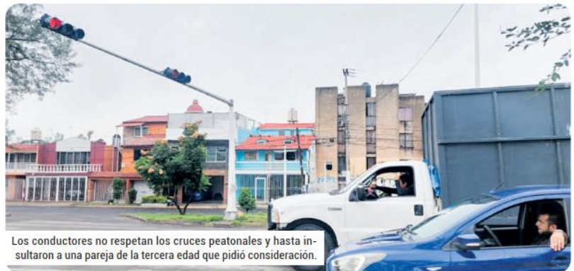
Los conductores no respetan los cruces peatonales y hasta insultaron a una pareja de la tercera edad que pidió consideración.

"En esta vialidad siempre ha habido muertos; ahí mataron a uno; allá me atropellaron a mí (...) Nun-