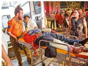
Los lesionados fueron trasladados a la Cruz Roja y a la Cruz Verde, aunque otros fueron dados de alta en el lugar.

empujada y arrollada. Un grupo de mujeres que presenció el hecho se agrupó a unos metros del cerco y comenzaron a rezar el rosario para agradecer que ninguna persona había fallecido y pe-