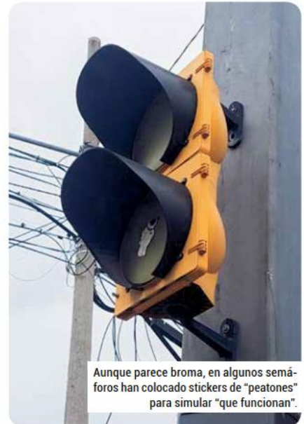
Aunque parece broma, en algunos semáforos han colocado stickers de "peatones" para simular "que funcionan".