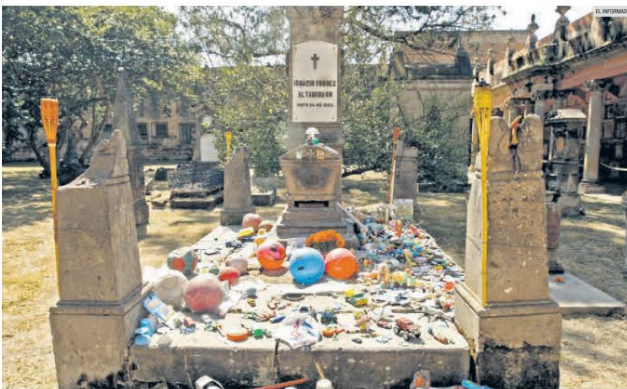
PANTEÓN DE BELÉN. En este sitio se encuentra la tumba de "Nachito", al cual la gente le lleva juguetes.