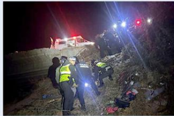
Paramédicos y bomberos auxiliaron a los afectados.

La Guardia Nacional informó que activó el Plan