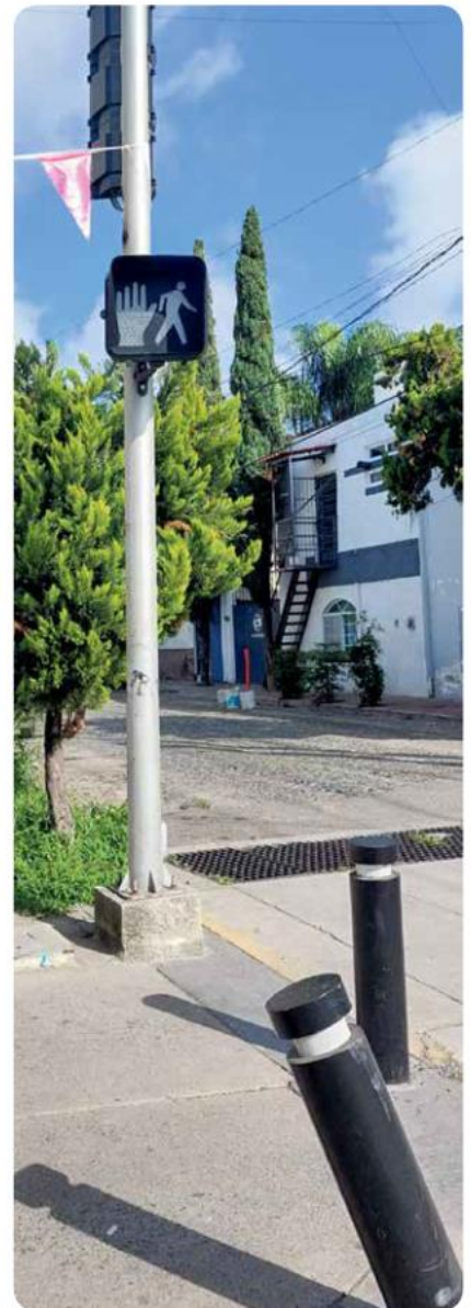
Calle Sexta Sur sobre avenida Base Aérea.