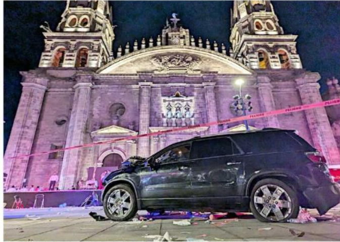
El vehículo robado quedó detenido justo frente a la Catedral Metropolitana.

Aunque el vehículo se ve avanzar lento, era tanta la gente concentrada en el lugar que no toda tuvo espacio para alejarse, por lo que fue