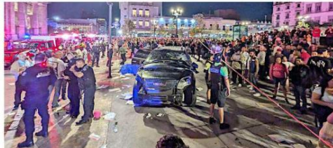
El presunto ladrón fue sacado del vehículo a golpes luego que arrolló a los manifestantes.