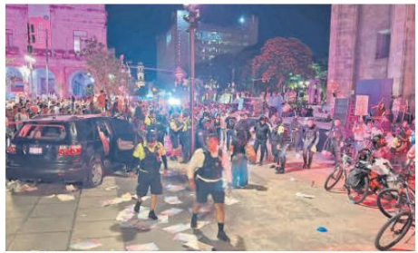
INVESTIGAN. Elementos de seguridad acordonaron el área y comenzaron las investigaciones para esclarecer el accidente en la plazaola.