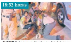
18:52 horas CHOQUE. Embiste a la multitud frente a Catedral, dejando 10 lesionados.