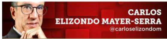
CARLOS ELIZONDO MAYER-SERRA @carloelizondom

La elección del Poder Judicial no otorga poder al pueblo; es una costosa demagogia.