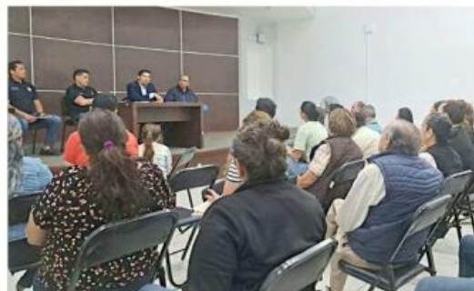
Denunciante fueron recibidos por funcionarios estatales.

El caso se destapó en enero de este año, cuando decenas de afectados comenzaron a organizarse para reclamar la falta de pago de rendimientos.