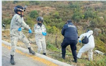
La Guardia Nacional colaboró en la emergencia.

GNA de auxilio. Se encargó de acordonar y mantener la seguridad en la zona, mien-