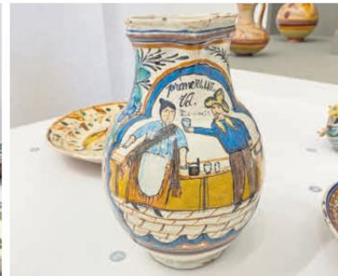
OBJETIVO. La riqueza cultural de México se ve reflejada en esta exhibición.