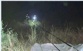
Bomberos utilizaron un sistema de cuerdas para el rescate.

Tras recibir una llamada de emergencia, rescatistas de Unión de Tula, así como de la Comandancia Regional de El Grullo, perteneciente a la UEPCBJ, acudieron al sitio para buscar sobrevivientes.