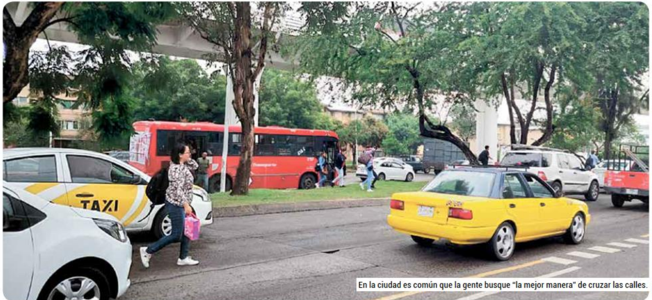
En la ciudad es común que la gente busque "la mejor manera" de cruzar las calles.