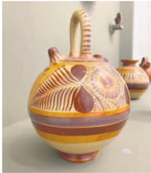
OBJETIVO. La exhibición busca enaltecer la relevancia histórica de la alfarería nacional.