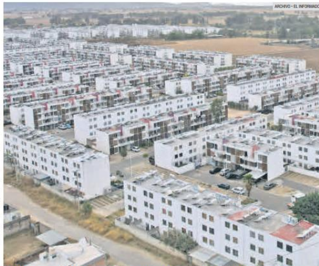
BENEFICIOS. La vivienda económica ayudará a mejorar las condiciones de vida de familias mexicanas.

De esta forma, se abre camino para poder cumplir con las metas establecidas en coordinación de los tres órdenes de gobierno (municipios, Estado y Federación) para implemen-