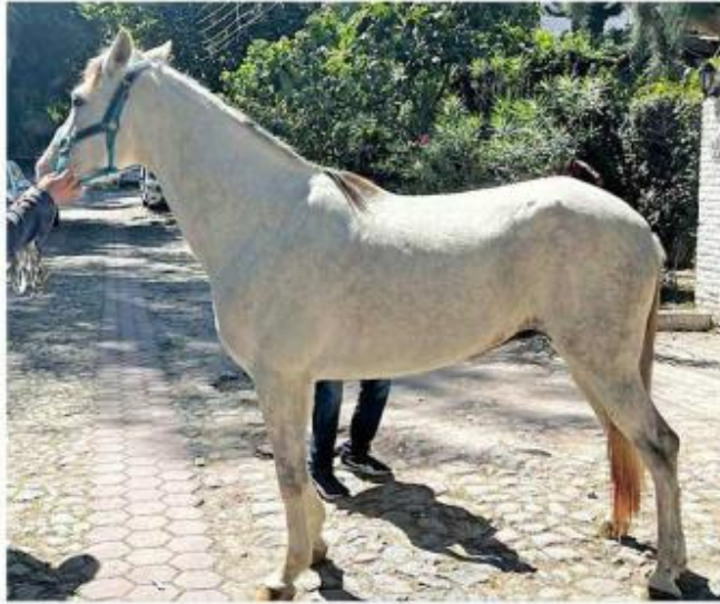
■ Estiman que la yegua tiene 3 años de edad.

vientre por los espuelazos que se le dieron. Trae una claudicación en una de las manos. Entonces ya está la persona privada que se hará cargo del resguardo. Él llevará esta yegua a atención