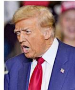
Donald Trump, ayer en un acto de campaña.

A base de jonrones, los Dodgers adelantan 2-0 en la Serie Mundial, pero Ohtani se lesiona. CANCHA