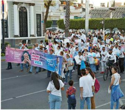
El contingente marchó desde el Templo Expiatorio hasta la Catedral Metropolitana.

A las 17:00 horas comenzaron las actividades afuera del Expiatorio, donde los congregados rezaron el ro-