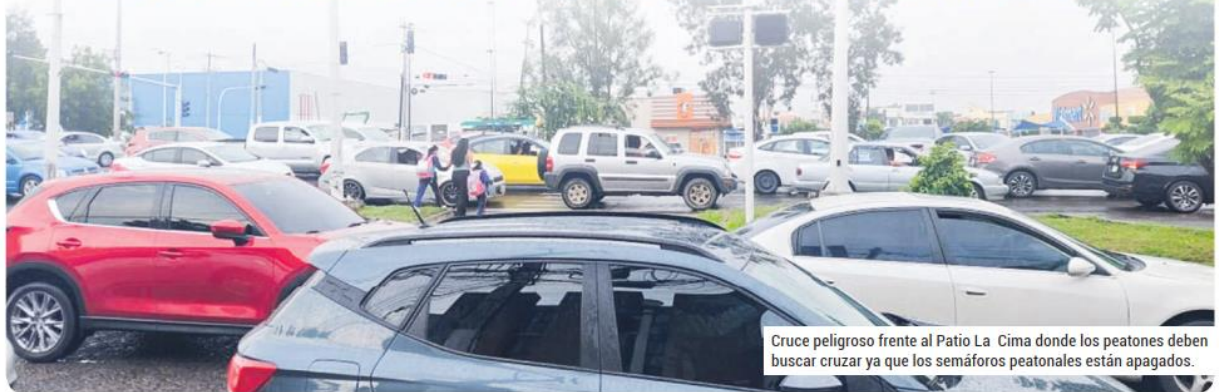
Cruce peligroso frente al Patio La Cima donde los peatones deben buscar cruzar ya que los semáforos peatonales están apagados.