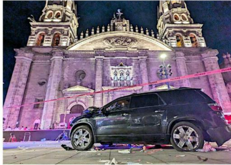
El vehículo robado quedó detenido justo frente a la Catedral Metropolitana.

Aunque el vehículo se fue avanzando lento, era tanta la gente concentrada en el lugar que no toda tuvo espacio para alejarse, por lo que fue