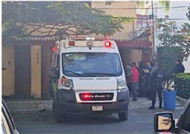
La agresión sucedió en la Colonia Moderna.

Oficiales de la División Especializada en la Atención a la Violencia contra las Mujeres en razón de Género de