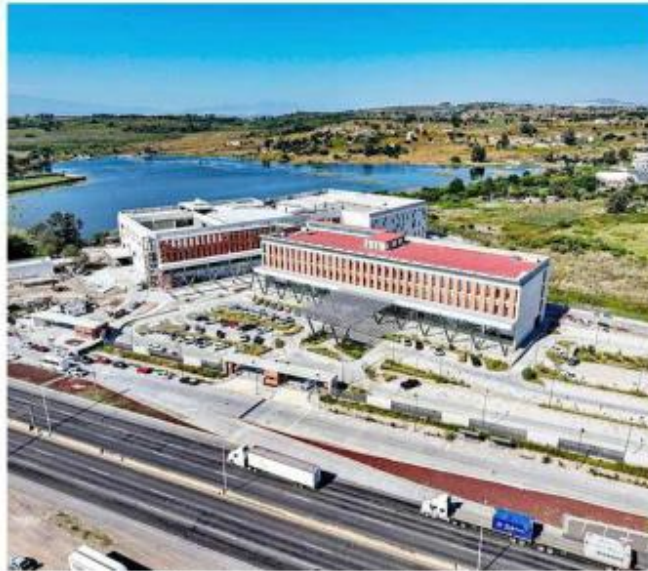
■ El Hospital Civil de Oriente estaría casi concluido.

Mientras el edificio B, con una superficie superior a 40 mil metros cuadrados, afirman que está por concluir. Ahí se hallarán los cuartos de