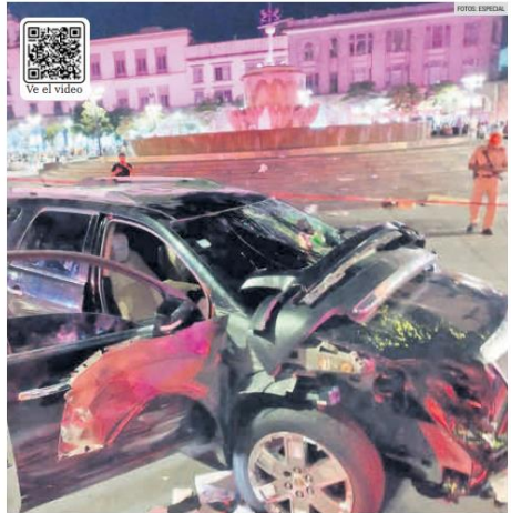
DANOS. Así quedó la camioneta tras embestir a otro vehículo, una motocicleta y a varios peatones en el Centro de Guadalajara.

El Gobierno de Jalisco reporta menos internos en sus cárceles, pero repartió más contratos millonarios a proveedoras de alimentos sin mayores detalles