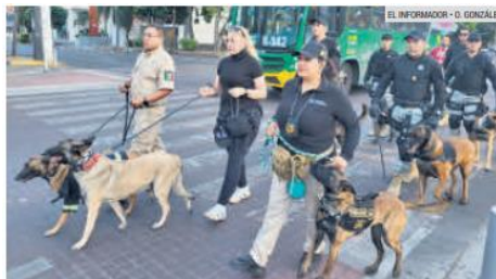
MARCHA. Figuraron los escuadrones caninos en el paseo por Chapultepec.

En la Plaza de la República se hizo un altar de muertos en conmemoración del reconocimiento por parte de la Iglesia Católica de que los perros tienen alma, por lo que se busca concientizar a la población sobre el cuidado de las mascotas.