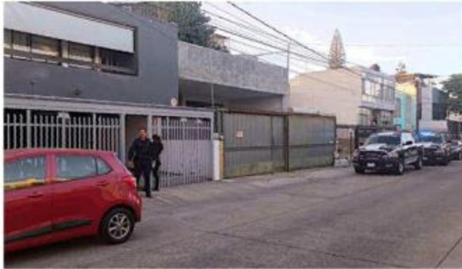
El atraco ocurrió en la Colonia Ladrón de Guevara.