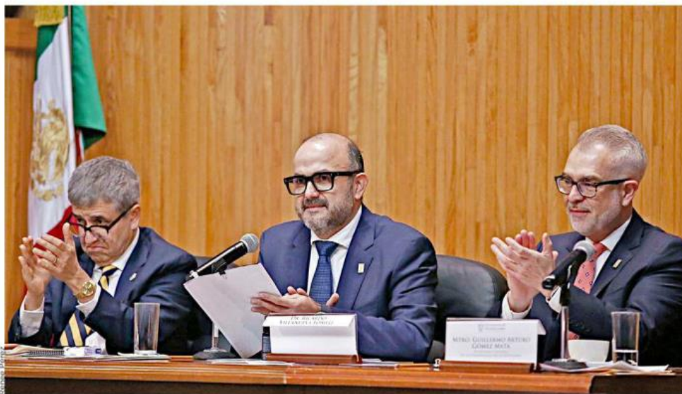
Villanueva señaló que, tras la elección de Planter, debe valorar su futuro profesional.

Señala académico que si se va antes, hay condiciones que lo permiten