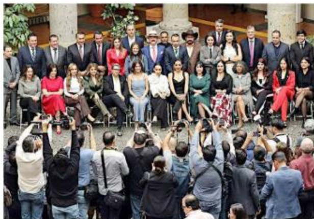
La Legislatura 64 entró en funciones el 1 de noviembre.

“La Coordinación de Administración y Finanzas elaborará los contratos laborales para estos supuestos por un lapso que no exceda el periodo constitucional de la presente Legislatura”, indica el acuerdo avalado.