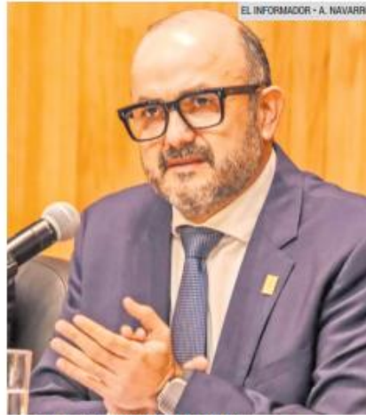
RICARDO VILLANUEVA LOMELÍ. Gestionará recursos en los Gobiernos estatal y federal.