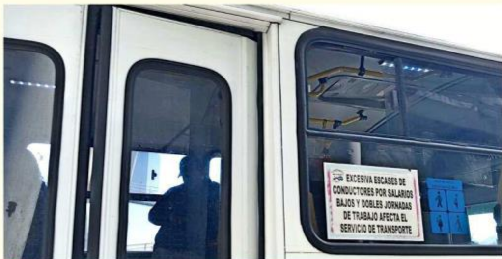
Algunas unidades operan con letreros señalando las condiciones laborales injustas.

“Rutas que tienen que dar frecuencia de cinco minutos, ahorita dan una frecuencia de 20; entonces, en cuanto llega el conductor sale porque ya se abrió la frecuencia, la gente está esperando, no tenemos tiempo de nada y ya el conductor en el transcurso del camino ya va