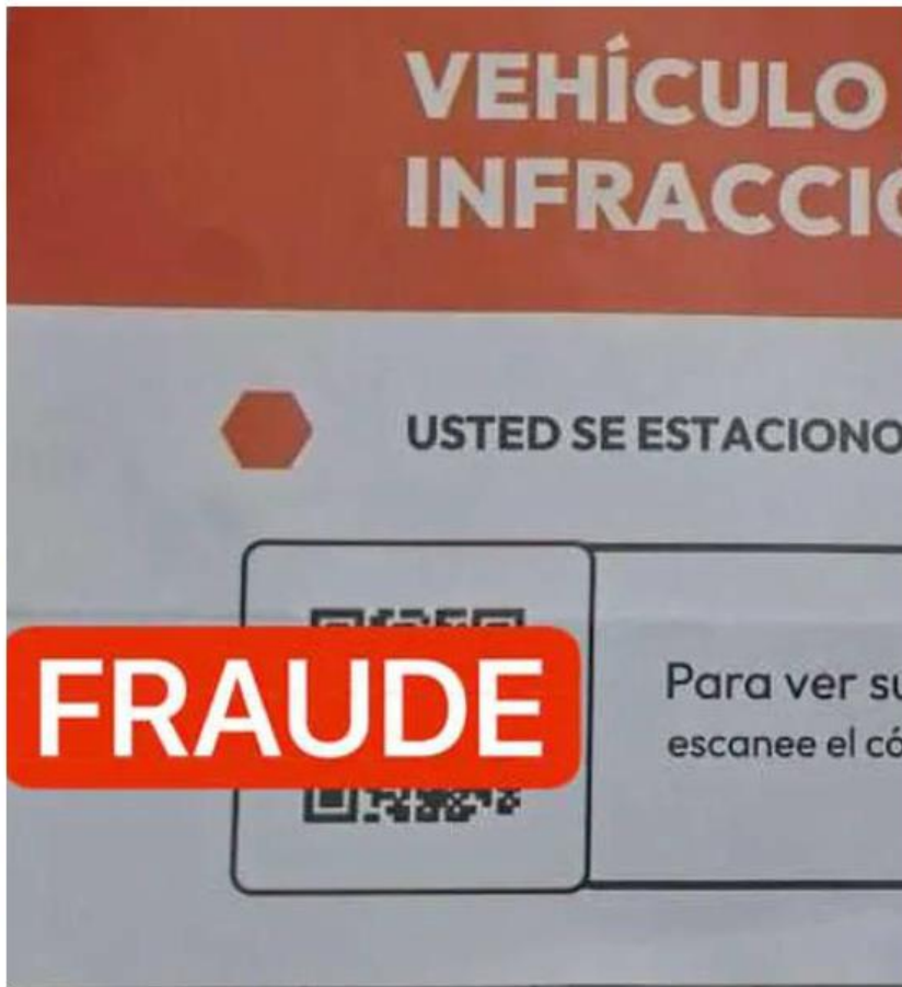
El gobierno pidió a la población mantenerse alerta y no escanear códigos QR de procedencia desconocida, especialmente si se encuentran en avisos dejados en vehículos. ESPECIAL

El modus operandi de los responsables de este fraude es dejar