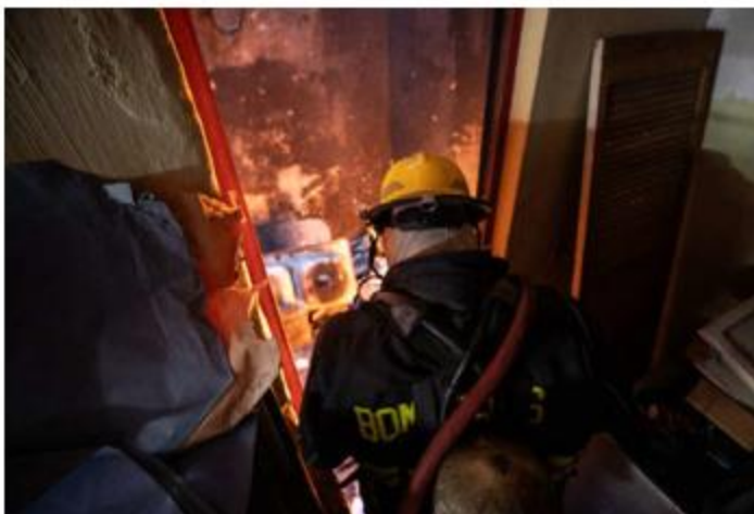
SINIESTRO. Durante la tarde de este viernes se registró un incendio en la planta baja de un domicilio ubicado en la colonia Atlas de Guadalajara. Solo se quemó algo de basura y madera.