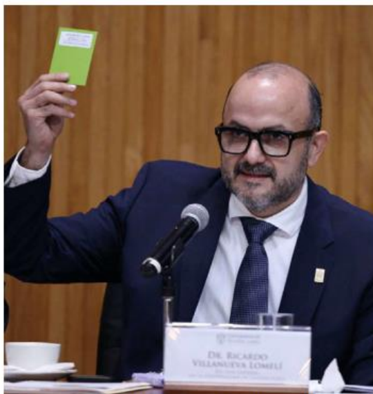
Destacó que se siente satisfecho y orgulloso de lo que ha logrado durante su gestión al frente de la UdeG.