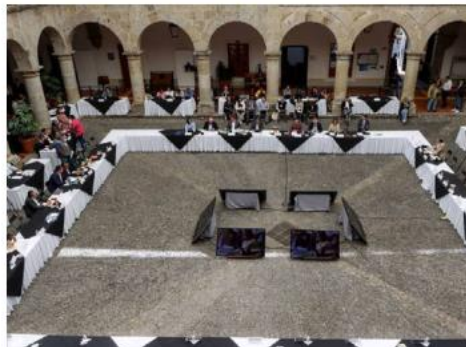
Realizan Glosas de Seguridad y Economía.

También se realizó la glosa correspondiente al desarrollo económico y las diversas áreas que las conforman. Los titulares de las Secretarías resolvieron las dudas en torno al informe presentado por el gobernador Enrique Alfaro. Dentro de los cuestionamientos, se puso de manifiesto la situación actual de los productores y trabajadores del campo, aunque en general, reconocieron el trabajo que se ha hecho para concretar la estabilidad económica de Jalisco, aunque son conscientes de que faltan muchos rubros por mejorar. —