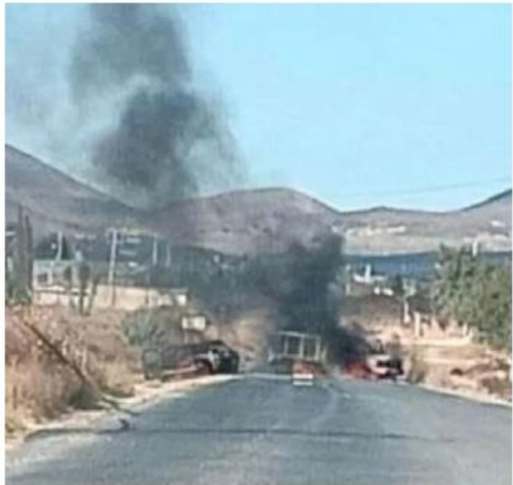
Varios sujetos armados bloquearon carreteras e incendiaron vehículos en los límites de Jalisco y Zacatecas.

Fuentes policiacas también aseguraron que se encuen-