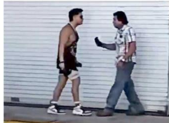
La agresión ocurrió en Puerto Vallarta.

Pese a que testigos pidieron la intervención de paramédicos, la víctima murió en el lugar.