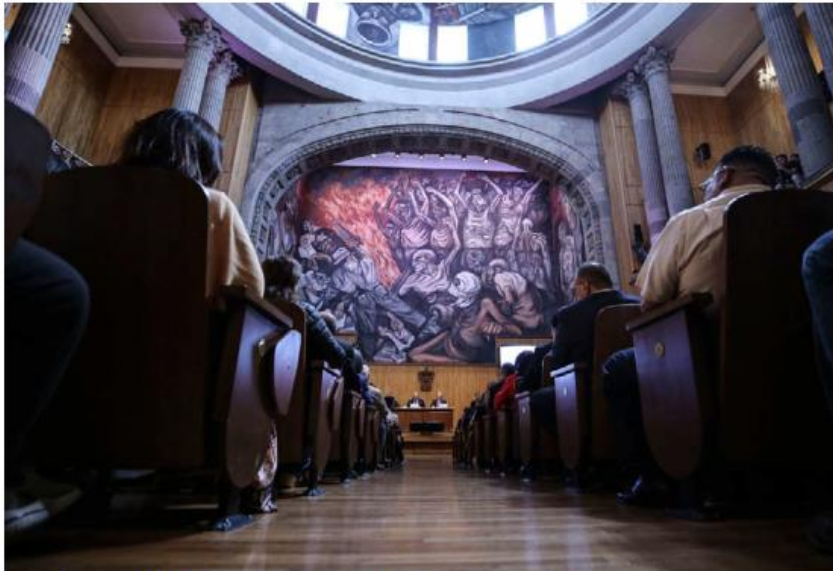
Dirigirá la universidad del 1 de abril de 2025 al 31 de marzo de 2031. ESPECIAL