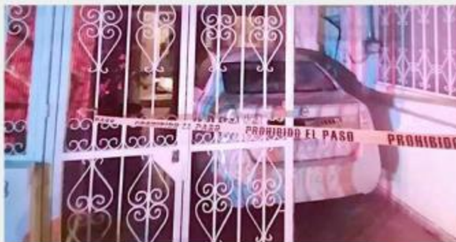
■ En Tlaquepaque ocurrió un doble homicidio.

Personas que conocían a la pareja explicaron a las