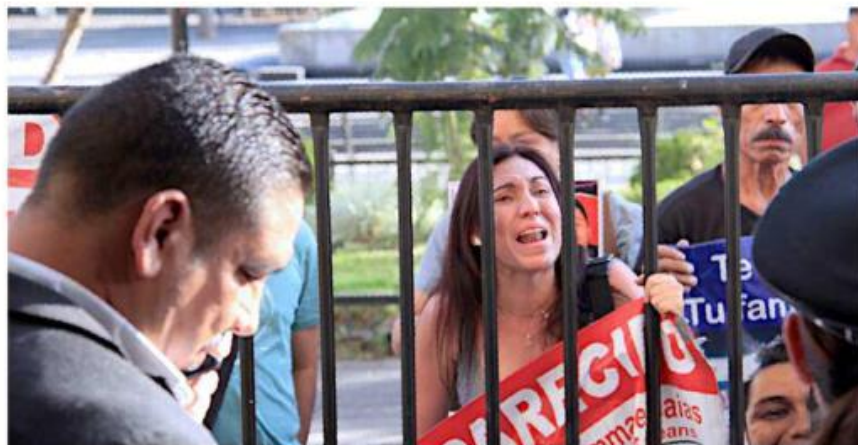
Integrantes del colectivo Luz de Esperanza exigieron resultados en materia de desapariciones.

Pronto se empezó a escuchar la protesta de una veintena de personas del colectivo Luz de Esperanza, que