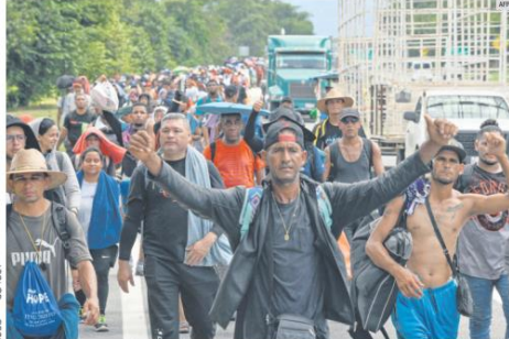
EN TRÁNSITO. Caravanas de migrantes avanzan hacia el Norte en busca de mejores oportunidades. La Presidenta aseguró que su Gobierno trabaja en un plan para enfrentar posibles deportaciones masivas.