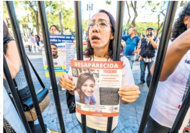
PROTESTAN AL EXTERIOR. Familiares de desaparecidos lanzaron consignas durante la glosa.