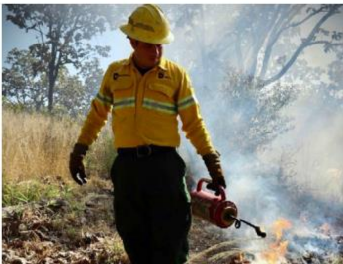
LABORES. Bomberos forestales de Zapopan realizan quemas controladas y líneas negras dentro del Bosque de La Primavera, como parte de los trabajos contra la temporada de estiaje.