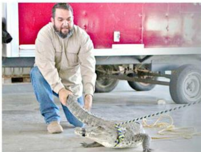
■ En el curso se abordó el manejo adecuado de animales como cocodrilos.