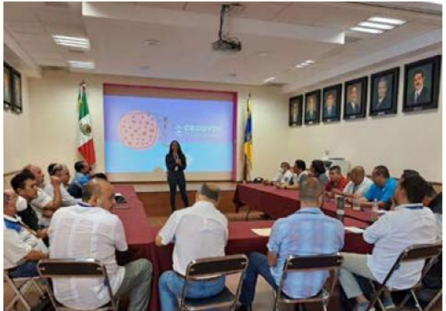
Esta acción fue posible a través de una reforma al Reglamento Interno de la Secretaría de Salud.

En casi tres años y medio de labor, esta unidad realizó nueve sesiones, en las que se acordaron las acciones de trabajo al interior de la dependencia. En este lapso, el personal recibió capacitación en temas como Lenguaje Incluyente y no