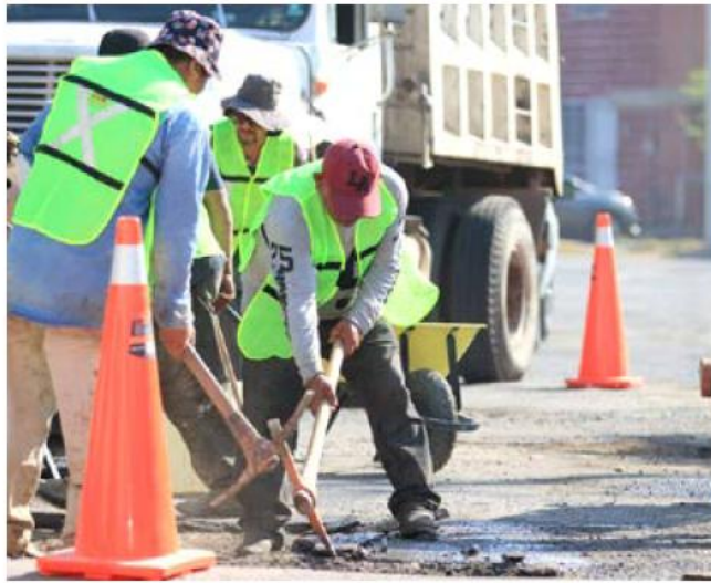
Estas obras mejorarán la calidad de vida de los habitantes de la zona.

Los trabajos incluyen la rehabilitación de vialidades, limpieza del entorno y rescate de espacios públicos, beneficiando directamente a mil 630 personas