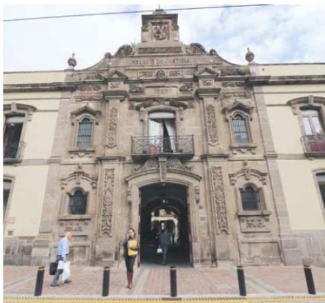
UNA DE LAS TRES INSTITUCIONES. De cara al próximo año, el Supremo Tribunal de Justicia del Estado de Jalisco solicitó 976.9 mdp.

A pesar del alza, los recursos propuestos por el gobernador para 2025 son inferiores en poco más de 150 millones de pesos (mdp) a los solicitados por el Poder Judicial, ya que la Judicatura solicitó 2