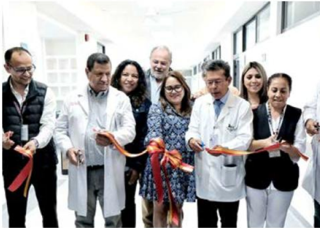
Se invirtieron 14 millones de pesos para la nueva cara del nosocomio.

Las áreas rehabilitadas fueron la zona de puerperio con nueve salas, sala de aislados, baños para pacientes, instalaciones eléctricas y renovación de pisos