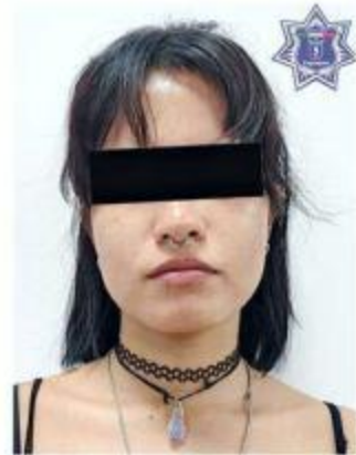
■ La mujer hurtó ropa y maquillaje.

El encargado decidió proceder en contra de la mujer, por lo que fue entregada a autoridades ministeriales.