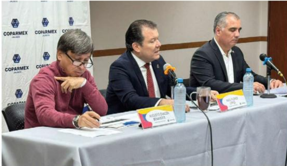
El estudio lo hizo Jalisco Cómo Vamos, de la mano de la COPARMEX y el Tec de Monterrey. PN