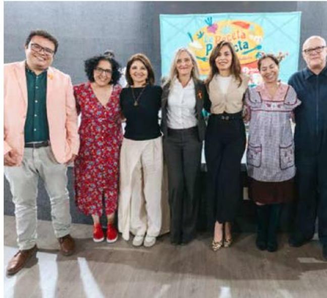
El Gobierno de Guadalajara realizó una serie de actividades para visibilizar, prevenir, concientizar.

“El 25N nos tiene que servir para reflexionar qué tenemos que hacer para que esta realidad cambie, qué tenemos