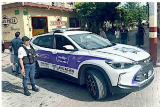
Los hechos fueron en Ixtlahuacán de los Membrillos.