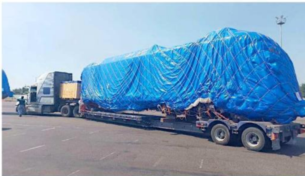
Los trenes tocaron tierra en Lázaro Cárdenas, Michoacán.