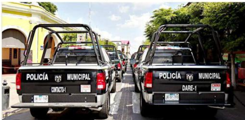
La actual Administración realizó una reorganización de rutas de patrullaje.

“Tenemos muchas prioridades, pero yo te diría que una de las más relevantes y más demandadas por parte de la gente es la seguridad, lograr mejorar la seguridad, los tiempos de respuesta, la cercanía y confianza que le tenga a nuestras policías la gente es una prioridad; por eso desde el primer día no-