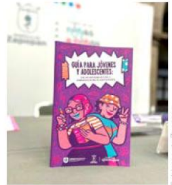
Esta guía será entregada de manera física a alumnos de prepa.