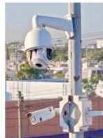
Fueron dañadas más de 80 videocámaras.

Con las 80 cámaras destruidas, ya suman 387 equipos dañados e inactivos en Culiacán, que significan el 48 por ciento de las cámaras que había en la Capital de Sinaloa. Actualmente quedan solamente 407 en activo. Mérida Sánchez recomen-