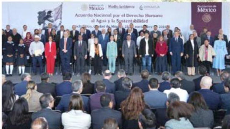
El acuerdo tiene por objeto garantizar el acceso universal al agua.

del Plan Nacional Hídrico 2024-2030 se centra en la restauración y saneamiento de los tres ríos más contaminados del país, que son el Río Lerma-Santiago, el Río Atoyac y el Río Tula