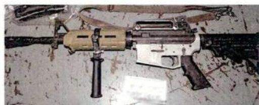
■ A los hombres les aseguraron armas de fuego.