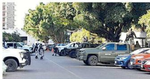
■ Los 21 detenidos en Ojuelos fueron trasladados a la FGR y después a Puente Grande.

ba suficientes para iniciarles un proceso penal por asociación delictiva y violaciones a la Ley de Armas de Fuego y Explosivos.