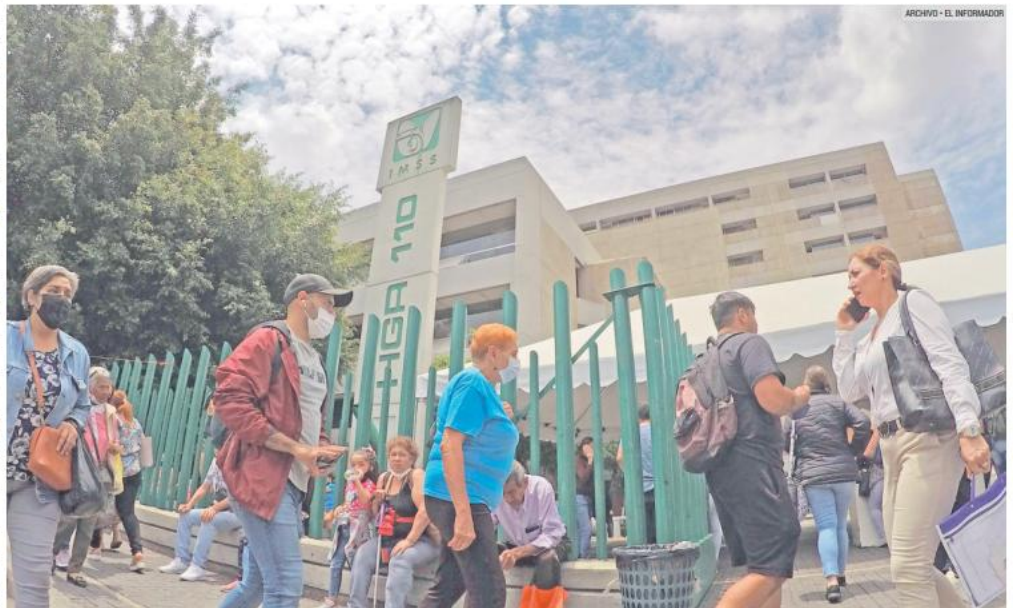
BATALLAN. Los usuarios del servicio público son sujetos a largas esperas para ser atendidos.

Sobre el acceso y cobertura en 2022 los habitantes de la Zona Metropolitana de Guadalajara el 19.3% manifestó utilizar los servi-