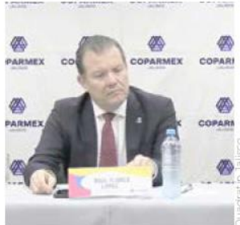
Académicos señalan que Jalisco tiene hospitales de buen nivel.

En los centros de salud municipales, se identifica que la disponibilidad de medicinas y atención recibida son los de menor calificación.