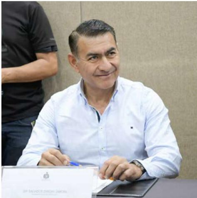
El aún diputado pedirá licencia a su cargo el 30 de noviembre.

Sostuvo que estar tanto en el Congreso del estado como en el equipo de transición no lo ha distraído ni afectado en su desempeño porque el motivo para permanecer allí es avanzar en la labor legislativa y los acercamientos con el gobierno estatal.