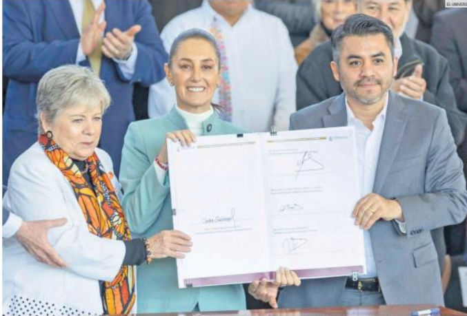
FACTO. El Acuerdo Nacional por el Derecho Humano al Agua es un compromiso entre el Gobierno federal, Estados y empresarios para sanear el agua en México. Alicia Bárcena, titular de la Semarnat, la Presidenta Claudia Sheinbaum y Efraim Morales López, director de la Conagua, muestran el convenio.

La Presidenta de México y los gobernadores firman un acuerdo con varios compromisos, entre ellos sanear esta cuenca, una de las más contaminadas del país