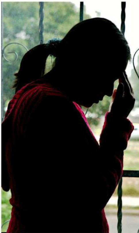
Las agresiones en contra de mujeres no cesan en el Estado.

Además, de acuerdo con la plataforma federal, el segundo Municipio de Jalisco