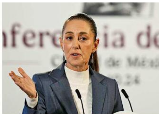
■ Claudia Sheinbaum, Presidenta de México.