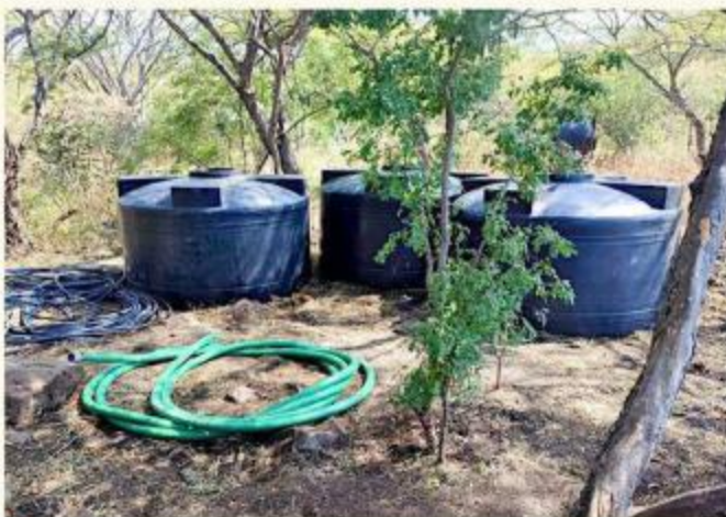
Las autoridades decomisaron 11 mil litros de huachicol.

del combustible, se informó que lo recuperado asciende a 11 mil 421 litros de diésel, que fueron asegurados por personal del Ministerio Público Federal.