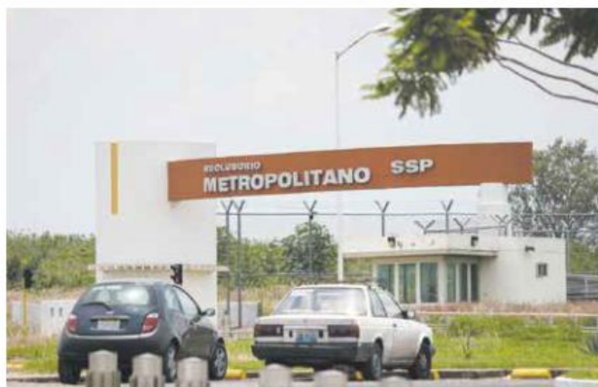
EN LA ENTIDAD. La organización considera que la justicia con perspectiva de género aún es una deuda pendiente.