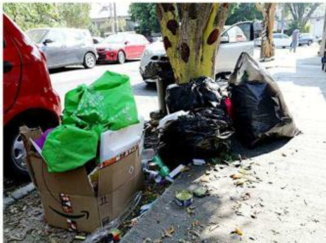
La acumulación de basura es evidente en algunas colonias de Guadalajara, como este punto de Vallarta Norte, ayer.