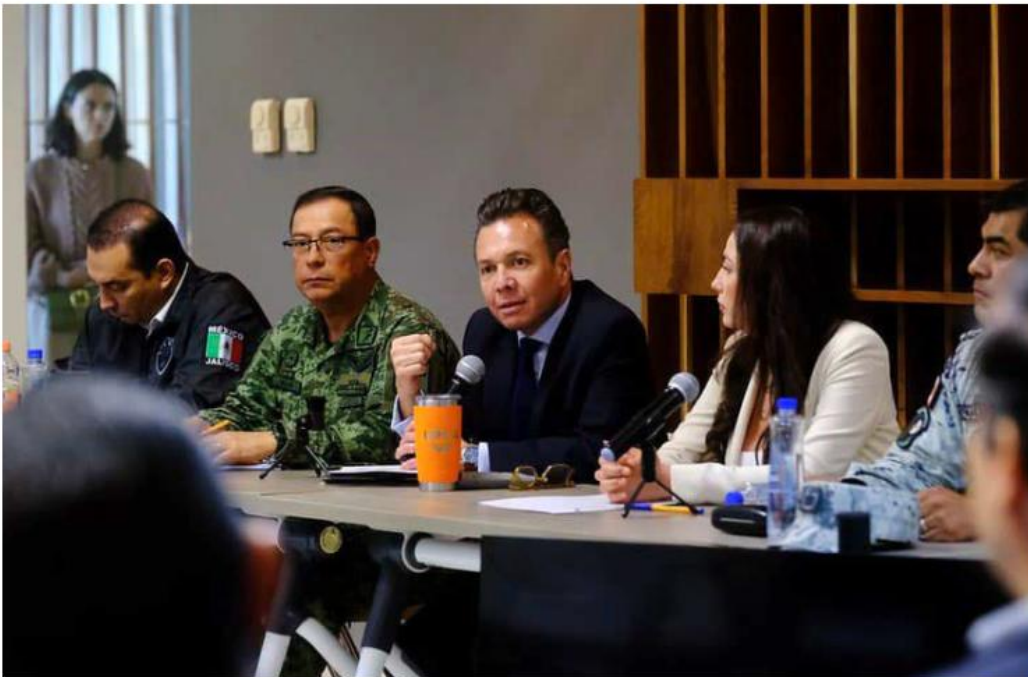
El mandatario encabezó la instalación de la mesa en Ocotlán, donde enfatizó la importancia de la coordinación interinstitucional.

Contrato de Línea 4 Ante incumplimiento de empresa amplían el plazo ROBERTO HURTADO - PAG. 3