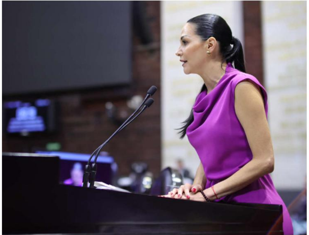
La legisladora jalisciense y presidenta de la Comisión presidió la sesión que se extendió hasta la madrugada de ayer.