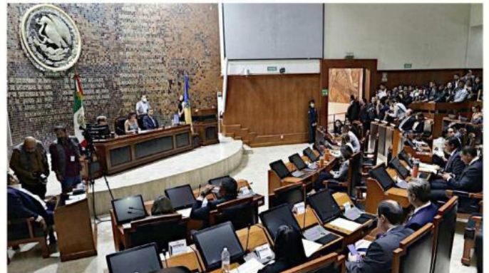
Se proyecta que este día se vote el paquete económico 2025.

“El monto inicial que se presupuestó para este 2025 son 172 mil 960 millones de pesos, estamos pensando un incremento de alrededor de mil millones de pesos (declaración previa a la reunión de Comisión)”.