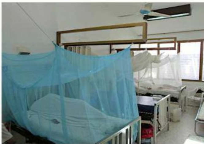
Jalisco acumula 19 mil 854 casos de dengue.

“En Jalisco, en la semana epidemiológica 49 se registraron 912 casos nuevos de dengue, una cifra que muestra una estabilización en comparación con la semana anterior y por lo que se espera que la disminución continúe en las semanas restantes de 2024”, informó la