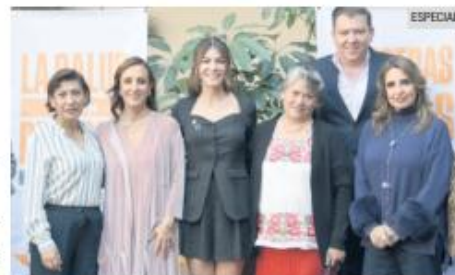
A ESPERAR. La legisladora (al centro) confió en que hoy se aprueben los nuevos recursos.

“Para la salud no hay colores, no hay partidos; para la salud necesitamos ser uno mismo. Yo confío plenamente en que no habrá quien se oponga a la atención de las personas que viven con alguna de estas condiciones”.