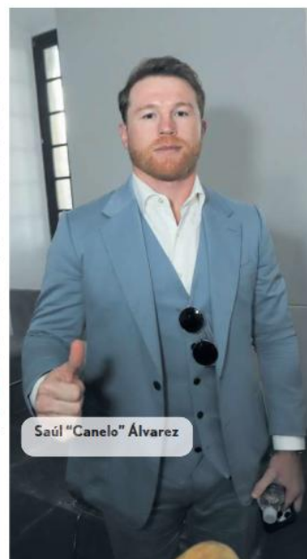
Saúl "Canelo" Álvarez