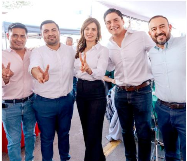
Gobierno de Guadalajara

“Trabajemos para tener una Guadalajara limpia, una navidad limpia,