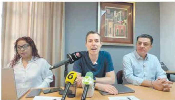
SEÑALAMIENTO. Los morenistas creen que podría darse un “negocio naranja”.

“Caabsa pierde el rumbo social, se han rasgado las vestiduras en sostener que Caabsa debe irse, que es el coco, (pero) estamos salvando de la quiebra a Caabsa y la empresa es parte del gru-