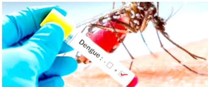
Se registraron 912 casos nuevos.

En total, Jalisco acumula 19 mil 854 casos de dengue, distribuidos en nueve mil 416 casos de dengue no grave, nueve mil 615 de dengue con signos de alarma y 823 de dengue grave. Este miércoles, la Dirección General de Epidemiología informó sobre la