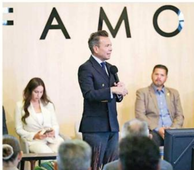
El Gobernador se reunió con empresarios y transportistas.