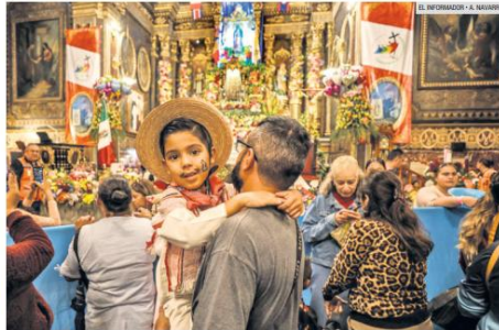
FEBVOR RELIGIOSO. El Santuario de Guadalajara recibió a miles de católicos, quienes le cantaron las Marías a la 'Morenita'.

"Le supliqué a la Virgen que, por lo menos, me quitara el dolor de la rodilla porque era mucho, pero la 'Morenita' es bondadosa y me dio mucho más que eso: me hizo el milagro y me dio fuerzas para levantarme y venir a verla", compartió.