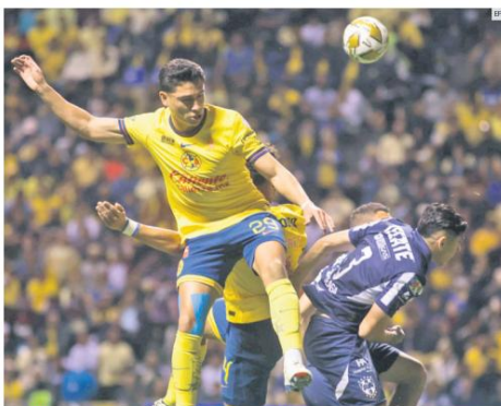
VICTORIA. Las Águilas se llevaron una mínima ventaja para el partido de Vuelta en Monterrey.