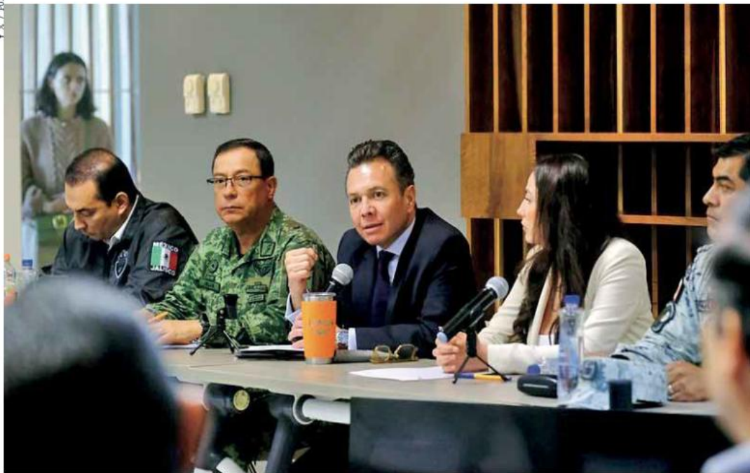
Exposición. El mandatario estatal estuvo acompañado por autoridades de Ayotlán, La Barca, Tototlán, Zapotlán El Rey, Degollado, Poncitán y Jamay.

Coordinación. El gobernador de Jalisco expuso una estrategia integral para renovar el transporte público de la zona, destacando su implementación "al Estilo Jalisco". /Pág.02