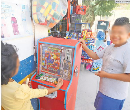
MAQUINAS TRAGAMONEDAS. Tiendas y pequeños comercios continúan operando estos dispositivos para los niños y adolescentes, a pesar de estar prohibidos por ley y de los daños a la salud mental que genera la adicción al juego.

Pida apoyo Instituto Jalisciense de Salud Mental Contacto: 33-3030-9900