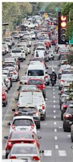
Los ajustes iniciaron el pasado 6 de diciembre sobre López Mateos, entre Plaza del Sol y Periférico.