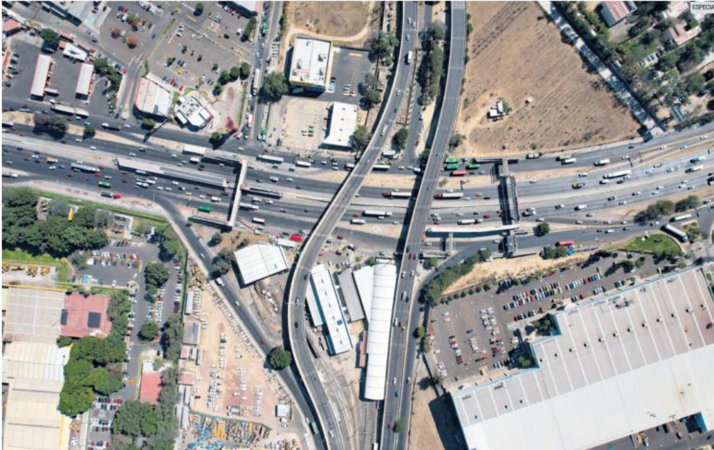
PERIFÉRICO SUR. Además del paquete de rehabilitación de carreteras, se remozarán los carriles laterales de esta vialidad.

Una vez más no habrá dinero federal para la Línea 5 del Tren Ligero, aunque sí para la L4