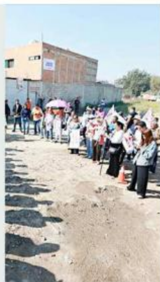
■ Ayer arrancaron las obras del mercado.