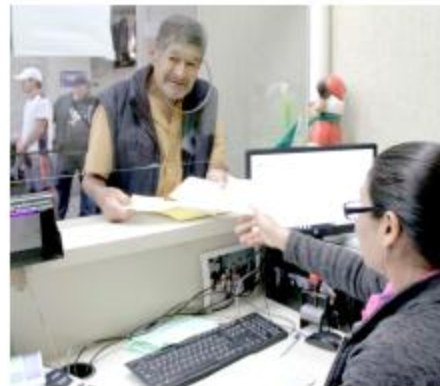
Gobierno de Tlaquepaque

Los descuentos se aplicarán a multas y recargos derivados del impuesto predial, agua potable, licencias de giro comercial, licencias de anuncios