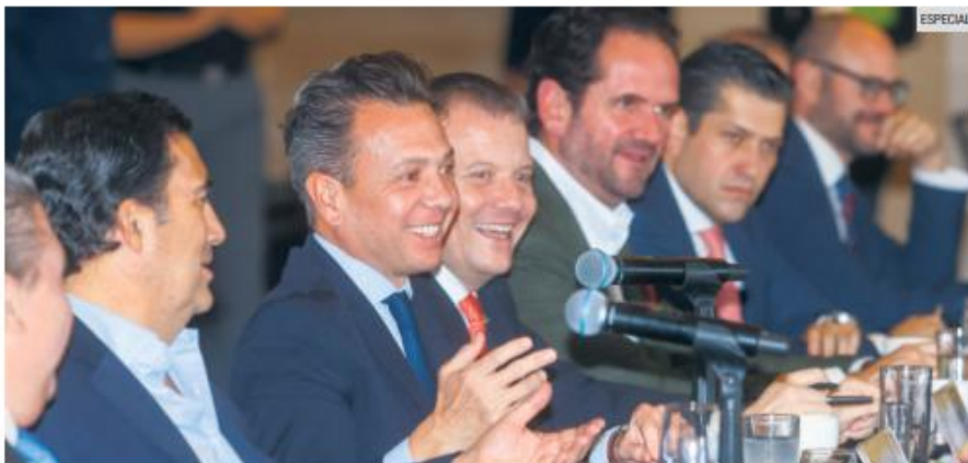
GOBERNADOR. Pablo Lemus compartió con los empresarios los retos para Jalisco, como la infraestructura, la seguridad, el agua y la energía.

Asimismo, se reconoció a las universidades por su apoyo invaluable durante el proceso de aprendizaje y mentoría brindado a cada una y uno de los emprendedores, esfuerzo