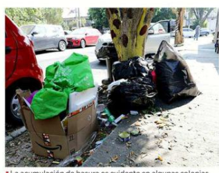
La acumulación de basura es evidente en algunas colonias de Guadalajara como, este punto de Vallarta Norte, ayer.

A cuatro días de que termine el contrato de concesión del servicio de recolección de basura que tiene el Ayuntamiento de Guadalajara con Caabsa, la Comuna tapata aún no cuenta con camiones suficientes para prestar el servicio. Guadalajara tiene actualmente 67 unidades y están en vías de adquirir otras 160 mediante un proceso de licitación pública cuyo fallo será emitido hoy. Aunque autoridades municipales esperan recibir las nuevas unidades el martes 17 de diciembre, a más tardar, es decir, antes de que la concesionaria deje de prestar el servicio, la fecha límite establecida en las bases de la licitación para la entrega de los camiones es el 31 de diciembre de este año. El Gobierno de Verónica Delgadillo en Guadalajara