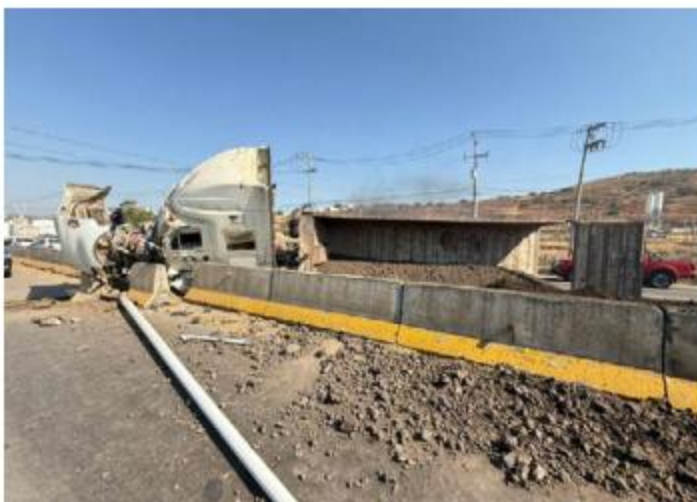
CASO. Sobre la Carretera Libre a Zapotlanejo, a la altura de la colonia la Jauja de Tonalá, se registró la volcadura de un tráiler. Apparently, the driver was driving at excessive speed.