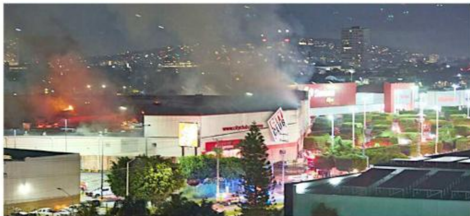
El City Club, localizado en Patria y Clouthier, ardió el 4 de octubre.

MURAL publicó a mediados de noviembre que era un dictamen el que tenía atorada la reconstrucción del Walmart y el City Club quemados en la zona sur del Municipio, por lo que las empresas no podían tomar acciones en los predios dañados.