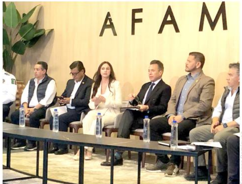
El mandatario de Jalisco, Pablo Lemus, realizó su primera gira de trabajo.

Lemus Navarro adelantó que seguirá visitando siete regiones para instalar mesas de seguridad con los municipios bajo este modelo que permita una total colaboración entre las fuerzas del orden.