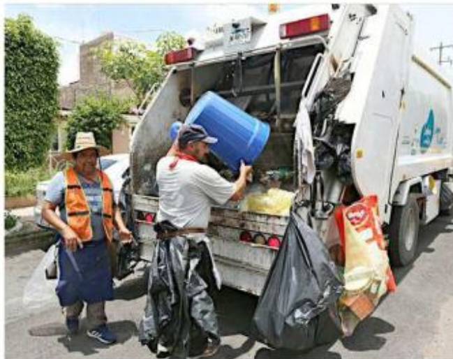
El contrato de concesión del servicio de recolección de basura con Caabsa terminará este 17 de diciembre.

“Estoy haciendo todo lo que puedo para tener el equi-