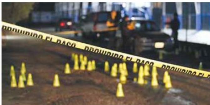
AÑO PASADO. La tasa estatal en 2023 fue de 17.4 homicidios por cada 100 mil habitantes.

cidios por cada 100 mil habitantes, es decir, Cañadas de Obregón tuvo una 10 veces mayor.