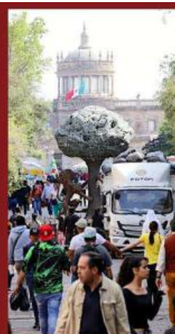
El vehículo se llenó rápidamente.