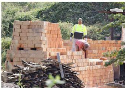
La veda a hornos de ladrillos concluirá el próximo 3 de enero.

nicipales proveerán insumos como palas y carretillas.