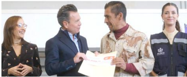
La veda de las ladrilleras contribuye a la mejora en la calidad del aire.

Esta entrega, que representa una inversión de 11 millones de pesos,