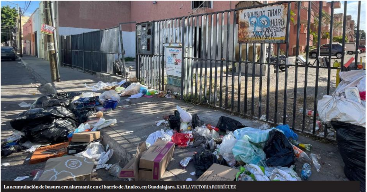
La acumulación de basura era alarmante en el barrio de Anasco, en Guadalajara. KARLA VICTORIA RODRÍGUEZ