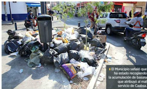
El Municipio señaló que ha estado recogiendo la acumulación de basura que atibaja al mal servicio de Caabsa

Explicó que hay una de 150 millones de pesos para ello, pero primero se reunirá