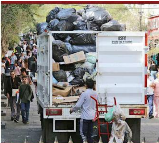
El camión recolector se lleva la basura de los negocios de Plaza Tapatía.