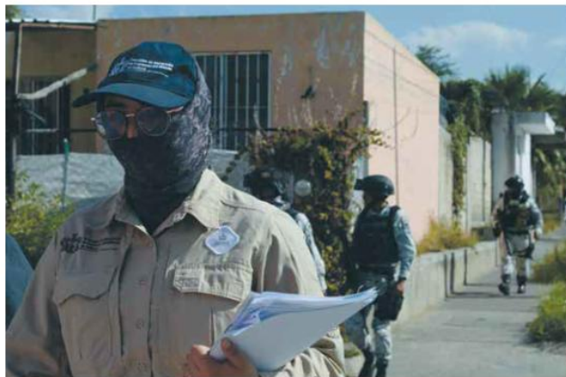
PERSONAL. Según Elementa DDHH, hasta 2023 la Cobupej contaba con 118 personas adscritas; sin embargo, ninguna contaba con contrato definitivo.

Finalmente, Por Amor a Ellxs pidió al mandatario atender el tema y generar certeza laboral a las y los trabajadores para que las acciones de búsqueda puedan continuar sin complicación alguna.