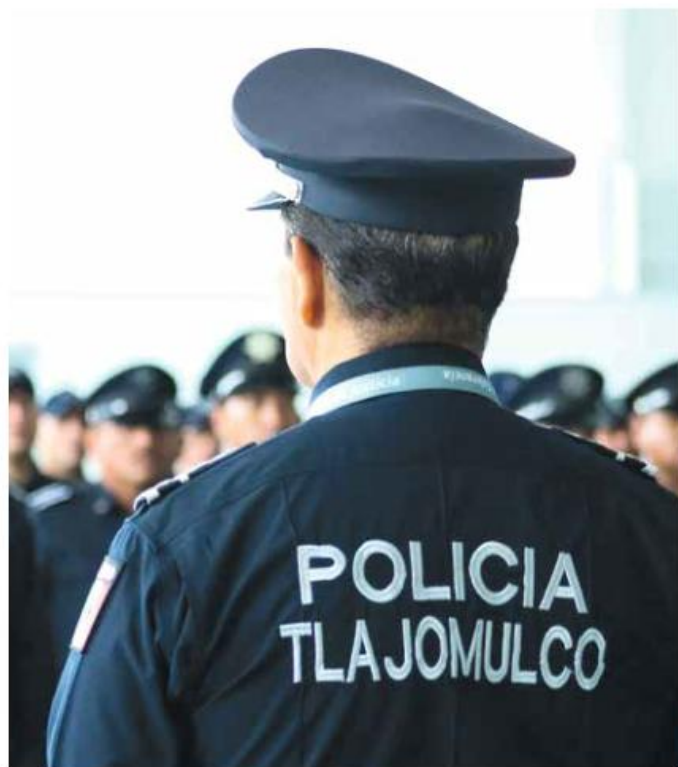
PROTOCOLO. Elementos de la Policía de Tlajomulco resguardaron la escena criminal del fraccionamiento Los Silos.

Hasta el cierre de esta edición no circuló información de los causantes de los asesinatos ni de los motivos de éstos. Tampoco hubo personas detenidas.