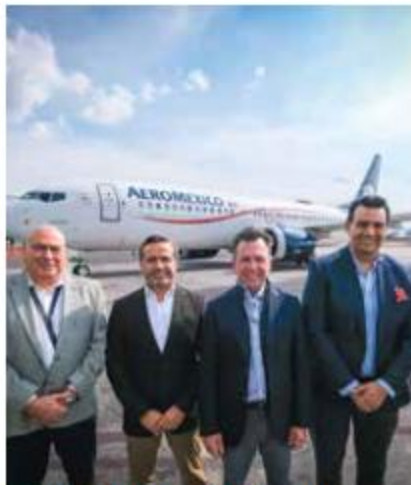
UNIÓN AMERICANA. Las nuevas rutas van hacia Las Vegas, Orlando, Miami y Denver.

La idea es que Guadalajara sume puertas con la Unión Americana a