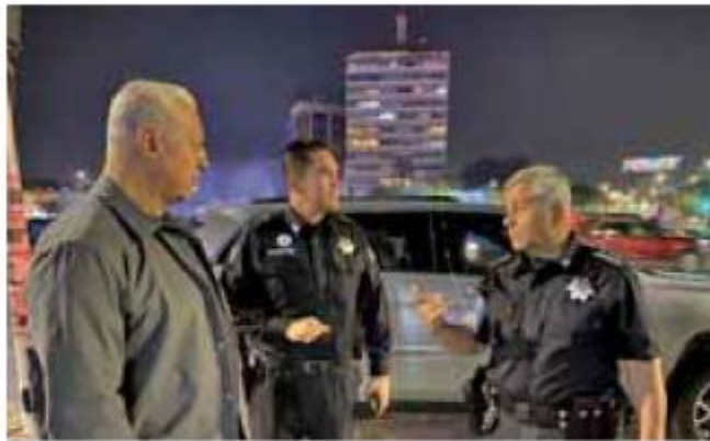
Orden. El objetivo es reducir la incidencia delictiva.