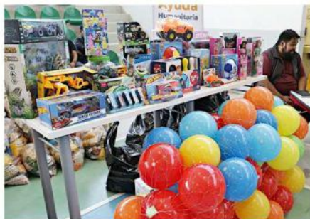
Entre los insumos también entregaron juguetes para las familias.

Este año, señaló el ladrillero, la veda en los hornos estará activa desde ayer 19 de diciembre hasta el 3 de enero, con la diferencia de que