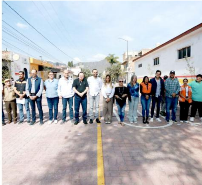
En esta obra se invirtieron 8.7 millones de pesos; también se habilitaron nuevas banquetas.

Esta obra, dijo, es una muestra de lo que se puede lograr cuando se ponen por delante las necesidades de la gente y la comunidad que nos obliga a trabajar con eficiencia y sobre todo con el uso responsable de los impuestos que pagan los contribuyentes, finalizó.