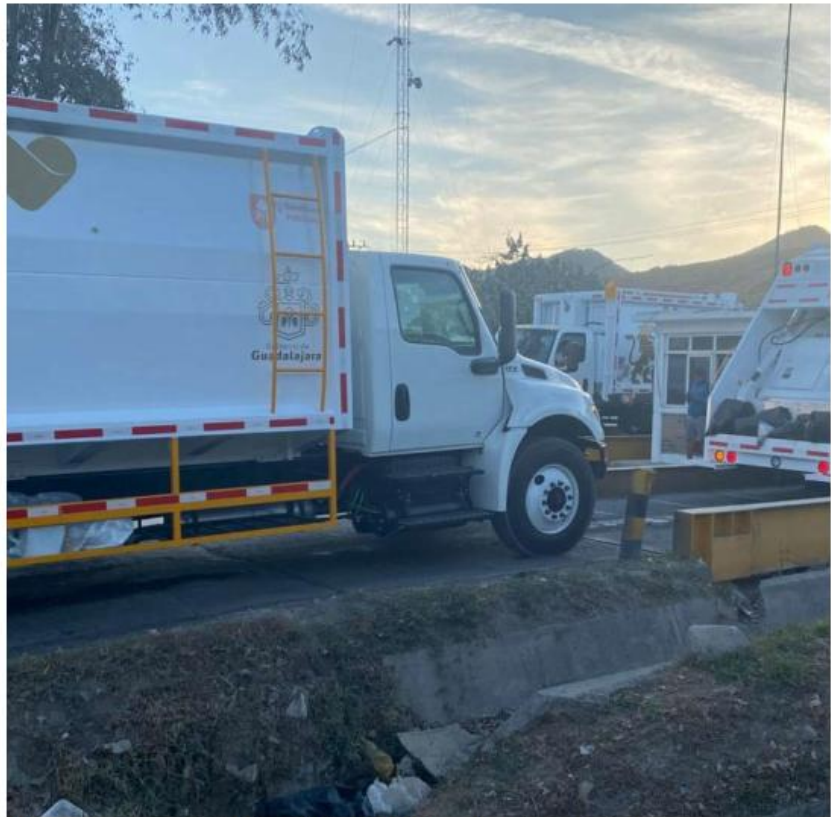
El ayuntamiento adquirió 160 unidades para realizar el servicio. GLORIA REZA

La ruta del plan Limpia Guadalajara incluye ocho puntos y actualmente se trabaja en el cuarto y quinto: tomar el control de la operación del servicio