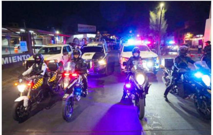
Las autoridades se enfocaron en la detección de motociclistas que no cumplen con la normativa.

con las siguientes disposiciones para circular de manera segura y evitar sanciones: