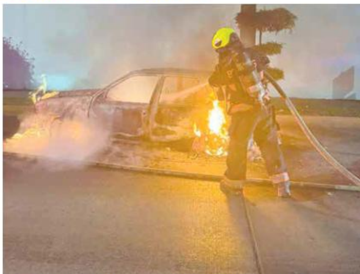
FUEGO. En Jardines Universidad, en Zapopan, un auto se quemó durante la madrugada.

La Coordinación de Seguridad y Emergencias Tonalá detalló que elementos de Protección Civil y