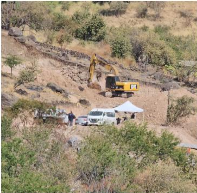
La fosa clandestina fue localizada la semana pasada en la colonia Lomas del Refugio de Zapopan. JUAN CARLOS MUNGUÍA