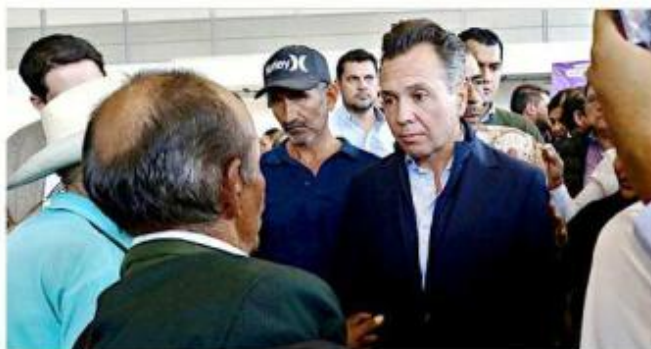
■ Pablo Lemus, Gobernador del Estado.

que no hay "carpetazo" del asunto y que las investigaciones van a continuar.