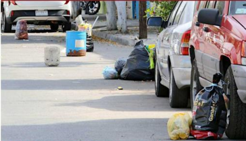
En la Calle Alejandro Arango, esquina con José Gómez de la Cortina, había bolsas cada pocos metros.