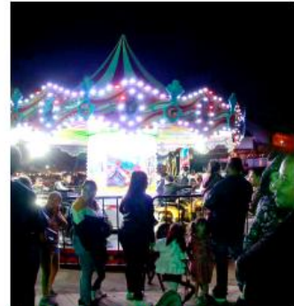
Hay atracciones gratuitas para toda la familia.

El acceso principal se encuentra sobre avenida Malecón, esquina con Calle María Reyes, en el municipio de Guadalajara.