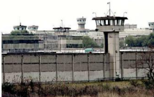
■ Por la falta de pago están siendo afectados psicólogos y doctores de Puente Grande.

Este tipo de procesos se registran cada sexenio, sin embargo, en esta ocasión la