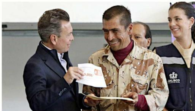
El Gobernador Pablo Lemus acudió a entregar los apoyos para los ladrilleros que suspenderán actividades durante la temporada.