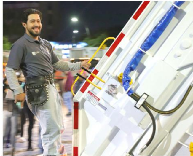
En el arranque se recolectaron residuos en 149 puntos críticos.

Verónica Delgadillo, alcaldesa de Guadalajara, pidió la colaboración y paciencia de los ciudadanos para continuar con la ruta de estabilización del servicio que se ha trazado por parte de la administración, pues se trata de un proceso que hace frente a tres décadas de un modelo de recolección y gestión de residuos que esta rebasado