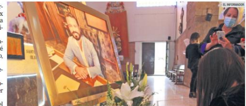
DOLOR. A cuatro años del asesinato, familiares de Aristóteles Sandoval exigen justicia.

Recordó que, cuando fue alcalde de Zapopan, Aristóteles Sandoval siempre lo apoyó, por lo que "siempre estaré agradecido... y es un interés personal saber qué fue lo que pasó". Esta semana se cumplen cuatro años del asesinato del ex gobernador en Puerto Vallarta.