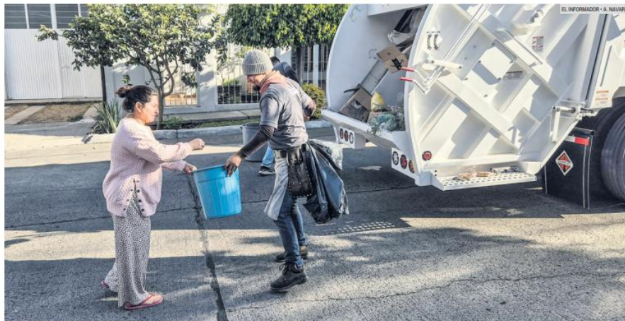
ARRANCAN. Nuevos camiones recolectores refuerzan la estrategia municipal en las colonias de la ciudad.

Por otra parte, la alcaldesa explicó que durante los próximos días estará llegando la totalidad de los camiones recolectores comprados por el municipio.