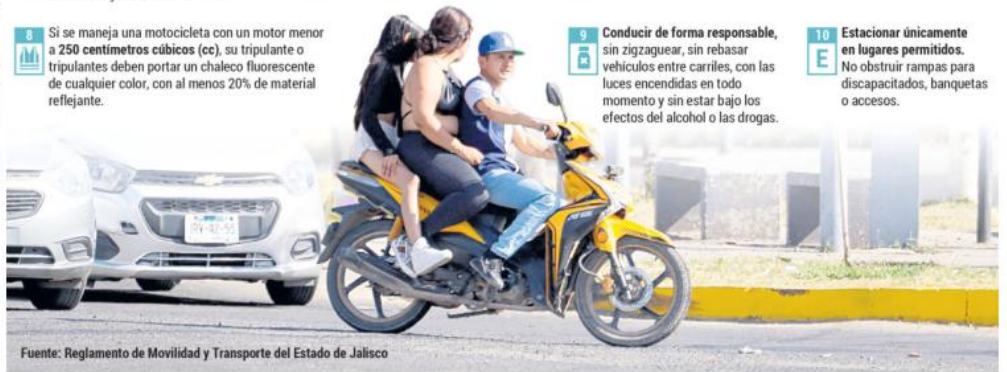
Fuente: Reglamento de Movilidad y Transporte del Estado de Jalisco