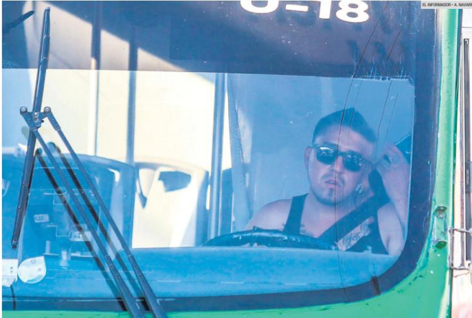
PELIGRO. Un conductor del transporte público utiliza el celular mientras maneja, pese a la nueva estrategia de la Policía Vial para sancionar este tipo de infracciones. El uso de dispositivos al volante aumenta el riesgo de accidentes y caos en las calles.

Lanzan estrategia para que 70 agentes viales se enfoquen en sancionar esta práctica, que detona accidentes y caos en las calles