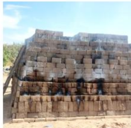
Revisaron que ladrilleras cumplan con el paro de actividades.

En cada caso, el personal de Protección Civil emitió recomendaciones verbales para respetar la veda de quema, vigente hasta el 6 de enero del próximo año.