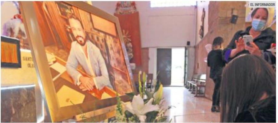
DOLOR. A cuatro años del asesinato, familiares de Aristóteles Sandoval exigen justicia.

Esta semana se cumplen cuatro años del asesinato del ex gobernador en Puerto Vallarta.