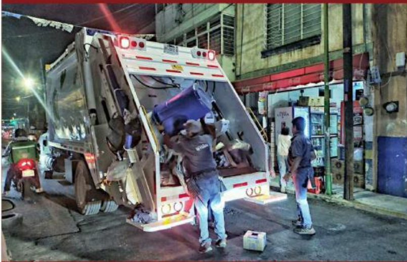
La unidad 003 fue asignada a los recolectores que cubren la zona de San Juan de Dios, con el mismo personal que cubría antes la ruta.