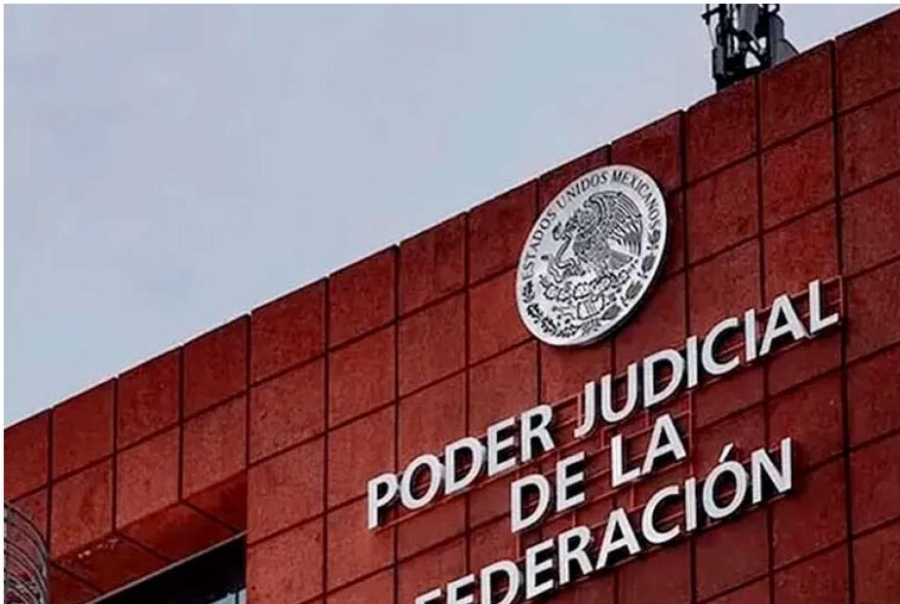
Es necesario promover una pedagogía ciudadana que permita comprender el papel de los jueces, magistrados y ministros. ESPECIAL