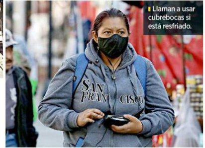
Llaman a usar cubrebocas si está resfriado.

Entre influenza y Covid, este año causaron 31 defunciones en Jalisco.