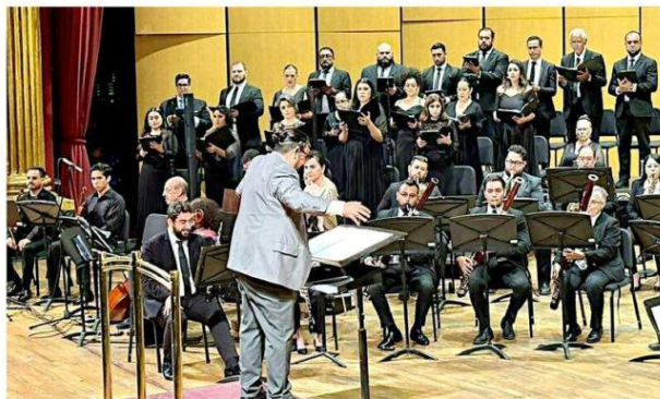
■ Dar mayor protección a los talentos de Jalisco debe ser una de las prioridades de las autoridades.

Uno de los puntos claves será, de acuerdo con Paredes, generar una agenda metropolitana