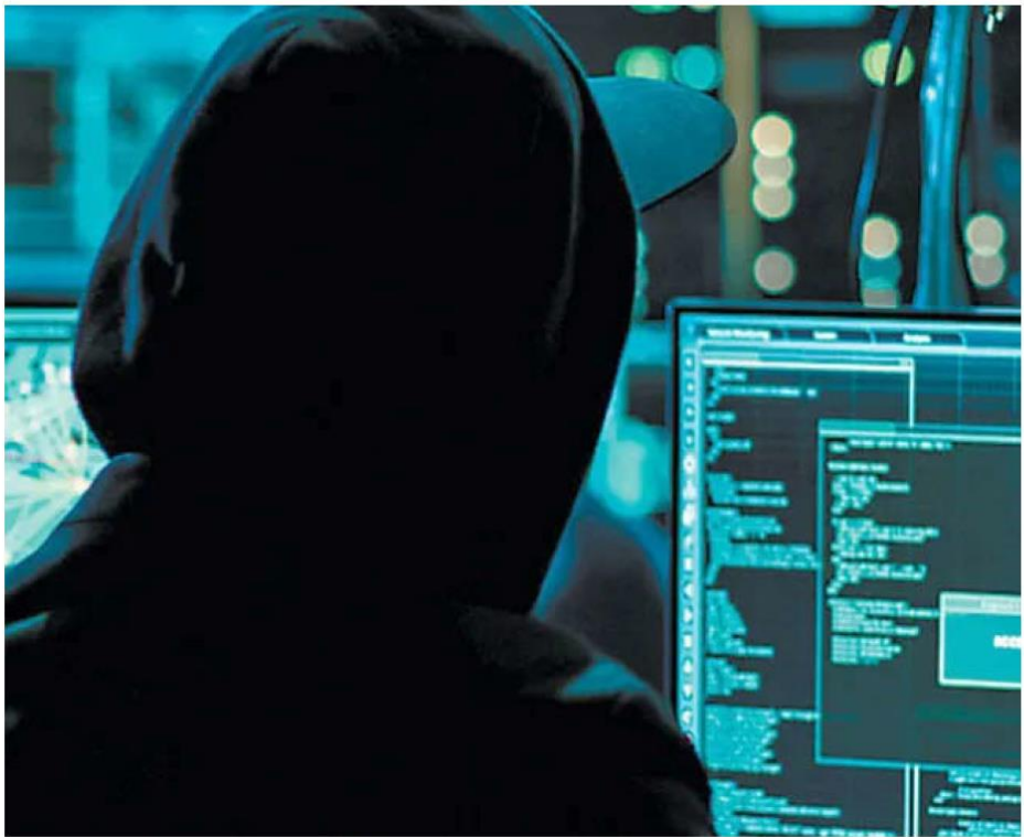
La falta de educación financiera y digital también juega un papel importante en la expansión de este fenómeno. ESPECIAL

El fenómeno no discrimina perfiles. Aunque las víctimas suelen ser personas jóvenes, desempleadas o sin historial crediticio, cualquier usuario activo en redes sociales puede ser objetivo. González resalta que el uso cada vez más extendido de internet y redes sociales ha facilitado que este tipo de delitos se dispare en los últimos años. Desde 2020, el problema ha crecido exponencialmente debido a la digitalización forzada durante la pandemia, que aumentó la dependencia de plataformas digitales. La facilidad de acceder a préstamos desde el teléfono móvil y la falta de opciones