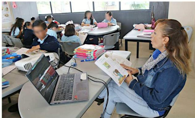
El magisterio de Jalisco participará en la elaboración de las propuestas para la reforma de ley.

A decir de González, el tema del incremento salarial