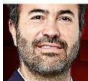
DAVID GÓMEZ-ÁLVAREZ @gomezalvarezd

El gobierno federal invertirá recursos en tierras jaliscienses, pero no donde Jalisco quiera, sino donde la Presidenta mande.