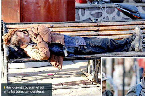
Hay quienes buscan el sol ante las bajas temperaturas.

acumulado fueron 7 mil 878 casos; dentro del registro se contemplan las 52 semanas epidemiológicas, incluidas 20 semanas de la temporada estacional 2023-2024.