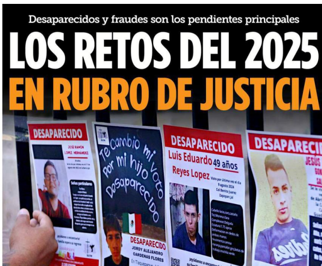
El tema de desaparecidos sigue siendo el mayor problema que existe en Jalisco.