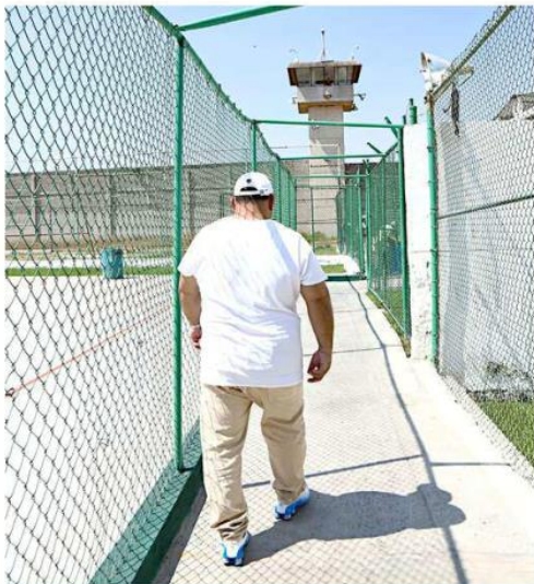
Los protocolos de visitas en prisiones son rudimentarios.