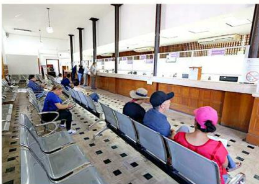
■ Las recaudadoras estarán cerradas este día, pero abren a partir de mañana.