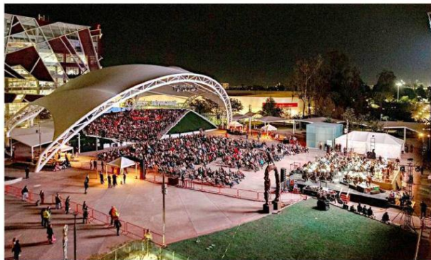
■ La UdeG, por su gran infraestructura, debe abrirse mucho más a toda la sociedad.

de cooperación, con una visión regional más inclusiva.