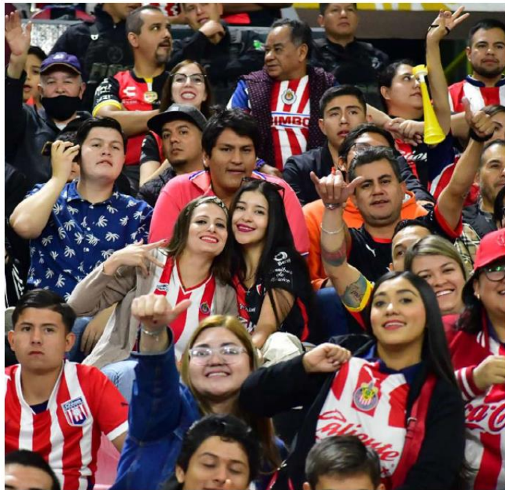
La afición tapatía en el Estadio Jalisco.

Especial. El estado tendrá un año de mucha actividad donde algunos clubes buscan el protagonismo perdido y otros atletas demostrar que aún tienen mucho poder