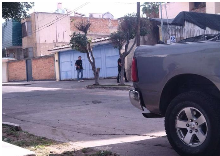
Desde el lunes 30 de diciembre comenzaron a concentrarse rescatistas frente a la vivienda. GR