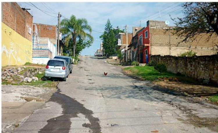
■ Villas de Guadalupe, en Zapopan, es una de las colonias donde es necesario la construcción de banquetas.