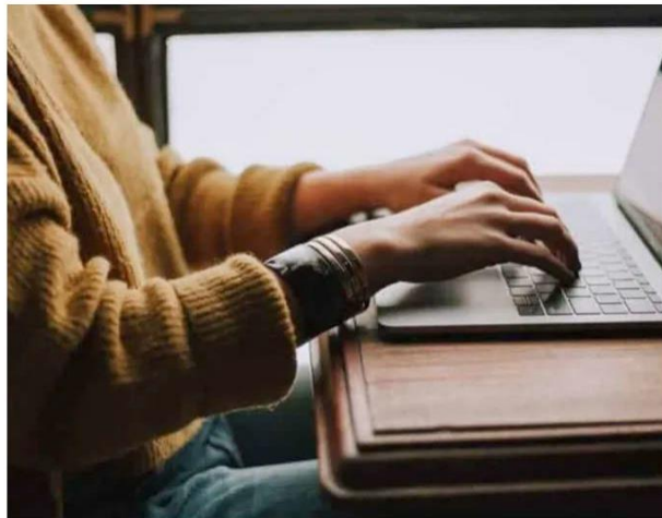
No acababa de mandar los datos que le pedían cuando ya le habían depositado 500 pesos.

Cuatro días después de recibir el dinero, comenzaron las llamadas. “Me exigían mil 500 pesos por los intereses. Pagué porque pensé que sería suficiente para terminar con el asunto, pero no fue así”, explica. Lejos de acabar, las deman-