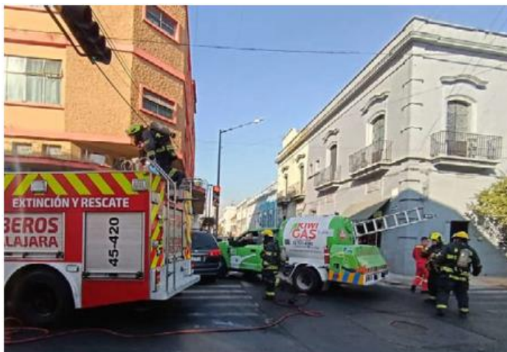
CHOQUE. Sobre el cruce Donato Guerray Miguel Blanco, en GDL, se registró el impacto entre una pipa de gas LP y un autp compacto.