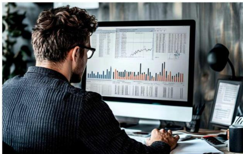
Ilustración: IA, Grupo REFORMA

“En promedio el consumidor va a pagar 0.31 pesos más por cada litro de gasolina, que si nos vamos a un tanque promedio de 41 litros