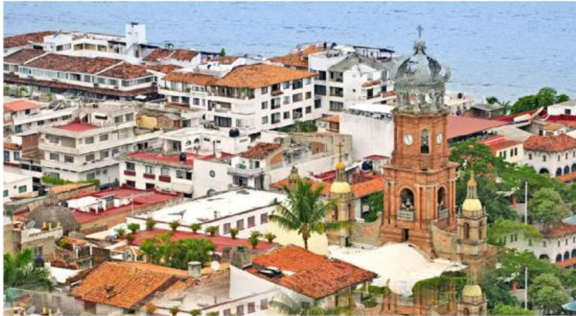
El objetivo final es consolidar esta ciudad como una metrópoli bien conectada. ESPECIAL