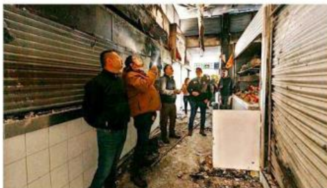
El incendio del jueves destruyó cinco locales.

El fuego comenzó cerca de las 19:30 horas del jueves en el mercado ubicado en la Avenida Artesanos, cerca de San Pedro.