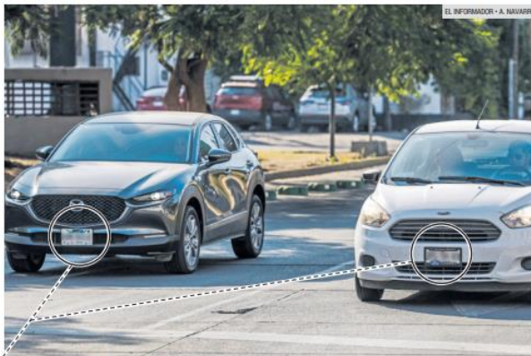
EN CIRCULACIÓN. La Ley de Movilidad del Estado de Jalisco aclara que no se puede obstaculizar la información contenida en las láminas vehiculares, aunque dicha normativa no se cumple del todo.