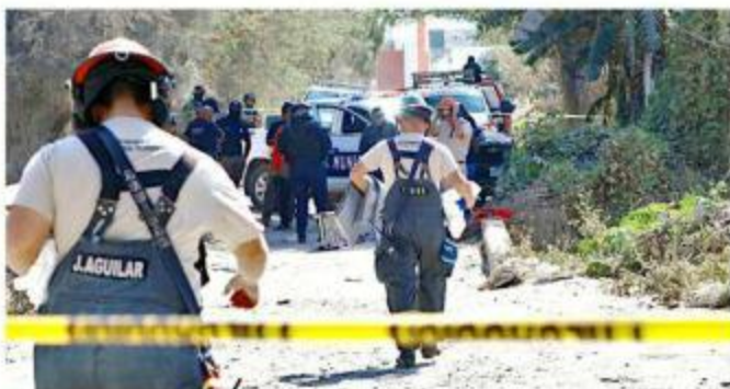
■ Bomberos extrajeron el cuerpo y lo entregaron al Semefo.

En avanzado estado de descomposición fue localizado el cadáver de un hombre durante la tarde de ayer, en Tlaquepaque.