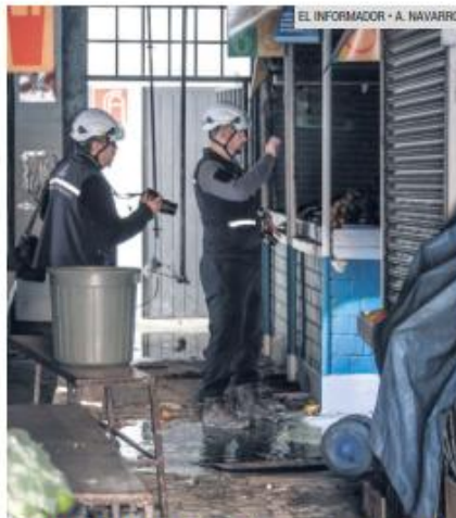
GUADALAJARA. Expertos inspeccionan las condiciones del mercado.