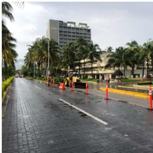
La avenida Francisco Medina Ascencio es la principal vialidad de este destino turístico.