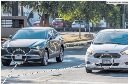
EN CIRCULACIÓN. La Ley de Movilidad del Estado de Jalisco aclara que no se puede obstaculizar la información contenida en las láminas vehiculares, aunque dicha normativa no se cumple del todo.

El gobernador anterior tuvo que suspender el cobro rápidamente, aunque aclaró que "el problema de las placas falsas es real y tiene que atenderse", pero "ante las quejas de los ciudadanos", instruyó para que se suspendiera la medida, según dijo.