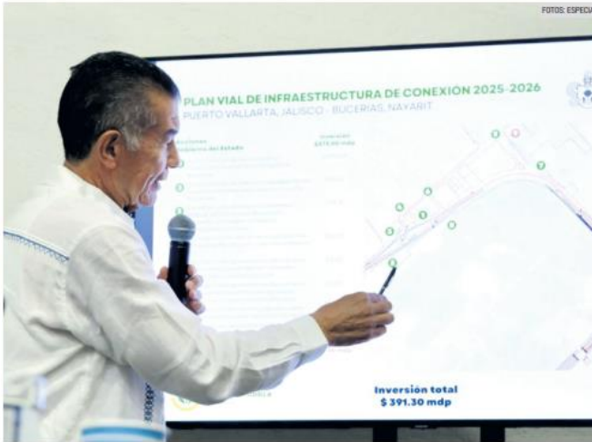
DAVID ZAMORA BUENO. El secretario de Infraestructura y Obra Pública detalló la inversión.

Este proyecto se implementará en la avenida Francisco Medina Ascencio, una de las principales vías de este puerto jalisciense, conectando de Ixtapa al Centro de Puerto Vallarta para impactar a 20 mil usuarios al día; con una inversión de 897 millones de pesos.