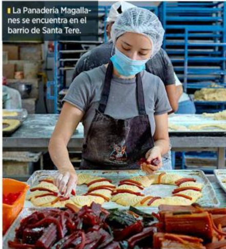
La Panadería Magallanes se encuentra en el barrio de Santa Tere.

El año pasado se vendieron aproximadamente 5 mil rosas, combinando ventas en mostrador y pedidos especiales. Para 2025, la producción comenzó el 3 de enero