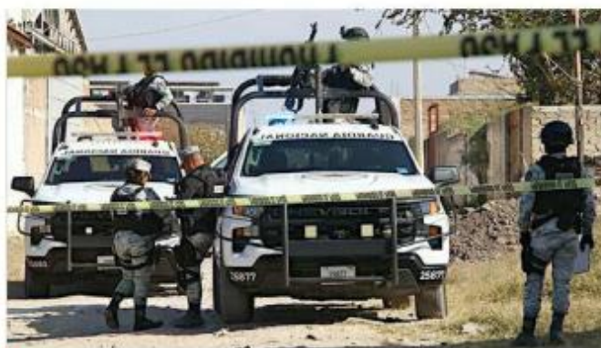
■ El hallazgo ocurrió en Lomas del Aeropuerto.

En otro hecho, la dependencia estatal informó que un hombre murió en la Cruz Verde luego de que fue golpeado en la Colonia San Mar-