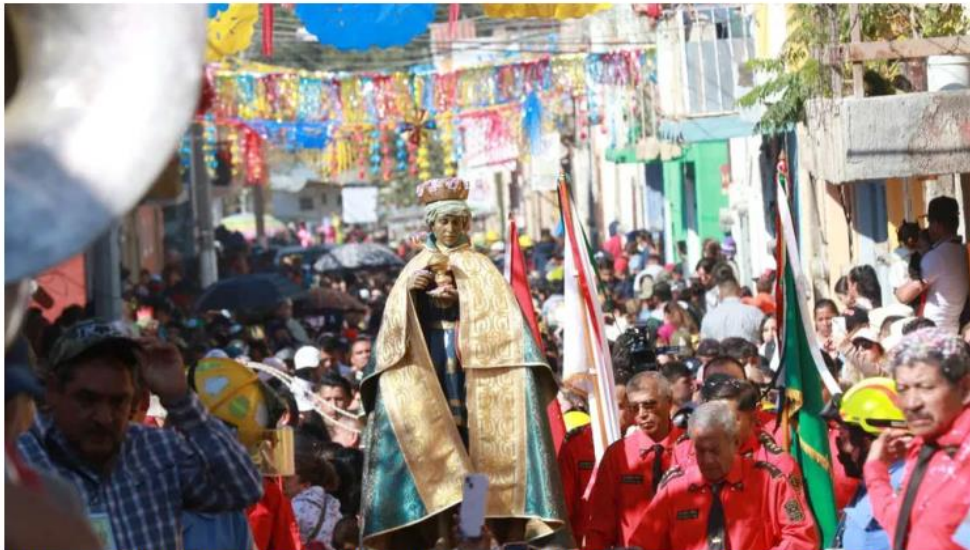
El dispositivo incluye un despliegue de 350 elementos de distintas áreas, de los cuales 100 son de seguridad pública. ESPECIAL