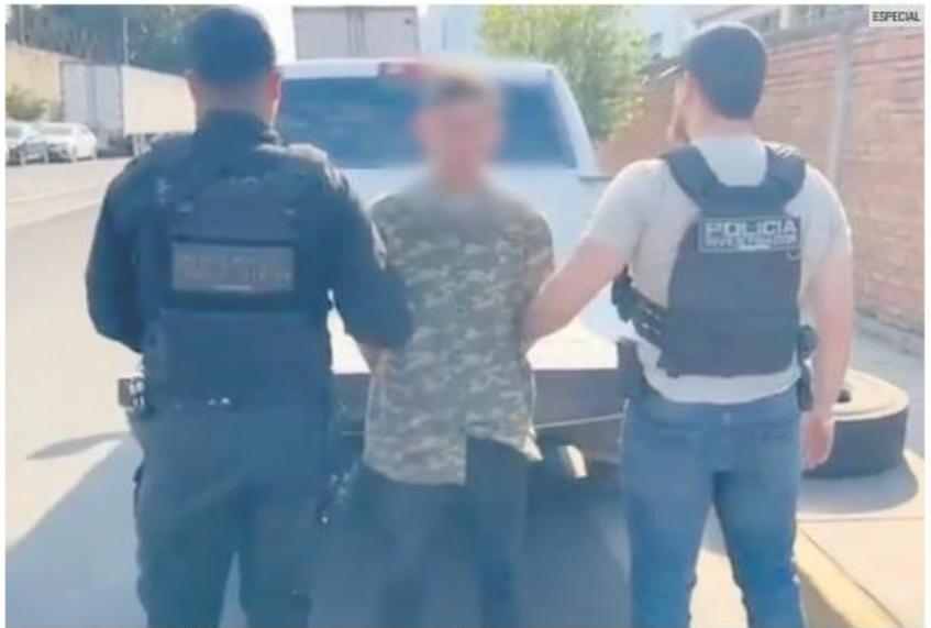
ANTONIO "N". Autoridades recuperan arma y sustancias durante la captura en San Gaspar.

El detenido fue puesto a disposición del Agente del Ministerio Público, quien continuará con la integración de la carpeta de investigación. Las autoridades confirmaron que, hasta el momento, no se han presentado denuncias por parte de los pasajeros afectados. Sin embargo, la Fiscalía inició de manera oficiosa las investigaciones correspondientes para esclarecer el caso y garantizar la justicia.