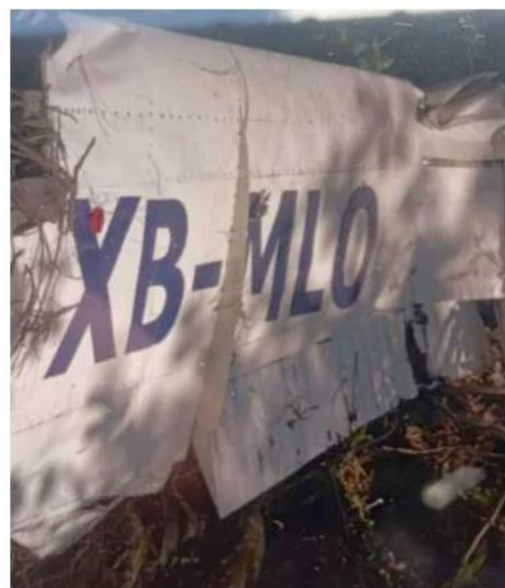
El 22 de diciembre se desplomó una avioneta.

El accidente de la avioneta Cessna 207 ha generado consternación en Jalisco y Michoacán, y las autoridades han trabajado estrechamente para coordinar las labores de identificación y entrega de los cuerpos. Este tipo de incidentes pone de manifiesto la importancia de la cooperación interestatal y de los protocolos de seguridad en el transporte aéreo, especialmente en zonas rurales y de difícil acceso. —