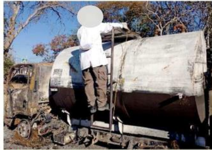
■ El combustible era almacenado de forma irregular.