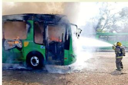
■ El incendio ocurrió el 9 de diciembre.

No hubo personas detenidas, pero la indagatoria continúa para dar con los responsables.