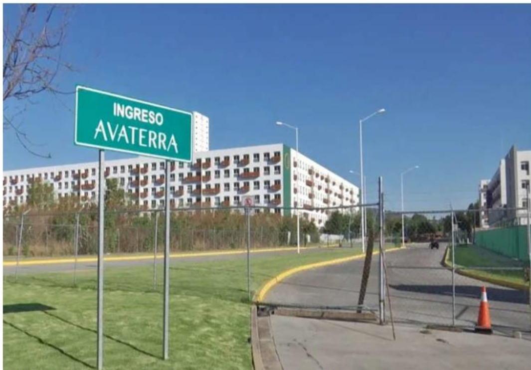
La principal atracción para los compradores es que está en un área natural, a pesar del impacto ambiental que representa.

Los departamentos se ofertan desde tres millones 700 mil pesos. Estas unidades cuentan con dos o tres recámaras, balcón o terraza, y amenidades compartidas como terraza mirador, zona de albercas, gimnasio, parque central, pista de jogging y espacio de coworking. Sin embargo, la principal atracción para los posibles compradores es su ubicación en un área natural, a pesar del impacto ambiental que representa. Aunque la Villa Panamericana está habitada desde hace tres años, el desarrollador no ha cumplido con las obras de contraprestación. Sin embargo, el alcalde de Zapopan, Juan José Frangie, se mostró confiado en que esto sucederá. "Todavía no terminan de entregárnoslo, no sé qué proceso vaya, pero todavía no lo terminamos. Les digo algo: creo que sí están actuando con responsabilidad, no están haciendo nada fuera de lo que estaba anteriormente. Y bueno, pues esperar ahorita a ver qué pasa con este nuevo decreto y las Villas;