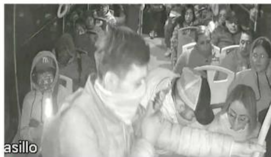
■ Los ladrones amagaron a los pasajeros con una pistola.