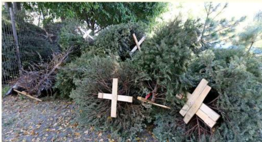
El único requisito solicitado es que el ejemplar vaya limpio.