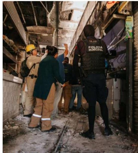
Continúan con los trabajos de peritaje.

El mercado permanecerá cerrado hasta que se concluya el peritaje realizado por el Instituto Jalisciense de Ciencias Forenses y Protección Civil de Guadalajara. —