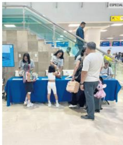
PUERTO VALLARTA. Vigilancia en la terminal.