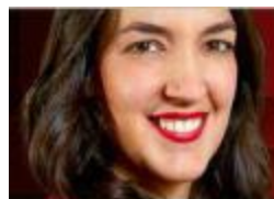
LINOTIPIA PENILEY RAMÍREZ @peniley_ramirez

El perdón de Biden a una productora minorista de carfentanilo es usado por congresistas de EU para presionar a políticos que negociarán con México.