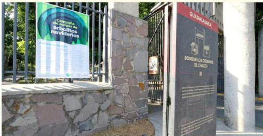
Uno de los puntos de acopio que funcionarán está en Los Colomos.

El único requisito solicitado es que el ejemplar vaya en limpio, sin adornos ni materiales extra incrustados.