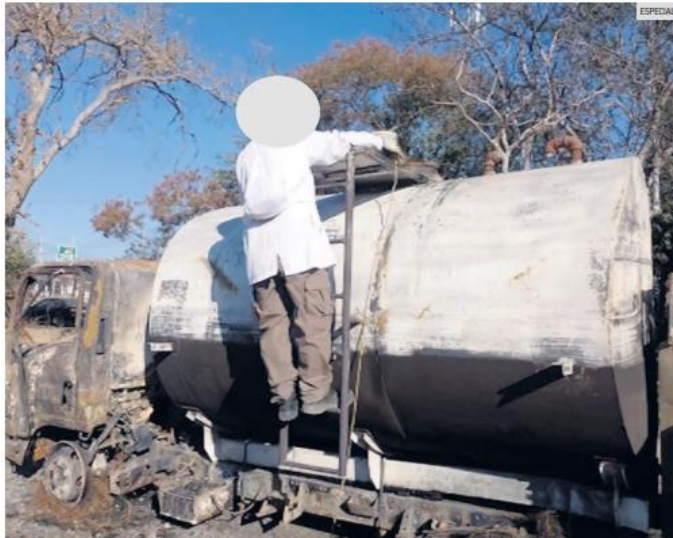
EL INCENDIO. Además del combustible irregular, las autoridades encontraron varios contenedores, así como 13 vehículos y dos motocicletas.