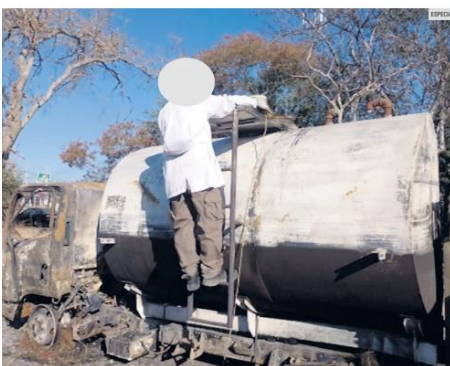
EL INCENDIO. Además del combustible irregular, las autoridades encontraron varios contenedores, así como 13 vehículos y dos motocicletas.

"La siguiente semana estaremos poniendo los taches físicamente (imagen) en las gasolineras que se pasen de listas con los precios, pues se veían la barda con lo que ganan a cada litro de gasolina". Iván Escalante, titular de Profeco.