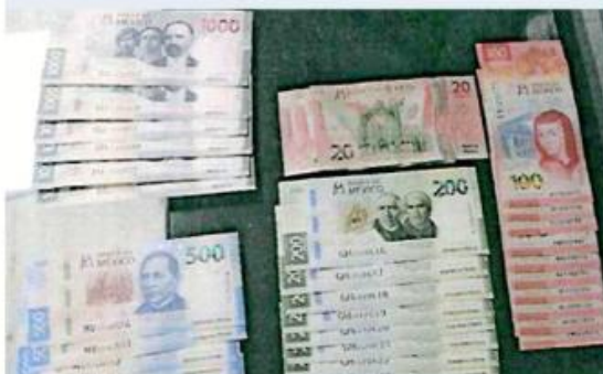
■ El canadiense portaba dinero en efectivo y cheques.