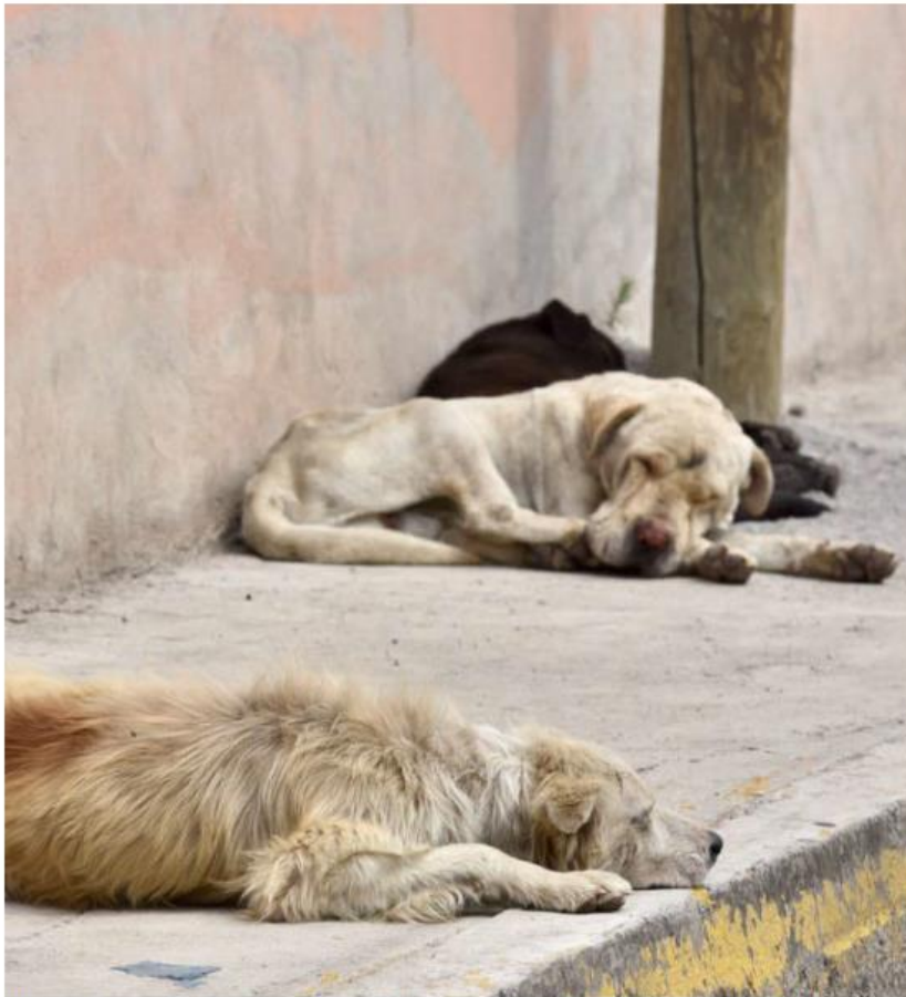
Durante los meses de marzo y abril aumentan los reportes de abandono animal.

Por otro lado, advirtió que comprar en lugares no regulados, como los tianguis o en zonas ajenas a veterinarias, no garantizan que los animales se encuentren en buenas condiciones, mucho menos que tengan la edad que les indican tener o que la cartilla de vacunación sea auténtica, por lo que pide evitar la necesidad de comprar en