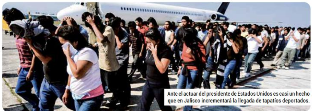
Ante el actuar del presidente de Estados Unidos es casi un hecho que en Jalisco incrementará la llegada de tapatíos deportados.

Para ninguna de las personas que serán deportadas será fácil volver a su Estado para reiniciar una vida en comunidad o con su familia. Es como empezar de cero y, por más que pensemos que no, les resultará frustrante. Regresivo