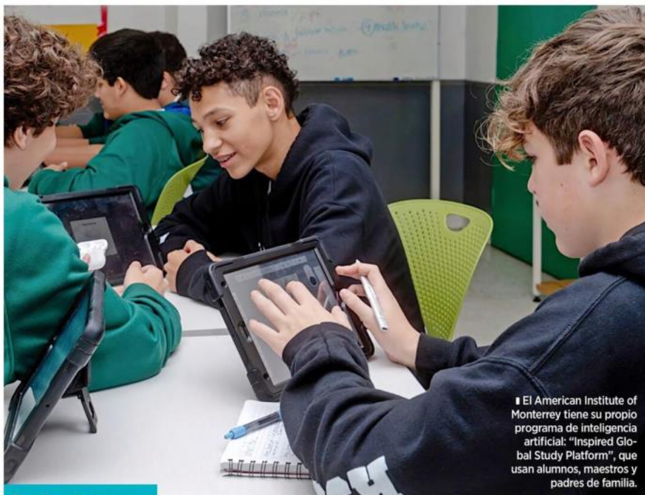
El American Institute of Monterrey tiene su propio programa de inteligencia artificial: "Inspired Global Study Platform", que usan alumnos, maestros y padres de familia.