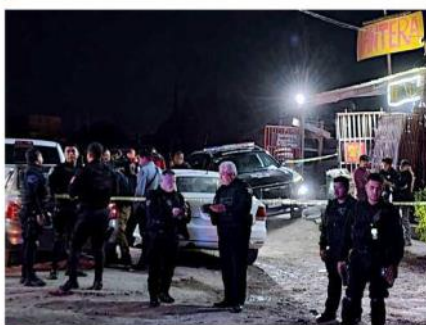
Un multihomicidio se registró en una llantera de Tesistán.

taron un tambo con olores fétidos y manchas de sangre en Juan Bautista Ceballos y Acueducto.