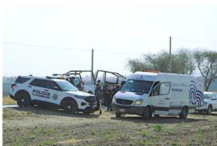
Junto a la Carretera a Arvento fue localizado un cadáver.