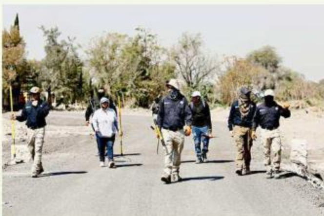
El operativo se implementó en zonas estratégicas.

Durante el despliegue se utilizaron diferentes herramientas para apoyarse