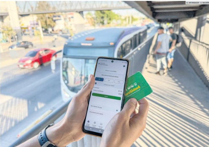
AVANCES. Los usuarios del transporte público tienen más opciones para pagar sus pasajes: ahora con QR en los sistemas del Peribús y Macrobus.

La Secretaría de Transporte activa una nueva modalidad de ingreso al transporte público a través de una aplicación desde el teléfono