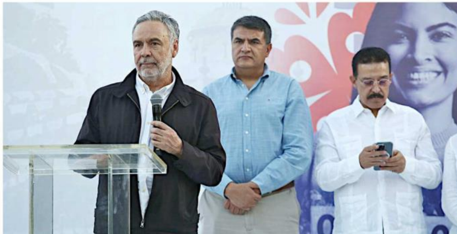
Funcionarios de Morena reaccionaron ante los anuncios del Presidente de EU sobre deportación y aranceles.

Reprobó los anuncios del Mandatario norteamericano, quien desde que asumió funciones ha amenazado con realizar una deportación masiva de inmigrantes. Además, amagó con imponer aranceles del 25 por ciento a los