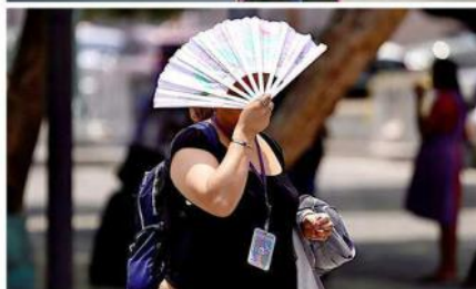
El Instituto de Astronomía y Meteorología de la UdeG prevé días más cálidos de lo normal.

grados Celsius, sobre todo por las tardes.