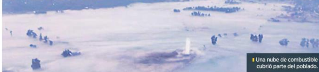
Una nube de combustible cubrió parte del poblado.

El Estado es puntero en el hallazgo de 'piquetes' a ductos de Pemex