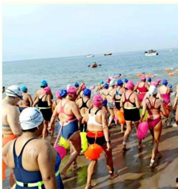
La ocupación hotelera en Puerto Vallarta alcanzó 88 por ciento; la mayoría fueron turistas nacionales.

La Costa Sur, por su parte, alcanzó 58 por ciento de ocupación hotelera y generó ingresos por 8 millones 470 mil pesos.