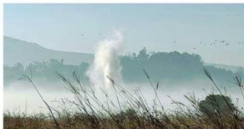
La fuga en el ducto se debió al robo de hidrocarburo.