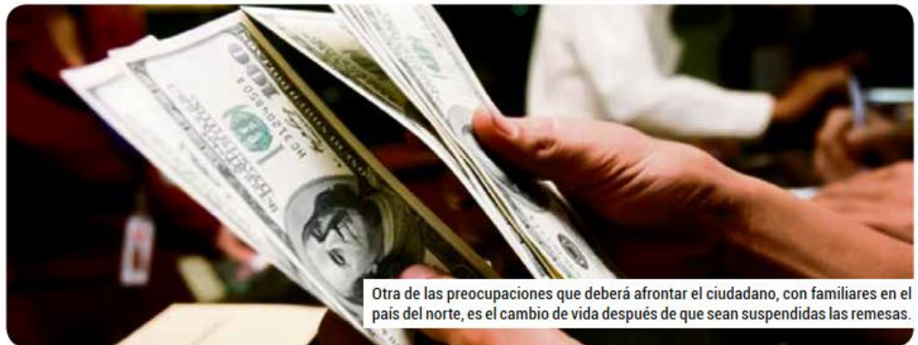
Otra de las preocupaciones que deberá afrontar el ciudadano, con familiares en el país del norte, es el cambio de vida después de que sean suspendidas las remesas.

Habrà que ver si las políticas de contención del gobierno de Pablo Lemus en Jalisco son suficientes para atender a los miles de migrantes tapatíos que regresarán, o son meros paliativos que no resuelven el problema histórico de fondo que les hizo marcharse sin quererlo: la falta de oportunidades de los más y