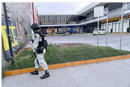
En una plaza de Tonalá fue asesinado a balazos un hombre.

Cerca de las 23:00 horas, vecinos de la Colonia 5 de Mayo, en Guadalajara, repor-