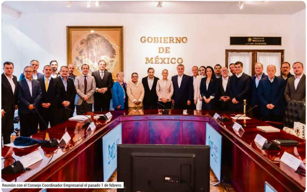
Reunión con el Consejo Coordinador Empresarial el pasado 1 de febrero.