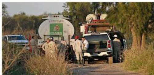
Autoridades calcularon un derrame de 5 millones de litros.

cada 4 horas 37 minutos se detectó una toma clandestina en Jalisco el año pasado.