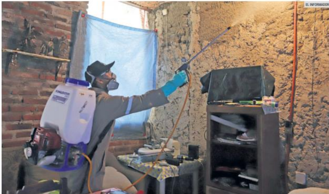
FUMIGACIÓN. La Secretaría de Salud Jalisco llamó a la población a permitir que los brigadistas identificados ingresen a los hogares.

En las primeras semanas del año se registró un alza respecto al mismo periodo de 2024