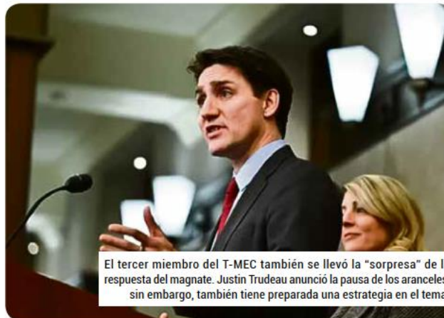
El tercer miembro del T-MEC también se llevó la "sorpresa" de la respuesta del magnate. Justin Trudeau anunció la pausa de los aranceles, sin embargo, también tiene preparada una estrategia en el tema.

Han transcurrido 31 años desde entonces, el TLC cambió de nombre por T-MEC (Tratado México, Estados Unidos, Canadá), pero conservó su esencia de convertir a la región de norteamérica en la de mayor crecimiento económico del mundo. Otras economías, como la