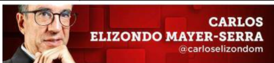
CARLOS ELIZONDO MAYER-SERRA @carloelizondom

¿Logrará el gobierno avances sustantivos en la lucha contra el fentanilo, así como en frenar la migración, en apenas un mes?