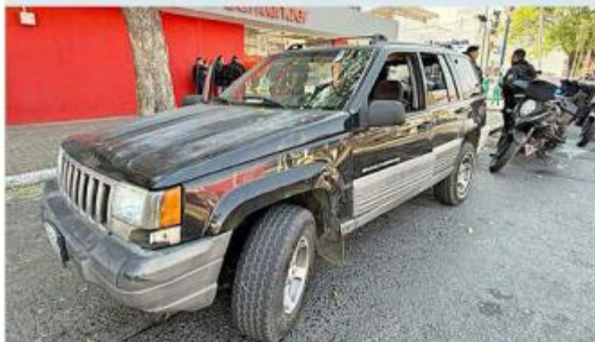
Los sujetos fueron interceptados en la Avenida La Paz.

Anunciaron vigilancia calle por calle en horarios en los que hay mayor afluencia.