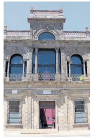
“LA CASA DE LOS PERROS”. Este espacio es la sede del Museo del Periodismo y las Artes Gráficas.