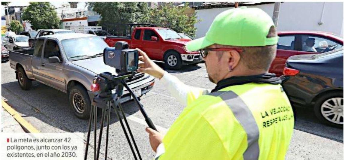
■ La meta es alcanzar 42 polígonos, junto con los ya existentes, en el año 2030.

están dispuestas para 2030. Aunado a ello, el Instituto de Planeación y Gestión del Área Metropolitana (Imeplan) informó el 5 de febrero que se encuentra en proceso el Plan de Gestión de Velocidades, previsto para este año con aplicación en Guadalajara, Zapopan, Tlajomulco, Tlaquepaque, Tonalá, El Salto, Zapotlanejo, Juanacatlán e Ixtlahuacán de los Membrillos.