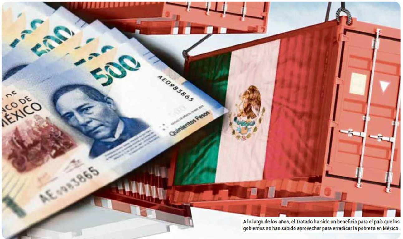
A lo largo de los años, el Tratado ha sido un beneficio para el país que los gobiernos no han sabido aprovechar para erradicar la pobreza en México.