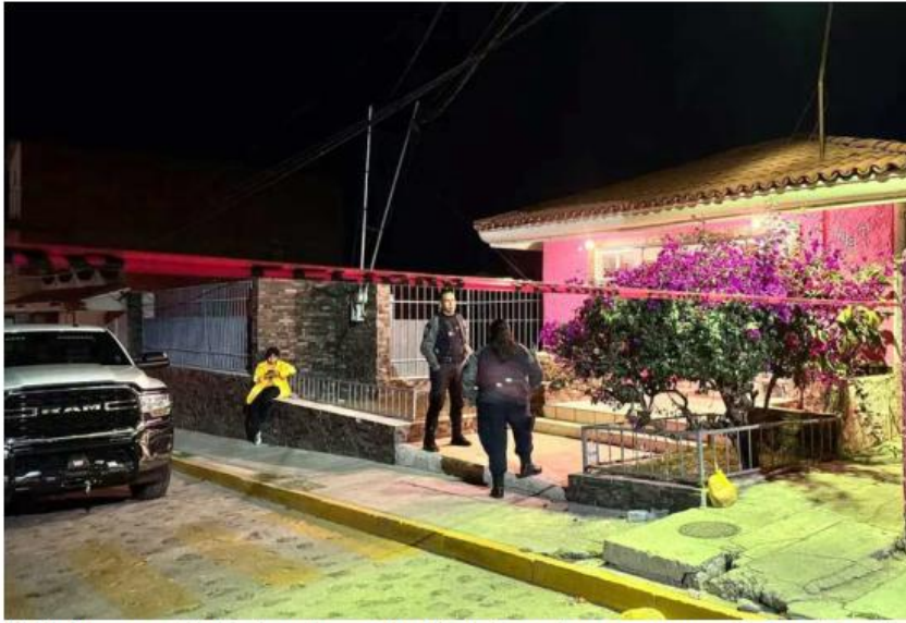
El 6 de febrero un niño de cinco años murió en kinder luego de que le cayera una barda encima. UT