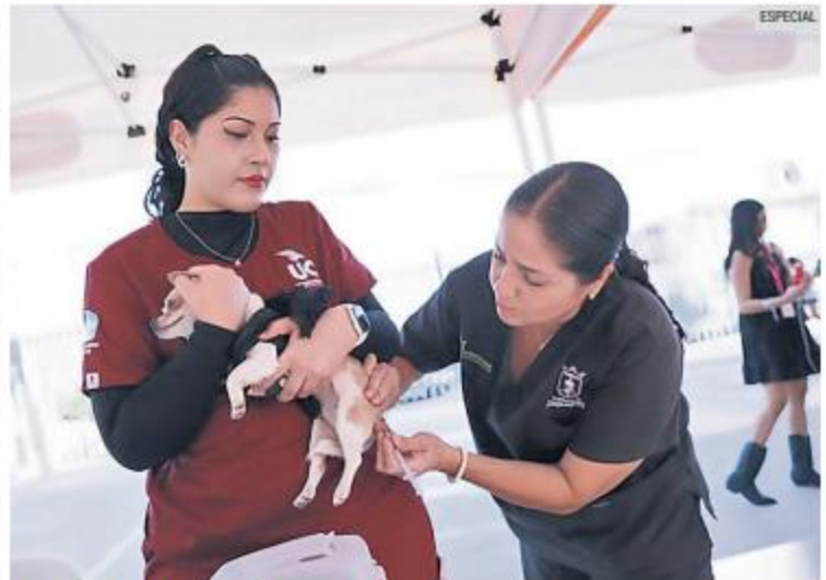
SALUD ANIMAL. Especialistas atienden a mascotas en Zapopan.

“Nuestro objetivo es llevar los servicios del CISAZ a las colonias más alejadas del municipio. Invitamos a los ciudadanos a que traigan a sus mascotas con correa o en transportadora para garantizar su seguridad”, detalló. Desde noviembre de 2023, la Caravana de Salud Animal ha visitado colonias como Villas del Ixtepete, El Colli, Auditorio y Teistán, brindando 430 atenciones médicas a 263 mascotas de 167 familias.