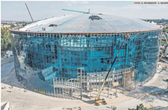
CONFORT. La Arena Guadalajara contará con más de 400 pantallas 4K en los pasillos.

Además, enfatizó la importancia de ofrecer explicaciones claras y directas sobre el cambio de fechas. "Pocas promotoras y recintos hablan después de un boletín, pero para nosotros el público es lo más importante. La gente que compra un boleto merece respuestas, y por eso estamos aquí, para explicar el porqué del cambio y darles la certeza, es lo mínimo que podemos hacer".