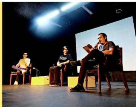
Los encuentros de los Miércoles Literarios se realizará en el Ágora del Ex Convento del Carmen.