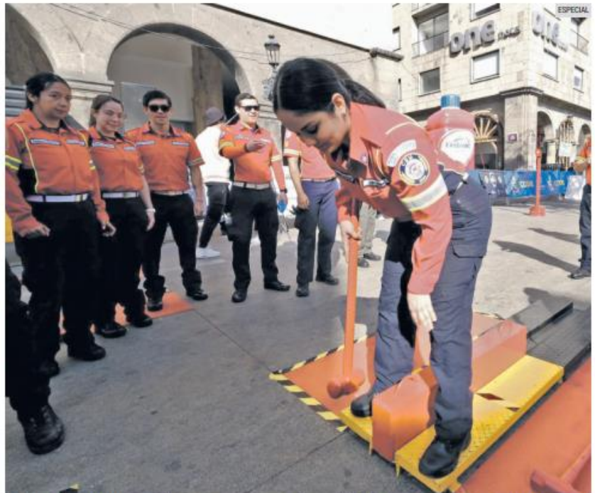
HÉROES. Bomberos de varios países ponen a prueba sus habilidades en materia de rescate, emergencias y combate de incendios.