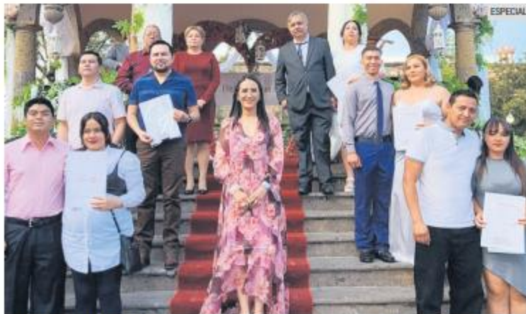
BODA COMUNITARIA. Cientos de parejas regularizaron su unión.