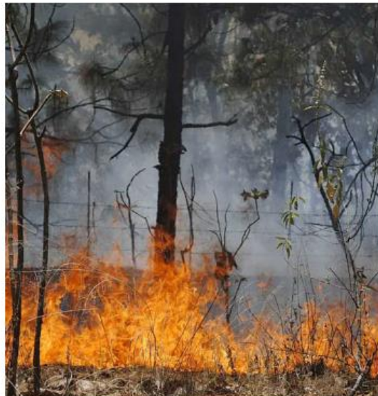
Las acciones han estado enfocadas en la creación de brechas cortafuego y líneas negras.

El funcionario subrayó la importancia de estas estrategias en la conservación del medio ambiente y en la protección de comunidades cercanas a zonas forestales. ■