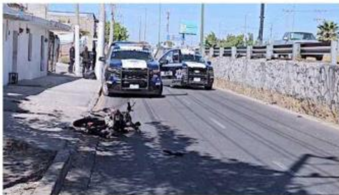
■ El choque se registró en la Avenida Juan Gil Preciado

La Fiscalía de Jalisco informó que la muerte es investigada por la Unidad especializada en Hechos de Sangre, Tránsito y Transporte Público, cuyo personal entrevistó a varias personas y recopiló videos. No se ha establecido si el impacto fue accidental o intencional.