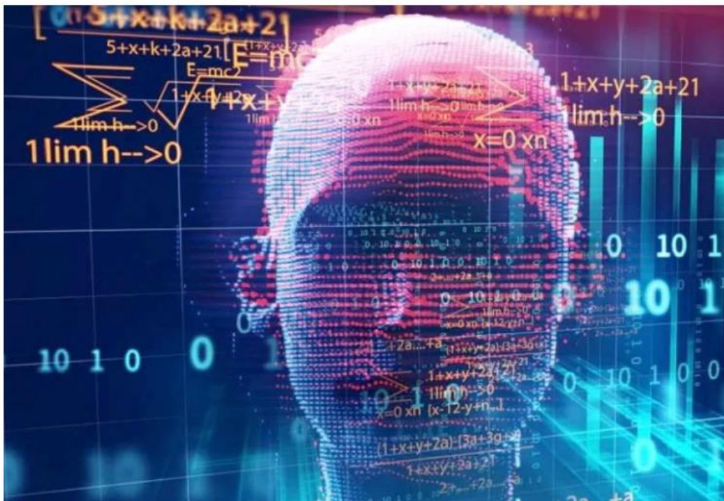
La instalación de "Kutsari" atraerá inversiones y fomentará la innovación en áreas como la inteligencia artificial.