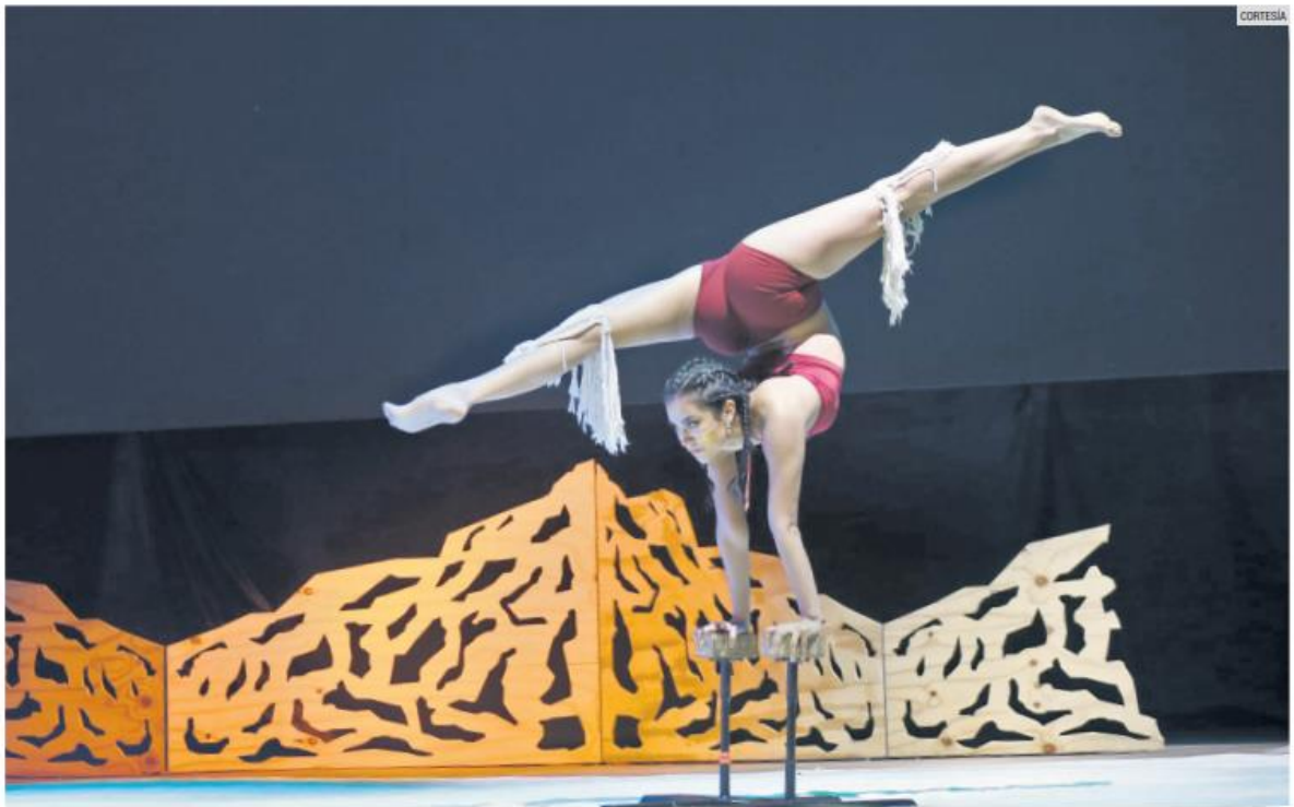
ARTES CIRCENSES. Las acrobacias están presentes en el espectáculo.

La compañía tapatía Circo Elektrico ofrece un espectáculo donde están presentes títeres gigantes y acróbatas