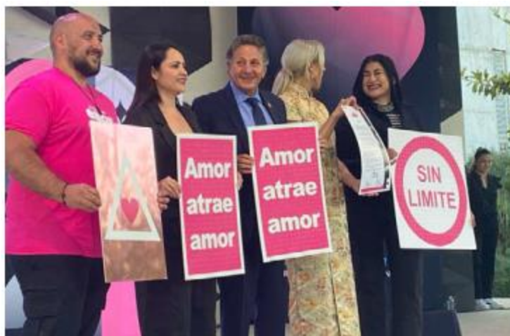
CELEBRACIÓN. Zapopan inauguró el Festival del Amor en el Parque de las Niñas y Niños, un evento para fortalecer el tejido social.