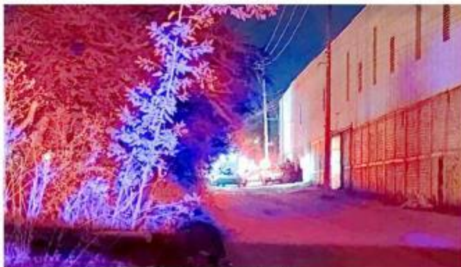
La víctima fue localizada en la Colonia Las Pomas.

Después de apagar el fuego, autoridades establecieron que la víctima era una mujer, aunque el cuerpo quedó carbonizado y no se pudo determinar su edad