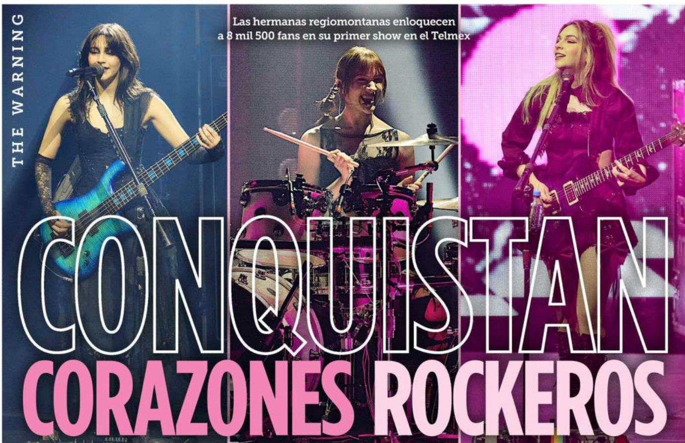
Las hermanas regiomontanas enloquecen a 8 mil 500 fans en su primer show en el Telmex