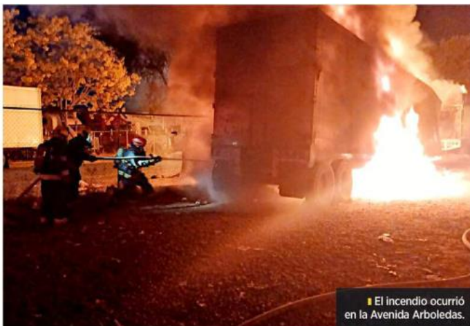
El incendio ocurrió en la Avenida Arboledas.