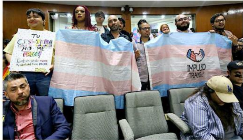
■ Grupos de la diversidad sexual se manifestaron el jueves en el Congreso para apoyar a las infancias trans.