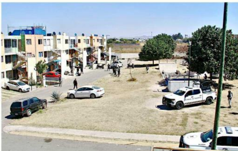
El tiroteo ocurrió el miércoles en la Colonia Viveros del Real.