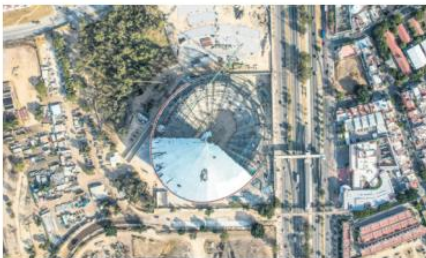
EXTERIORES. En cuanto al estacionamiento, ofrecerá más de 2 mil 500 cajones gratuitos.