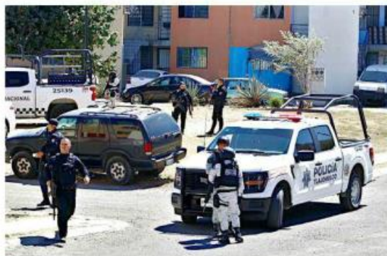
Decenas de policías participaron en el operativo.

La balacera generó una movilización intensa a la que se sumaron elementos de la Guardia Nacional y la Policía Metropolitana, así como