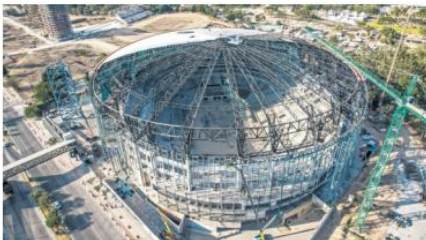
ESPACIOS. El recinto tendrá una capacidad de hasta 20 mil personas en el escenario central, adaptable para diferentes tipos de presentaciones.