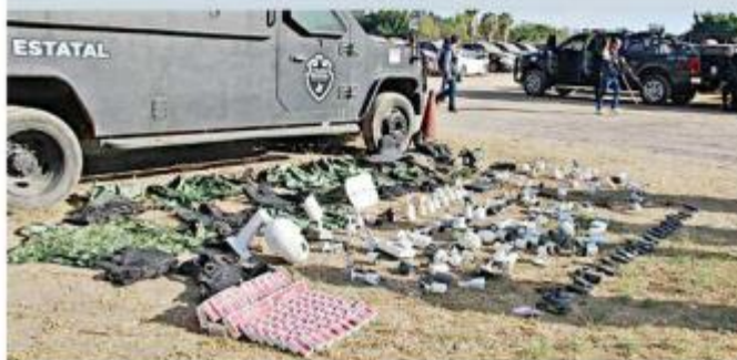
■ En Villa Hidalgo se aseguraron cámaras de videovigilancia ilegales, fusiles, radios y chalecos tácticos.