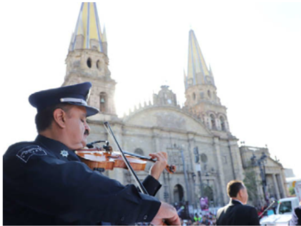
Policías tocaron y cantaron las "Mañanitas". ESPECIAL