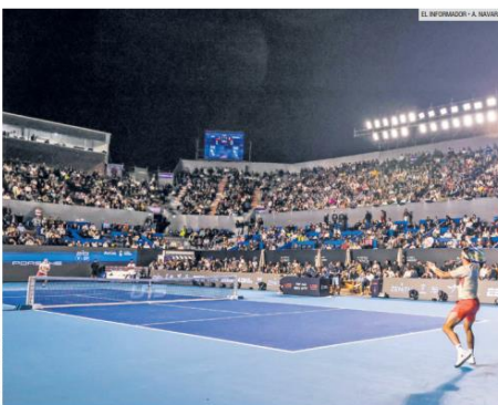
HASTA LAS LAMPARAS. El estadio del Complejo Panamericano de Tenis tuvo una entrada espectacular en el primer día de actividades. Estas concluirán el domingo.

La guerra ha provocado crisis económicas y energéticas en todo el mundo, con aumentos en los precios de los alimentos y combustibles, además de una reconfiguración geopolítica con el fortalecimiento de la OTAN.