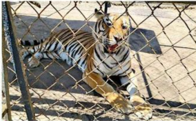
■ En la propiedad fueron hallados 10 tigres.

El hallazgo se hizo público en abril de 2023. La FGR informó que miembros de la Secretaría de la Defensa Nacional (Defensa) hacían un recorrido en La Barca cuando vieron un predio con