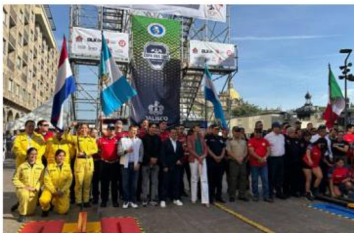
COPA. Guadalajara es sede de la Copa de la Organización de Bomberos Americanos, con delegaciones de seis países.