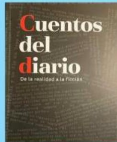
■ Portada del libro presentado en la Casa ITESO Clavigero.