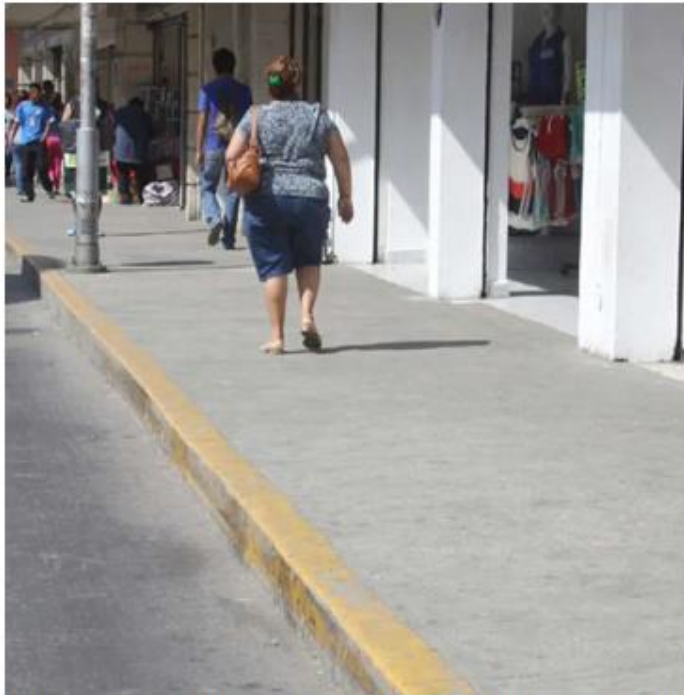
La posible aplicación de multas a quienes no mantengan limpias sus aceras ha sido bien recibida.