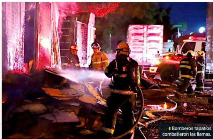
Bomberos tapatíos combatieron las llamas.