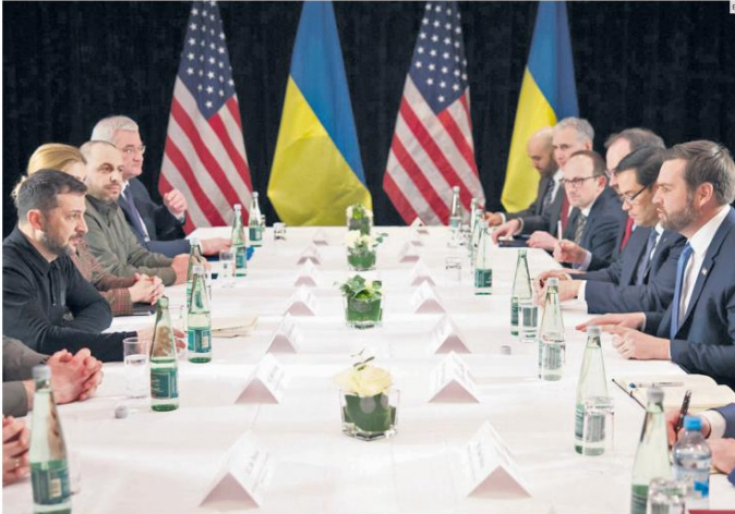
PRIMER ACERCAMIENTO. El presidente de Ucrania, Volodymyr Zelenskyy (primero a la izquierda), se encuentra con el vicepresidente de Estados Unidos, J.D. Vance (primero a la derecha) en la conferencia de Múnich, Alemania.