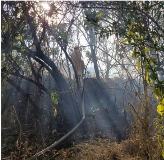
Un total de 133 elementos de diferentes corporaciones combaten el fuego en el bosque de La Primavera.