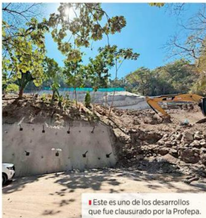
Este es uno de los desarrollos que fue clausurado por la Profepa.

“Las zonas costeras son importantísimas, porque protegen a las poblaciones de fenómenos meteorológicos extremos y también garantizan la conservación de la biodiversidad”, agregó.