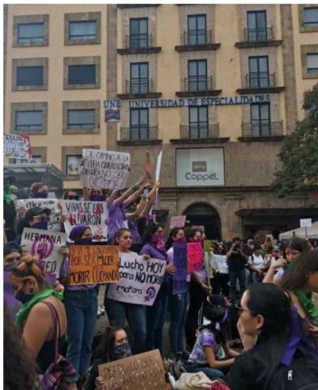
El año 2020 fue un antes y un después, asistieron 35 mil. ESPECIAL

La organización de la marcha nació por iniciativa de jóvenes y mujeres con la intención de darle visibilidad a la lucha feminista. Con el paso de los años, la participación ha crecido de manera exponencial. La manifestación de 2020 fue un antes y un después, con una asistencia de 35 mil personas, impulsadas por la preocupación e indignación por la violencia contra las mujeres, con casos mediáticos como el de Fátima y Lesvy, ocurridos en Ciu-