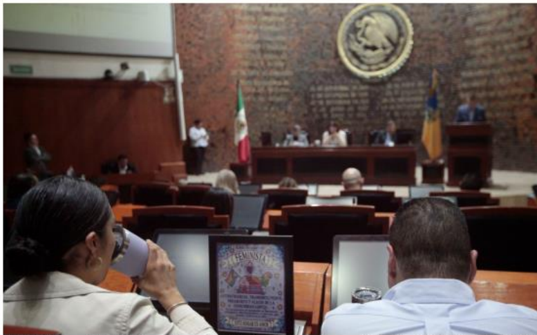
El PAN dijo que la iniciativa vulnera 43 artículos de los derechos de la niñez.