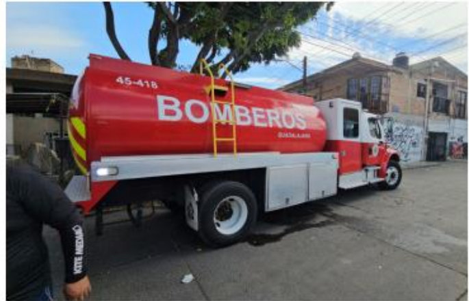
CASO. Durante la tarde de este viernes se registró un incendio al interior de una casa ubicada en la colonia Nueva Santa María de GDL. Al parecer todas las personas del lugar alcanzaron a salir.