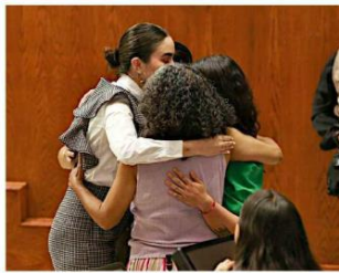
Diputados se consolaron, luego del resultado en la votación.

Candelaria Ochoa, diputada de Morena, criticó