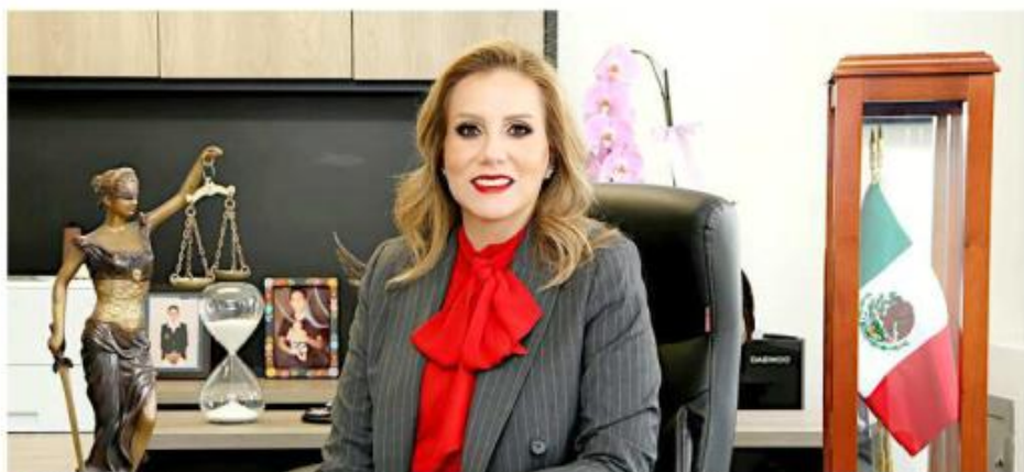
■ Gabriela Sánchez Cabrales, Consejera Jueza del Consejo de la Judicatura del Estado.

De acuerdo con cifras compartidas por la Consejera, tan sólo el año pasado en los juzgados del Estado se iniciaron 153 mil 53 procedimientos nuevos; de ellos, 32 mil 898 fueron en mate-