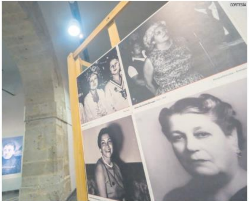
EXPOSICIÓN. Pieza de la muestra "Mujeres Jaliscienses Prominentes".