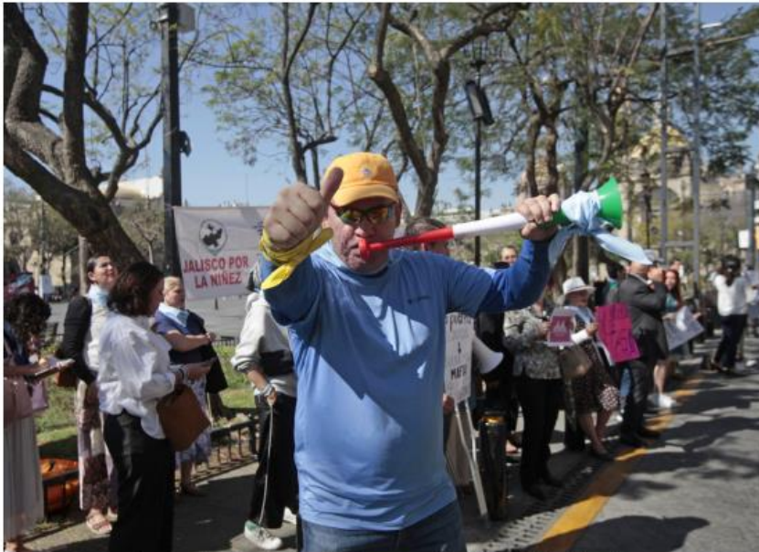
Dicen que su postura no implica desacato, sino un pedido de análisis minucioso. F. CARRANZA