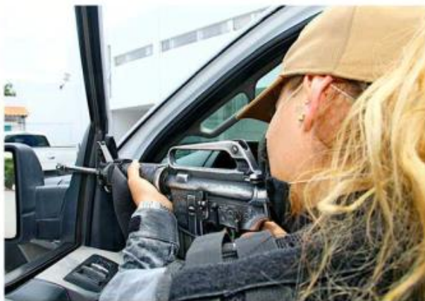
■ La mayoría de los puestos de mando en comisarías del AMG es ocupada por hombres.

Tonalá respondió que 25 por ciento de los mandos son