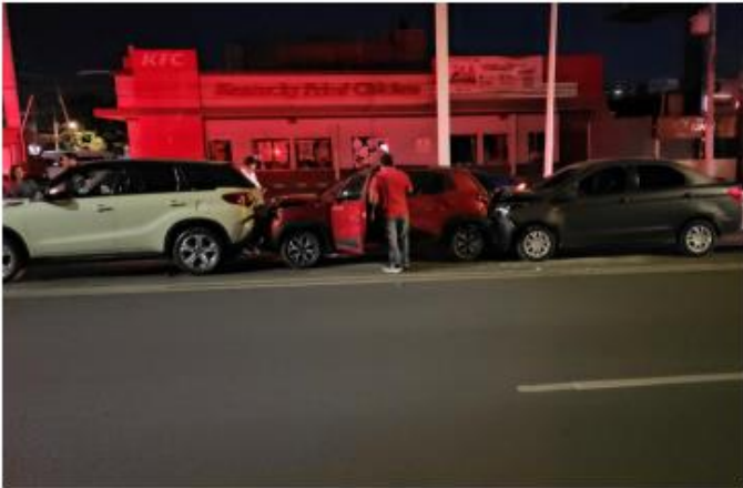
COLUSIÓN. Dos lesionados fue el saldo que dejó una carambola entre tres vehículos sobre la avenida Mariano Otero al cruce de la avenida Plaza del Sol. No se reportaron heridos de gravedad.