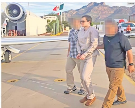
CADENA PERPETUA. El hijo de Nemesio Oseguera tiene 35 años de edad. Además de la sentencia, Estados Unidos requiere el decomiso de más de seis mil millones de dólares de su propiedad.