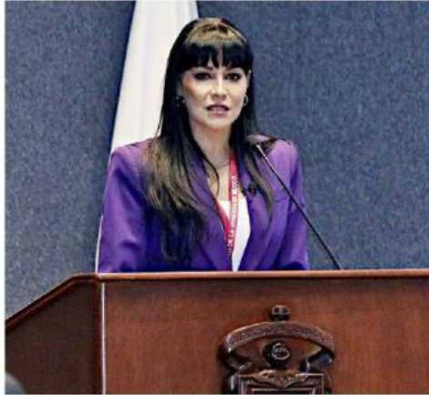
La legisladora estuvo ayer en Guadalajara en el foro "El futuro de la vivienda social en México".