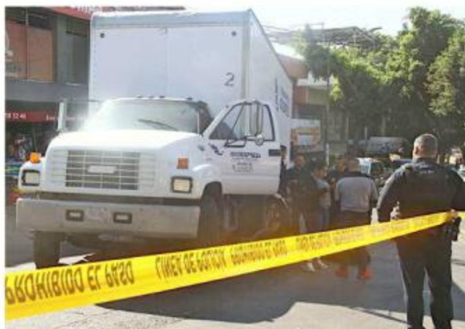
El vehículo fue asegurado en la Avenida del Mercado.

Dentro del camión se hallaron dos inhibidores de señal, así como un arma de fuego.