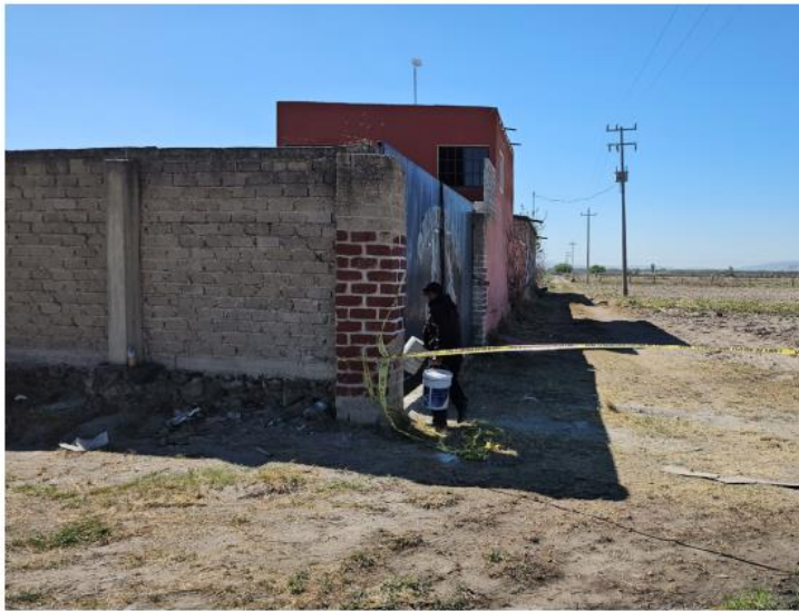
El hallazgo se registró al interior de un rancho. JUAN CARLOS MUNGUÍA