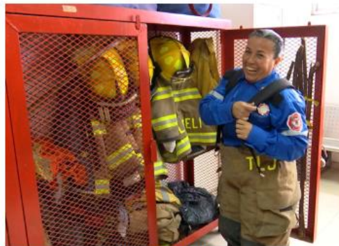
Su vida transcurre entre turnos de 24 horas.