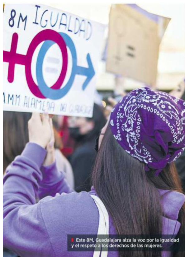
Este 8M, Guadalajara alza la voz por la igualdad y el respeto a los derechos de las mujeres.