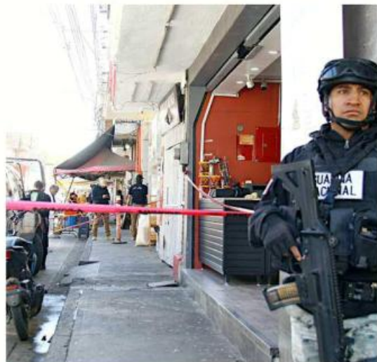
■ En San Martín de las Flores mataron a un hombre en robo.

Además, cerca de las 11:00 horas fue encontrado un cuerpo carbonizado en un cañaveral del poblado de San Isidro, en Tlajomulco.