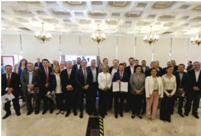
PROGRAMA. El gobierno estatal presentó el Distintivo Responsabilidad Laboral al estilo Jalisco, el cual será entregado a las empresas e instituciones que cumplan con las normativas laborales.