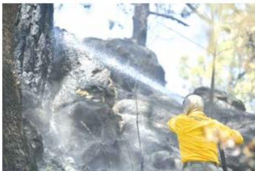
MÁS DE UN DÍA. Las labores de combate al fuego comenzaron a las 13:30 horas del domingo y terminaron hasta las 7 de la noche de este lunes.

Por el incendio ocurrido en los límites de los municipios Zapopan y El Arenal, la Secretaría de Medio Ambiente y Desarrollo Territorial (Semadet) activó durante la noche del domingo una emergencia atmosférica que la tarde de este lunes pasó a una alerta atmosférica para Zapopan (El Bajío, Base Aérea y La Venta), Tala (cabecera municipal) y El Arenal (Huaxtla y Santa Cruz del Astillero). En las mismas zonas se suspendieron las clases en educación básica durante