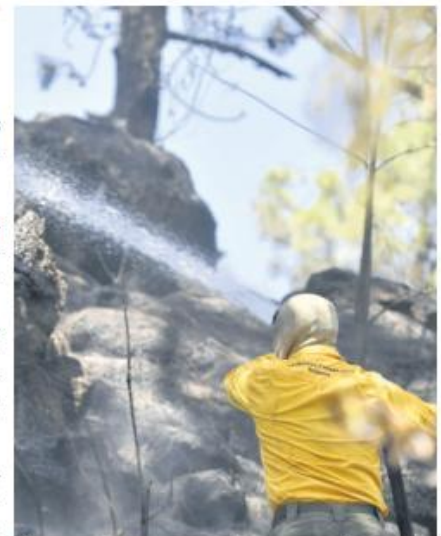
ÁREA VULNERABLE. Desde 2020, La Primavera ha sufrido de más de 254 incendios.