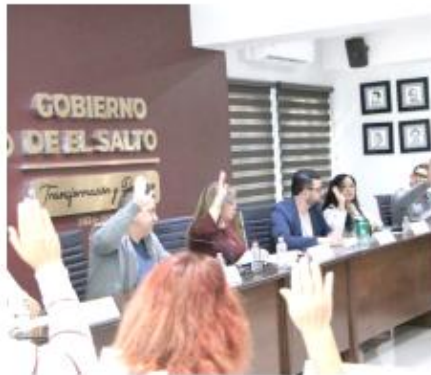
En sesión de Cabildo probaron el subsidio.

Se trata de un convenio entre el Gobierno de El Salto y el Gobierno de Jalisco, a través de la Coordinación Estratégica de Seguridad, y en beneficio de los elementos para que