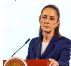
La Presidenta.

— Claudia Sheinbaum desestima el "descuido" morenista en el Zócalo capitalino, "tema menor", y Ricardo Monreal dice que es "capítulo cerrado". PAG.18