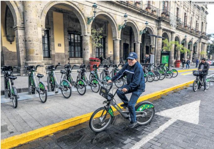
CENTRO HISTÓRICO. De acuerdo con una encuesta, la mayoría de los usuarios utiliza el sistema de MiBici para trasladarse a sus centros de trabajo.

Usuarios reconocen que se han eliminado fallas en el sistema, pero piden más estaciones hacia Tonalá, Tlaquepaque y Tlajomulco