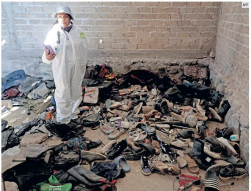
INTERVENCIÓN. El colectivo Guerreros Buscadores de Jalisco hizo el hallazgo la semana anterior.

En el lugar, los activistas también encontraron objetos personales como mochilas, carteras, bolsas de mano, maletas, cuadernos, documentos, credenciales, llaveros y libros y artículos de bisutería, entre decenas de objetos, que comparten en fotos y videos, en varias de ellas muestran fotografías, libros y cuadernos de los presuntos desaparecidos.