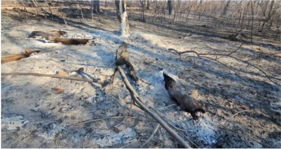
El fuego devoró gran parte de un paraje del Bosque de La Primavera. JUAN CARLOS MUNGUÍA