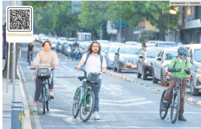
SUSTENTABILIDAD. Ciclistas contribuyen a una mejor calidad del aire.