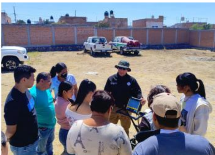
LABOR. La Comisión de Búsqueda de Personas de Jalisco capacitó a la Célula de Búsqueda de Lagos de Moreno y familiares de desaparecidos en los trabajos de búsqueda de campo y forense.