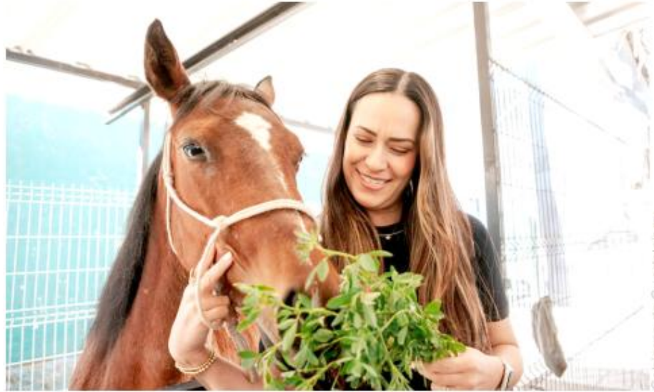
Gobierno de Guadalajara

"Tenemos el hospital ambulante que se llama Firulais, que también ya