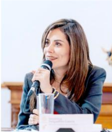
Gobierno de Guadalajara

La ciudadanía se involucraría en la gestión pública, dijo Delgadillo.