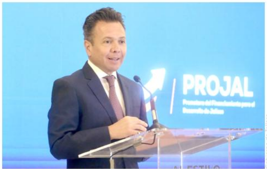
El gobernador, Pablo Lemus Navarro, encabezó el evento.

Yo quisiera hacer una reflexión en torno a la informalidad. No pone el piso parejo contra la empresa que hace el compromiso de pagar sus impuestos, de estar al día. Pero, por otro lado, la informalidad también tiene una cara humana que no debemos de olvidar”.