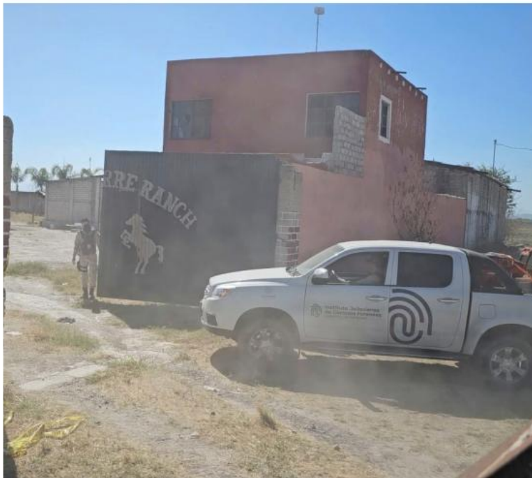
Autoridades revisan el inmueble tras el hallazgo de crematorios clandestinos.

En la conferencia mañanera, la presidenta Claudia Sheinbaum