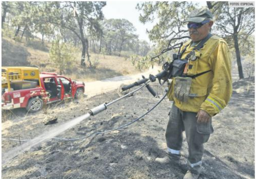
EVITAN MAYORES DAÑOS. Más de 218 elementos de Protección Civil del Estado trabajaron en la contención y posterior extinción del siniestro.

También se desplegaron 42 vehículos operativos y cuatro aeronaves (Witari, Zeus, Titán y Tlaloc), las cuales realizaron 153 descargas de agua en el paraje afectado. Se reportaron tres personas lesionadas, mientras que 800 más fueron evacuadas de las zonas de La Presa y Río Caliente.