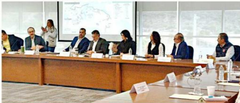
Instala Tlajomulco Mesa de Trabajo sobre Vivienda.

“Se propuso al Gobierno federal que Jalisco tuviera 29 mil viviendas de un millón que se están planteando en todo el País; 29 mil viviendas