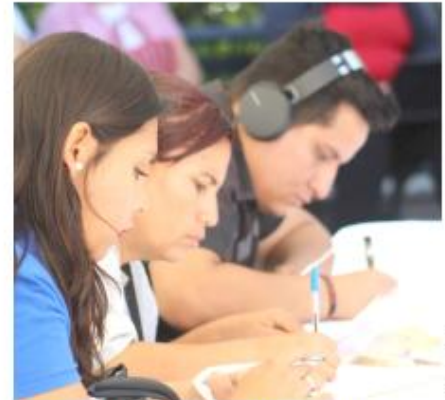
Es acusado de autorizar compras que afectaron al erario.

El exfuncionario había sido sentenciado el 3 de octubre de 2022 por haber autorizado de manera irregular la contratación de servicios y cámaras de videovigilancia, lo que afectó recursos públicos. Sin embargo, su defensa presentó recursos legales que lograron anular la sentencia, obligando a repetir el proceso.