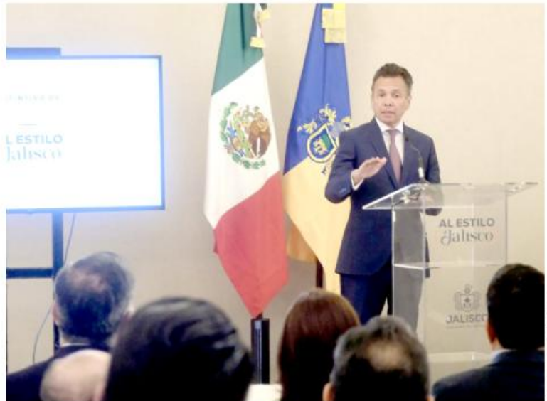
El gobernador de Jalisco, Pablo Lemus.