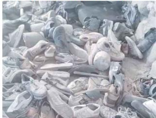
AGRUPACIÓN. El hallazgo de zapatos y prendas de ropa de las víctimas de reclutamiento fue realizado por el colectivo Guerreros Buscadores de Jalisco, no por la Fiscalía Estatal.

El gobernador de Jalisco recalca que, desde septiembre de 2024, cuando se halló el Rancho Izaguirre, debió realizarse una correcta revisión del sitio y afirma que debe haber castigos ante omisiones de funcionarios