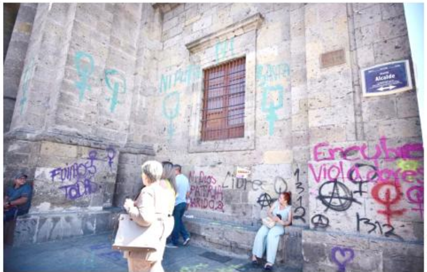
La Catedral fue vandalizada como no había sucedido en otras ocasiones.

"Las autoridades del Gobierno del Estado, a las que se les había solicitado apoyo para resguardar