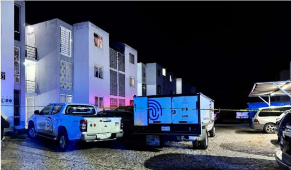
El crimen ocurrió en el fraccionamiento Real del Sol, en Tlajomulco de Zúñiga. USI TOLEDO