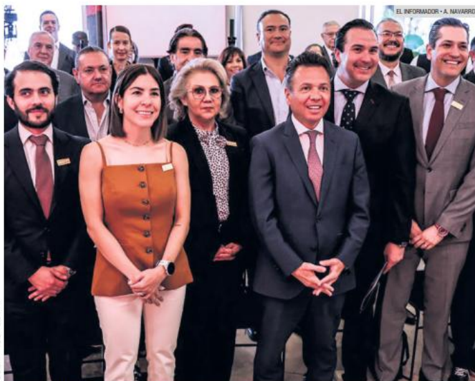
PABLO LEMUS. El gobernador presentó la Promotora del Financiamiento para el Desarrollo de Jalisco (Projal), un nuevo programa que busca apoyar a los emprendedores y las empresas locales.