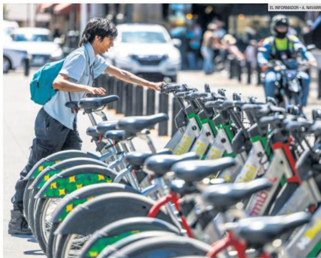
MEJORA. Usuarios manifiestan que hay más lugares para estacionar las bicicletas.

De hecho, de acuerdo con los datos de la AMIM, fue precisamente la contingencia ocasionada por el COVID-19 la que impulsó el uso de la movilidad activa, sumándose así a la petición de la Organización Mundial de la Salud emitida desde el inicio de la pandemia "para impulsar el uso de la bicicleta como un medio de transporte para disminuir la posibilidad de contagio del coronavirus".