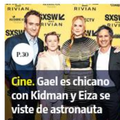
Cine. Gael es chicano con Kidman y Eiza se viste de astronauta