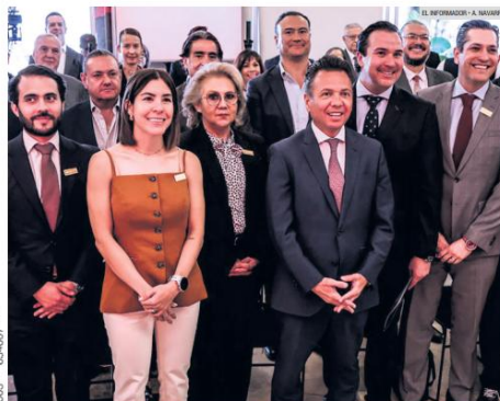
PABLO LEMUS. El gobernador presentó la Promotora del Financiamiento para el Desarrollo de Jalisco (Projal), un nuevo programa que busca apoyar a los emprendedores y las empresas locales.

La combinación de estos factores ha llevado a los analistas a advertir sobre un panorama complicado para los mercados en los próximos meses.