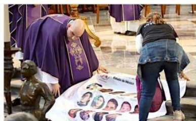
■ Madres buscadoras colocaron una manta con el rostro de sus desaparecidos en la Catedral de la CDMX.