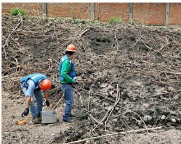
■ En julio del año pasado, autoridades realizaron un estudio en un predio de la zona del que se originaban malos olores.

Ante ello, y tras una reunión el jueves, la Coordinación Estratégica de Comunicación del Gobierno de Tlajomulco reconoció que es necesario reforzar la ins-