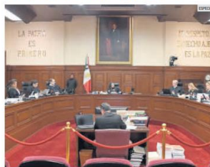
SUPREMA CORTE DE JUSTICIA DE LA NACIÓN. Una celebración desangajada.

En pleno proceso de desintegración por la reforma judicial, la primera presidenta de la Suprema Corte de Justicia de la Nación cumplió 200 años de su instalación como máximo tribunal de justicia del país. A través de redes sociales, la Corte destacó en un breve mensaje el Bicentenario del Alto Tribunal, que inició funciones el 15 de marzo de 1825, con Miguel Domínguez Trujillo, ex corregidor de Querétaro, como primer presidente.