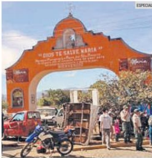
TALPA DE ALLENDE. El incidente ocurrió cerca del arco de ingreso al municipio.

Un autobús de pasajeros se accidentó la mañana de 1 sábado en el municipio de Talpa de Allende, mismo que dejó saldo de un fallecido y varias personas lesionadas.