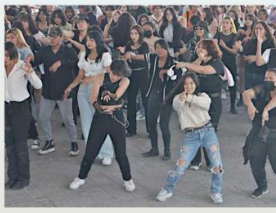
■ Muchos jóvenes utilizan espacios públicos para ensayar las coreografías de sus bandas favoritas.

"Es una forma muy libre de aprender danza pero también de generar trabajo en equipo porque te acercas a algunos valores tradicionales de esta técnica: la disciplina, el trabajo colectivo, la competitividad porque