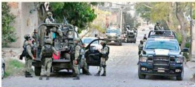
■ El crimen ocurrió el 11 de junio de 2023, en la Colonia Lomas del Cuatro, en San Pedro Tlaquepaque.

Por lo que respecta al delito de homicidio calificado, el Código Penal de Jalisco estipula una pena de 20 años de prisión como mínimo.