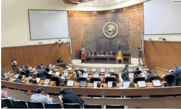
CONGRESO DEL ESTADO. La cámara falló en armonizar la reforma federal en nuestra Entidad.

Especialistas en derecho señalan que no existe un mecanismo para sancionar a los legisladores