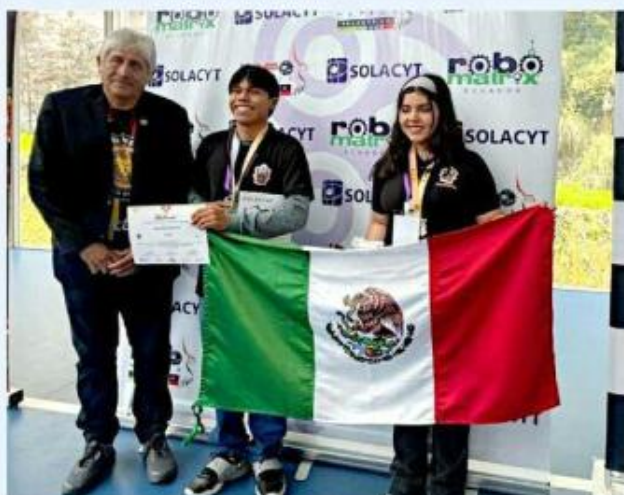
Alumnos de la Prepa de Jocotepec lograron la medalla de oro en el Infomatrix Sudamérica 2025.

La competencia Infomatrix es un espacio donde estudiantes latinoamericanos presentan proyectos innovadores en ciencia