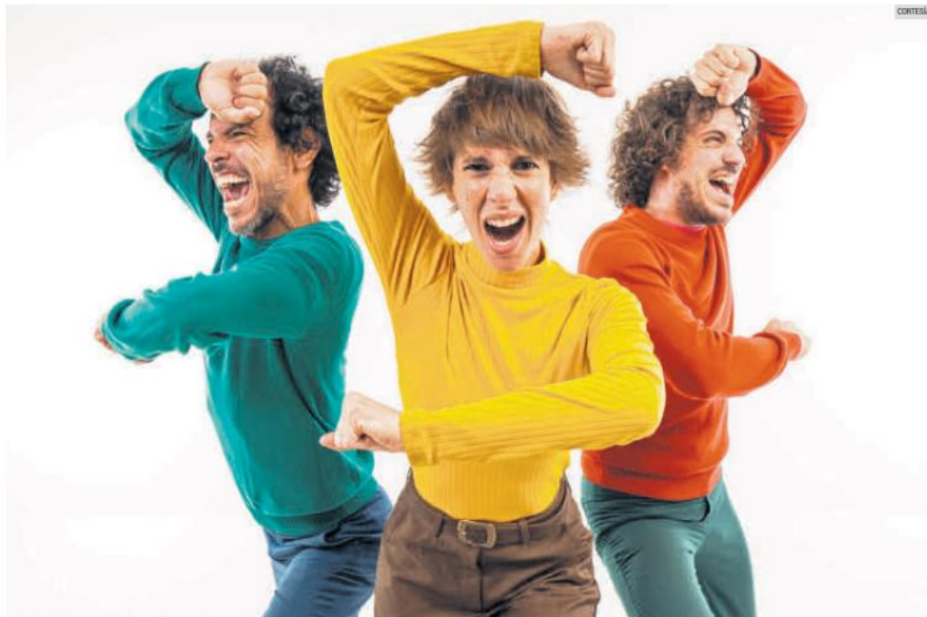
PIM PAU. La agrupación enfoca su show en temas lúdicos y educativos.

LA AGRUPACIÓN CELEBRA UNA DÉCADA DE MÚSICA Y JUEGO CON SU PÚBLICO EN GUADALAJARA