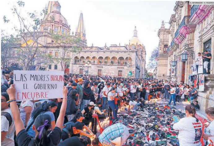
"TEUCHITLÁN, NUNCA MÁS". Las consignas lanzadas en la marcha de Guadalajara tuvieron eco en todo el país. La exigencia: "Ni un desaparecido más".

Colectivos de buscadores llenan el Centro de Guadalajara para exigir que frenen las desapariciones; la protesta se replicó en todo el país