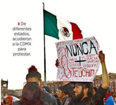
■ De diferentes estados, acudieron a la CDMX para protestar.