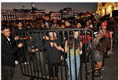
■ Integrantes de grupos anarquistas y policías de la CDMX sostuvieron un pequeño altercado.