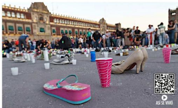
■ Cuatrocientos pares de zapatos y veladoras fueron colocados ayer en la plancha del Zócalo de la CDMX, en representación del Rancho Izaguirre, donde el CJNG habría reclutado a jóvenes.