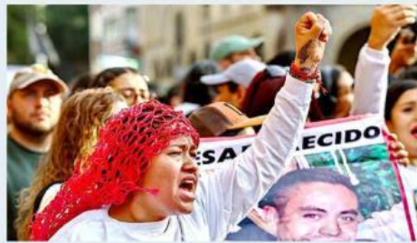
Familiares de víctimas de desaparición estuvieron presentes.

Muchos de los asistentes llevaban camisas con las fotografías de sus familiares no localizados.