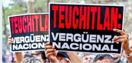
Una de las exigencias fue sancionar a los responsables.

Otros elevaron pancartas con mensajes alusivos a la tragedia registrada en la narcofinca.