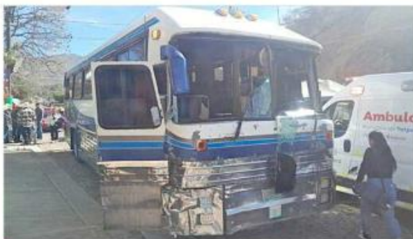
Una falla en los frenos hizo perder el control al chofer.