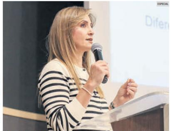
CYNTHIA CANTERO PACHECO. La secretaria de planeación y participación ciudadana hizo hincapié en que el futuro de Jalisco depende del compromiso de sus ciudadanos.

jos y foros de las regiones Altos Norte, Sierra de Amula y Sur, se realizaron en los días 11, 12 y 13 de marzo, respectivamente.