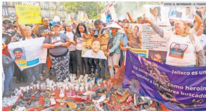
“NOS FALTAN”. Los integrantes de colectivos de búsqueda fueron acompañados por ciudadanos que se unieron a su causa. Frente al Palacio de Gobierno, exigieron a la autoridad que localice a sus familiares.