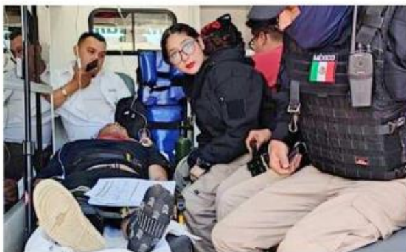
Los heridos fueron llevados a distintos hospitales.

Asimismo, una mujer de 69 años fue atropellada y sufrió múltiples fracturas en las costillas.