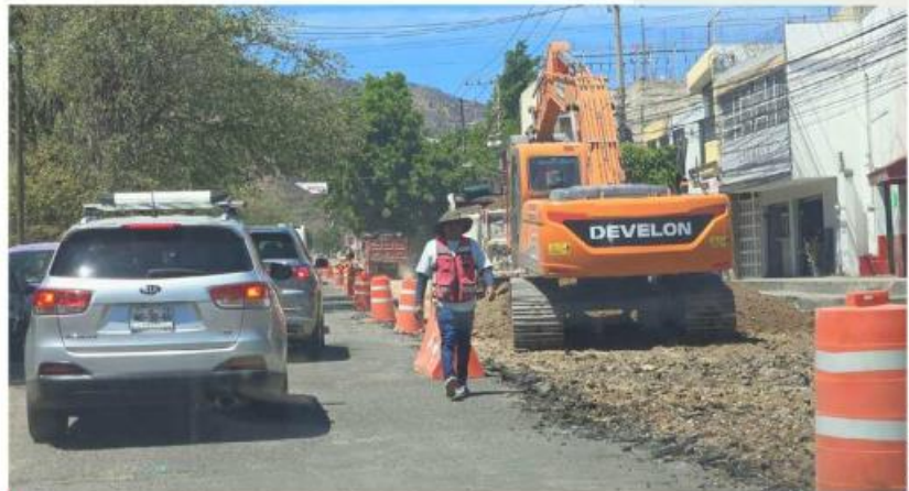
La primera etapa de la obra sobre Camino Real a Colima se estima concluya en marzo del próximo año.

11.5 kilómetros de la vialidad, es decir, de Periférico, en Tlaquepaque, a San Agustín, en Tlajomulco.