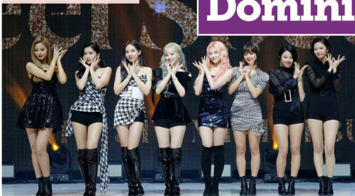
La agrupación Twice tiene un gran arraigo entre los fans del k-pop, y recientemente tuvieron dos fechas en el Foro Sol.