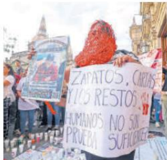
SIN ROSTRO. Las pancartas recordaron los hallazgos del rancho Izaguirre, en Teuchitlán.

chitlán. Reunidos en un semicírculo, en el centro sólo quedaron ellos, los que ya no están.