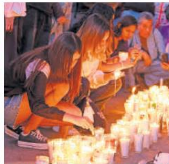
VELADA. La luz del día se fue, pero no la exigencia de las familias para reunirse con quien hoy no está.

“Nuestro corazón y nuestra mente nos lle-