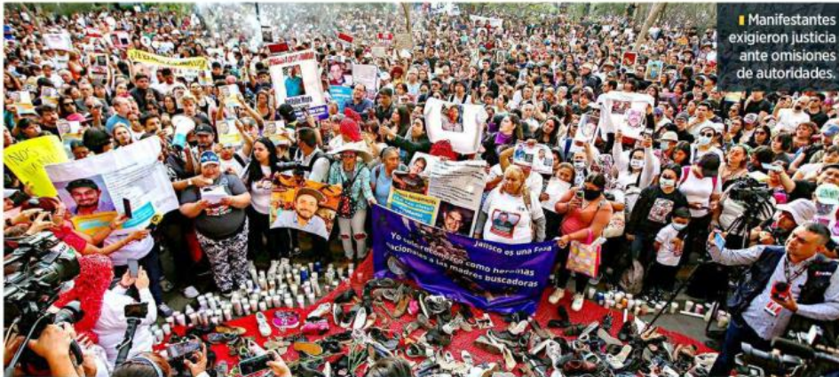
Manifesteros exigieron justicia ante omisiones de autoridades.