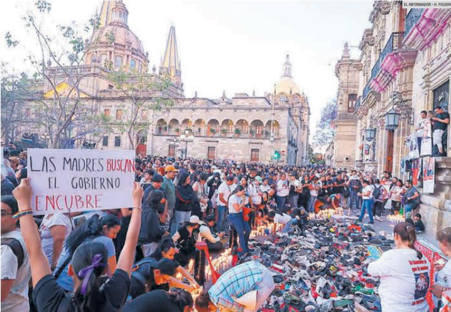
"TEUCHITLÁN, NUNCA MÁS". Las consignas lanzadas en la marcha de Guadalajara tuvieron eco en todo el país. La exigencia: "Ni un desaparecido más".

Colectivos de buscadores llenan el Centro de Guadalajara para exigir que frenen las desapariciones; la protesta se replicó en todo el país