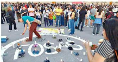
■ Familiares de desaparecidos exigieron a las autoridades indagar las fosas que se han encontrado en el País.

Teuchitlán prendió veladoras y también otro frente en el tema de desaparecidos, un frente que exige una mesa con la Presidenta Claudia Sheinbaum para resolver el “Teuchitlán” en que se convirtió el País.