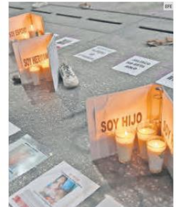
LUTO. Los rostros de quienes hoy no están.

“Si tengo familias que han logrado identificar alguna prenda. De hecho, están en el municipio de Ocotlán y la fiscal (Especial en Personas Desaparecidas) nos dijo que estas van a ser llevadas a cada delegación porque queda la duda porque están arrugadas, empolvadas, camuflajeadas”.