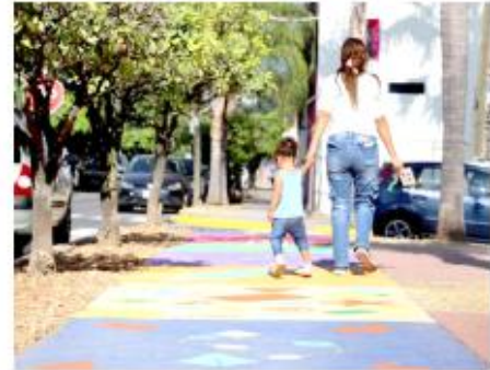
Frangie reiteró que trabajan por el bienestar de la niñez.

“Hoy ellos son el futuro. Tener un Sendero Seguro nos trae muchos beneficios porque nos evita un accidente, se arreglan las banquetas, se pone señalética a la altura de las niñas y los niños, para que vayan aprendiendo sobre educación vial”.