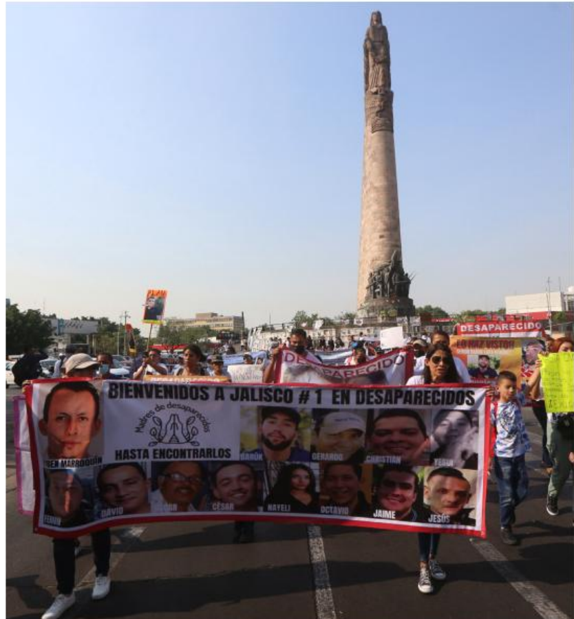
El monumento a los Niños Héroe dejó de ser un homenaje a soldados caídos. P. CARRANZA

El 19 de marzo de 2018, tras una jornada de grabación en una finca de Tonalá, fueron interceptados por al menos seis hombres con armas largas. A las tres estudiantes mantas que los acompañaban las dejaron ir; a ellos se los llevaron para siempre. Las investigaciones posteriores, basadas en cateos a 15 propiedades y en declaraciones de detenidos, apuntaron a que fueron asesinados y sus cuerpos disueltos en ácido. La versión oficial: un