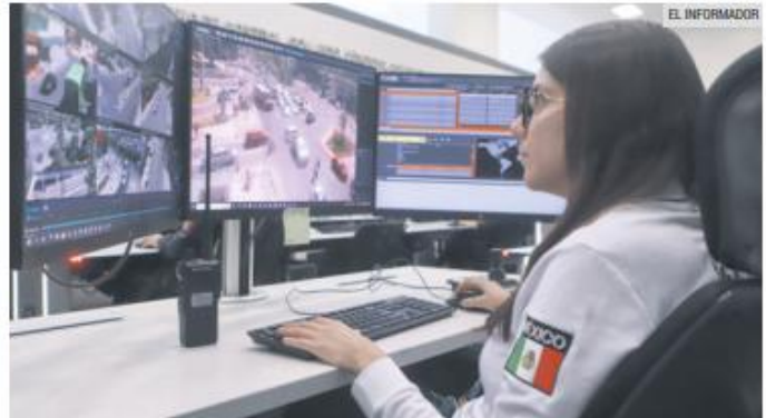
C5. Legisladores piden dar más presupuesto a este sistema.