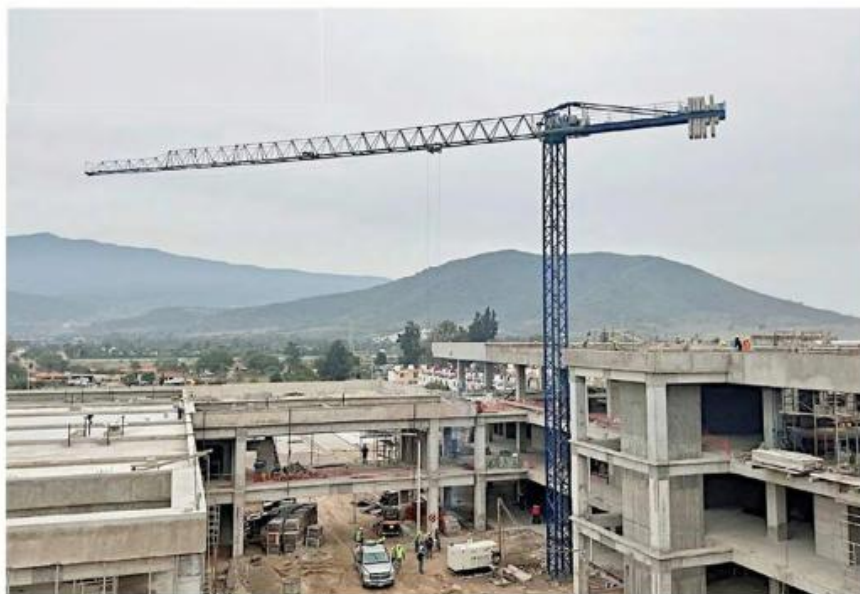
El nosocomio de Tlajomulco dará servicio a derechohabientes de 7 Estados.

Los pendientes son en los edificios de la obra federal, que se convertirá en el centro de alta especialidad del Instituto de Seguridad y Servicios Sociales de los Trabajadores del Estado para el Occidente del País, donde atenderán a un padrón de 2.5 millones de derechoha-