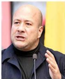
Alfaro llegó a decir que sólo 10% de desapariciones eran producto de algún delito.

una constante en la gestión de Alfaro fue minimizar la crisis de desaparecidos.