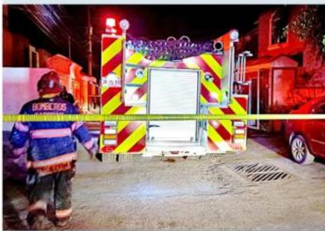
■ El menor falleció por la intoxicación de humo.

Las autoridades indagarán cuáles fueron las causas que dieron origen al fuego y determinarán si hubo daño estructural en la vivienda.