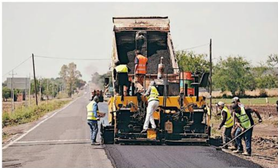
Este martes se abrieron 17 frentes de obras carreteras.

Entre las vías a cargo del Gobierno jalisciense que se-