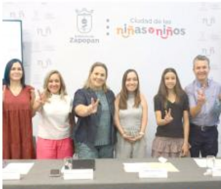
Gobierno de Tlajomulco

Los organizadores presentaron los detalles.