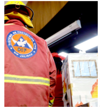
Buscan prevenir accidentes en niños y niñas.

Actualmente han sido capacitados 8 centros educativos, entre ellos, los 5 Centros Asistenciales de Desarrollo Infantil (CADI) del organismo estatal, en beneficio de mil 200 niñas y niños capacitados, así como 480 maestras y maestros, más lo que se incrementen a partir de este taller.