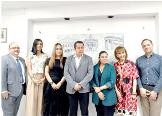
Contemplan el interés superior de la niñez y el principio propersona.

Pretenden asegurar el cumplimiento de derechos como el acceso a servicios de salud, educación y protección de niñas, niños y adolescentes vulnerables