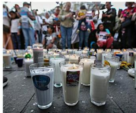
■ Durante el fin de semana se realizaron algunas protestas para exigir justicia tras los hallazgos en el rancho Izaguirre.

El caso del rancho Izaguirre fue atraído por la Fiscalía General de la República la semana pasada, después