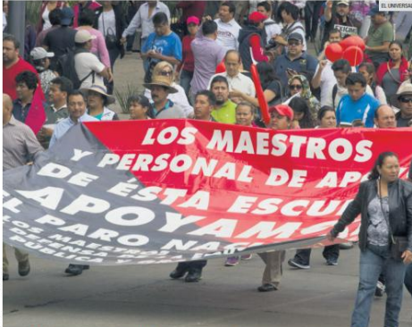
PROTESTAS. Integrantes de la CNTE realizaron protestas para ejercer presión al Gobierno Federal a fin de que no se aprobara la reforma al ISSSTE. Sin embargo, continúan con su amenaza de paro a partir de hoy.

Tras este exitoso amerizaje, SpaceX planea ampliar las opciones de aterrizaje para futuras misiones, incluyendo el Océano Pacífico como alternativa a Florida. Mientras tanto, la NASA sigue analizando los retos de las misiones espaciales de larga duración y preparando futuras expediciones.