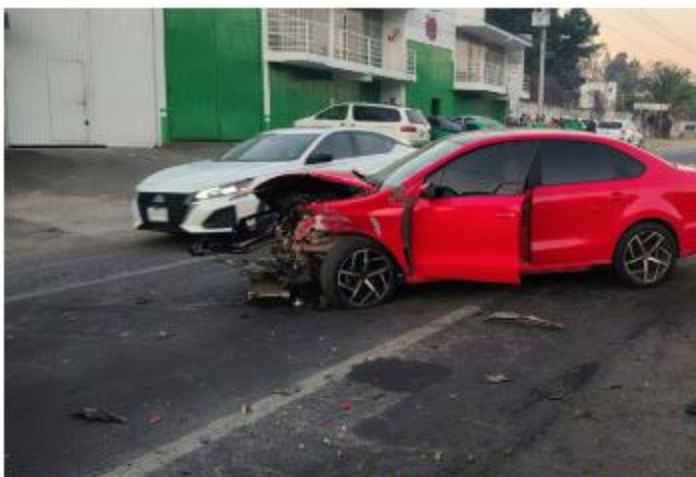
CHOQUE. Sobre la carretera Federal 80, a la altura de Acatlán de Juárez, se registró un choque frontal entre dos vehículos. Dos mujeres y un menor de 12 años resultaron con lesiones.