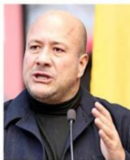
Alfaro llegó a decir que sólo 10% de desapariciones eran producto de algún delito.

una constante en la gestión de Alfaro fue minimizar la crisis de desaparecidos.