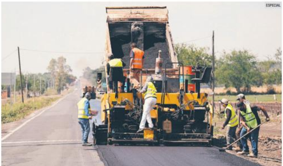
AVANZAN LAS OBRAS. La SIOP señala que la rehabilitación de carreteras impulsará el comercio e industria.

Para ello, dijo, la SIOP es que se publicaron las 21 licitaciones en el Periódico Oficial del Estado de Jalisco, mismas que tienen como fecha de inicio la segunda quincena de mayo, en las que se contemplan acciones indispensables para mantener las arterias a cargo del Estado en óptimas condiciones como reconstrucción, conservación periódica y conservación rutinaria.