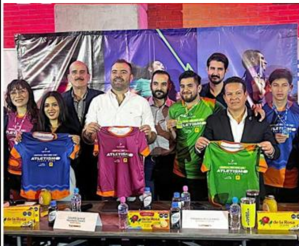
Hay varios paquetes para que los runners participen en todas las competencias.

Como un extra, se anunció la preventa especial para el Medio Maratón Tlajo 2025 con un costo de 300 pesos, o en paquete con el serial por 750 pesos.