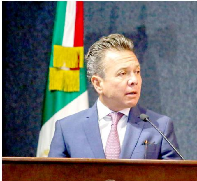
El Gobernador de Jalisco quiso compartir un mensaje que transmitiera tranquilidad.

El gobernador de Jalisco quiso compartir un mensaje que transmitiera tranquilidad porque las máximas autoridades están comprometidas a atender este caso con toda la fuerza del estado y porque no pretenden ocultar los hechos por muy difíciles que sean.