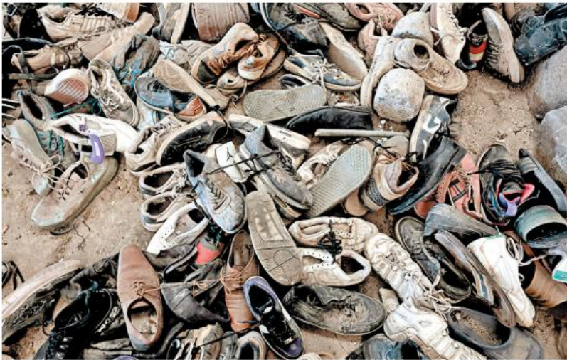
Hago votos por que esos zapatos sirvan para despertarnos y no volvemos a dormir.

¿Quiénes son esas personas desaparecidas? ¿Cuáles son los nombres, apellidos y domicilios de los responsables concretos de haberlos esfumado? ¿Dónde estaban y están las autoridades cuyo trabajo más básico era y es pro-