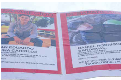
DEMARCAIONES. La FEPD, hoy Vicefiscalía Especializada en Personas Desaparecidas, documentó 14 casos de adolescentes reclutados forzosamente en 10 municipios.

Datos de la Fiscalía del Estado en la Plataforma Nacional de Transparencia dan cuenta de apenas tres casos en el sexenio pasado, aunque la fiscalía de desaparecidos reconoció 14 en un documento propio