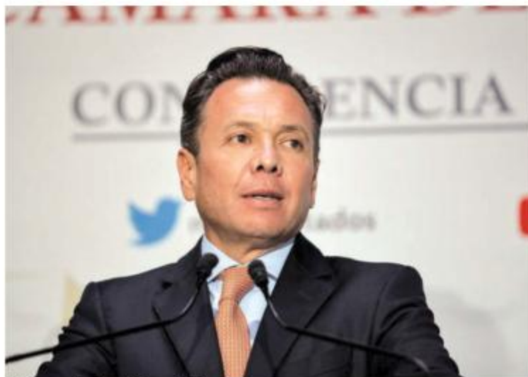
Gobernador de Jalisco, Pablo Lemus

“Vamos a seguir trabajando con el Gobierno Federal en el esclarecimiento de los hechos de cara a la ciudadanía con toda la apertura para que se conozca la verdad de estos acontecimientos”, expresó.