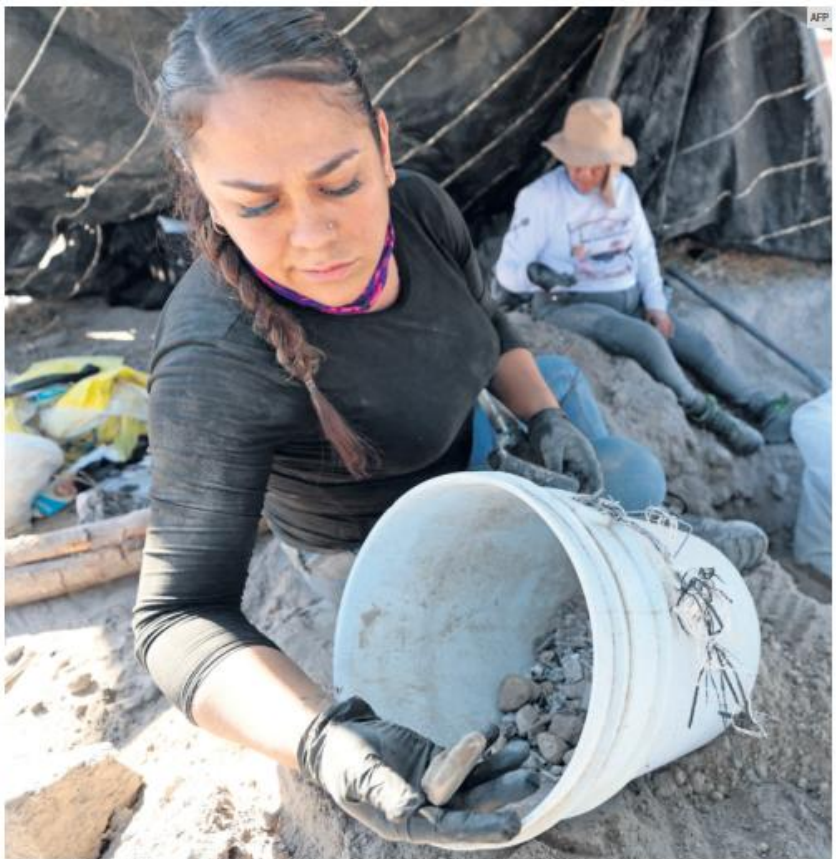
SIGUE LA INVESTIGACIÓN. En Teuchitlán se mantiene la búsqueda de indicios en el rancho.

El gobernador detalló que "la estrategia es muy sencilla: Decir la verdad de los sucesos de