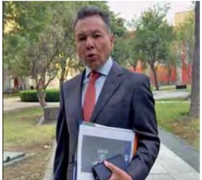
Reunión. El mandatario estatal estuvo presente en el Gabinete de Seguridad.

Por su parte, la presidenta de México, Claudia Sheinbaum, compartió durante la mañana que en la reunión que se sostuvo con Lemus se “coincidieron en muchas de las visiones que están