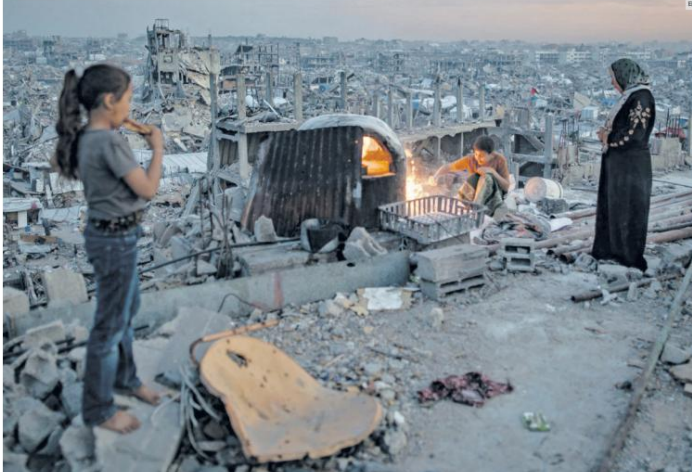
DEVIACIÓN. Ciudadanos subsisten en lo que quedó tras los bombardeos israelíes en Gaza, el primer ministro, Benjamin Netanyahu, dice que "sólo es el comienzo".

El cese al fuego que estaba en vigor desde enero quedó suspendido por la negativa de Hamás a liberar a rehenes; hay más de 400 muertos