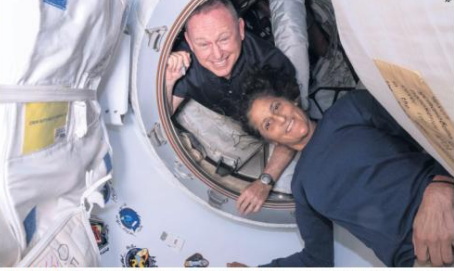
VUELTA A CASA. Tras nueve meses en el espacio, la sonrisa de los astronautas Butch Wilmore (izquierda) y Sunita Williams (derecha) al regresar a la Tierra es imborrable.

Wilmore y Williams serán sometidos a revisiones médicas antes de reunirse con sus familias en uno o dos días.