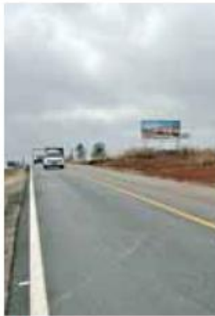
Mejoras. Los trabajos son en beneficio de miles de usuarios.

El Gobierno de Jalisco, a través de la Secretaría de Infraestructura y Obra Pública (SIOP) da a conocer que a durante el mes de mayo, se ampliará la intervención de tramos dentro del programa estatal de reconstrucción y mantenimiento carretero 2025, con la incorporación de 21 frentes en diferentes regiones del estado. Estas acciones contemplan, entre otros