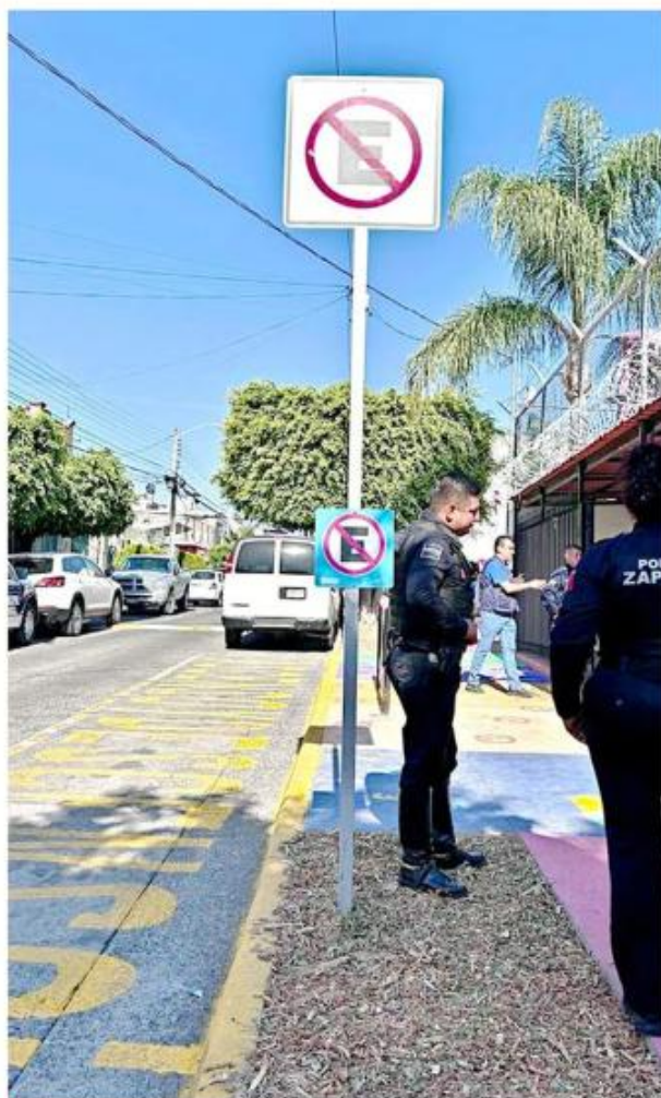
El programa busca brindar seguridad y confianza a los alumnos y padres en su camino a la escuela.

"Tener un Sendero Seguro nos trae muchos beneficios porque nos evita un