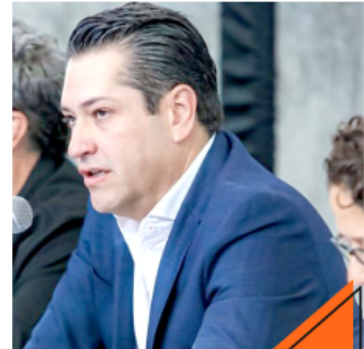
Fue presentada la nueva estructura de la Comisión de Filmaciones.

"Realmente otros países, otros estados lo han visto como una potencia de desarrollo económico. Que así se vea en nuestro estado, que realmente cada municipio cuando se viene a hacer un comercial, a hacer una película, entiendan que es una potencia. Que tenga este contenido que se muestra al mundo.