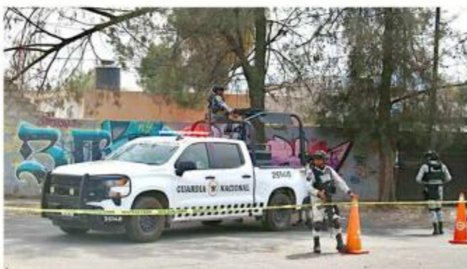
■ Vecinos de Lomas del Mirador localizaron un cráneo humano.