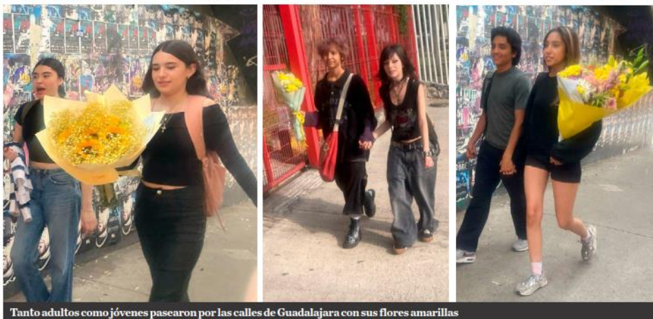
Tanto adultos como jóvenes pasearon por las calles de Guadalajara con sus flores amarillas

Tanto adultos como jóvenes se sumaron a esta tradición que aunque no es una fecha oficial, sí ha marcado un hito en todo el continente americano.