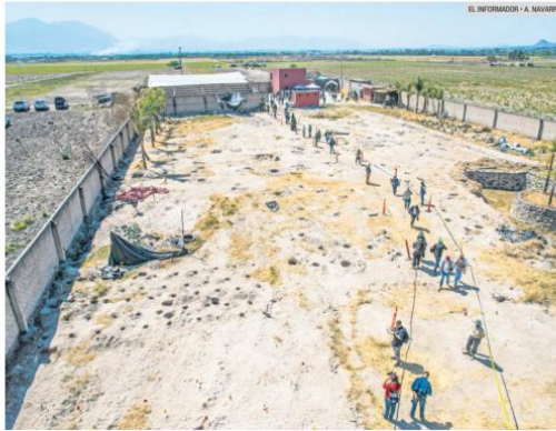
CONTRASTE. La relatoría del operativo de septiembre de 2024 del Ejército y la Fiscalía estatal no coinciden.

“Al arribar al sitio, los integrantes de ambas instituciones escucharon detonaciones de arma de fuego desde el interior del predio, por lo que