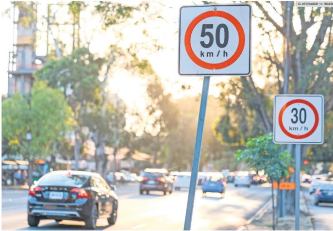
AVENIDA VALLARTA. Los automovilistas se confundirán al ver letreros que establecen dos límites de velocidad colocados a menos de cinco metros entre sí.

Conductores muestran su molestia porque hay confusión en calles principales, donde la señalética marca topes que van de 30, 40, 50, 60 y 80 kilómetros por hora