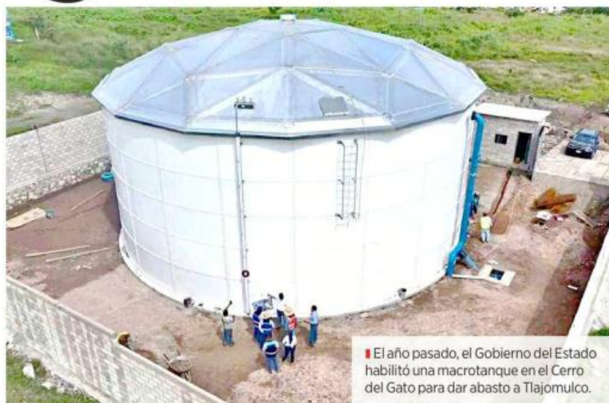
El año pasado, el Gobierno del Estado habilitó una macrotanque en el Cerro del Gato para dar abasto a Tlajomulco.

El año pasado comenzaron los trámites de conectividad al Siapa de tres polígonos: fraccionamientos del corredor de Carretera a Chapala, como Paseo de los Aga-