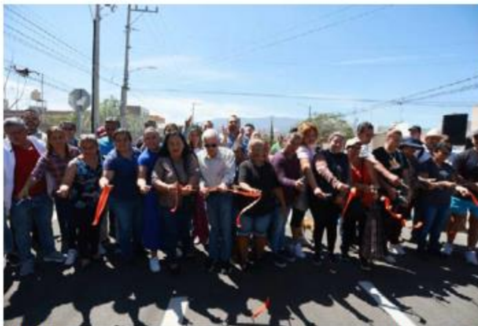
OBRAS. El gobierno de Tlajomulco entregó la rehabilitación de la calle Valle de Los Areces y la unidad deportiva de Hacienda de Los Eucaliptos. Invirtieron más de 6.4 millones de pesos.