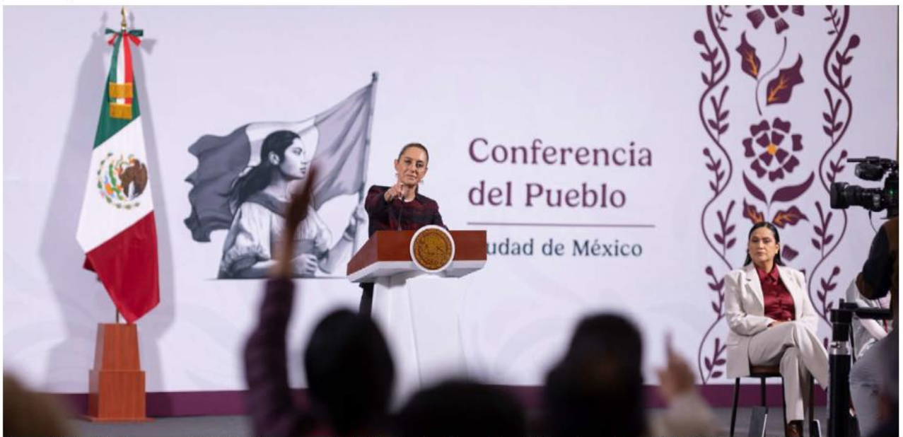
La mandataria dejó claro que su administración no se confrontará con los familiares de las víctimas, sino que buscará brindarles apoyo.