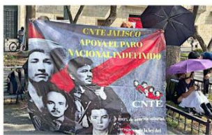
Maestros en activo y jubilados realizaron un plantón ayer afuera del Congreso local.