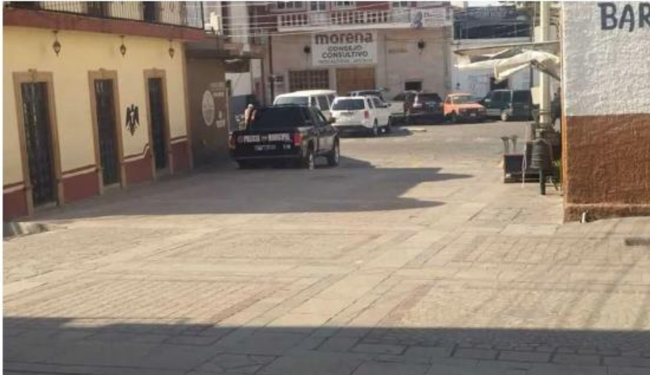
En febrero de 2025, ocho policías municipales desaparecieron de este lugar.