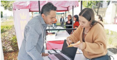
TECNOLOGÍA AL ALCANCE. El Gobierno de Zapopan pretende que todos los estudiantes, freelancers y emprendedores cuenten con herramientas tecnológicas como laptops y los apoyará con la mitad de su costo.

También es necesario contar con un estado de cuenta bancario o constancia de ingresos reciente, pues el beneficiario tendrá un