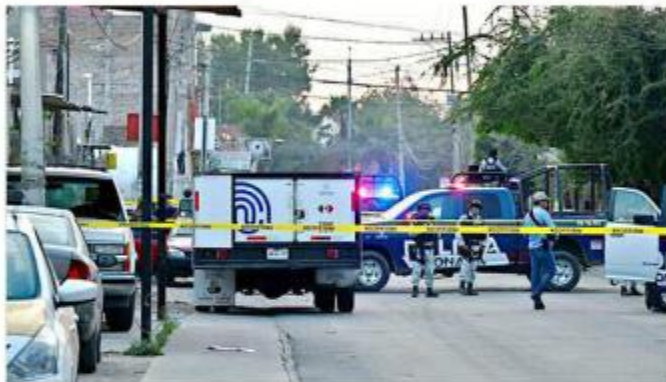
■ En un negocio de Tonalá fue asesinado a tiros un hombre.

El ataque duró un par de minutos. Después, los agresores subieron de nuevo a sus