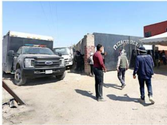
El Rancho Izaguirre está bajo resguardo de la FGR.

A inicios de marzo se destapó el hallazgo de lo