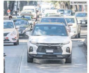
VIALIDAD. Se observan dos señales distintas en un mismo tramo.