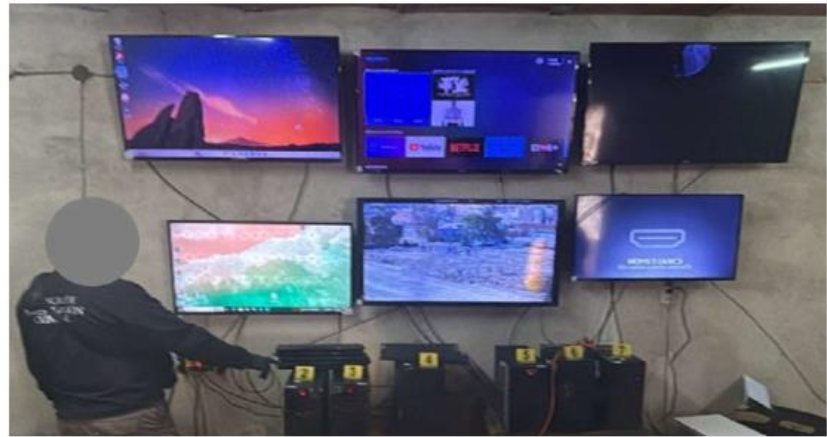
La operación se realizó mediante un cateo autorizado por un juez de control. ESPECIAL

Al llegar a las afueras de un inmueble en la colonia, observaron múltiples cámaras de videovigilancia instaladas en el exterior, lo que generó sospechas sobre la posible operación ilegal en dicho sitio. ■