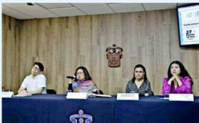
■ Autoridades del CU Valles aseguran trabajar para promover la inclusión.

“En nuestro centro universitario hicimos una reestructuración en donde la coordinación de extensión tiene ya una Unidad de Inclusión, desde ahí vamos a impulsar y dar continuidad a lo ya hacíamos, pero ahora de forma mucho más