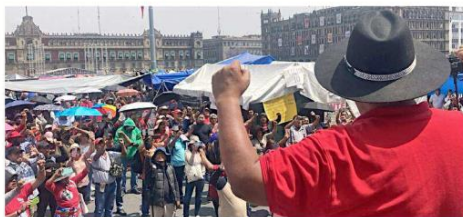
Los maestros de la CNTE realizaron un mitin en el Zócalo y después levantaron su campamento... aunque amagaron con volver.

“Proponemos que los recursos para regresar al antiguo esquema de pensiones sean del fondo de las Afores”, se le cuestionó.