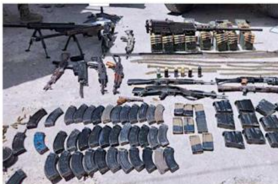
Las armas quedaron a disposición del Ministerio Público.