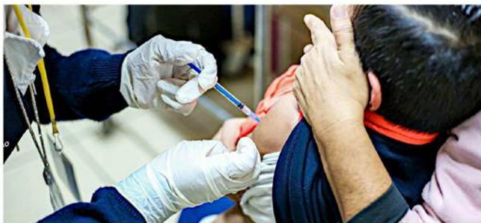
■ La SSJ invitó a la población a vacunar a los menores de edad ante la alerta por tos ferina.

En lo que va de la semana epidemiológica 10, se han reportado 26 pacientes con tos ferina en Jalisco, mientras