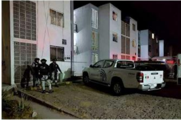
El feminicidio de madre e hija ocurrió en Tlajomulco.