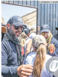
LOGÍSTICA DEFICIENTE. La CNDH llamó a autoridades a preservar adecuadamente las evidencias.

“La participación de los familiares debe llevarse a cabo conforme a los protocolos establecidos”, insistió la Comisión Nacional, esto con la intención de evitar que sus derechos al acceso a la justicia y la verdad se vean comprometidos.