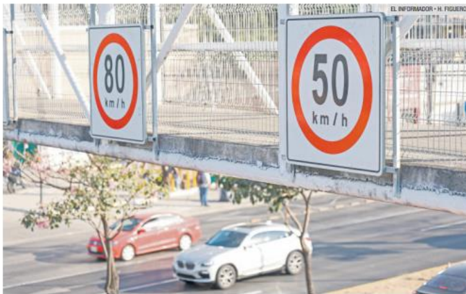
LÓPEZ MATEOS. En vías centrales sin semáforos el límite será de 80 kilómetros por hora.

En vialidades primarias con semáforos, se establecerá un límite de 50 kilómetros por hora, mientras que, en vías centrales sin semáforos, como López Mateos Sur o Periférico, el límite será de 80 kilómetros por hora.