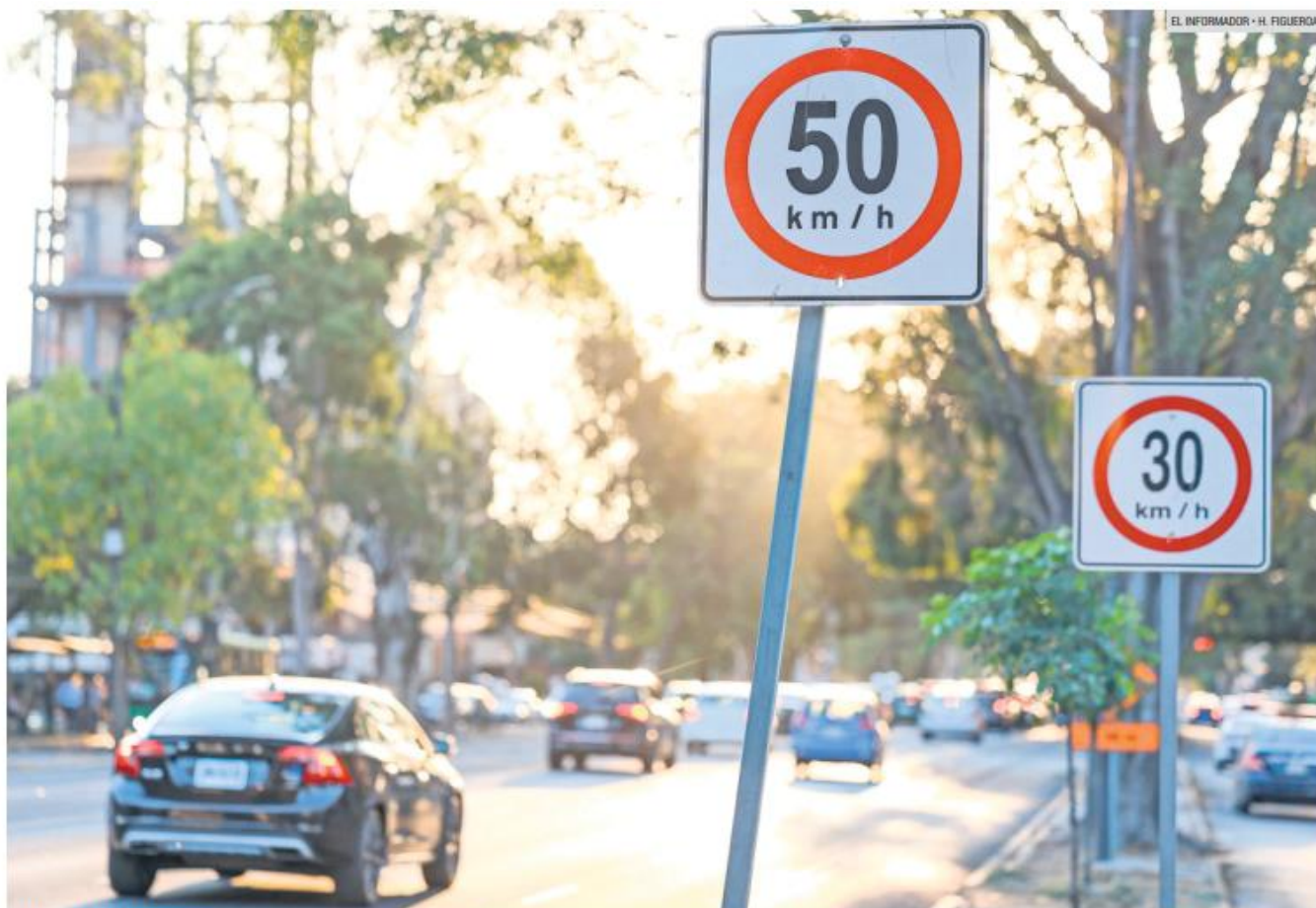
AVENIDA VALLARTA. Los automovilistas se confunden al ver letreros que establecen dos límites de velocidad colocados a menos de cinco metros entre sí.