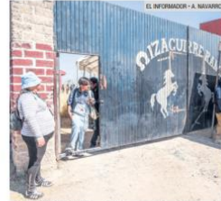
MOLESTIA. CEPAD calificó como “círculo” la organización de la visita al rancho en Teuchitlán.