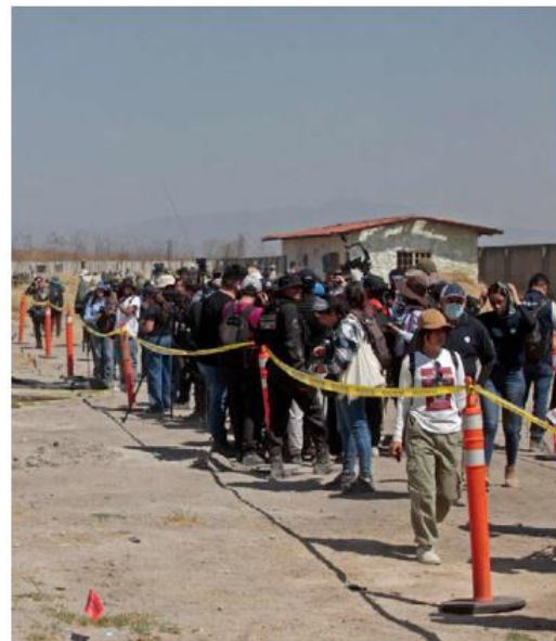
Las denuncias apuntan a que la visita expuso a los asistentes a un evento que más parecía un recorrido turístico. FC

El organismo pidió que las autoridades permitan la participación efectiva de las familias y colectivos.