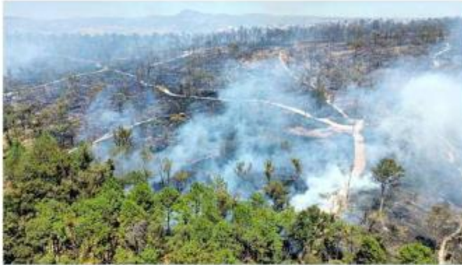
El fuego afectó el Área Natural Protegida.